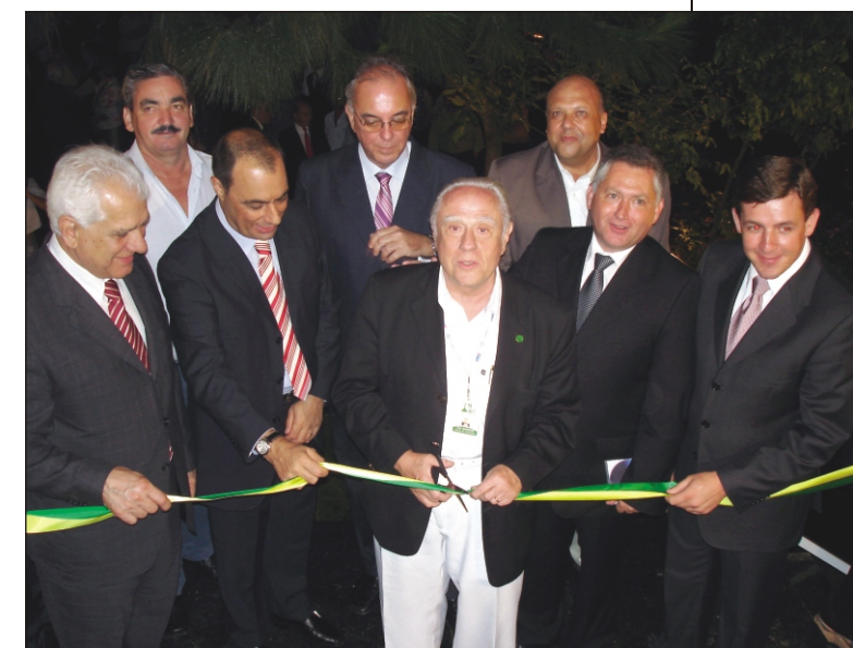
Acima, inauguração da sede própria da FUABC; Em destaque, galeria em homenagem aos 27 presidentes que comandaram a instituição em 40 anos