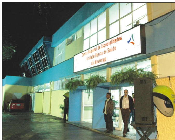
Centro Regional de Especialidades do Alvoranga, em São Bernardo

- Hospital Estadual Mário Covas realiza primeiro replante total de mão no Grande ABC, sob cuidados da Disciplina de Doenças do Aparelho Locomotor da Medi-