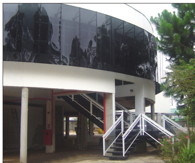
Inauguração da sede da FUABC marca início da gestão 2008-2009

- Câmaras de Vereadores de Santo André, São Bernardo e São Caetano homenageiam os 40 anos da FUABC. Legislativos de São Bernardo e São Caetano concedem à FUABC título de Entidade Benemerita e ao