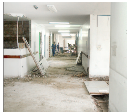
Divulgação Hospital Bertioga

Também reforçam os quadros 60 auxiliares e 8 técnicos de enfermagem, 8 enfermeiros e 26 profissionais para a área administrativa e recepção. A expectativa é chegar a 380 profissionais servindo o complexo Hospital Bertioga-PS neste verão, contra 320 anteriormente – destes, a maioria é servidor público e foi remanejada para outros equipamentos municipais de saúde, como postos e UBSs. Outras prioridades da FUABC foram readequar o atendimento de recepção e instalar novo raio X no PS.