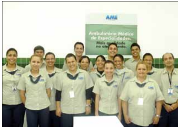
Divulgação AME Praia Grande

Empregos locais: Desde seu início administrado pela Fundação do ABC-OSS (Organização Social de Saúde), o AME Praia Grande também fixou como meta prestigiar o emprego local. São 85 funcionários diretos e 104 terceirizados, a grande maioria moradores do Litoral. Desde setembro toda a equipe trabalha dentro do padrão de uniformes da rede FUABC, outro facilitador da comunicação entre funcionários e usuários devido à fácil identificação visual dos atendentes.