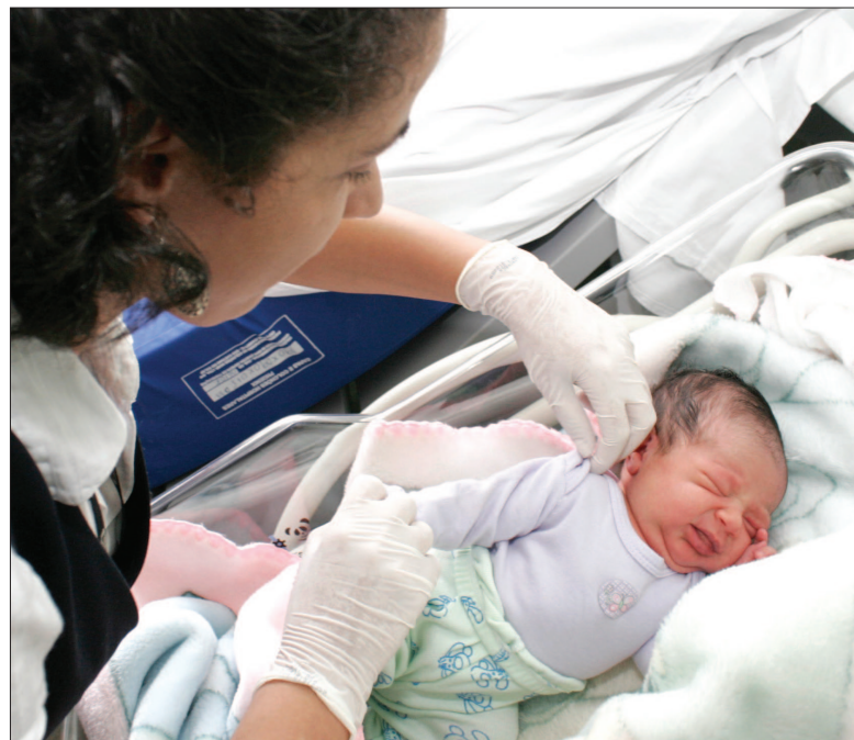
Divulgação PMSA / Norberto da Silva

Vídeos e Banco de Leite: Para ajudar nos treinamentos da rede andreense, o Hospital da Mulher-FUABC disponibilizou materiais de apoio como o vídeo de aleitamento materno do Ministério da Saúde, CD contendo as aulas de “Manejo Clínico em Aleitamento Materno” (curso de 20 horas), outro CD com o álbum seriado proposto pelo MS, além de folder do Banco de Leite Humano do hospital. “O objetivo é tornar a rede de saúde do município referência em aleitamento materno”, completa