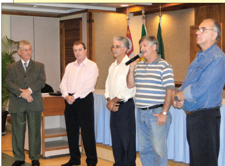
Bertioga Hospital Bertioga