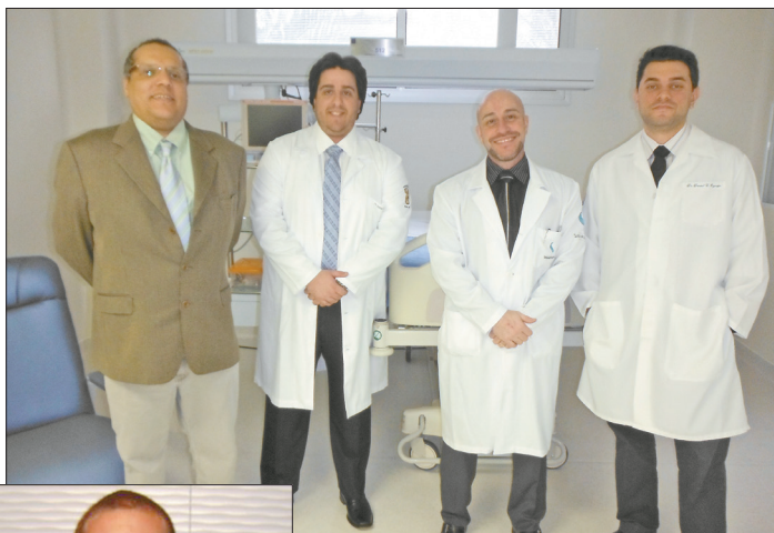
Nas fotos, grupo de médicos que assinam o artigo recém-publicado

O trabalho consistiu de uma revisão sistemática e subsequente metanálise de publicações sobre o tema feitas de 1966 a 2011 focando doentes críticos. A base do novo artigo foram 16 estudos feitos nesse período cobrindo 1.523 participantes. Cinco ferramentas de screening foram incluídas na revisão. Segundo a