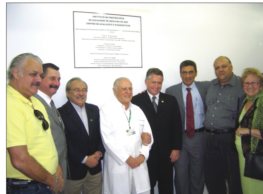
Autoridades durante inauguração do Instituto de Pneumologia e Centro de Avaliação e Diagnósticos

O Laboratório de PHmetria inicia com exame de mesmo nome cuja finalidade é diagnosticar e tratar problemas de refluxo esofágico. Os pacientes são acompanhados mediante uma sonda colocada no esôfago durante 24 horas. Já o Laboratório do Sono, inédito na região, busca investigar e trabalhar com as principais doenças respiratórias do sono, como apnéia, insônia, sonambulismo e a chamada síndrome das pernas inquietas. Duas salas que simulam quartos residen-