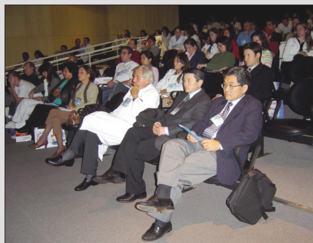
Membros da organização e público durante a “9ª Jornada”

Outro tema em destaque foi a má formação da medula em crianças nascidas de gravidez de alto risco, muitas vezes decorrente de mães mal alimentadas. “Muitos problemas se resolvem com medicina preventiva”, um dos maiores especialistas em cirurgia do pé.