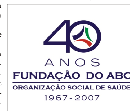
Selo e botom marcam aniversário

Reforçando sua missão como entidade assistencial, de saúde e educação, a FUABC assumiu definitivamente em 2006 a identidade de OSS (Organização Social de Saúde) criada em 2001 para gerir o Hospital Estadual Mário Covas. A imagem corporativa passou a adotar a logomarca da OSS, também emprestada neste 2007 para lançamento do selo comemorativo dos 40 anos. A data das quatro décadas será igualmente lembrada com a edição de um livro histórico da trajetória de lutas e conquistas.