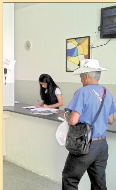
Recepção já ganhou senha numérica