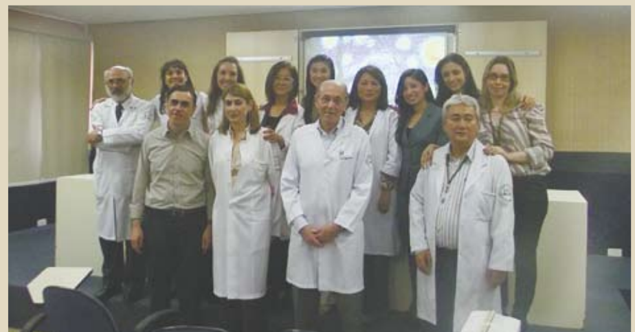
Tradicional, apresentação de TCCs na Dermatologia contou com seis formandos em 2013