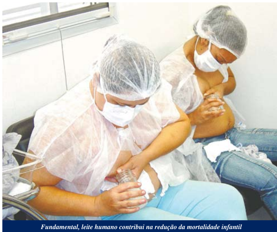
Fundamental, leite humano contribui na redução da mortalidade infantil

Para fazer a doação, as mães devem atestar saúde plena, já que antes da possível