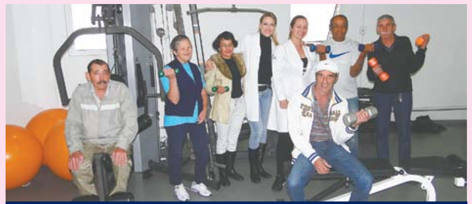
Pacientes e educadoras físicas durante sessão de musculação na academia da FUABC

No estudo em andamento, a ideia é avaliar os benefícios do fortalecimento muscular no dia a dia dos pacientes, estimulando a prática de atividades físicas. “Queremos mostrar aos pacientes que apesar das limitações, eles são capazes de praticar exercícios e que isso trará impacto positivo à saúde e à qualidade de vida. Durante as aulas na academia, conseguimos identificar potencialidades individuais, estimulamos e buscamos avanços a cada sessão”, explicam as educadoras físicas responsáveis pela pesquisa, Lu-