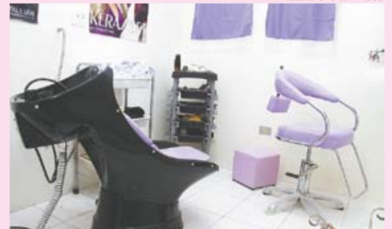
Cuidados estéticos aumentam autoestima e confiança

Ações simples e que podem elevar a autoestima e a confiança dos pacientes com câncer são consideradas eficazes por órgãos como o Instituto Nacional de Câncer (INCA) no combate a complicações colaterais, trazendo benefícios ao tratamento dos enfermos. Com esse objetivo, a direção do Centro de Oncologia Luiz Rodrigues Neves de São Caetano, em parceria com o Fundo Social de Solidariedade do município, inaugurou em 10 de junho o Cantinho da Beleza. Localizado no próprio prédio da unidade, o espaço recebe os pacientes oncológicos todas as segundas-feiras.