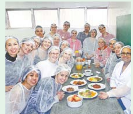
Residentes em aula prática na cozinha