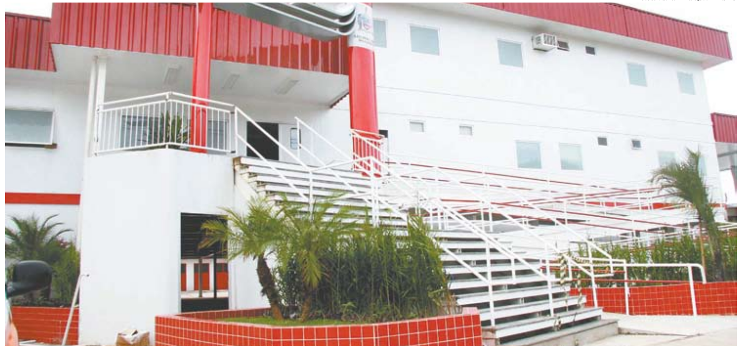
Com 1.181 m 2 , unidade tem capacidade de atendimento de até 300 pessoas por dia

São 12 leitos de observação, sendo oito para adultos e quatro para crianças, além de sala vermelha com dois leitos, dotada com equipa-