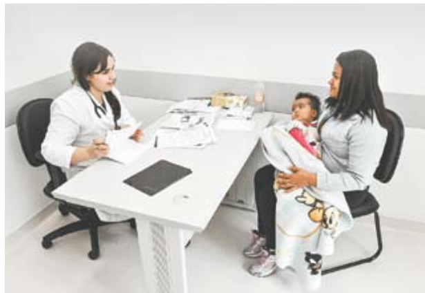
Mães aprovam novo serviço pós-internação