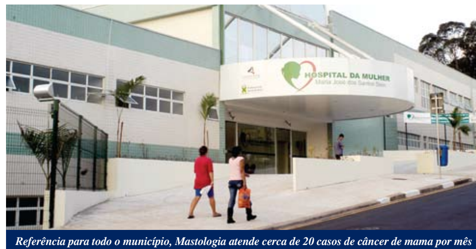
Referência para todo o município, Mastologia atende cerca de 20 casos de câncer de mama por mês

O médico acrescenta que até pouco tempo era comum as pacientes se sentirem mutiladas após a cirurgia, inclusive do ponto de vista emocional. “É extremamente importante que a mulher se sinta bem. Por isso, a oncoplastia se tornou tendência. Atualmente, os próprios mastologistas estão fazendo cursos de especialização e aprendendo procedimentos de reconstrução mamária. O intuito é somar conhecimentos aos dos cirurgiões plásticos e aumentar o número de pacientes beneficiadas”.