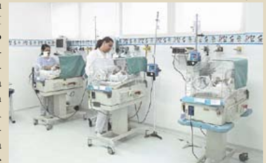
Nova ala é adaptada e decorada

Estimada em R$ 5 milhões, a reforma da maternidade tem recursos de emenda parlamentar da ex-senadora Marta Suplicy.