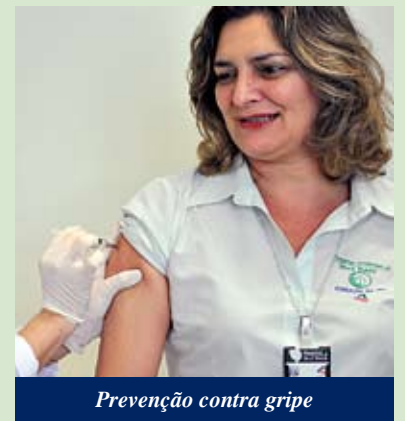
Prevenção contra gripe

Dentro da campanha nacional contra a gripe A (Influenza H1N1), o Complexo de Saúde Irmã Dulce realizou a vacinação de funcionários e profissionais de saúde. A cargo do Serviço de Controle de Infecção Hospitalar (SCIH), a ação contou com apoio dos setores de Segurança e Medicina do Trabalho. Por meio da Secretaria Municipal de Saúde (Sesap), o hospital recebeu 1.000 doses iniciais da vacina.