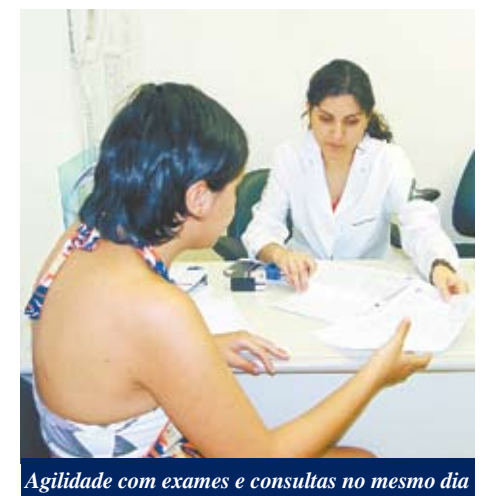
Agilidade com exames e consultas no mesmo dia