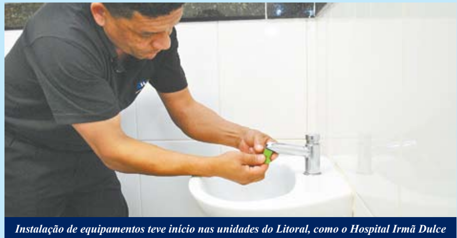
Instalação de equipamentos teve início nas unidades do Litoral, como o Hospital Irmã Dulce

No caso dos chuveiros, a empresa coloca um restritor, que regula a pressão da água gerando economia e evitando superaquecimento, prossegue o técnico. Tais medidas reduzem custos com o consumo de água e preservam o meio ambiente. Na mesma linha ecológica, numa segunda etapa o hospital deverá orientar os funcionários sobre essas mudanças e a como adotar postura pessoal em prol do meio ambiente e evitando desperdício.