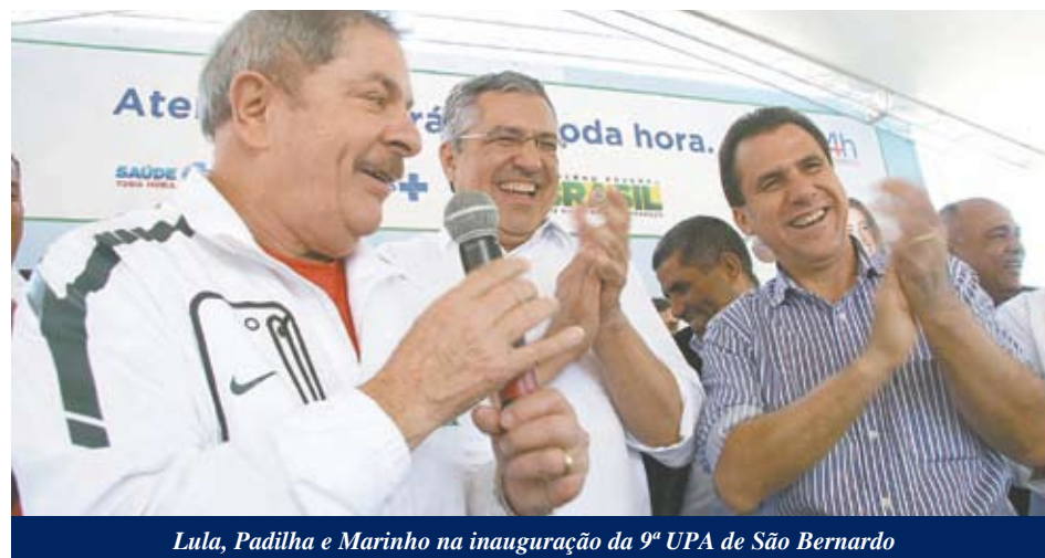
Lula, Padilha e Marinho na inauguração da 9ª UPA de São Bernardo

Após o encontro, Padilha anunciou liberação de R$ 53 milhões para construção de 20 Centros de Atenção Psicossocial (Caps) voltados, principalmente, ao tratamento de crack, além de oito Residências Terapêuticas para reforçar o atendimento de dependentes químicos na região.