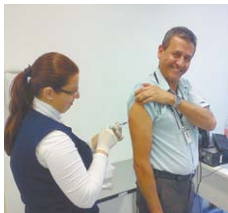
Funcionários em vacinação contra gripe

“A conscientização e participação dos colaboradores na imunização contra gripe foi de grande importância. Aproveitamos a campanha para funcionários e vacinamos até mesmo alguns pacientes e acompanhantes”,