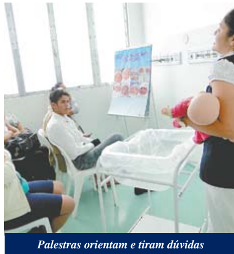
Palestras orientam e tiram dúvidas