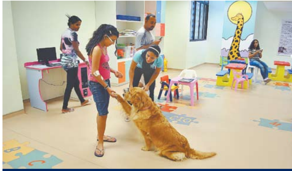
Pet Terapia com a cadela Satine ganhará reforço da ONG Cão Amor