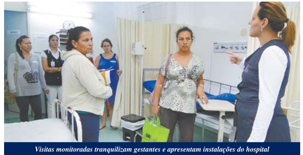
Visitas monitoradas tranquilizam gestantes e apresentam instalações do hospital

Graças à parceria entre Secretaria de Saúde e Hospital Bertioga, as parturientes que fazem o pré-natal nas Unidades Básicas de Saúde passaram a contar com curso especial. Toda última quarta-feira do mês, as gestantes no terceiro trimestre são convida-