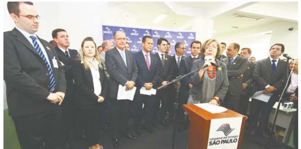
Nardini reformará 1º andar após liberação de R$ 6,5 milhões pelo Estado

A reforma completa com ampliação da área e otimização da ambiência de todo o andar será feita por fases, sendo que em nenhum momento haverá suspensão do funcionamento do pronto-socorro.