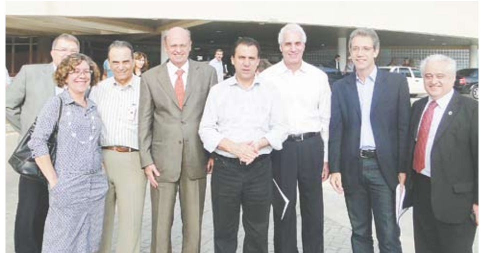
Autoridades vistoriam obras do futuro HC de São Bernardo, que será entregue no segundo semestre

Já o prefeito explicou que após a entrega do Hospital de Clínicas, a rede hospitalar do município será totalmente readequada. O Hospital Municipal Universitário (HMU) se firmará como unidade de excelência do cuidado em saúde materno-infantil, enquanto que o Hospital Anchieta se consolidará como unidade de tratamento do câncer. Já o Hospital e Pronto-Socorro Central será transformado em Hospital de Urgência e Emergência. “O cronograma de obras está 93% cumprido e pretendemos concluir o hospital em agosto deste ano. Mas, para isso, vamos depender da liberação dos R$ 23 milhões por parte do Governo do Estado”, disse Luiz Marinho.