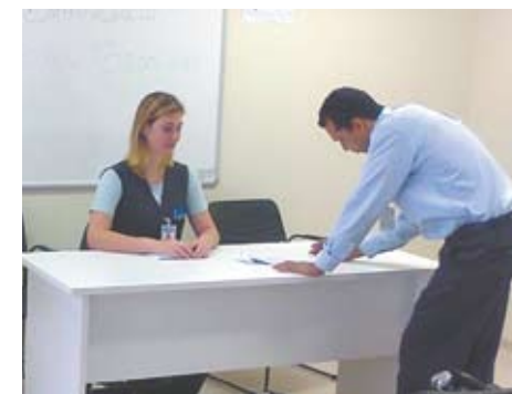
Eleição da CIPA 2013-2014

“Todos os membros da última gestão da CIPA desempenharam papel fundamental para o AME. Além disso, temos que ressaltar a participação da Brigada de Incêndio, que trabalha em parceria no intuito de combater princípios de incêndios e também de evitar incidentes e acidentes no ambiente de trabalho. Cada profissional treinado tem grande importância na prevenção da integridade física de profissionais e pacientes que circulam pelo complexo de saúde”, destaca o técnico de Segurança do