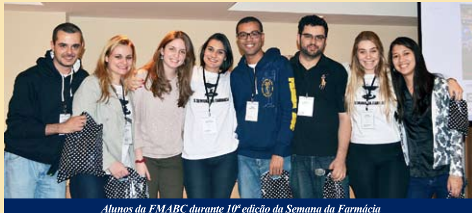
Alunos da FMABC durante 10ª edição da Semana da Farmácia