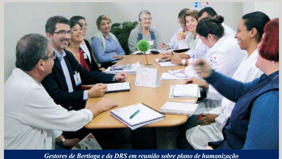
Gestores de Bertioga e da DRS em reunião sobre plano de humanização