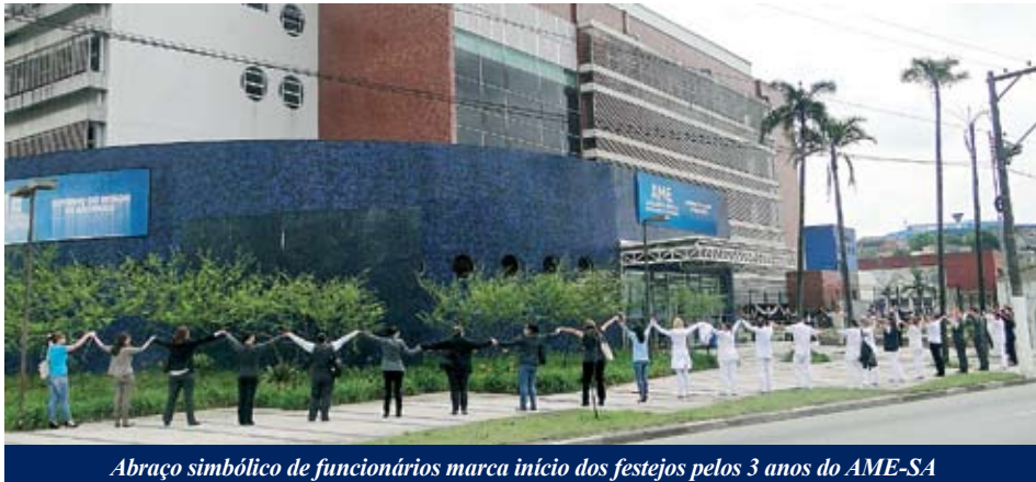
Abraço simbólico de funcionários marca início dos festejos pelos 3 anos do AME-SA

Unidade estadual completa três anos em 2013 e programa diversas palestras e atividades gratuitas para a população durante todo o mês