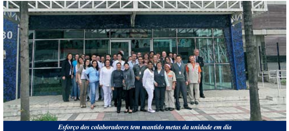
Esforço dos colaboradores tem mantido metas da unidade em dia

O Ambulatório Médico de Especialidades (AME) de Santo André, unidade da Secretaria de Estado da Saúde de São Paulo, comemora neste outubro aniversário de três anos e programa atividades durante todo o mês, tanto para funcionários quanto para pacientes, acompanhantes e população em geral. O início das comemorações em 1º de outubro foi marcado por abraço simbólico dos colaboradores da unidade, que apesar do pouco tempo de funcionamento, já se tornou referência em saúde para todo o Grande ABC.