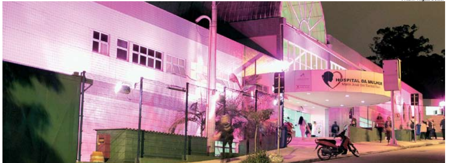
Fachada rosa busca chamar atenção das mulheres para a importância dos exames preventivos contra o câncer

Em Santo André, até o dia 31 as usuárias da rede municipal podem se dirigir a uma das unidades e solicitar os exames preventivos. Não há necessidade de agendamento prévio tanto para a coleta de Papanicolau quanto para o rastreamento de câncer de mama, que consiste na palpação das mamas pela médi-