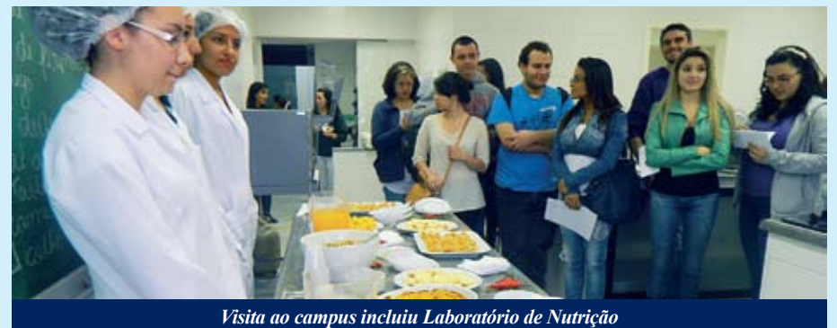
Visita ao campus incluiu Laboratório de Nutrição

Os participantes assistiram à duas palestras: “O que é ser médico?” e “A FMABC e o curso de Medicina”. Também houve bate-papo com ex-alunos recém-formados para compartilhar