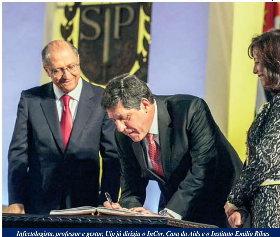
Infectologista, professor e gestor, Uip já dirigiu o InCor, Casa da Aids e o Instituto Emílio Ribas