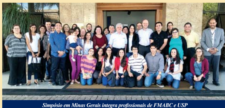
Simpósio em Minas Gerais integra profissionais de FMABC e USP

veu interação entre médicos da disciplina de Cardiologia da FMABC e pesquisadores do Laboratório de Biologia Vascul ar do IN-COR/FMUSP. Considerando o público participante, o simpósio teve potencial de atrair