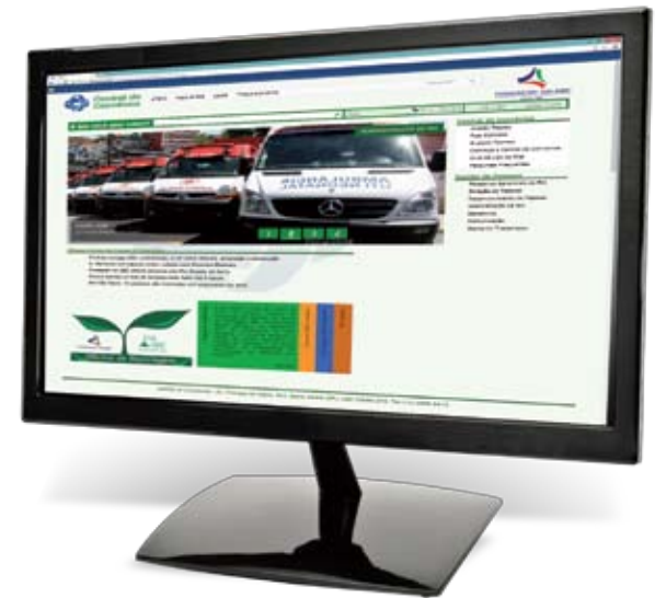
Novo portal permitirá consultar holerites, relação de férias, boletins, processo seletivo, normas e legislação trabalhista

Durante o lançamento do portal, a superintendente apresentou a evolução da mantida ao longo dos anos. “Em 2009 atuávamos somente nas três cidades do ABC. Contávamos com 2.997 funcionários, 90 unidades e orça-