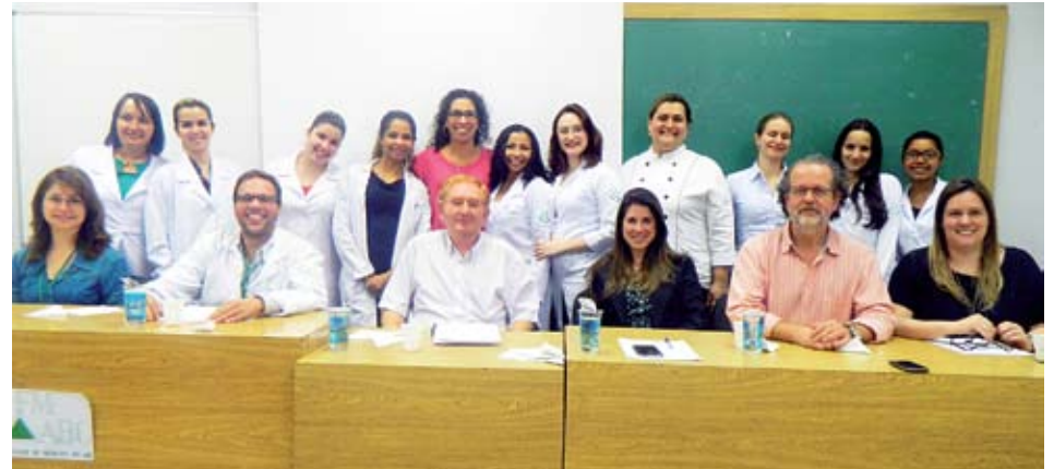
Jurados do Núcleo Gestor, professores e alunos no concurso de gastronomia

O evento reforça as comemorações pelo Dia Mundial da Alimentação, comemorado em 16 de outubro. Criada pela Organização das Nações Unidas para a Agricultura e Alimentação (FAO - Food and Agriculture Organization), a data é reconhecida em mais de 150 países e considerada importante para conscientização quanto às questões relacionadas à nutrição e alimentação em todo o mundo, destacando a luta contra a fome. “Sempre quisemos fazer o concurso