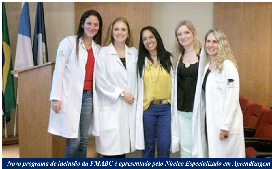
Novo programa de inclusão da FMABC é apresentado pelo Núcleo Especializado em Aprendizagem

Em abril deste ano o NEA organizou apresentação piloto do Pingo no “I” junto aos alunos do Colégio Piaget de São Bernardo, cujo assunto central em debate foi a im-