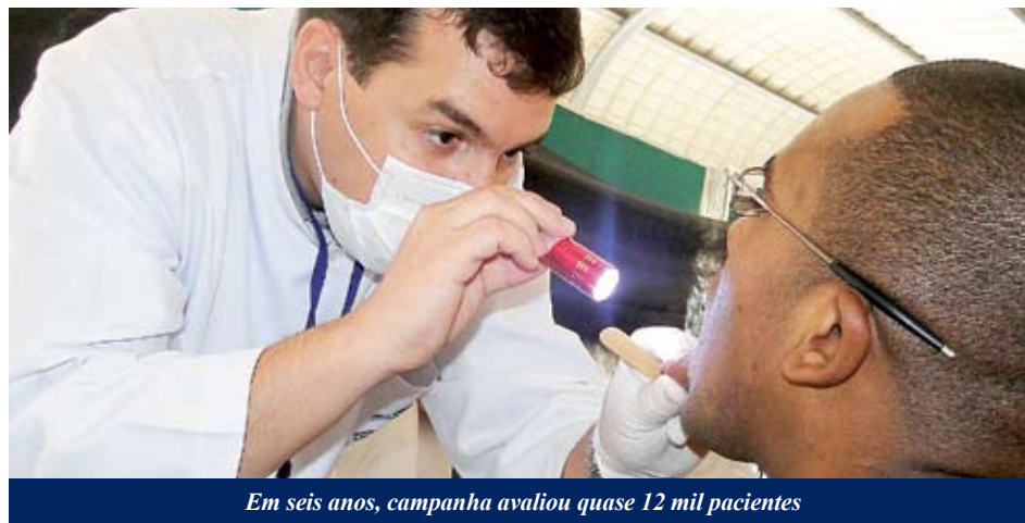
Em seis anos, campanha avaliou quase 12 mil pacientes

Em seis anos de campanha foram avaliados 11.965 pacientes, dos quais 886 apresentaram lesões orais e foram encaminhados para esclarecimento diagnóstico junto à equipe de dentistas do Centro de Especialidades Odontológicas de São Bernardo. Casos com lesões que podem se transformar em câncer ou com suspeita de serem malignas são encaminhados ao ambulatório da disciplina de Cabeça e Pescoço no Hospital Anchieta – referência no município para esse tipo de