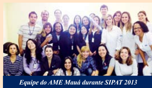
Equipe do AME Mauá durante SIPAT 2013

“A SIPAT foi extremamente importante para que a CIPA - Comissão interna de Prevenção de Acidentes conseguisse reunir os funcionários para discussão de assuntos relacionados à segurança do trabalho, tais como uso de equipamentos de proteção individual, prevenção de doenças, prevenção de riscos no ambiente de trabalho, além de melhorar as relações entre o AME e seus colaboradores”, considera a comissão organizadora da SIPAT 2013.