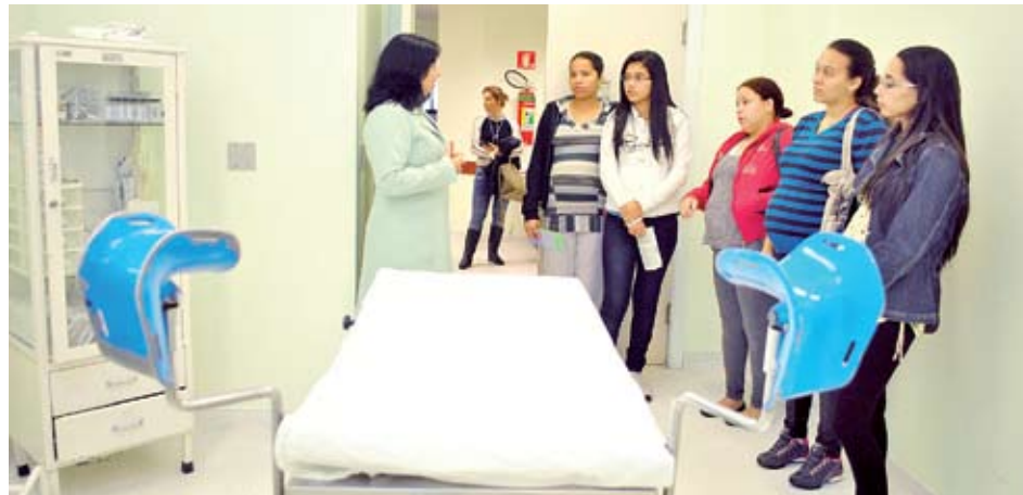
Visitas diminuem ansiedade em relação ao parto