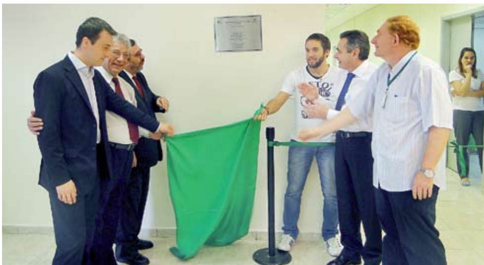
Professores, gestores e alunos inauguram andar térreo do Prédio Central

Jardim com acessibilidade e investimento de R$ 1,2 milhão em reformas estruturais, tecnológicas e de rede completam novidades na FMABC