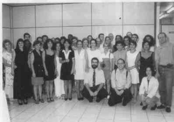
Formados da 1ª Turma do Curso de Pós-Graduação em Administração de Serviços da Saúde. (Alunos e Professores)

Hoje em dia, diante da complexidade dos problemas enfrentados, torna-se cada vez mais necessária a interação entre as instituições de ensino, a sociedade e os órgãos de governo. No dia 14 de março de 1997, data da formatura dos alunos do 1º Curso de Pós-Graduação em Administração de Serviços de Saúde da Faculdade de Medicina do ABC, tivemos a oportunidade de dar mais um passo nessa direção. As presenças dos Secretários de Saúde da Faculdade de Saúde de Santo André, São Bernardo, Mauá e do representante de São Caetano do Sul na solenidade de formatura são um sinal claro de que a Faculdade caminha firme na direção de solidificar laços com gestores da saúde na região. Mais uma vez, parabéns aos formandos e muito obrigado aos Secretários e assessores pela presença.