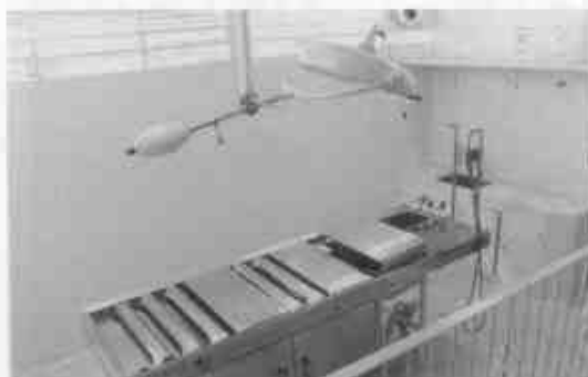
Vista parcial da sala de necropsia.

Dr. Aché planeja expor a todo corpo clínico como funcionará e quais serão as condições do serviço a ser oferecido. A previsão é de realizar aproximadamente 200 necropsias por ano naquele local. Outra vantagem lembrada pelo Dr. Aché com implantação deste serviço é mapear melhor as causas de mortes na região, já que com as autopsias serão identificadas muitas doenças que antes não eram definidas pelo clínico que emitiu a certidão de óbito.