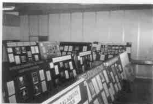
Trabalhos ficaram expostos no campus da FMABC.

O sucesso da XXIV edição do COMUABC - Congresso Médico Universitário do ABC - pôde ser medido, principalmente, pela quantidade de trabalhos inscritos e participantes neste ano. O evento contou com a inscrição de mais de 600 congressistas, 105 posters expostos (20 apresentados) e 30 trabalhos científicos. O congresso reuniu durante um semana profissionais de peso da área médica que, entre palestra e cursos, se revejavam em apresentações no campus da Faculdade de Medicina do ABC e no Teatro Cacilda Becker, em São Bernardo do Campo. A participação da empresa Ford do Brasil no patrocínio do evento foi bastante elogiada, já que foi mais uma forma encontrada para incentivar a pesquisa médica na Faculdade. A festa de encerramento do COMUABC foi realizada no Centro Social José Tortorello, em São Caetano do Sul, quando foi entregue o prêmio Ford-Nylceo Marques de Castro para os vencedores das diversas categorias.