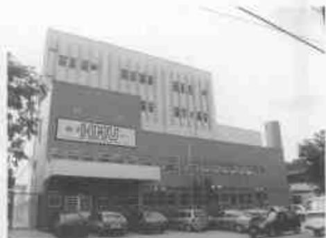
HMUSBC: Gerenciamento em parceria com a FUABC.

O Hospital Municipal Universitário de São Bernardo conta atualmente com 140 médicos atuando naquele espaço e capacidade de 130 leitos nas especialidades de clínica médica, clínica cirúrgica, ginecologia e obstetrícia, pediatria e UTI adulto, infantil e neonatal. Em breve deverá estar incorporando também os serviços de ecocardiografia e endoscopia.