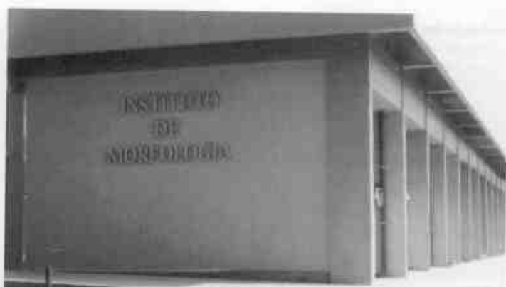
Instituto vai integrar disciplinas de Anatomia e Histologia

Nunca esquecendo que a partir do próximo ano a Faculdade de Medicina do ABC contará com um novo curso – Farmácia – também os alunos desta nova turma poderão utilizar aquele espaço. Para a construção do Instituto de Morfologia a FUABC contou com apoio financeiro da Prefeitura de Santo André.