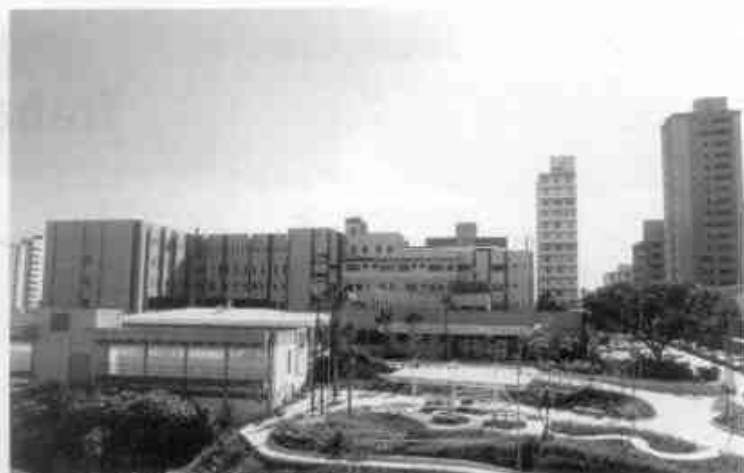
Centro Hospitalar de Santo André