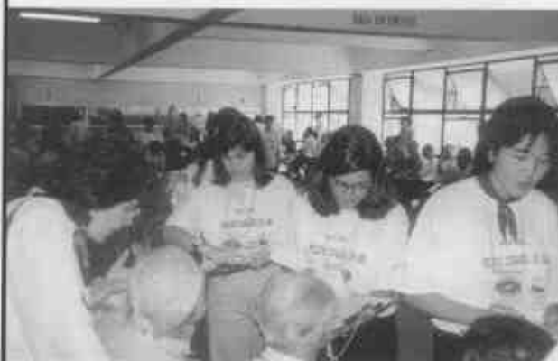
Atendimento no Projeto Catarata