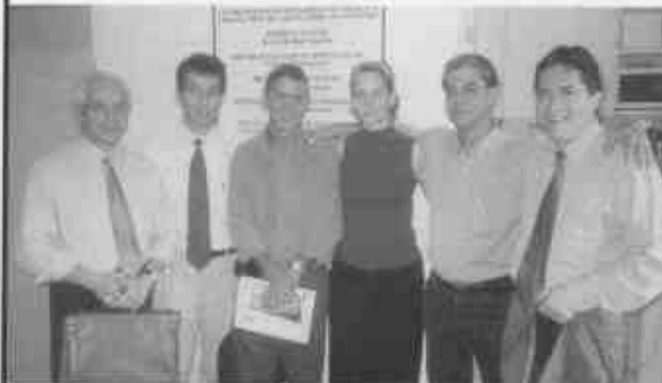
Inauguração do Centro Avançado de Treinamento de Cirurgia de Catarata