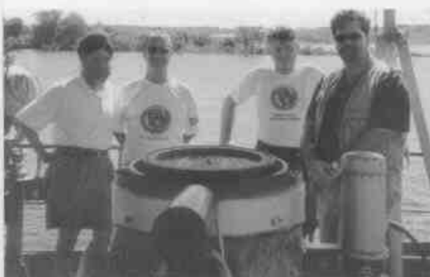
Projeto Amazônia VISÃO 2000