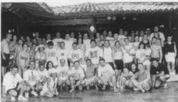
Confraternização no Club Med

A disciplina de Oftalmologia dirige junto com o Ministério da Saúde, Ministério da Marinha e Hospital das Forças Armadas de Brasília o Projeto Amazônia Visão 2000, que objetiva levar saúde ocular para ribeirinhos e aldeias indígenas na Amazônia Legal. Hoje, este projeto constitui-se no modelo de ação de saúde na Amazônia para o Ministério da Saúde.