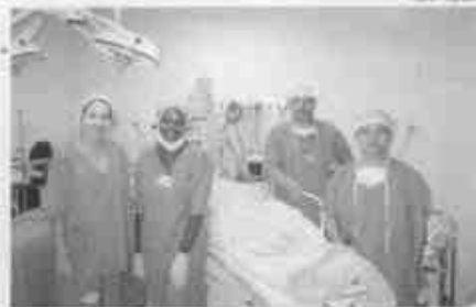
Equipe médica responsável pelas primeiras intervenções no Hospital Dia

e Rio Grande da Serra). As especialidades hoje oferecidas pelo Hospital são: Alergologia, Cardiologia, Cardiologia Infantil, Cirurgia Vascular, Dermatologia, Endocrinologia, Gastroenterologia, Geriatria, Infectologia, Nefrologia, Neurocirurgia, Neurologia Infantil, Neurologia, Oftalmologia, Oncologia, Ortopedia, Otorrinolaringologia, Pneumologia, Reumatologia, Urologia, além de serviços de diagnoses de imagem (tomografia, raio X simples e contrastado e ultrassonografia), laboratório de análises clínicas, eletroencefalograma, teste ergométrico, Holter, ecocardiograma e endoscopia digestiva alta.