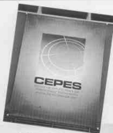
Banner exibido durante a cerimônia de lançamento do CEPES