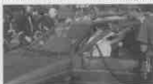
Simulação de atendimento no SENAI-SBC

O evento contou com a presença dos principais profissionais do país na área de prevenção e tratamento ao trauma e teve como destaque as diversas videoconferências, em especial a do dia 23, quando foi estabelecido um link ao vivo com o Departamento de Bombeiros de Nova Iorque - EUA, responsável pelo atendimento às vítimas do atentado de 11 de setembro de 2001 ao World Trade Center.