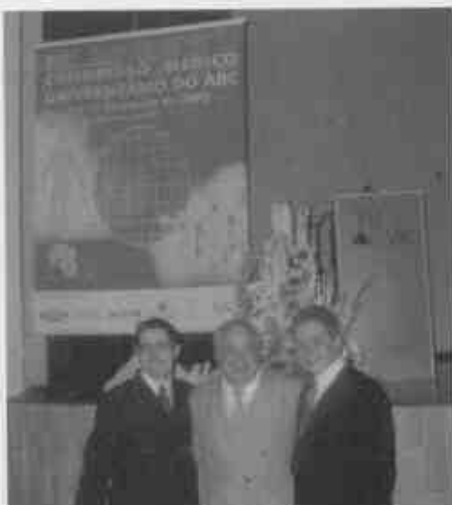
Encerramento da XXVII COMUABC