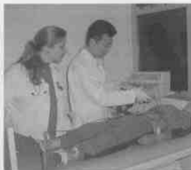
Criança em atendimento no Ambulatório de Arritmias

O Ambulatório tem capacidade para atender cerca de 80 pacientes por mês, sendo realizado inicialmente as quartas-feiras, das 8h às 12h, podendo fazer agendamentos pelo telefone 4993-5468.