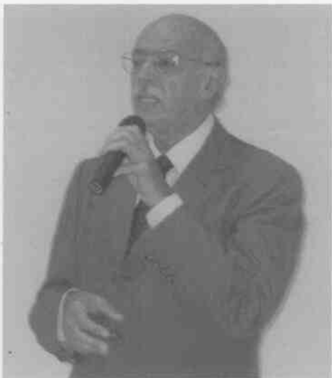
Dr. Adib Jatene