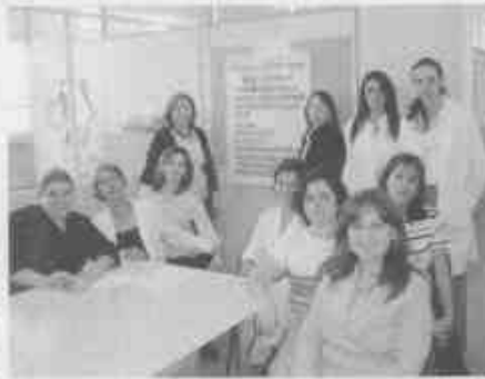
Docentes do Curso de Enfermagem da FMABC