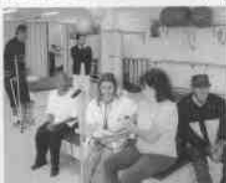
Fisioterapia no Hospital Mário Covas

Em princípio, as três novas graduações serão inauguradas com apenas 50 vagas cada. As aulas para os cursos de Fisioterapia e Terapia Ocu-