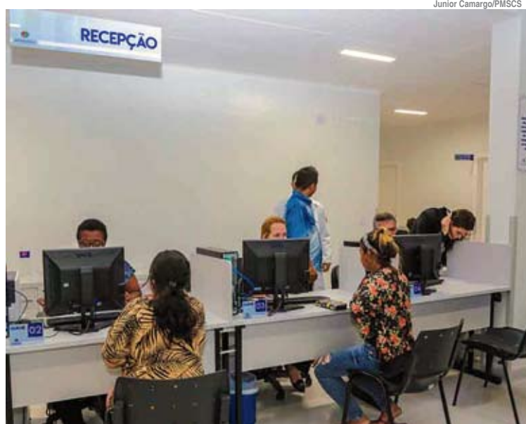
Pacientes elogiam início dos atendimentos de urgência e emergência no novo modelo

O atendimento infantil (até 14 anos) permanece no Hospital Infantil Márcia Braidó para quem tem o CidCard. Quem não possui o cadastro é atendido