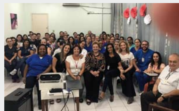
Funcionárias participaram de palestras e ganharam café da manhã

Em 13 de março, a unidade ofereceu um café da manhã para as funcionárias e promoveu uma palestra com profissionais do CRAVI (Centro de Referência de Apoio à Vítima) e Defensoria Pública. A atividade foi