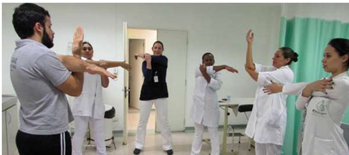
Funcionários participaram de aulas de ginástica laboral em vários setores assistenciais

O evento contou, ainda, com um SPA facial e de mãos realizado