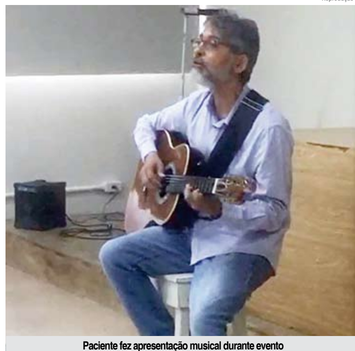
Paciente fez apresentação musical durante evento