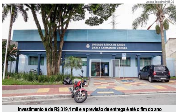
Investimento é de R$ 319,4 mil e a previsão de entrega é até o fim do ano