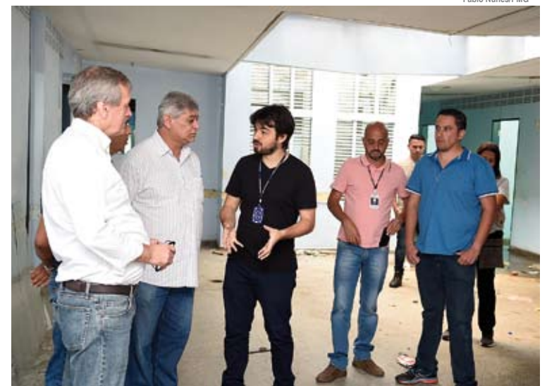
Nova unidade contará com 21 leitos de observação, nove a mais do que disponibilizava o PA

A UPA Paraíso será a quarta do município e a terceira entregue pela atual gestão. Assim como as demais, segue projeto e padrão do Ministério da Saúde. Com mais de 1.400m² de área