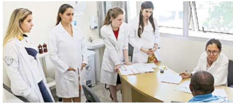
Ao todo foram atendidos 63 pacientes na FMABC

Musicoterapia, boliche, piscina de grãos, jogos de arremesso e pranchas de equilíbrio estiveram entre as ativida-