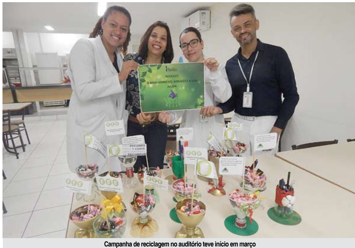
Campanha de reciclagem no auditório teve início em março

As iniciativas de preocupação com a saúde ambiental e hospitalar fazem parte das ações realizadas para cumprimento dos objetivos da Agenda Global Hospitais Verdes e Saudáveis (AGHVS), ligada à Rede Global Hospitais Verdes e Saudáveis – da qual o hospital é membro desde 2013.