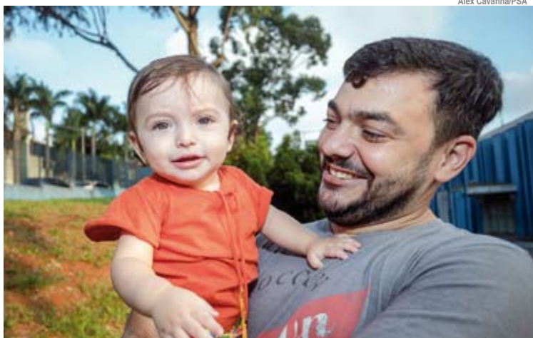
Presença do pai nos primeiros dias de vida fortalece vínculo com o bebê

A ampliação do período de licença-paternidade está prevista na Lei nº 13.257, sancionada em 8 de março de 2016, no Dia Internacional da Mulher. Essa legislação modificou uma lei de 2008 que já havia ampliado o tempo de licença-maternidade de quatro para seis meses.