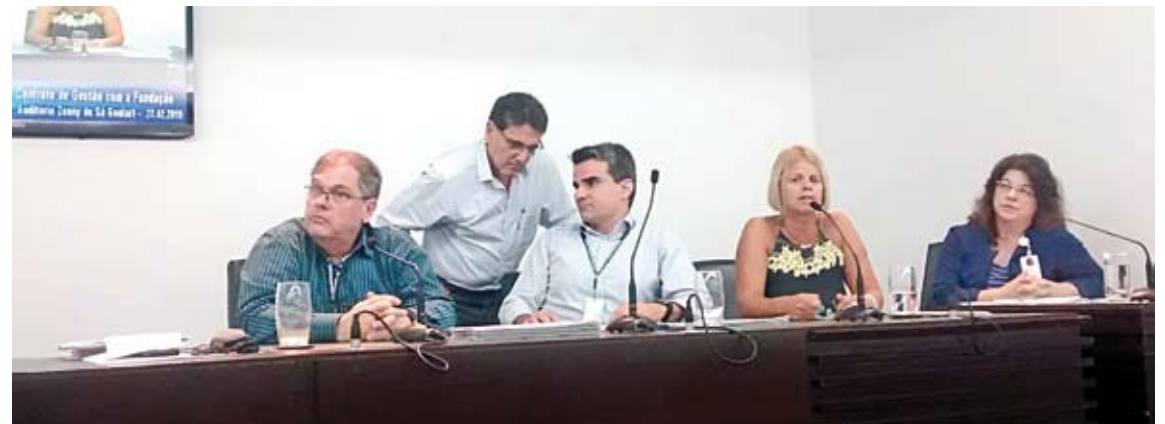
Audiência pública ocorreu no auditório da Câmara Municipal de Santos

Entre os indicadores de desempenho, foram avaliados índices quantitativos de consultas médicas (Pediatria, Clínica Médica e Ortopedia), exames diagnósticos e procedimentos. Ao todo foram 56.308 consultas médicas e 6.307 de