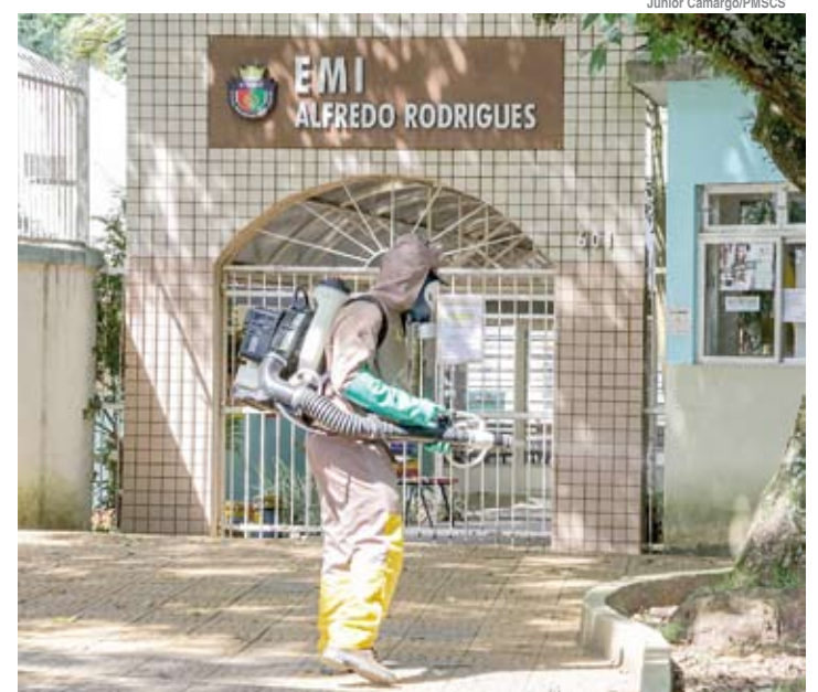
Município não registrou caso autóctone da doença em 2019

Alguns cuidados simples são efetivos no controle da proliferação do mosquito, como evitar o acúmulo de água em vasos de plantas e outros objetos, tratar ralos com água sanitária, fazer a manutenção periódica de calhas e lajes e vedar corretamente as caixas d’água. “A prevenção da dengue em São Caetano depende da participação de todos”.