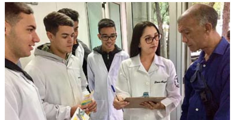
Ação buscou orientar a população sobre o mosquito Aedes aegypti e as doenças por ele transmitidas

Amostras de medicamentos contendo ácido acetilsalicílico foram exibidas, a fim de reforçar junto à população que esse tipo de fármaco deve ser evitado