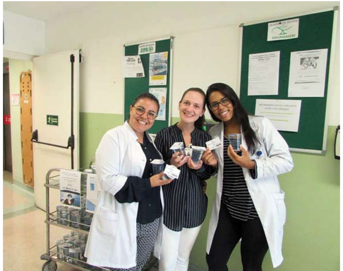
Equipe distribuiu copos de água mineral e informativos para pacientes e funcionários