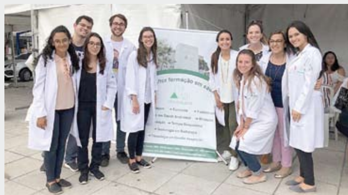
Ação foi voltada à promoção da saúde e qualidade de vida

As equipes da FMABC e da Sogesp estiveram responsáveis por uma tenda temática sobre “Osteoporose”, onde os pacientes puderam conversar com especialistas e tirar dúvidas, além de realizar gratuitamente dois tipos de exames: teste de sarcopenia e ultrassom de calcâneo.