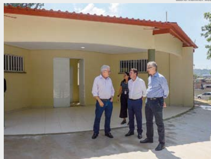
Prefeito Orlando Morando visitou andamento das obras no fim de março

Em breve, a população de São Bernardo será beneficiada o com maior Centro de Atenção Psicossocial da cidade. As obras de construção do CAPS do Jardim Farina – localizado na Avenida Wallace Simonsen, 1.900, no bairro Nova Petrópolis –, seguem em ritmo acelerado. O espaço foi visitado dia 26 de março pelo prefeito Orlando Morando e pelo secretário de Saúde, Dr. Geraldo Reple.