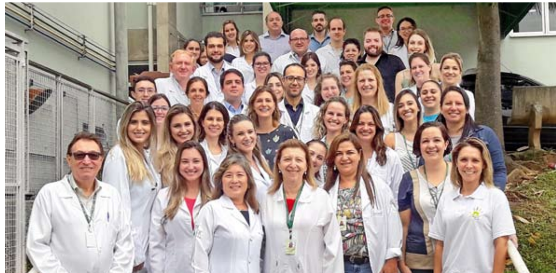
Equipe multiprofissional foi composta por especialistas em diversas áreas das doenças raras

A ação “Um dia para os raros” ocorreu em comemoração pelo Dia Mundial das Doenças Raras – celebrado oficialmente em 28 de fevereiro. Segundo definição da Organização Mundial da Saúde, a doença rara caracteriza-se como aquela que afeta até 65 pessoas a cada 100 mil indivíduos – ou seja, 1,3 pessoa num grupo de 2 mil. O problema atinge aproximadamente 5% da população, comprometendo milhões de pessoas ao redor do mundo. Estima-se que 80% dos casos têm origem genética e 50% afetam crianças – sendo que 30% morrem antes dos 5 anos de idade. Até o momento, cerca de 8 mil doenças raras já foram identificadas, cujas características principais são a natureza complexa, a evolução crônica e debilitante. Essas particularidades, associadas ao acesso limitado aos tratamentos e serviços especializados,