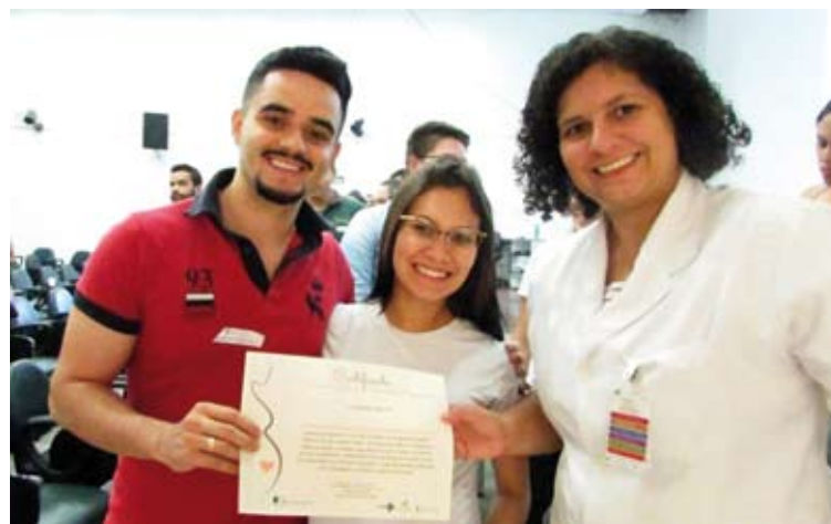
Pais e mães recebem certificação após participação no programa