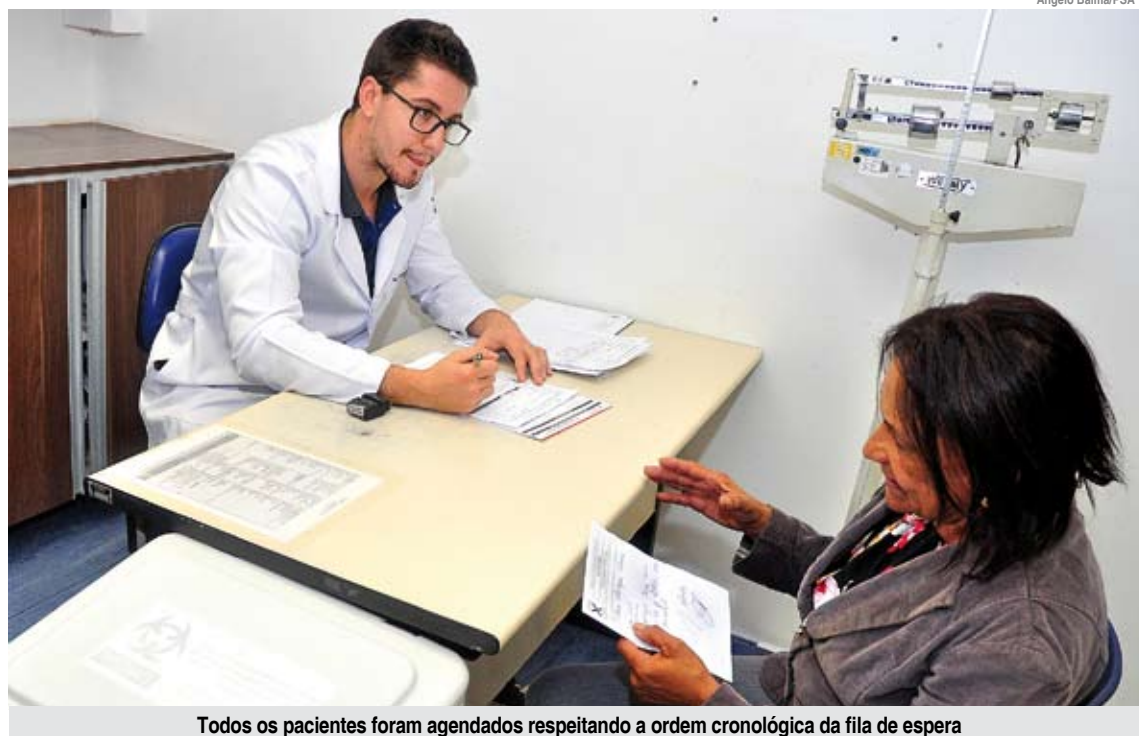
Todos os pacientes foram agendados respeitando a ordem cronológica da fila de espera

Para garantir efetividade e agilidade aos atendimentos, a organização foi dividida em três etapas. Após o primeiro atendimento, se necessário, os pacientes são encaminhados para realizar exames de diagnóstico e retorno médico