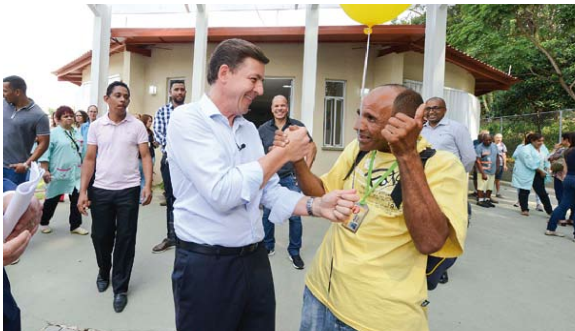
Prefeito Orlando Morando cumprimenta paciente da unidade

sociais, entre outros. As 34 Unidades Básicas de Saúde (UBSs) da cidade possuem atendimentos psicológicos e psiquiátricos, por meio de matriciamento, realizado por médicos generalistas.