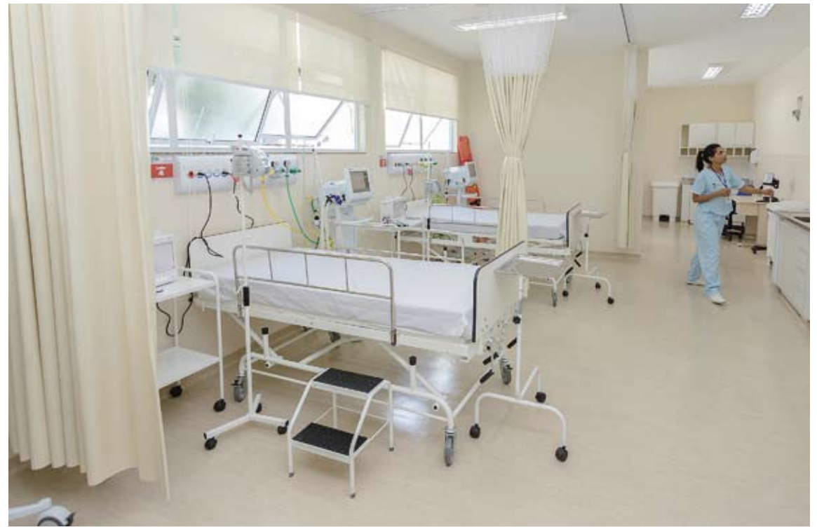
Estrutura possui 21 leitos, cinco consultórios médicos e duas salas de classificação de risco

“O sistema de saúde de Santo André há muito tempo não tinha investimento e nem passava por pro-