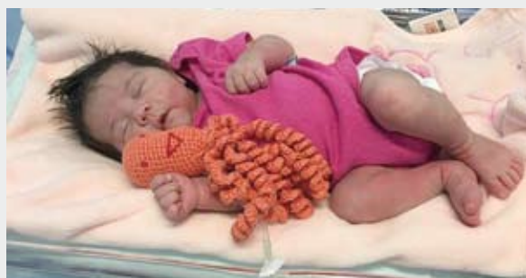
Bichinhos de crochê e seus tentáculos remetem ao cordão umbilical e reproduzem o ambiente interno do útero

Os bebês prematuros da UTI Neonatal do Hospital da Mulher de Santo André passaram a dividir espaço, em maio, com polvos de crochê. Os bichinhos fazem parte de uma iniciativa trazida da Dinamarca, aplicada por voluntários da Igreja Plenitude de Cristã de Santo André e doados à unidade.