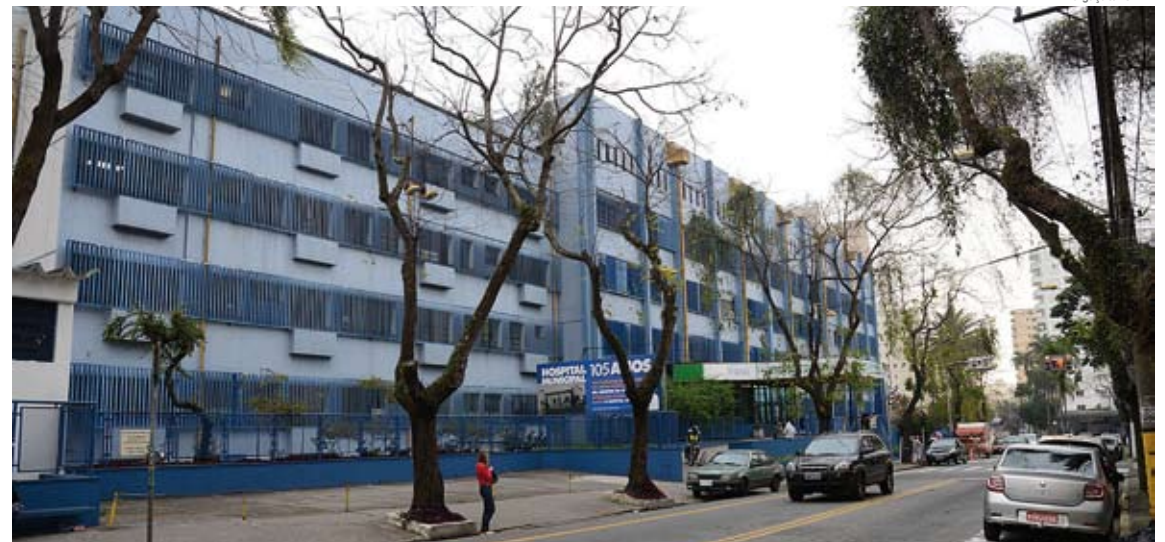
Mais de mil pacientes farão cirurgias de vesícula, hérnia, tireóide e vascular no CHM

administração em abril de 2017 e realiza cirurgias de baixa complexidade que permitem que o paciente passe pelo procedimento e tenha alta no mesmo dia, sem necessidade