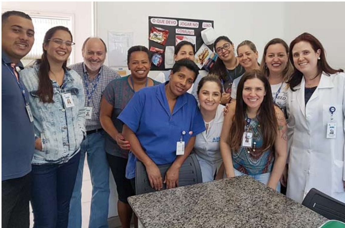
Equipe da Comissão de Gerenciamento de Resíduos junto à diretoria

Equipes desenvolveram ações de melhorias para a segregação dos materiais; objetivo é engajar os colaboradores sobre o descarte correto