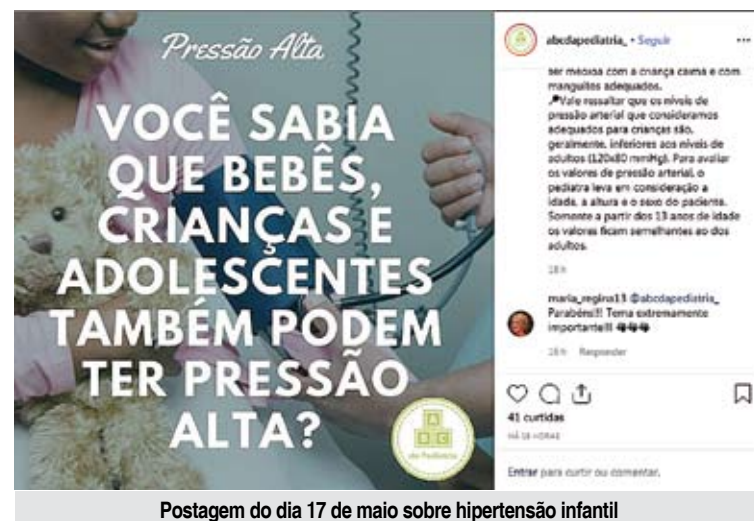
Postagem do dia 17 de maio sobre hipertensão infantil

Interessados podem acompanhar as postagens no Facebook pelo @pediatriaabc e no Instagram pelo @