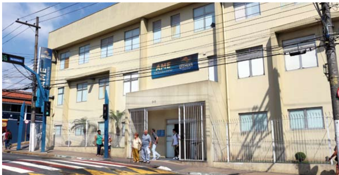
Unidade irá ofertar 6 mil consultas médicas por mês em 20 especialidades

Localizado na microrregião de Osasco, Ambulatório Médico de Especialidades será gerido pela FUABC a partir de 3 de junho