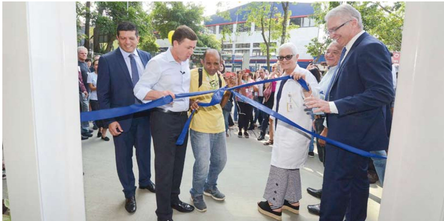
Cerimônia de entrega ocorreu dia 24 de abril no bairro Nova Petrópolis

O novo imóvel possui área de 2.680m², dispõe de seis salas de atendimentos individuais, duas salas