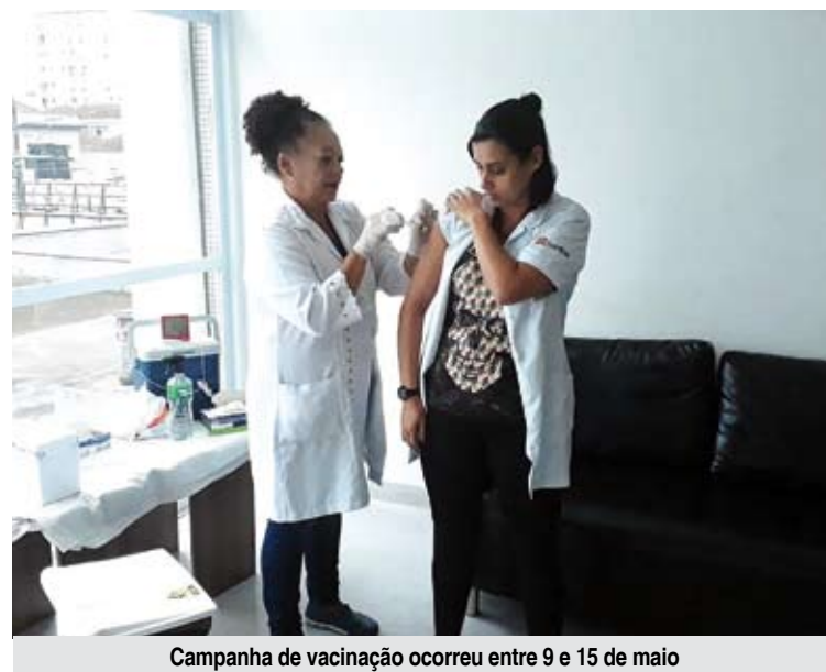
Campanha de vacinação ocorreu entre 9 e 15 de maio

Neste mês de maio, a UPA Central de Santos aderiu à campanha nacional de vacinação contra a gripe Influenza, do Ministério da Saúde (MS), e imunizou todos os seus funcionários entre os dias 9 e 15 – inclusive as equipes do final de semana. Os trabalhadores da área da Saúde fazem parte do grupo prioritário