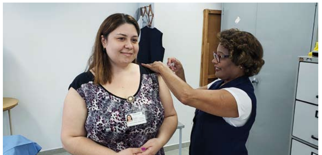
Equipes imunizadas são das áreas assistenciais e administrativas

A sala do NECIH, no prédio administrativo, foi decorada para a campanha e os funcionários puderam tirar fotos com acessórios inspirados nas redes sociais para demonstrar que foram imunizados contra o vírus Influenza. Após a ação junto aos colaboradores, a equipe do núcleo segue, como de costume, vacinando pacientes em internação prolongada, com doenças crônicas não transmissíveis e idosos (a partir dos 60 anos), mediante critérios médicos.