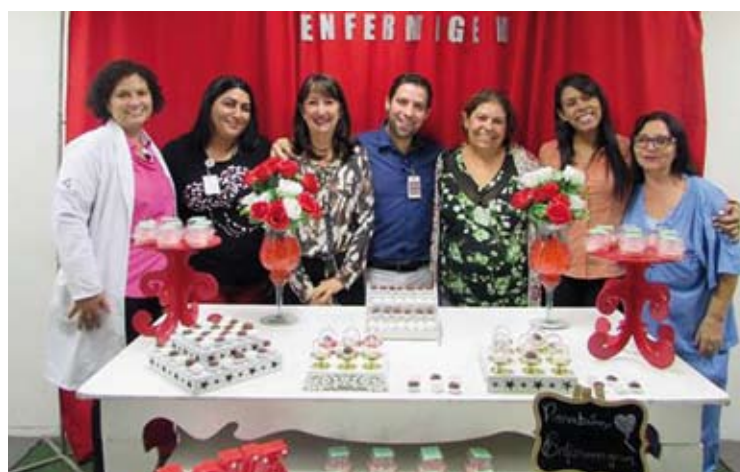
Equipes de enfermagem do Hospital da Mulher de Santo André (à esq.) e do Hospital Nardini de Mauá

“O papel da enfermagem é essencial para a saúde pública. É um momento de construção e compartilhamento de saberes integrando a área de ensino, assistência e prática para estímulo e articulação de ações que podem melhorar o processo de trabalho da equipe de Enfermagem. Foi uma semana muito bem pensada para os nossos profissionais e feita com capri-