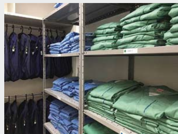
Iniciativa visa unificar em um mesmo espaço a entrega e retirada das roupas privativas

A reativação da chapelaria unifica em um espaço a entrega e retirada das roupas privativas e dos Equipamentos de Proteção Individual (EPIs), que fazem parte da norma regulamentadora do Ministério do Trabalho, a NR 32. Além disso, o espaço possibilita ao funcionário que atua na área assistencial guardar seus pertences pessoais (bolsas, mochilas,