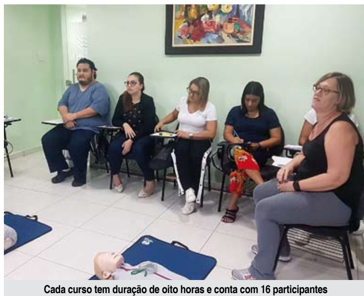
Cada curso tem duração de oito horas e conta com 16 participantes

“O curso de atendimento de emergência para enfermeiros e médicos é uma das cláusulas de nosso plano