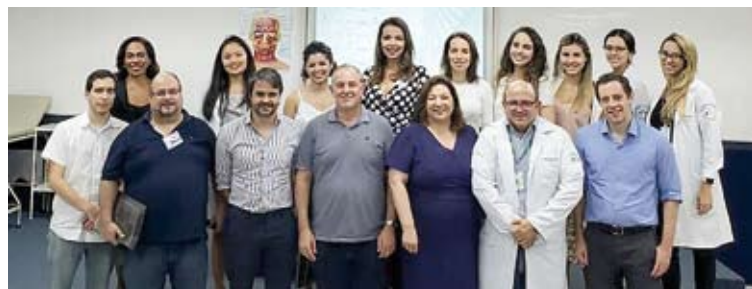
Equipe participante da terceira edição do curso

Em média, 1% da população apresenta urticária crônica. Trata-se de doen-