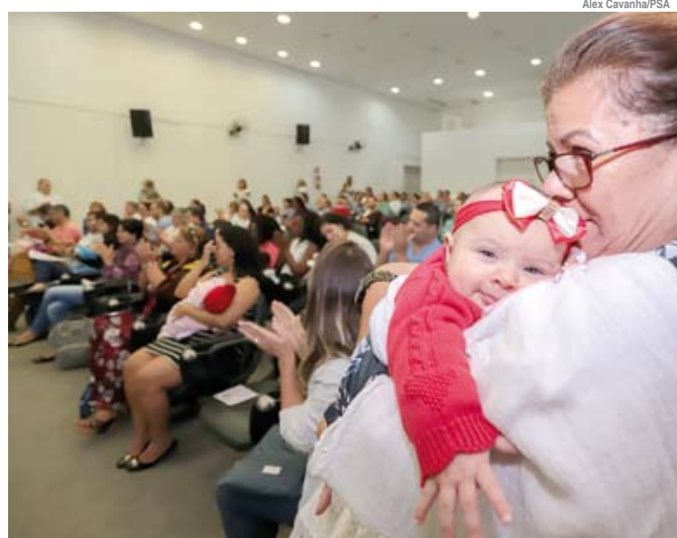
Banco de Leite da unidade conta atualmente com 63 doadoras fixas

O Banco de Leite Humano do Hospital da Mulher atende de segunda a sexta-feira, das 8h às 18h. Para doar, é preciso ligar no telefone (11) 4478-5048 ou (11) 4478-5027. É realizado um cadastro e agendada uma visita à