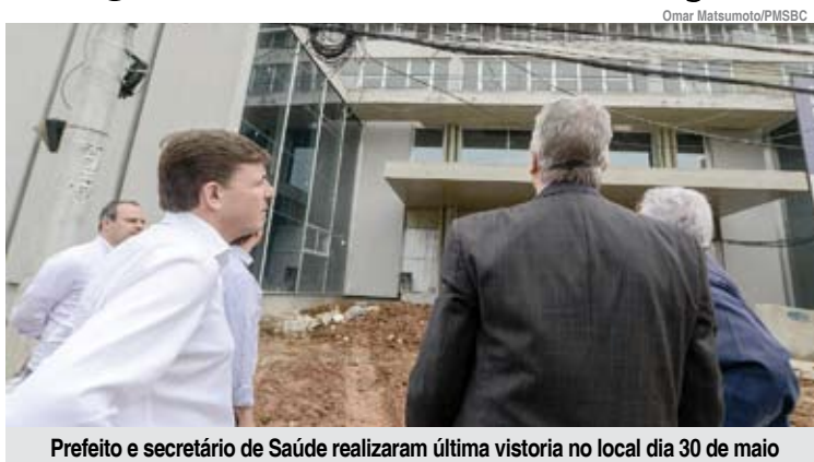
Prefeito e secretário de Saúde realizaram última vistoria no local dia 30 de maio