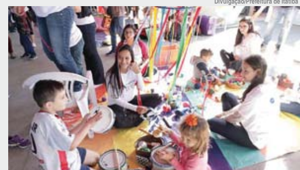
Ao todo, mais de 5 mil pessoas passaram pelo local

O Dia do Brincar, instituído em 26 de maio, reuniu famílias e contou com diversas brincadeiras tradicionais e distantes de tecnologia no Parque da Juventude. Ao todo, mais de 5 mil pessoas passaram pelo local.