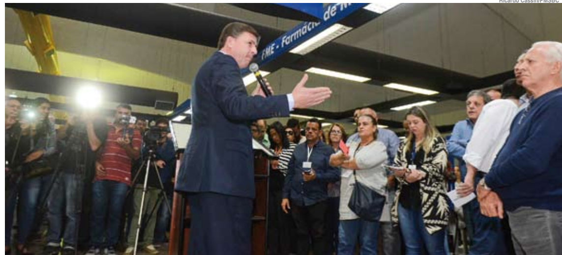
Prefeito Orlando Morando durante evento de entrega da unidade

O Estado investiu R$ 150 mil para a implantação do serviço e mensalmente irá enviar R$ 64 mil para a manutenção do equipamento e pagamento dos funcionários. Ao todo,