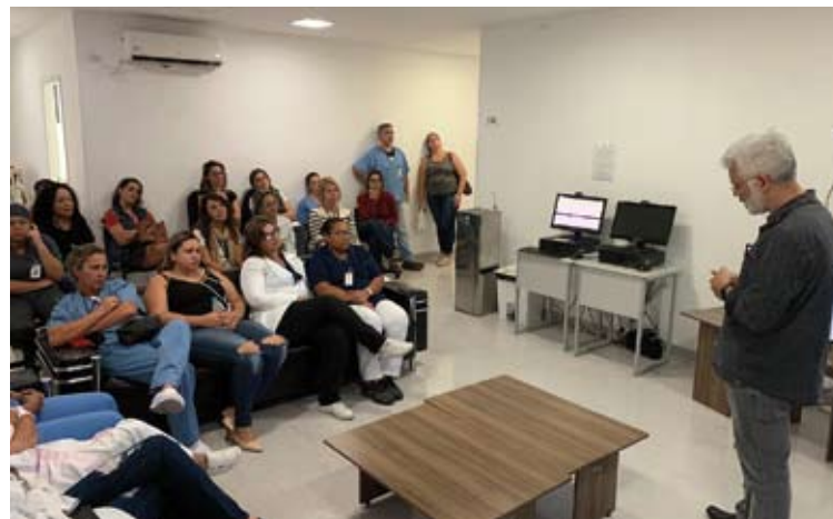
Em maio, colaboradores participaram de atividades na Semana da Enfermagem e do Serviço Social