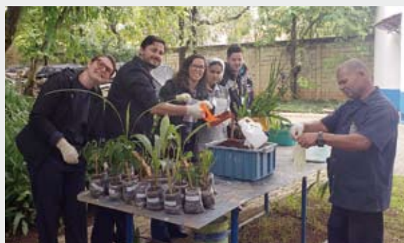
Funcionários ministraram oficina "Mãos na Terra" sobre plantio de mudas

Durante a semana os funcionários participaram de palestras educativas e diversas atividades de saúde, estética e beleza. Foram disponibilizados gratuitamente serviços como