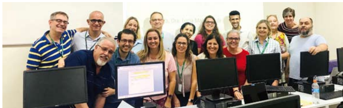
Professores durante oficinas sobre elaboração de planos de ensino e estratégias educacionais

Já na 16ª Semana da Farmácia, promovida dia 29 no Prédio Central do campus universitário, os alunos assistiram apresentações de representantes de diversas áreas farmacêuticas. Também houve palestras