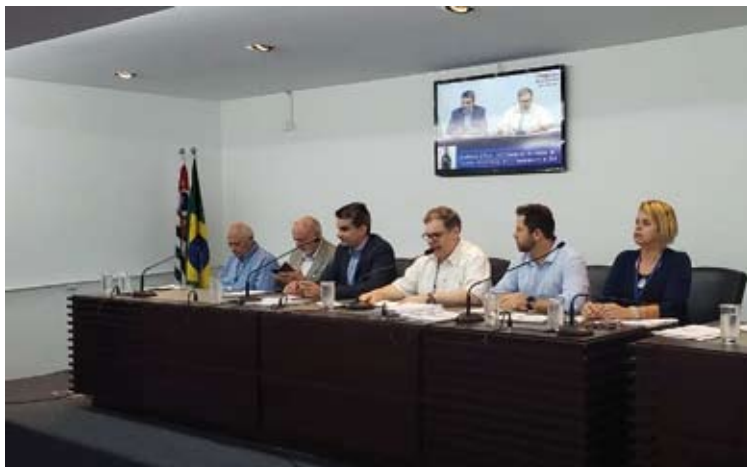
Com 100% de aprovação nas contas, FUABC garante manutenção do repasse integral para a assistência à saúde

No âmbito da satisfação dos usuários, quesito em que a UPA deve manter pelo menos 80% de satisfação positiva, a pontuação na prestação de contas atingiu 100%, graças a 82,3% de resultado bom ou ótimo na avaliação junto aos