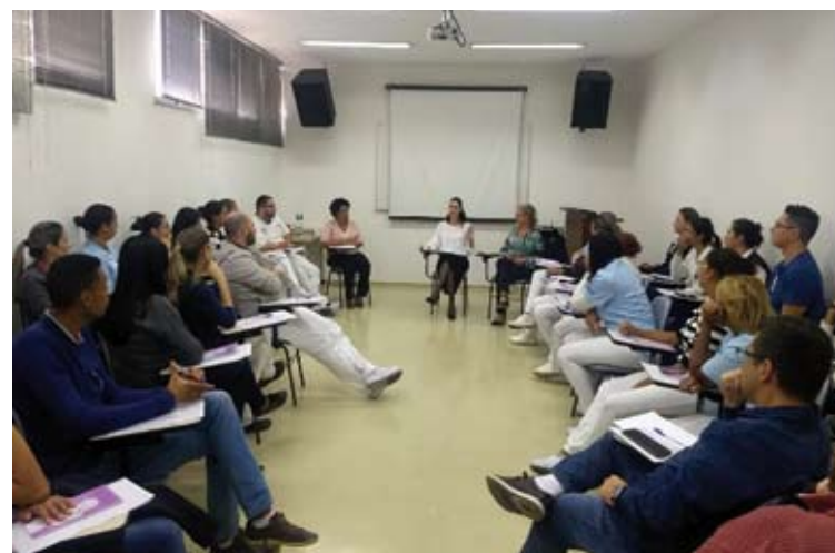
Roda de debates entre profissionais marcou atividades