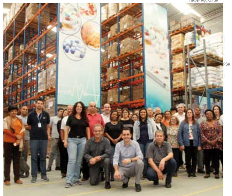
Prefeito Paulo Serra vistoriou o Centro de Gestão de Suprimentos da Saúde

A disponibilização do espaço onde funciona o Centro de Gestão de Suprimentos da Saúde, além de toda logística de entrada e saída de medicamentos, é feita pela empresa LogFarma. A empre-