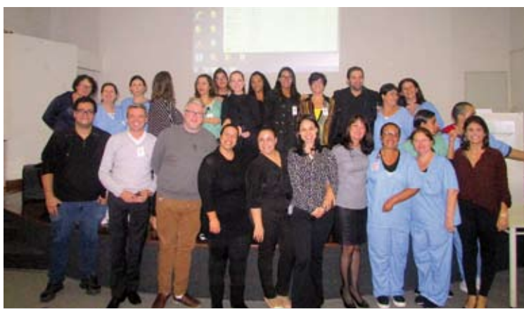
Evento contou com mais de 50 pessoas, sendo cerca de 30 representantes das UBSs

A Organização Mundial da Saúde (OMS) recomenda que apenas 15% dos partos sejam realizados por cesáreas. A falta de informação e o preconceito ainda são barreiras a serem superadas. “Nosso