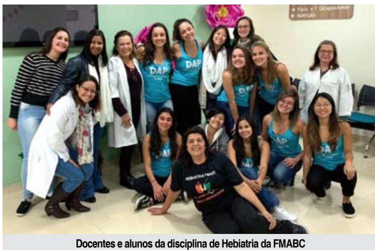
Docentes e alunos da disciplina de Hebiatria da FMABC