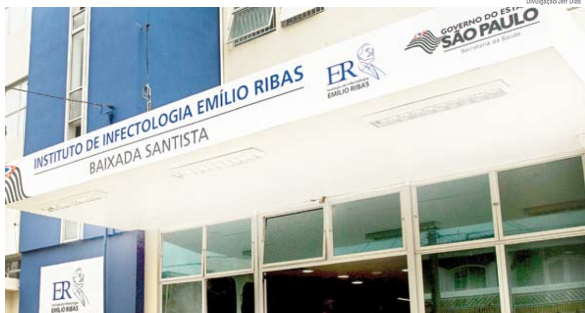
Unidade é especializada no atendimento de doenças infecciosas e parasitárias

O Emílio Ribas II conta com cerca de 200 colaboradores. Além do atendimento médico e de enfermagem, também estão disponíveis exames laboratoriais