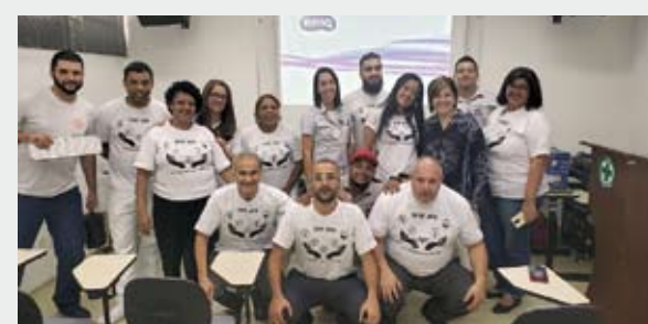
Evento contou com gincanas, palestras e atividades motivacionais

O objetivo é criar uma consciência crítica e observadora em todos os funcionários, bem como motivá-los a buscar conhecimento teórico e prático sobre as ações necessárias para cumprimento das normas que tornam o ambiente de tra-