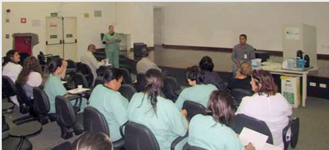
Técnicos das áreas de Segurança do Trabalho, Enfermagem, SCIH e SESMT ministraram o curso

Especialistas e técnicos das áreas de Segurança do Trabalho, Enfermagem, Serviço de Controle de Infecção Hospitalar (SCIH) e Serviço Especializado em Engenharia de Segurança e em Medicina do Trabalho (SESMT) ministraram o curso.