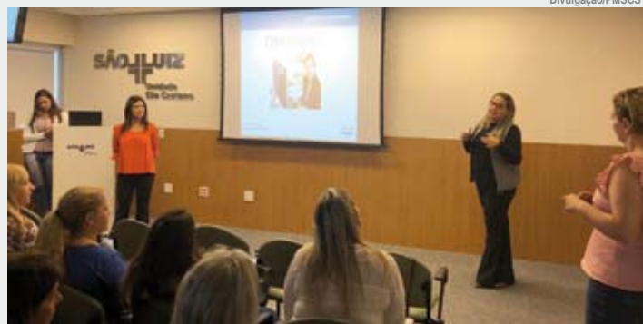
Cerca de 120 funcionários da rede de São Caetano participaram da atividade

Cerca de 120 funcionários da rede municipal de Saúde participaram da capacitação, realizada em dois sábados, 25 de maio e 1º de junho, no auditório da unidade São Caetano do Hospital São Luiz. A ação contemplou os servidores das 10 UBSs (Unidades Básicas de Saú-