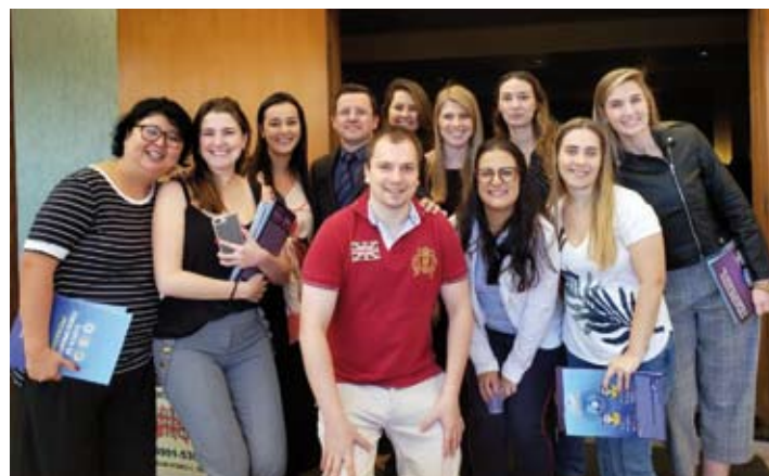
Atividade reuniu docentes e alunos da disciplina