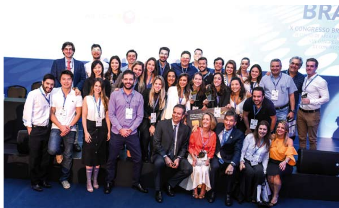
Equipe foi novamente premiada no Festival de Filmes Científicos

“Desde 2008 nosso serviço recebeu troféus em todos os festivais internacionais da BRASCRS que acontecem a cada dois anos. Neste ano conseguimos um recorde de premiações, o que muito orgulharia nosso saudoso professor e idealizador do Festival de Vídeos que realizamos