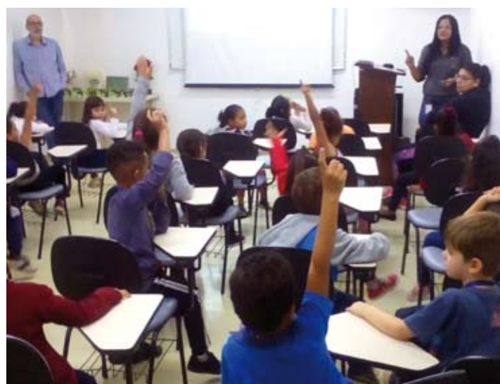
Unidade recebeu 40 alunos com idade entre 5 e 6 anos da escola vizinha

O objetivo da iniciativa é provocar uma reflexão nas crianças a respeito da reciclagem e para que compreendam a transformação dos materiais no meio ambiente.