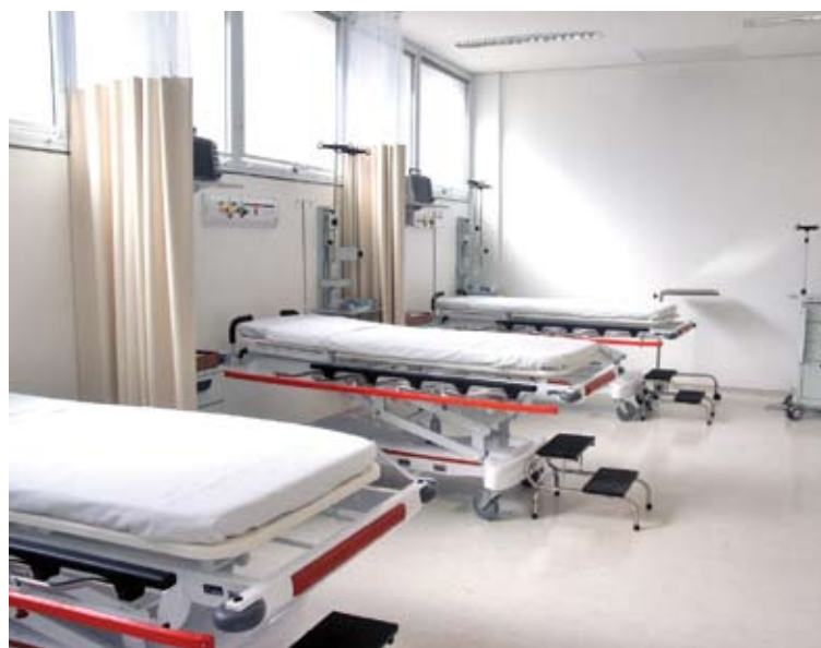
Hospital possui 91 leitos, sendo 69 de internação e 10 de UTI

O novo contrato amplia a bem-sucedida parceria com a Prefeitura de Mogi das Cruzes, iniciada em 2015 com a inauguração da Unidade de Pronto Atendimento (UPA) 24 Horas Dr. Manoel Masette Salgado, no bairro Rodeio, que desde o primeiro dia de funcionamento está sob gestão da FUABC. Em agosto de 2018, os trabalhos foram ampliados, quando a Fundação do ABC venceu chamamento público para prestação de serviços no Pronto Atendimento e UBS do Jardim Universo e no Pronto Atendimento Jundiapéba, assim como no Centro de Detenção Provisória de Mogi das Cruzes, Serviço de Apoio e Diagnóstico