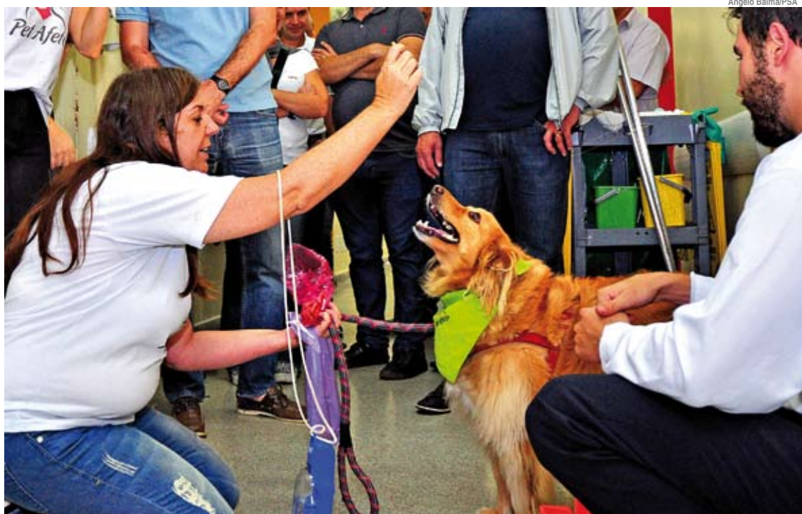
Estudos apontam efeito calmante e antidepressivo entre benefícios da iniciativa

Estudos apontam o efeito calmante e antidepressivo, o estímulo à integração social e a elevação da autoestima do paciente como alguns benefícios da Pet Terapia. Redução da pressão sanguínea e cardíaca, melhoria do sistema imunológico e do bem-estar geral também