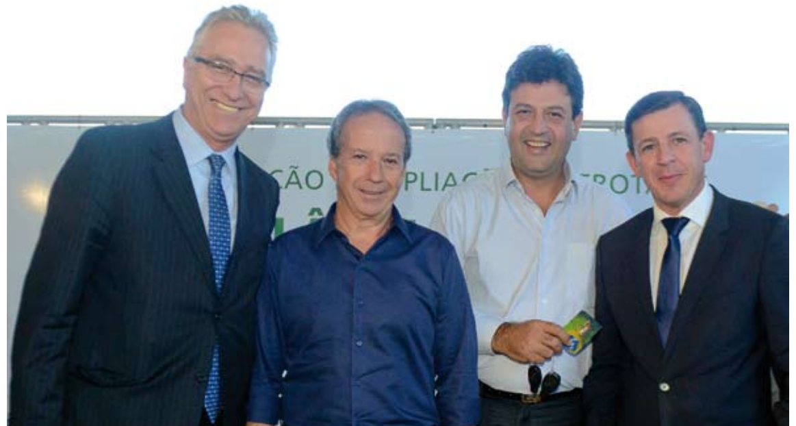
SBC foi contemplada com cinco novas ambulâncias do modelo básica

Além de conquistar novas ambulâncias, o município anunciou, dia 15