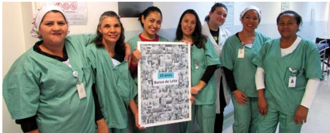
Equipe do Banco de Leite Humano celebra indicadores de qualidade

Vale ressaltar que o hospital também possui um serviço de apoio e promoção ao aleitamento materno destinado às gestantes e mães. O auxílio é dado por profissionais preparados para tirar dúvidas e orientar sobre assuntos referentes à amamentação.