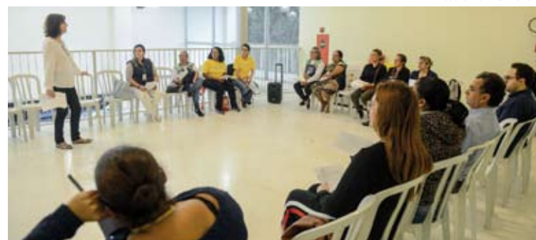
Nos últimos dois anos, mais de 3.500 pacientes foram assistidos

Com o programa nas UBSs, que tem duração de 12 semanas e encontros semanais em grupo, 2.278 pessoas deixaram de fumar. Para participar do programa o paciente deve procurar a UBS mais próxima da sua residência e solicitar a inscrição.