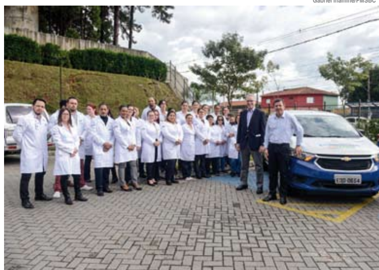
Entrega foi realizada no estacionamento do Hospital de Clínicas, no bairro Alvarenga

A entrega oficial foi realizada pelo prefeito Orlando Morando e pelo secretário de Saúde, Dr. Geraldo Reple, no estacionamento do Hospital de Clínicas, no bairro Alvarenga. “A entrega destes carros alinha o nosso trabalho de investimento por um melhor serviço à população. O PID realiza atendimento em pacientes acamados ou que necessitam de cuidado semelhante ao de homecare”, explicou o prefeito.