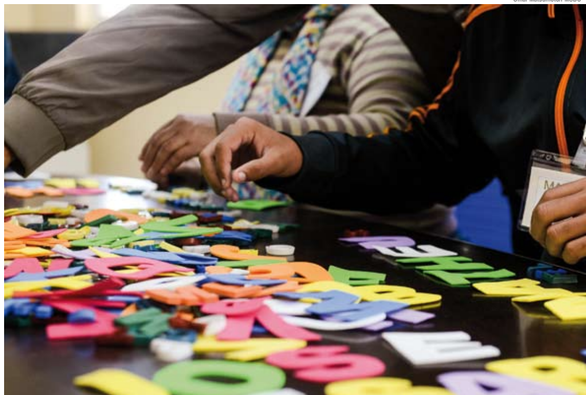
Oficinas terapêuticas auxiliam o processo de reabilitação social