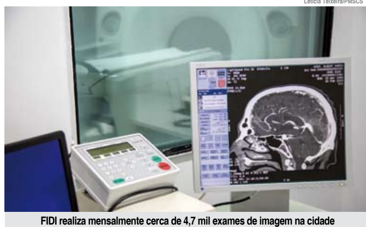
FIDI realiza mensalmente cerca de 4,7 mil exames de imagem na cidade

A instituição, fundada em 1985 por médicos professores do Departamento de Diagnóstico por Imagem da Escola Paulista de Medicina (atual Universidade Federal de São Paulo -