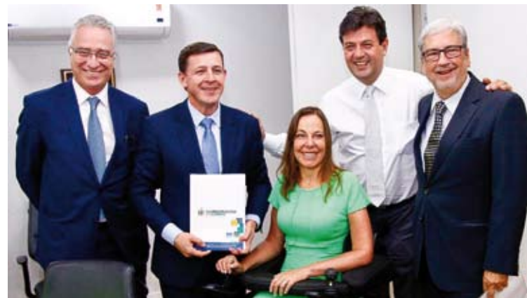
Senadora Mara Gabrilli acompanhada pelo secretário Dr. Geraldo Reple Sobrinho (Saúde), o prefeito de São Bernardo, Orlando Morando, o ministro da Saúde, Luiz Henrique Mandetta, e o secretário do Escritório de Representação do Estado de SP em Brasília, Antônio Imbassahy

O novo hospital irá substituir os atendimentos hoje realizados no Hospital Pronto Socorro Central (HPSC) e contará, além dos 250 leitos, com 38 quartos, de dois ou quatro leitos cada e sala de enfermagem. O local também estará apto para realizar procedimentos cirúrgicos de baixa complexidade ou