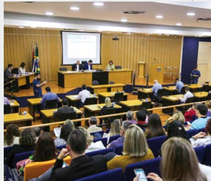
Audiência pública reuniu vereadores, moradores e técnicos da Pasta

A audiência pública para a prestação de contas do 1º quadrimestre de 2019 da Secretaria de Saúde da Prefeitura de São Caetano evidenciou o amplo trabalho baseado no tripé inovação, responsabilidade e seriedade, sempre com transparência. A plenária, realizada dia 29 de maio, na Câmara, reuniu vereadores, moradores e técnicos da Pasta.