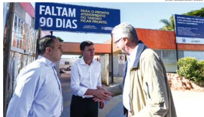
Previsão foi divulgada pelo prefeito dia 14 de junho

“Os dois equipamentos são fundamentais para ofertarmos serviços de qualidade, especialmente no Taboão, um bairro mais afastado do Centro e onde se faz necessário um Pronto Atendimento 24h para urgências e emergências, além da UBS que oferece o cuidado do dia a dia via Atenção Básica”, disse o secretário de Saúde.