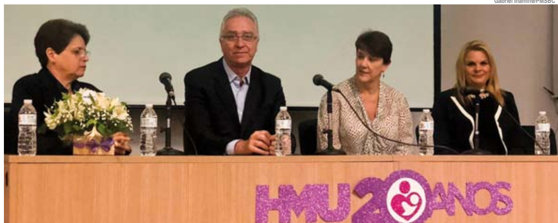
Evento na Associação Paulista de Medicina (APM) foi promovido em comemoração à data

Além do atendimento humanizado, o equipamento de São Bernardo também é referência como Banco de Leite. O hospital é o primeiro equipamento público de Saúde da região