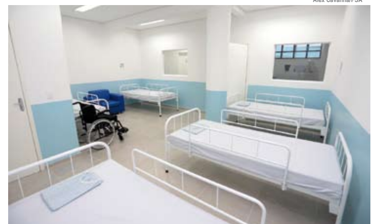
Serviço oferece atendimento 24h por dia e é referenciado para casos de urgência