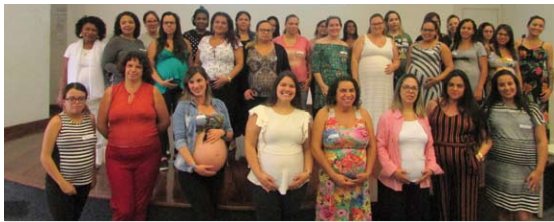
Desde março todas as pacientes recebem certificados

As voluntárias da Associação dos Voluntários da Saúde de Santo André (AVSSA), conhecidas como “rosinhas”, foram as responsáveis pelos presentinhos entregues às mães: sapatinhos de tricô vermelhos. Segundo a tradição, sair