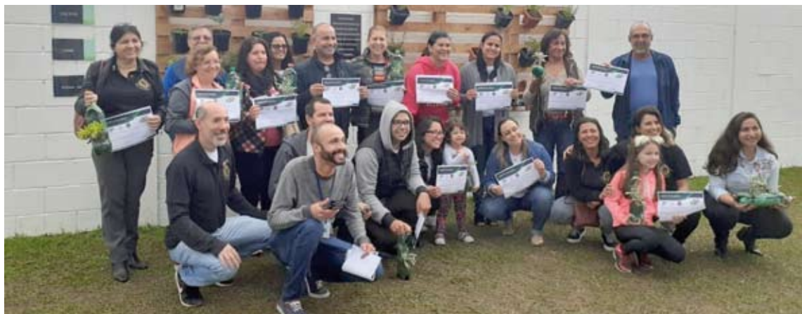
Participaram da atividade 20 pacientes, 15 colaboradores e seis familiares

A horta suspensa da unidade possui plantação de alface, couve, rúcula, tomate, além de camomila e ervas medicinais. Os itens são consumidos apenas pelos funcionários. Trata-se de uma ação voltada para o bem-estar e qualidade de vida dos colaboradores com espaço para descanso integrado com a natureza. O local é utilizado pelos colaboradores durante os intervalos de almoço, jantar ou café.