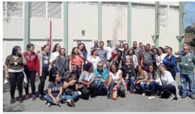
Atividade teve participação de brigadistas do hospital e foi comandada pelo SESMT

Após uma aula teórica no anfiteatro da unidade, os colaboradores foram para a ação que simulava um incêndio com focos maiores no setor administrativo e no centro cirúrgico. O objetivo foi procurar evacuar os setores de forma organizada, cada um sabendo qual era a sua função na “missão”, bem como combater o incêndio com os equipamentos necessários. A ação foi coordenada pelos líderes escolhidos durante a divisão de equipes.