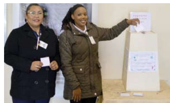
Funcionários votaram em slogan do Grupo de Trabalho de Humanização

No primeiro dia do evento uma urna foi colocada na entrada dos funcionários para que os profissionais depositassem sua sugestão. No dia 27, no auditório Grande São Paulo, foi realizada a abertura oficial da Semana