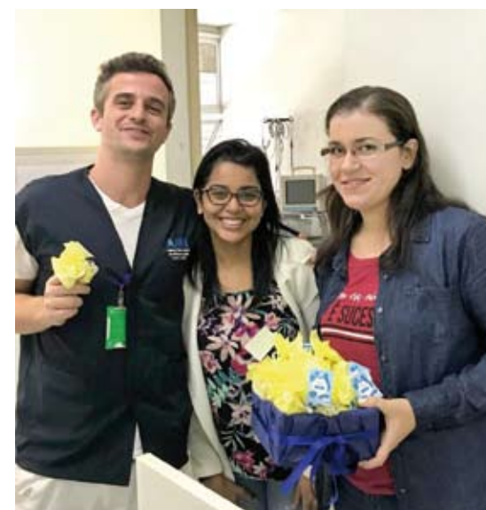
CIPA presenteou pais que atuam no AME

juntamente com representantes do Serviço de Engenharia de Segurança e Medicina do Trabalho (SESMT) e de outros departamentos se reuniram para confeccionar e distribuir lembranças em comemoração ao Dia dos Pais. Os presentes foram entregues tanto aos colaboradores diretos quanto aos indiretos que atuam na unidade.