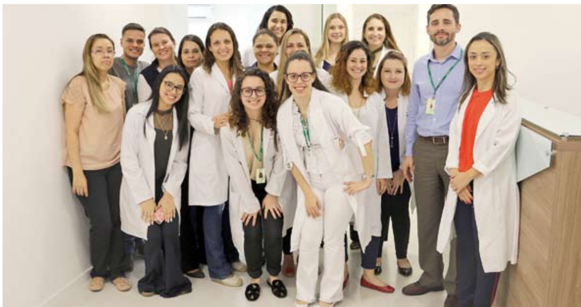
Equipe do Centro de Estudos e Pesquisas de Hematologia e Oncologia (CEPHO-FMABC)

A nova estrutura conta com três consultórios, recepção com capacidade para dez pessoas, sala de infusão com seis postos para recebimento de medicação com poltrona de acompanhante, sala de armazenamento de kits para coleta, sala de coleta, posto de enfermagem e posto de farmácia. Também foram adquiridos novo carrinho de parada cardiorrespiratória, seis poltronas para pacientes em tratamento quimioterápico e novos assentos para acompanhantes.