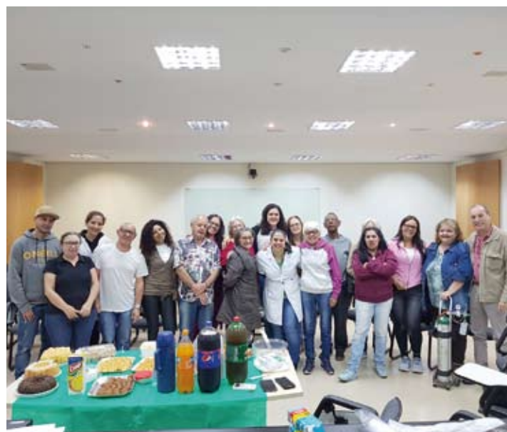
Roda de conversa marcou o Dia Nacional de Combate ao Fumo

mobilização da população para os danos sociais, políticos, econômicos e ambientais causados pelo tabaco. Criada em 1986 pela Lei Federal 7.488, a data inaugura a normatização voltada para o controle do tabagismo como problema de saúde coletiva. O hábito de fumar provoca doenças cardíacas, pulmonares, câncer, entre outras enfermidades.