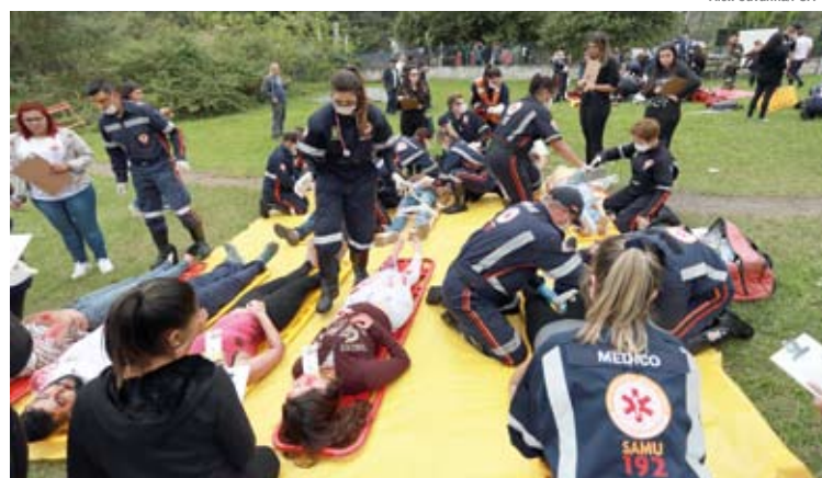
Atividade da Prefeitura teve parceria com o SAMU

A Prefeitura de Santo André participou com equipes da Guarda Civil Municipal, Departamento de Engenharia