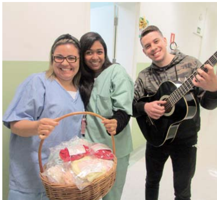
Funcionários cantaram e tocaram para entreter pacientes

O Hospital da Mulher de Santo André é considerado o maior centro de referência em saúde da mulher da região