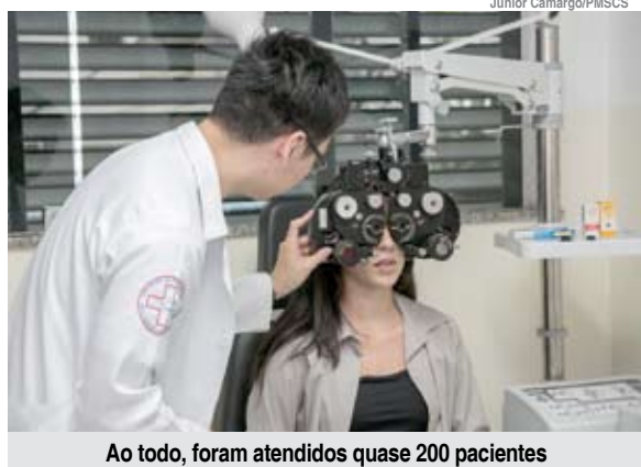
Ao todo, foram atendidos quase 200 pacientes

Ambos os mutirões foram exclusivos para pacientes agendados. No de pequenas cirurgias de pele, seis especialistas atenderam 128 pessoas com menos de 85 anos, com lesões menores de 6 cm não recidivadas (que não