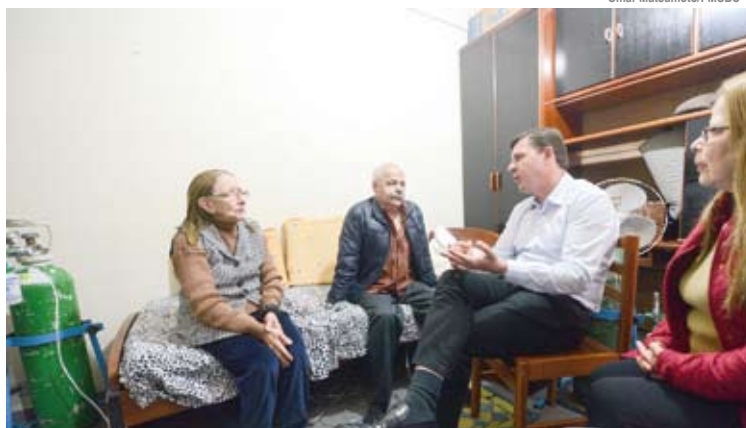
Prefeito Orlando Morando em visita domiciliar a pacientes

“Em vez de estas pessoas estarem em um leito hospitalar, estamos proporcionando a oportunidade de realizarem o acompanhamento no conforto de suas casas, com acompanhamento profissional e fornecimento dos materiais e equipamentos necessários para o tratamento”, explicou o prefeito Orlando Morando. Pelo programa, a Prefeitura fornece kits (concentrador, cilindro de back-up e cilindro de transporte de