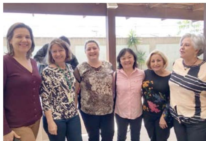
Palestrantes e convidados em evento na FMABC

gastroesofágico; contaminantes ambientais e risco da saúde; doenças endócrinas; guias alimentares para crianças abaixo de 2 anos e ansiedade e depressão em crianças e adolescentes. O evento contou com mesa redonda, painel de debates e miniconferências.