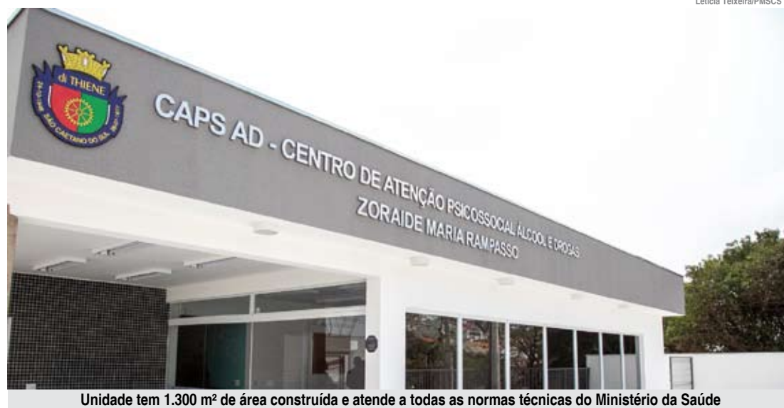
Unidade tem 1.300 m² de área construída e atende a todas as normas técnicas do Ministério da Saúde

O novo equipamento tem 1.300 m² de área construída e atende a todas as normas técnicas e recomendações do