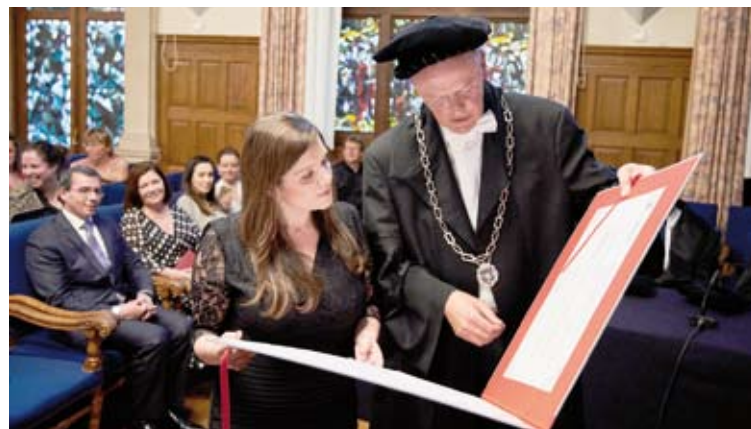
Tese foi defendida na Universidade de Groningen

Segundo o estudo da ex-aluna, embora a hemodiálise seja um tratamento capaz de salvar a vida de pacientes que possuem doença renal crônica, a expectativa de vida e a qualidade de vida desses pacientes é baixa em comparação