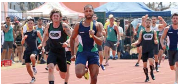
Atletismo masculino e vôlei feminino foram alguns dos destaques da FMABC

Ao todo foram 20 modalidades esportivas em disputa. Entre os resultados mais expressivos dos