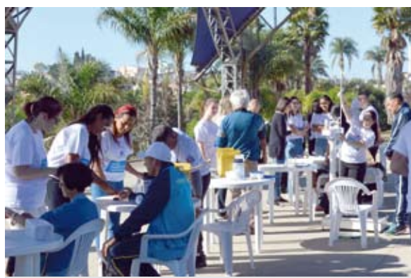
Participaram 60 profissionais e voluntários do HEMC

Quem esteve no parque pôde aferir a pressão arterial, fazer teste glicêmico e avaliar o Índice de Massa Corpórea (IMC). As equipes médicas, de enfermagem, serviço social,