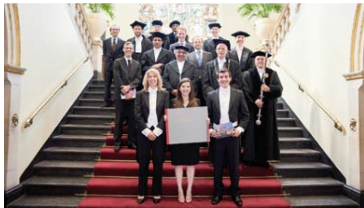
Ao centro, ex-aluna com outros pesquisadores

mente pesquisa em laboratório, é muito desafiador. Foi um processo difícil, mas muito enriquecedor. A internacionalização da FMABC é algo importantíssimo e deve ser incentivado para que nosso País e as universidades não fiquem de fora do mundo científico, que é um mundo de networking, de trabalho em conjunto e definitivamente internacional. Traz benefícios imensos que refletem na qualidade de ensino da faculdade e consequentemente no tratamento oferecido aos pacientes. O aprendizado adquirido durante a iniciação científica na FMABC foi muito importante para