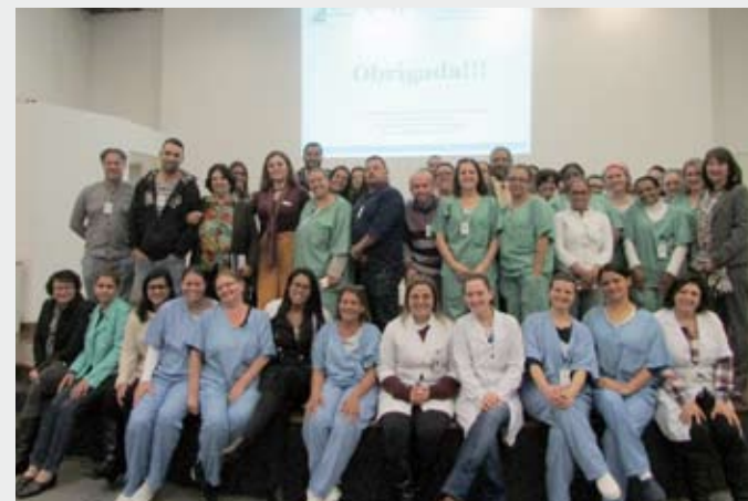
Palestras e atividades foram realizadas entre 3 e 6 de setembro

O Hospital da Mulher encerrou dia 6 de setembro a Semana Interna de Prevenção de Acidentes do Trabalho (SIPAT), voltada à prevenção de acidentes e doenças relacionadas ao trabalho.