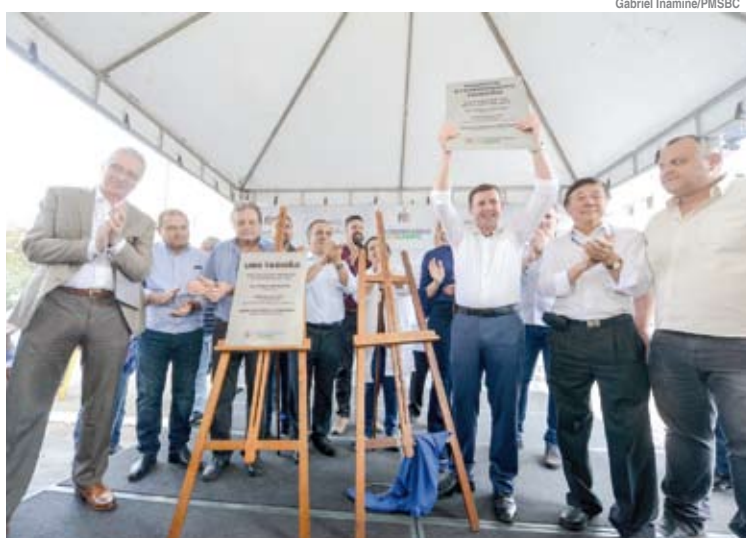
Evento de entrega foi realizado dia 12 de setembro e reuniu autoridades municipais

“Foi um erro do governo passado fechar o Pronto-Socorro do Taboão, por uma questão lógica. Este é o bairro mais afastado da região central da cidade e o deslocamento para equipamentos de urgência é mais difícil. Dependendo da gravidade do caso, essa viagem pode ser fatal. Estamos devolvendo um direito que foi tirado de maneira equivocada dos moradores