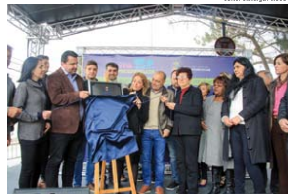
Entrega também marcou o início do Programa Remédio em Casa

A obra agregou novos espaços à UBS (inaugurada em 1968), como dois novos consultórios, escovódromo