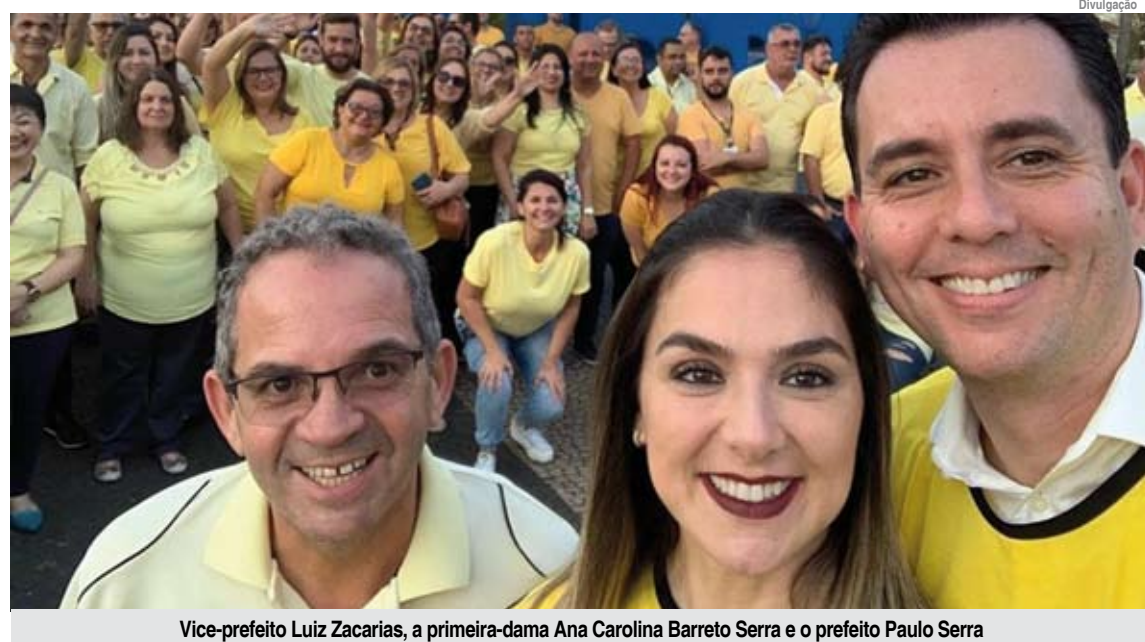
Vice-prefeito Luiz Zacarias, a primeira-dama Ana Carolina Barreto Serra e o prefeito Paulo Serra

Entre as atividades realizadas estão o 3º Fórum de Prevenção do Suicídio de Santo André, promovido dia 6 de setembro no Teatro Municipal Maestro Flavio Florence. Na ocasião, foram abordados temas como preven-