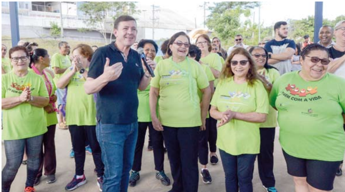
Prefeito Orlando Morando em inauguração da unidade do Jardim Nazareth

Com o objetivo de continuar a promover bem-estar e qualidade de vida em São Bernardo, o prefeito Orlando Morando inaugurou em agosto duas Academias da Saúde no município. A primeira, na Praça Três Marias, no Jardim Nazareth. A segunda no Jardim Farina.