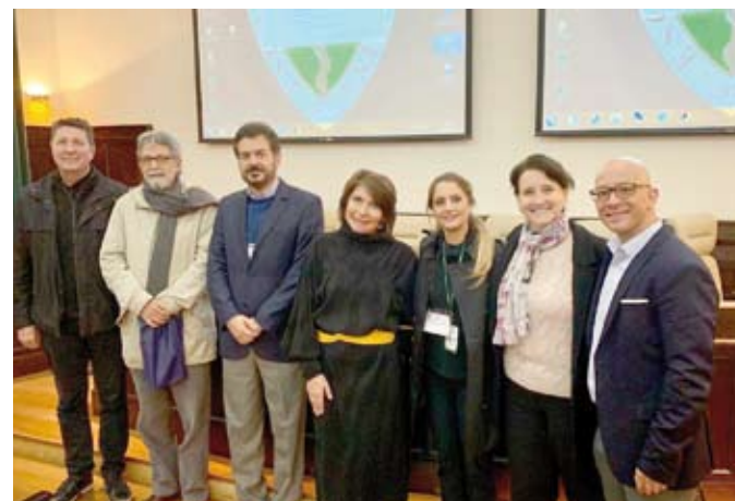
Equipe de professores participantes do curso