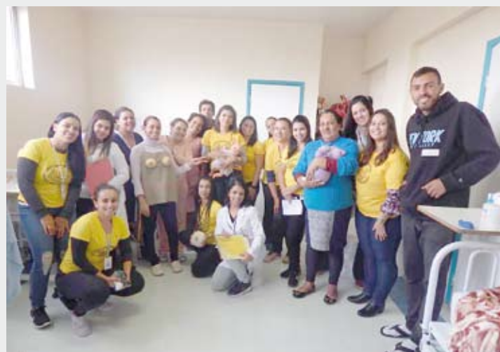
Equipes realizaram abordagem leito a leito com pacientes

O espaço dispõe de ambiente acolhedor para a ordenha do leite materno, além de oferecer geladeira para armazenamento, microondas e local para trocar fraldas. Vale ressaltar que o hospital não fornece frascos para retirada e armazenamento do leite humano ou bolsa térmica para o transporte. É de responsabilidade de cada funcionária ter o material necessário para ordenha, armazenamento e transporte do seu leite.