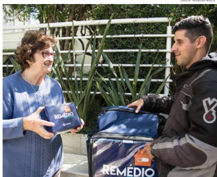
Entrega é realizada aos pacientes por quatro motos identificadas

O deputado estadual Thiago Auricchio antecipou que fará indicação para que o governador João Dória leve a iniciativa do Remédio em Casa para todo o Estado de São Paulo. Já a secretária de Saúde, Regina Maura Zetone, destacou o melhor acompanhamento dos tratamentos dos pacientes proporcionados pelo prontuário eletrônico e o novo programa. “Hipertensão, diabetes e outras patologias associadas não têm cura. Mas, com um melhor gerenciamento, os pacientes ganham qualidade de vida.”