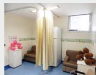
Nova sala de amamentação

As nutricionistas entregaram um trocador de fraldas, folder explicativo sobre mitos e verdades relacionados à amamentação e informativo sobre os dez passos de apoio para o sucesso