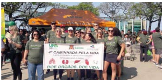
Funcionários se reuniram em atividade no dia 15 de setembro

Membros da equipe da Unidade de Pronto Atendimento (UPA) Central de Santos participaram em 15 de setembro da 4ª Caminhada pela Vida, iniciativa destinada à conscientização da população sobre a importância da doação de órgãos e tecidos. Em espaço familiar e descontraído para a discussão do tema, a atividade organizada pelo Grupo de Incentivo à Doação de Órgãos, da Prefeitura de Santos, teve início às 9h, com concentração na Concha Acústica da orla da praia do Gonzaga.