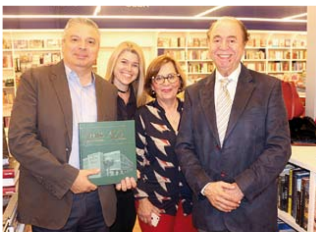
Evento contou com presenças de ex-alunos e docentes da FMABC