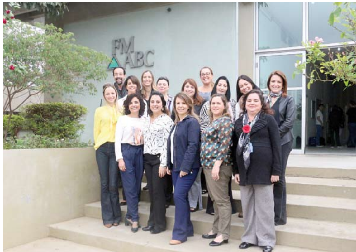
Grupo de professores do curso de Enfermagem do Centro Universitário Saúde ABC

“O projeto pedagógico do curso de Enfermagem da FMABC busca capacitar o aluno para atuar em todas as dimensões do cuidar, inclusive nas