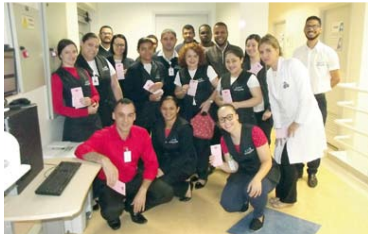
Setembro Vermelho alerta para prevenção de doenças do coração