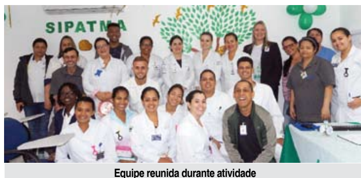
Equipe reunida durante atividade

A Comissão Interna de Prevenção de Acidentes (CIPA) do Instituto de Infectologia Emílio Ribas II do Guarujá realizou entre 9 e 13 de setembro a Semana Interna de Prevenção de Acidentes do Trabalho e Meio Ambiente (SIPATMA). Foram promovidas palestras sobre prevenção de acidentes, Infecções Sexualmente Transmissíveis (ISTs), primeiros socorros, higiene das mãos, reciclagem, meio ambiente e ergonomia. O objetivo foi