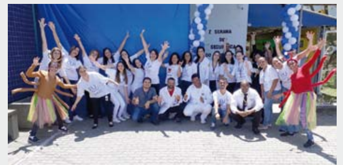
Em Guarulhos, foi realizada a I Semana de Segurança do Paciente

Funcionários do Pronto Atendimento Maria Dirce, em Guarulhos, e do Ambulatório Médico de Especialidades (AME) de Mauá organizaram campanhas sobre a segurança do paciente, em alusão ao Dia Mundial da Segurança do Paciente (17 de setembro). Em Guarulhos, a equipe organizou a ação entre 1 e 4 de outubro. O objetivo foi promover a segurança do paciente por meio do conhecimento técnico e sensibilização dos colaboradores para as práticas seguras no atendimento ao paciente.