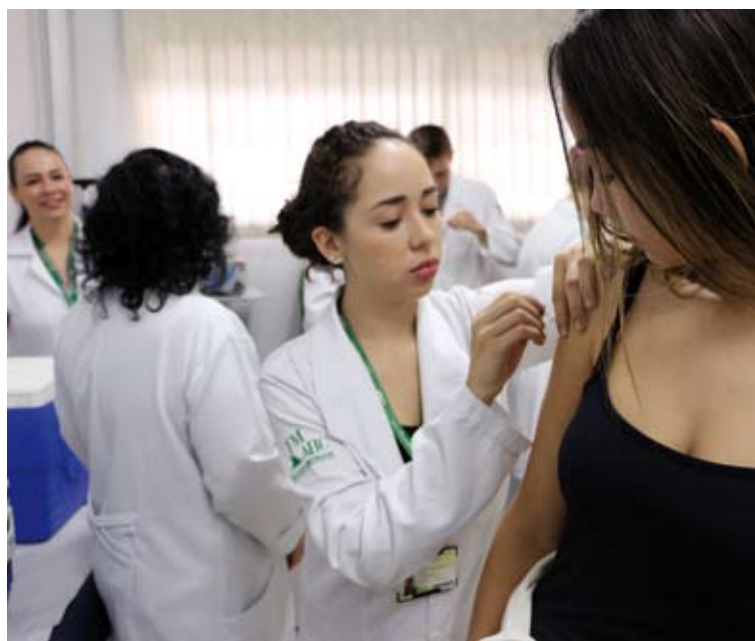
Estudantes integram diversas campanhas de promoção à saúde

de série que acompanham as necessidades das turmas. Procuramos estimular a criatividade e a autonomia dos estudantes, incentivar a pesquisa, a promoção à saúde e o desen-