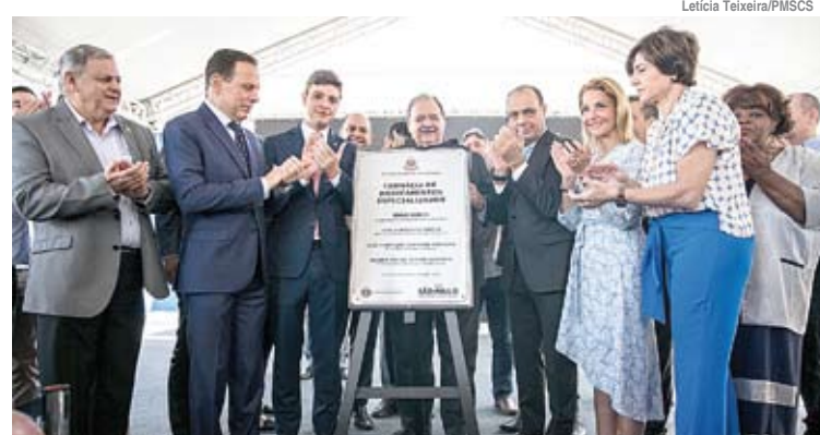
Evento de entrega contou com autoridades municipais e estaduais

O investimento do Governo do Estado foi de R$ 150 mil. Ainda serão re-