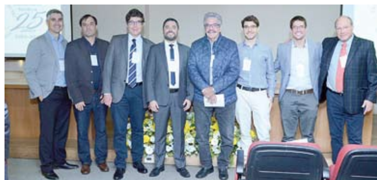
Docentes e convidados durante encontro científico

Duas personalidades receberam homenagens durante o evento. O primeiro residente em Urologia da FMABC e con-