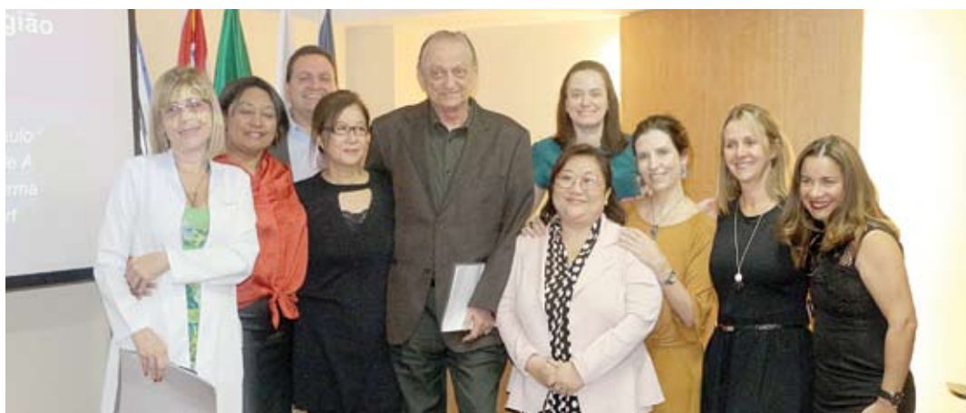
Equipe organizadora do evento e convidados externos

A disciplina de Dermatologia do Centro Universitário Saúde ABC / Faculdade de Medicina do ABC (FMABC) organizou dia 4 de outubro uma capacitação para médicos da rede pública do Grande ABC, com foco na importância da prescrição médica e das boas práticas de dispensação e armazenamento de medicamentos imunobiológicos. O evento teve apoio de três indústrias farmacêuticas. A abertura foi realizada pela professora da disciplina