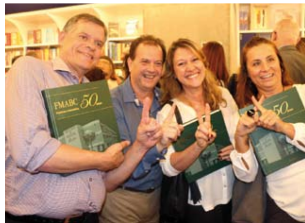
Fatos marcantes, bastidores e fotos célebres dão o tom da publicação