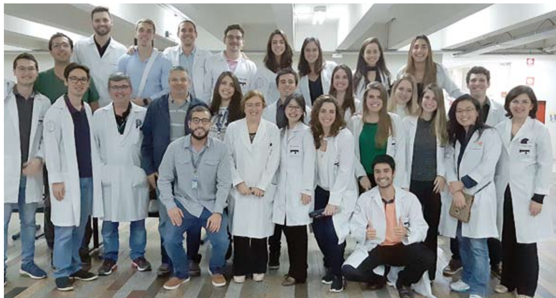
Equipe da Oftalmo ABC responsável pelos atendimentos

Prefeitura de Santo André e disciplina de Oftalmologia ocorreu no final de 2018,