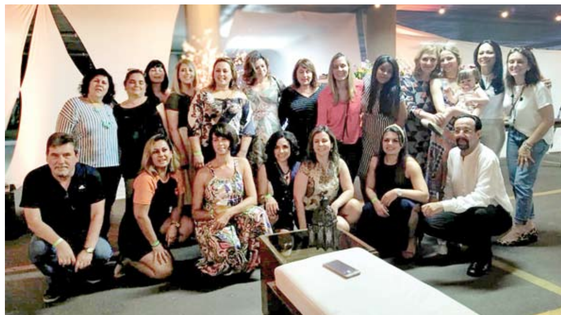
Docentes e convidados durante festa pelos 20 anos da Enfermagem