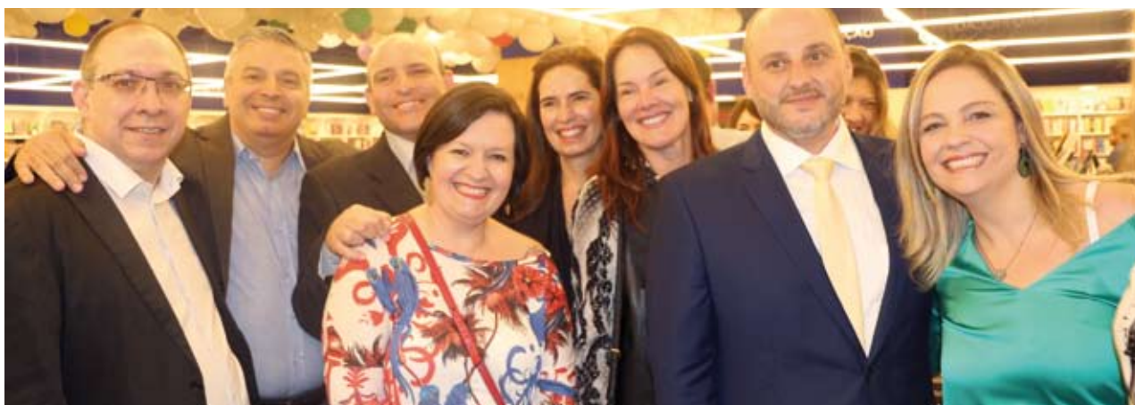
Lançamento de "FMABC 50 anos: Histórias e Memórias" reuniu centenas de convidados ilustres