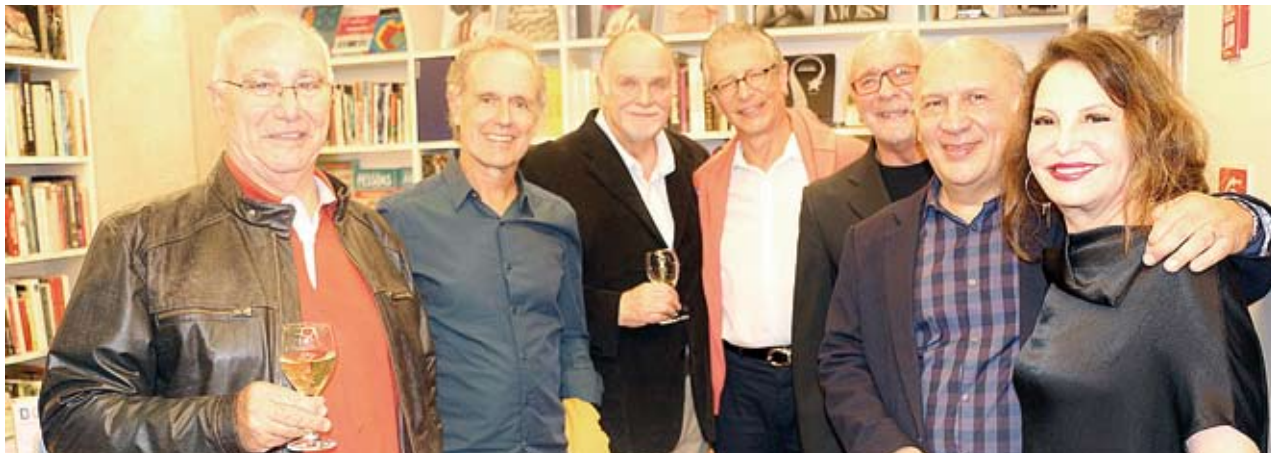
Festividade contou com coquetel para todos os presentes