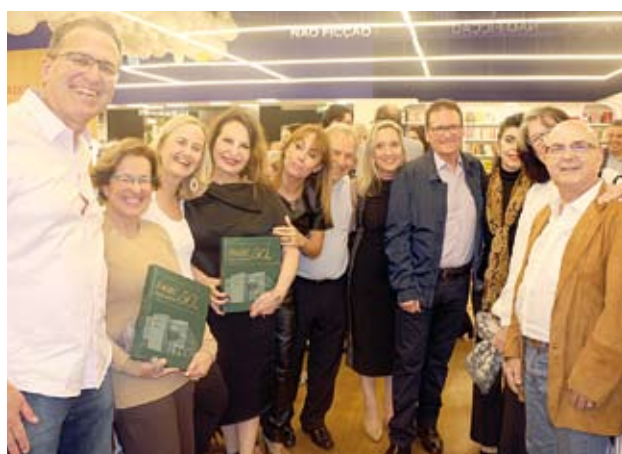
Convidados adquiriram o livro na entrada do evento