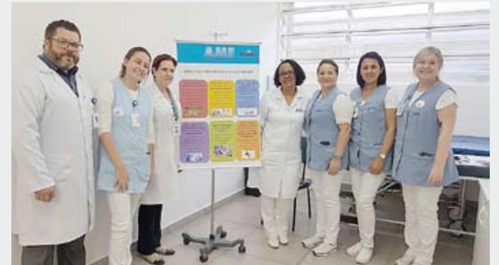
AME de Mauá expôs banners em locais estratégicos