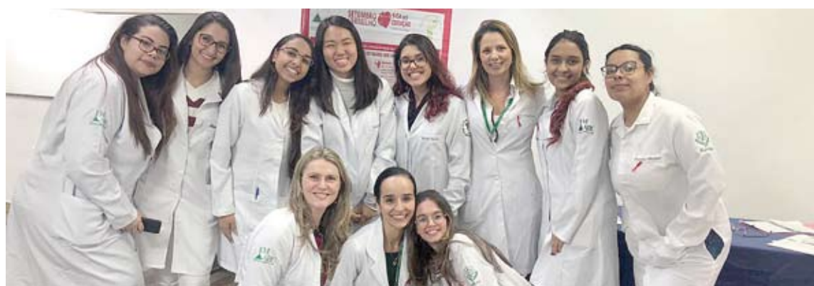
Equipe ministrou palestras e atendimento ao público

Foram disponibilizados serviços como medição de pressão arterial, testes de gli-