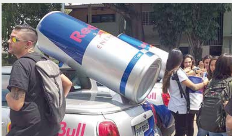
Programação teve parceria com a Red Bull e distribuição de energéticos

Já durante a semana os calouros conheceram detalhes do projeto Rondon — iniciativa de promoção à saúde, desenvolvimento social e