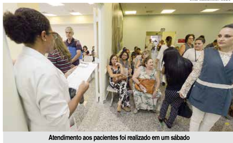
Atendimento aos pacientes foi realizado em um sábado

O HC realiza procedimentos em cardiologia, neurologias de urgência, cirurgias de politrauma, cirurgias ortopédicas e outras especialidades clí-