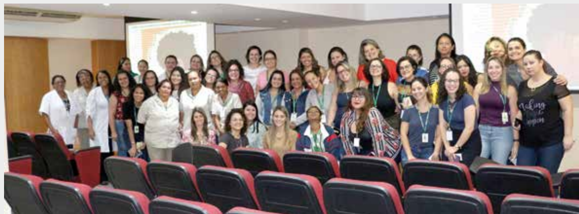
Evento reuniu funcionárias da FMABC, FUABC e Central de Convênios

ídos cartões para que cada colaboradora indicasse o nome de alguma colega de trabalho que a inspirasse e o motivo. Todos os cartões foram depositados em uma urna disponibilizada no anfiteatro e serão expostos junto à foto oficial do evento no corredor do Prédio Administrativo da FMABC.