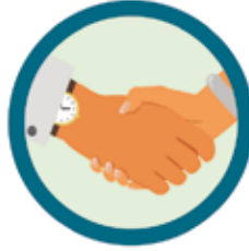
CONTATO FÍSICO COM PESSOA INFECTADA