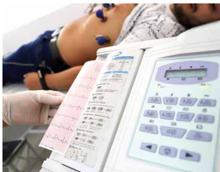
Atendimento foi exclusivo para 200 pacientes previamente agendados

A Secretaria de Saúde de São Caetano do Sul tem cumprido o papel de reduzir a espera pelos atendimentos – em algumas especialidades zerando a demanda reprimida. Seguindo esta estratégia, dia 7 de março foi realizado o mutirão de cardiologia, na UBS (Unidade Básica de Saúde) Nair Spina Benedicts, no bairro Oswaldo Cruz.