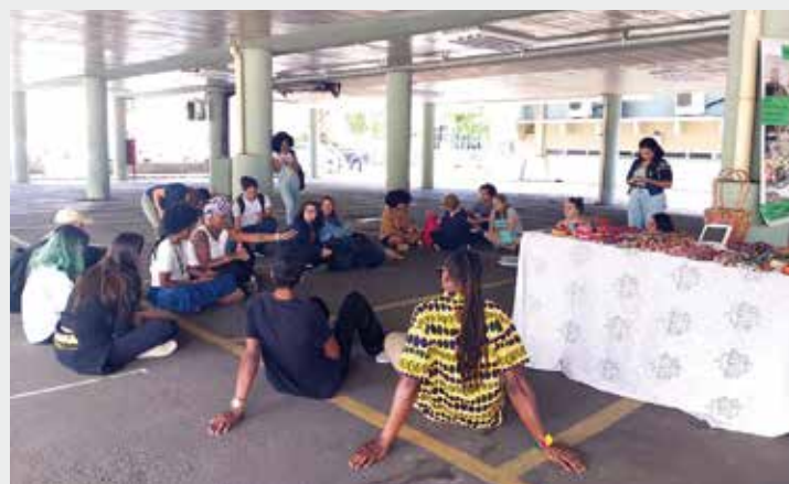
Novos alunos participaram de apresentação de sarau e poesia no estacionamento

(SIECS) e do Congresso Médico Universitário do ABC (Comuabc), eventos científicos da FMABC.