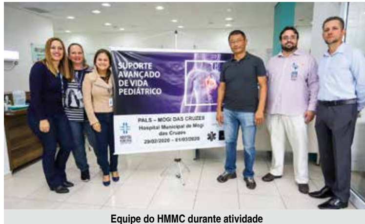
Equipe do HMMC durante atividade

O Pronto Atendimento Infantil 24 horas do Hospital Municipal atende demanda espontânea e é referência no atendimento de crianças com patologias diversas e diferentes emergências pediátricas. “Nossos