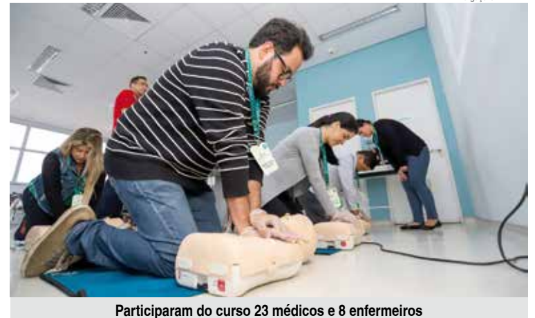
Participaram do curso 23 médicos e 8 enfermeiros

O curso tem como objetivos principais reconhecer crianças em risco de parada cardiorrespiratória; enfatizar as condutas médicas necessárias para prevenir a parada cardiorrespiratória;