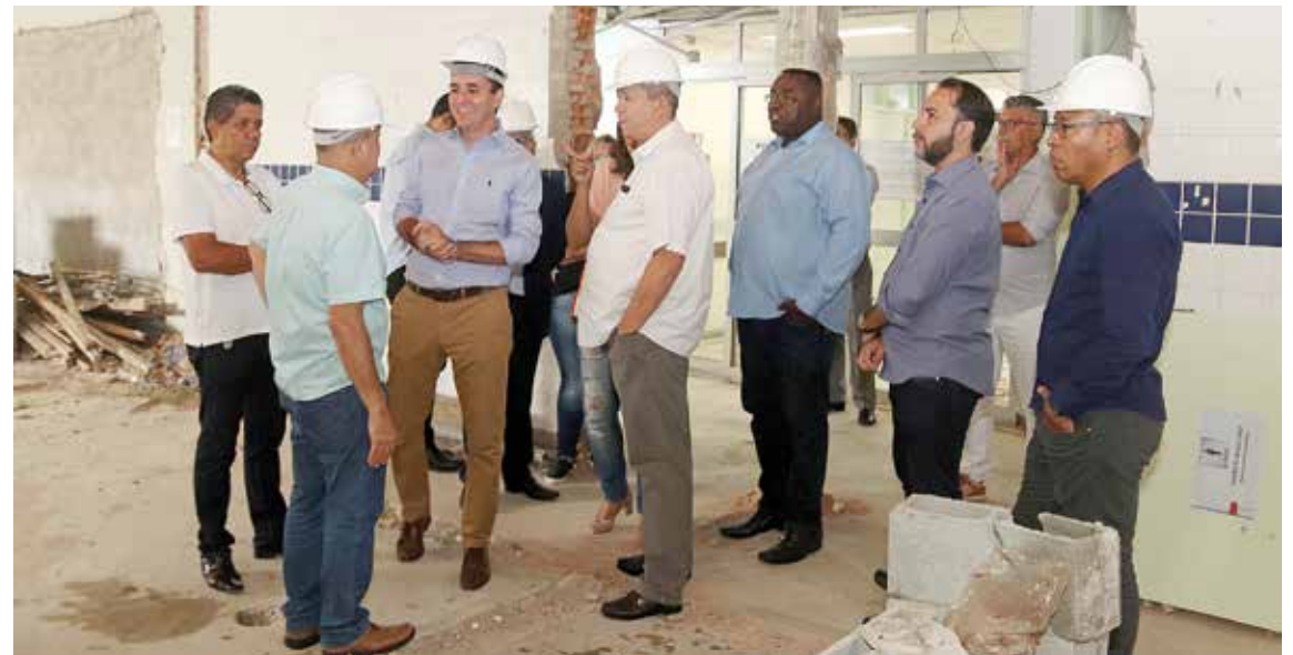
Unidade terá capacidade para realizar 22 mil atendimentos por mês

“Com a reforma vamos melhorar sensivelmente a estrutura de emergência e a questão de estabilização na sala amarela. O grande diferencial será toda a estrutura de internação tanto na ala vermelha, quanto na ala amarela de pediatria, que antes não existia. São mudanças importantes que vão oferecer melhor atendimento e conforto para a população”, afirmou o secretário