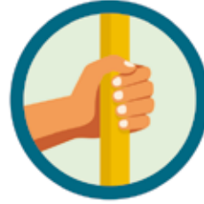
CONTATO COM SUPERFÍCIES CONTAMINADAS