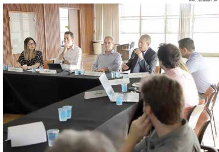
Santo André anuncia medidas de prevenção à doença