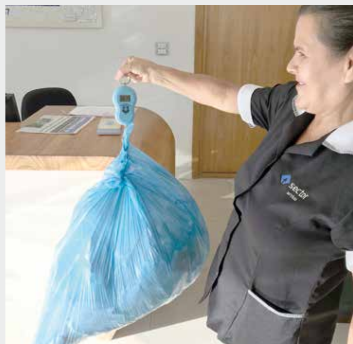
Pesagem é realizada diariamente por equipe responsável pela higienização

Entre os principais benefícios da iniciativa está a redução da contaminação do solo e do ar, o prolongamento da vida útil dos aterros sanitários, o estímulo à geração de empregos e a melhoria da limpeza urbana. Mais informações pelo e-mail sustentabilidade@fuabc.org.br ou telefone (11) 2666-5433.