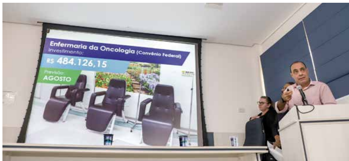
Prefeito convocou coletiva de imprensa para anunciar melhorias

outros R$ 3 milhões em obras para a modernização do Complexo Hospitalar. Já foram construídos o Centro