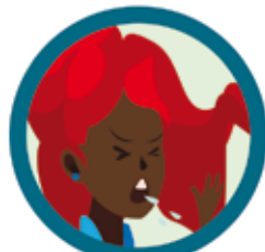
GOTÍCULAS DE SALIVA