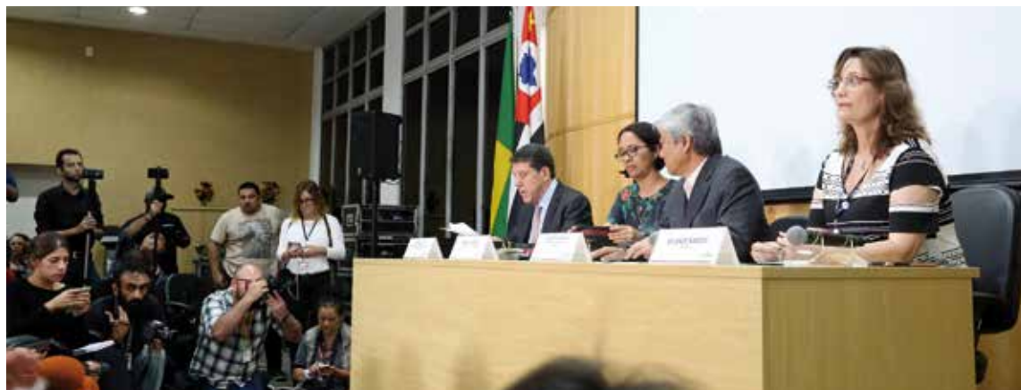
Anúncio da criação do comitê foi realizado dia 26 de fevereiro

As secretarias de Saúde do Estado e da Prefeitura de São Paulo estão monitorando as pessoas que tiveram contato com pacientes infectados. Todas as ações e medidas seguem protocolos do Ministério da Saúde e da Organização Mundial da Saúde. O site www.saude.gov.br/coronavirus concentra as informações atualizadas sobre o tema.