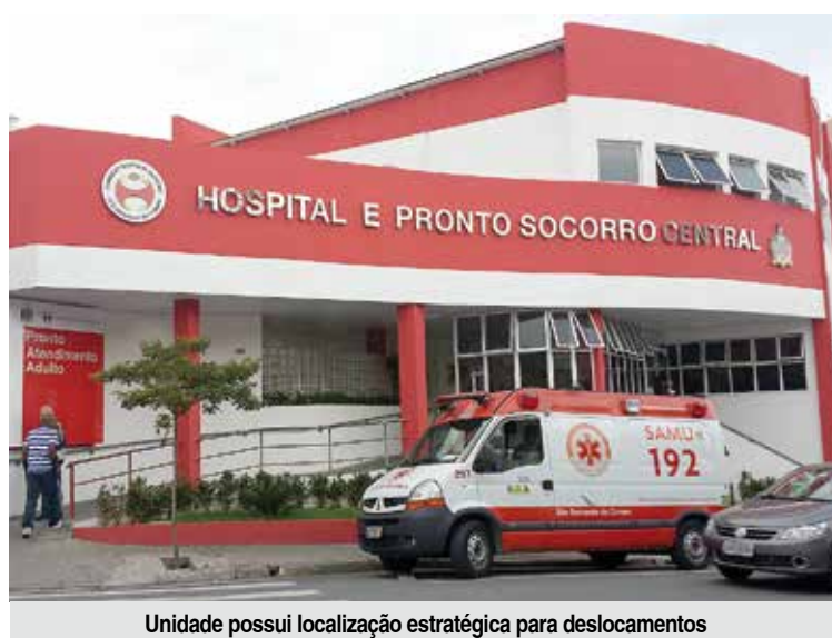
Unidade possui localização estratégica para deslocamentos

De acordo com o Plano de Ação Regional para Acidente Escorpiônico, a região foi classificada como área