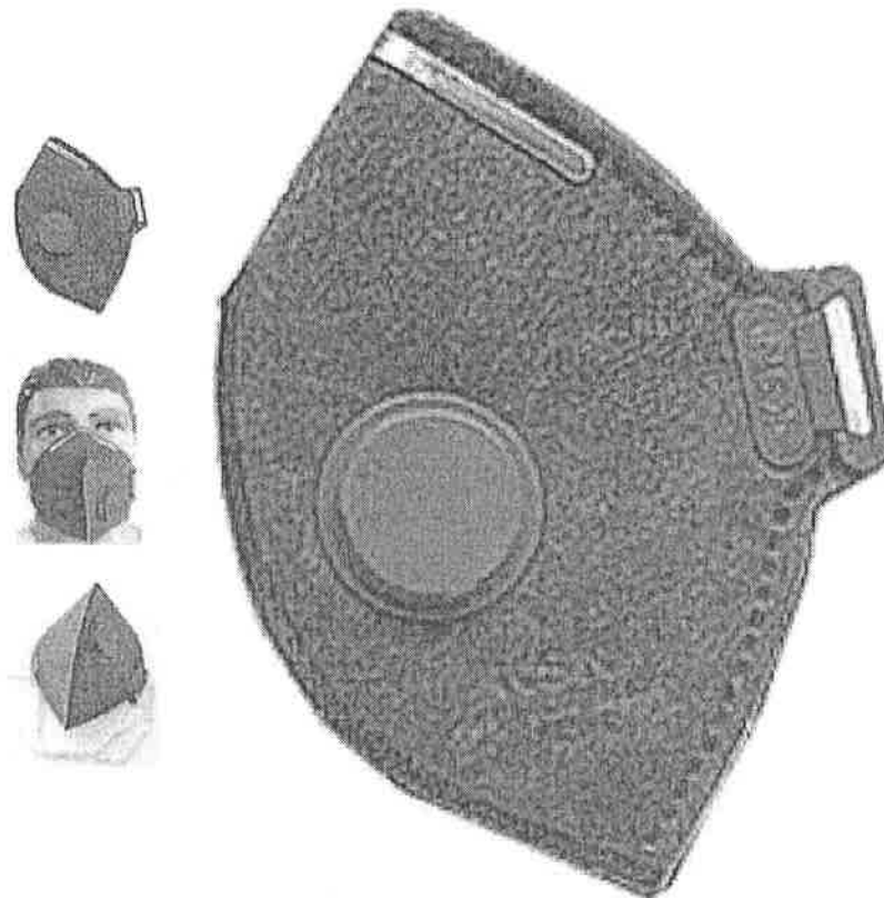
Máscara PFF2 com Filtro KSN CA 10578 R$ 5.99 cada

Máscara PFF ksn oferece o mais alto nível de NIOSH eficiência de filtração nominal em um respirador sem manutenção. máscara facial naturalmente contornada com flange nariz de espuma alivia pontos de pressão, estão disponíveis em uma versão com válvula para reduzir a acumulação de calor no interior da máscara para uma maior aceitação do trabalhador. Oferece proteção contra a toxicidade de aerossóis sólidos e líquidos não-tóxicos e-to-médla baixa (por exemplo, óleo-névoas). Camadas internas e externas de não-tecido protegem o filtro mantendo suas fibras no interior do respirador, aumentando a durabilidade e evitando que as fibras se soltem gerando desconforto. Essas camadas de não tecido são finas e facilitam a respiração, exigindo menor esforço do usuário.