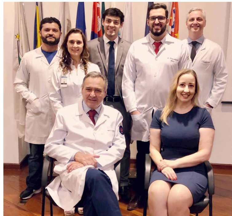
Equipe do Hospital Estadual Mário Covas e Centro Universitário FMABC