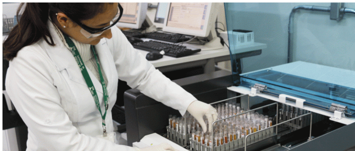
Criado em 1997, o CEP da FMABC avalia e acompanha aspectos éticos de todas as pesquisas que envolvem seres humanos

O sistema CEP-CONEP foi instituído em 1996 para proceder a análise ética dos projetos de pesquisa envolvendo seres humanos no Brasil. Este processo é baseado em uma série de resoluções e normativas deliberadas pelo Conselho