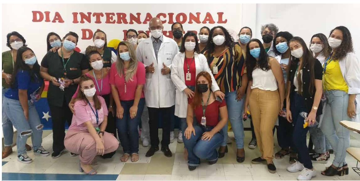
Evento foi realizado em quatro datas no auditório da unidade