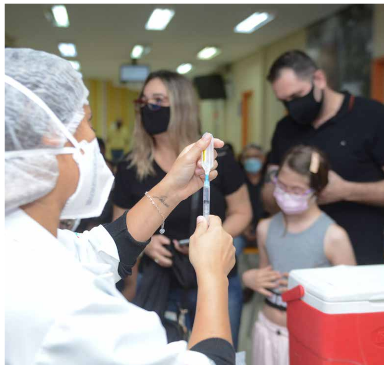
Município deve levar comprovante das vacinas anteriores