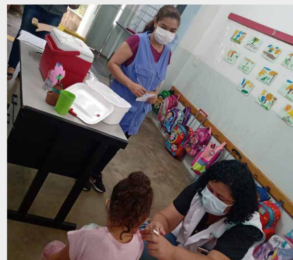
Cidade alcançou 85% das crianças vacinadas com a 1ª dose

“Estamos sendo bem cautelosos, devido à especificidade da atenção na vacinação infantil. Dia 10 de março atingimos 85% das crianças de Itatiba vacinadas com a primeira dose. A FUABC exerce papel essencial com seus profissionais