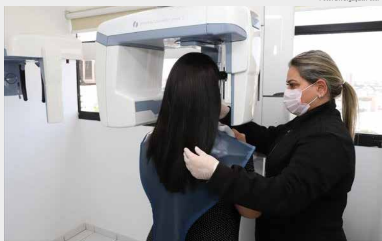
Podem ter acesso ao serviço os pacientes com indicação de dentista da rede pública

A medida integra o programa 'Mauá Sorridente', que vem retomando o atendimento em saúde bucal