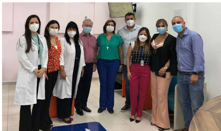
Equipe da FUABC em visita ao Hospital Municipal de Mogi das Cruzes