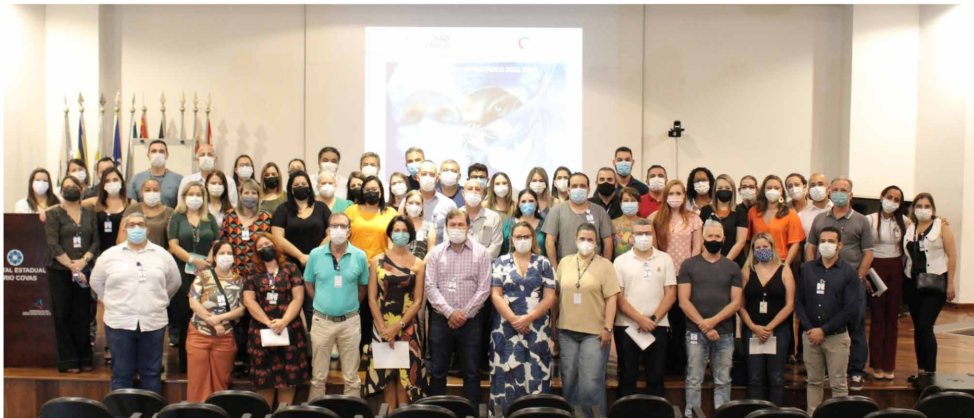
Evento foi realizado dia 19 de fevereiro e reuniu membros da diretoria, gerentes, coordenadores e supervisores

Unidade é referência na assistência de alta complexidade para municípios do Grande ABC