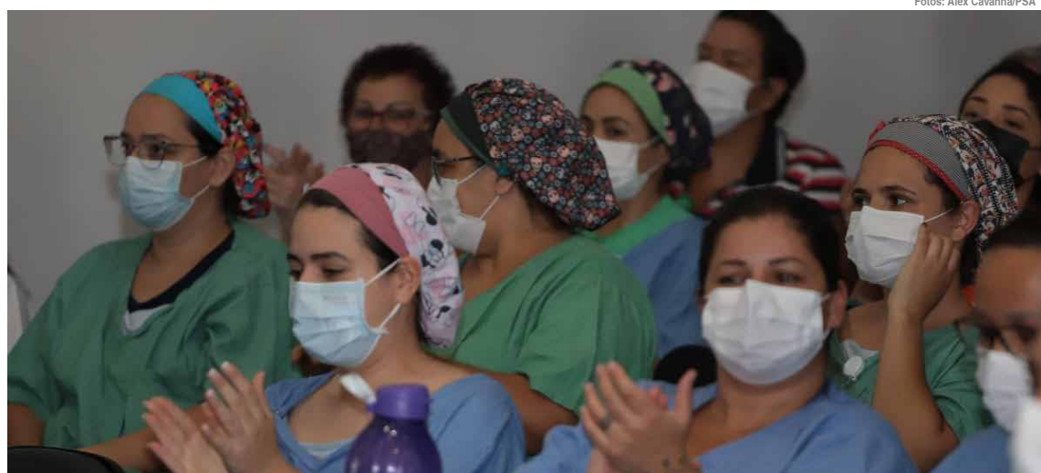
Ao todo, cerca de 100 pessoas estiveram presentes na ação