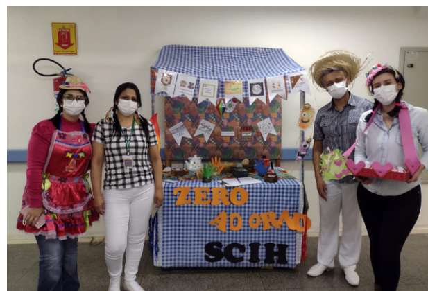
Festa junina foi tema da campanha

Outro treinamento realizado em julho, no auditório da