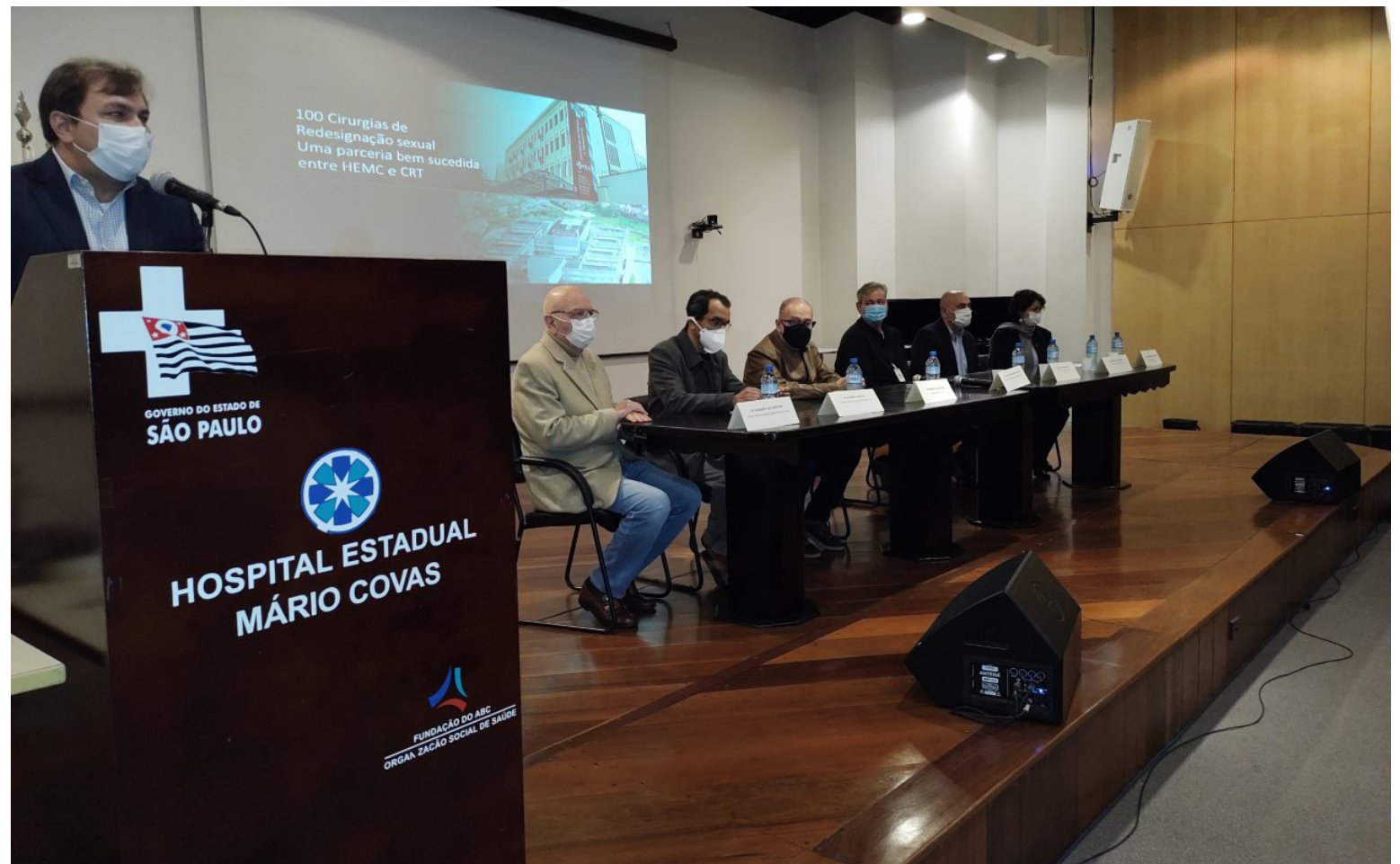
Solenidade reuniu mais de 150 pessoas no auditório da unidade