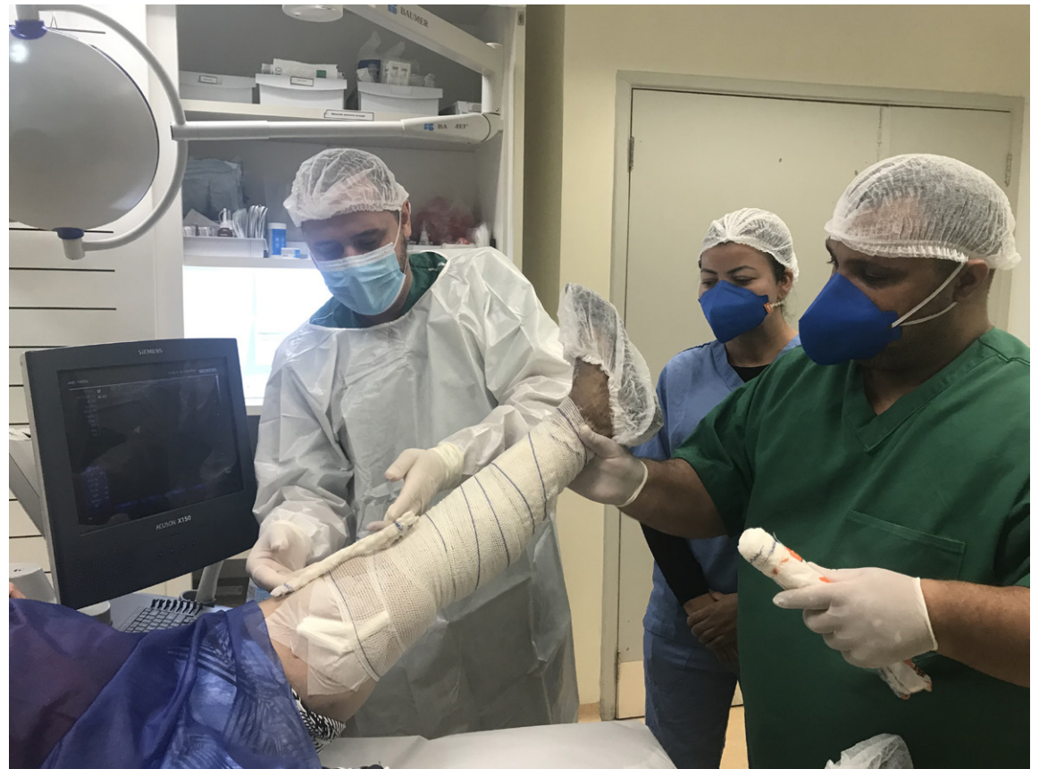
Técnica de escleroterapia com espuma é indicada para tratamento de varizes

A técnica de escleroterapia, feita através de punção guiada por ultrassonografia, consiste em injetar nas veias medicamento em forma de espuma, capaz de secar os vasos com má circulação do sangue. Essa solução faz com que a veia inflame e feche, o que obriga o sangue a se redirecionar para veias saudáveis. Trata-se de um procedimento minimamente invasivo e utilizado no tratamento de veias varicosas e úlceras venosas.