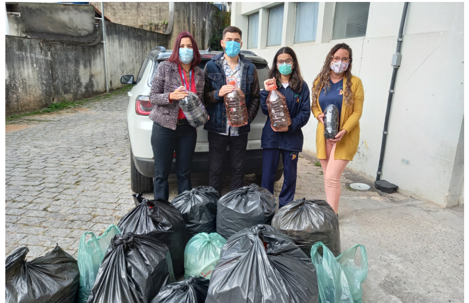
Doações foram recebidas do Colégio Gênesis Life, de Osasco

O plástico não é um material biodegradável e seu descarte inadequado causa inúmeras consequências maléficas ao meio ambiente. Dependendo de sua composição, o material pode demorar entre 100 e 450 anos para se decompor.