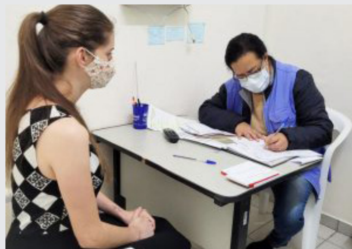
Ao todo, foram realizadas 90 consultas médicas em 11 unidades de saúde

Ao todo, foram realizadas 90 consultas médicas, 64 aferições de pressão arterial, 27 testes glicêmicos, 15 pedidos de mamografia, 27 testes rápidos de HIV e sífilis, 690 aplicações de vacinas (contra a gripe e Covid-19), além de 130 coletas de exames de Papanicolaou e uma triagem oftalmológica. Participaram da ação 19 unidades de Saúde do município.