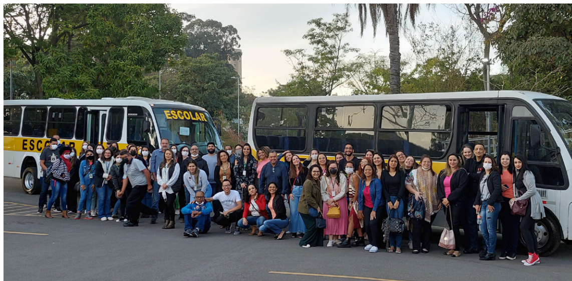
Colaboradores reunidos no campus universitário da FMABC, em Santo André

Atividade em 16 de julho reuniu cerca de 300 colaboradores de 12 unidades da Fundação do ABC