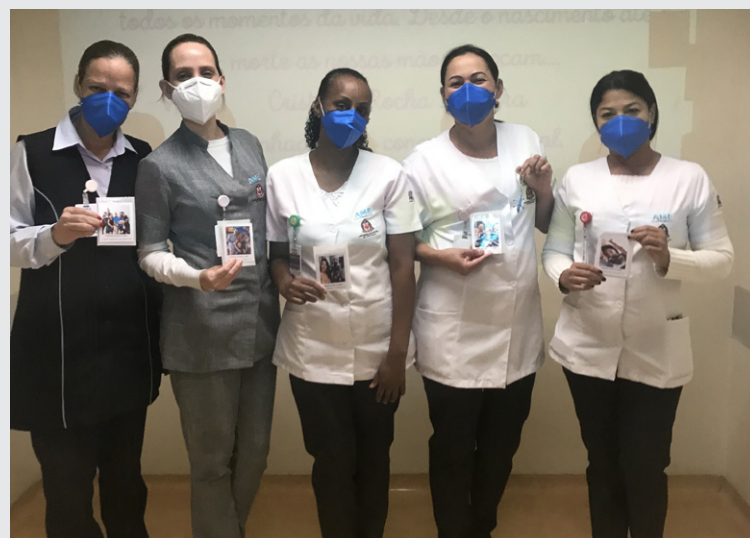
Integração entre colaboradores teve concurso de frases, palestras e café da manhã

a unidade organizou um café da manhã para os colaboradores e abriu um espaço chamado “Sala das Sensações”. O foco é enfatizar a importância e o valor dos sentidos, como sentir aromas de perfumes, ouvir música, saborear alimentos, poder enxergar, tocar e realçar de que forma os sentidos podem trazer sensações boas, como gratidão e alegria. O espaço contava com música ambiente, difusor de essências e fotos-lembranças suspensas no teto da sala. Todos os profissionais que passaram pelo local puderam procurar suas fotos e retirar a sua lembrança.