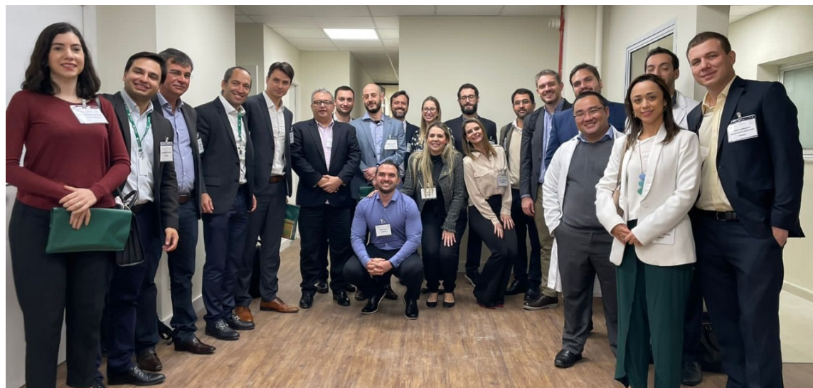
Equipe da Urologia da FMABC e integrantes do projeto

mostrado pacientes com mais chances de sobreviver ao tratamento, que chegam com melhores condições para