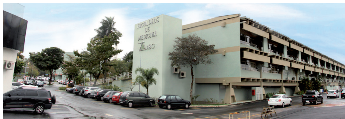
Trabalho foi realizado por pesquisadores da FMABC e da Irlanda

“A graduação no Brasil geralmente é concluída no final do ano, e na Europa é concluída no primeiro se-