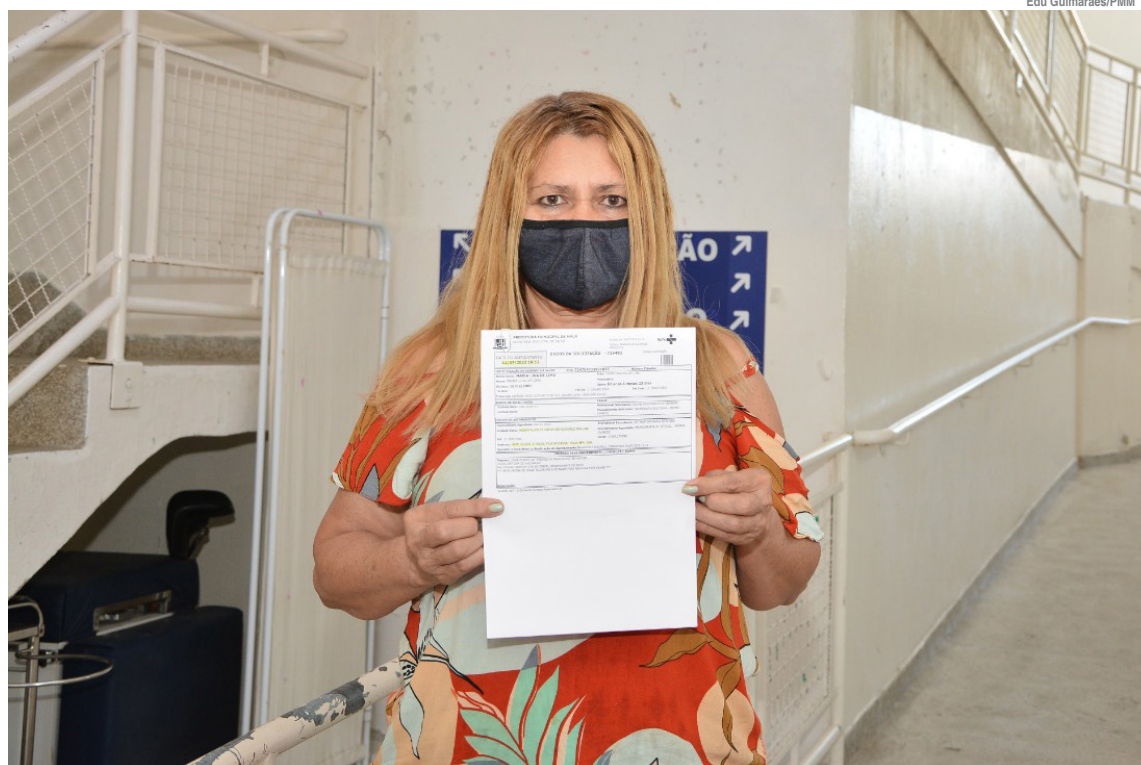
Quase 90% dos exames, ou seja, 4.621 deles, foram feitos na cidade

A mamografia é utilizada para identificar lesões e nódulos e diagnosticar precocemente o câncer de mama, o mais comum entre as mulheres brasileiras.