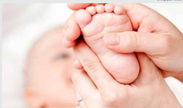
Doença rara e hereditária atinge cerca de um em cada 10 mil bebês

O médico explica, ainda, que o tratamento é relativamente simples, baseado em uma dieta apontada por