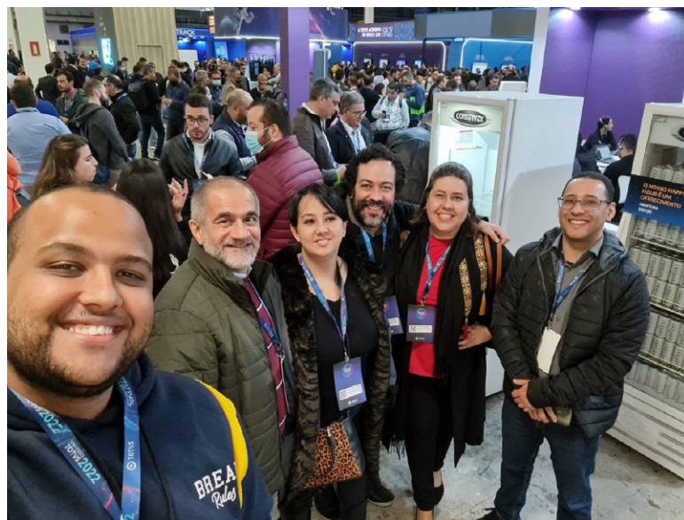
Colaboradores das áreas Financeira e de Tecnologia da Informação da FUABC

Em busca de inovação e conhecimento, a equipe técnica da FUABC