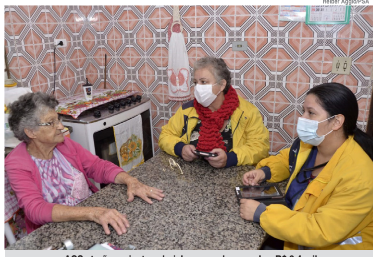
ACSs terão reajuste salarial, passando a receber R$ 2,4 mil

Atualmente o salário do Agente Comunitário de Saúde é de R$ 1.400 e a categoria terá reajuste salarial, passando a receber R$ 2.424,00. Os candidatos que passarem no processo de seleção já receberão o salário reajustado. Para mais informações, o edital está disponível em www.gsaconcursos.com.br ou www.fuabc.org.br .