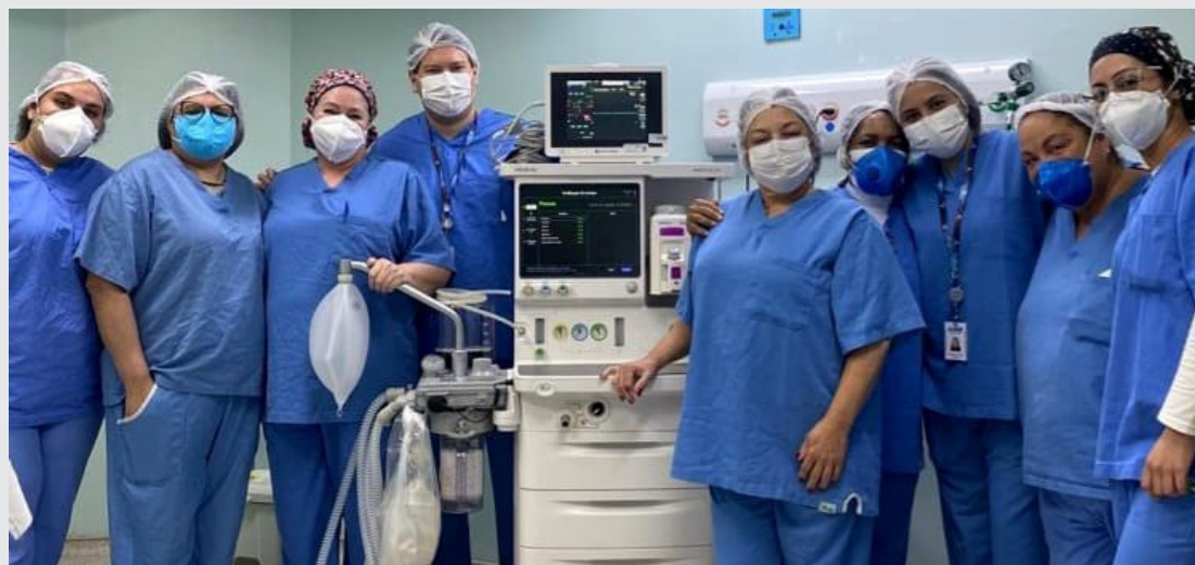
Equipe do AME-SA junto ao novo equipamento

Vocacionado ao atendimento ambulatorial em diversas especialidades e referência para munícipes de todo o Grande ABC, o AME-SA oferta exames e cirurgias de baixa e média complexidade para pacientes do Sistema Único de Saúde (SUS). Em 2022, a unidade já realizou cerca de 28 mil procedimentos.