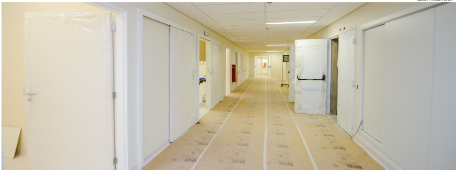
Novas instalações terão 42 leitos a mais do que no HMU, totalizando 170

A fusão das unidades, hoje em funcionamento no Rudge Ramos, e a nova localização, no Centro, vão facilitar o acesso aos tratamentos de todas as mulheres, gestantes e puérperas, em um único local. Além disso, haverá ampliação da capacidade dos leitos, totalizando 170, e oferta de serviços como o pronto atendimento de ginecologia e obstetrícia, centro cirúrgico, ambulatorios, unidade de terapia intensiva obstétrica, ginecológica e neonatal, casa da gestante, núcleo interno de regulação e estrutura para realização de exames laboratoriais (tomografia, mamografia, ecocardiograma, ultrassonografia, entre outros).