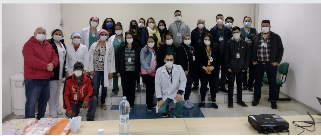
Capacitação foi destinada às equipes multidisciplinares do Hospital Nardini

Dia 27 de junho, outro treinamento foi ministrado em parceria com o NE-PEP, desta vez destinado ao Serviço de Nutrição e Dietética (SND) da unidade. O tema foi “Orientação dos padrões de dietas e a importância da prescrição médica correta”. Foram abordados assuntos como prescrição médica; dietoterapia; tipos de dietas; restrições alimentares e