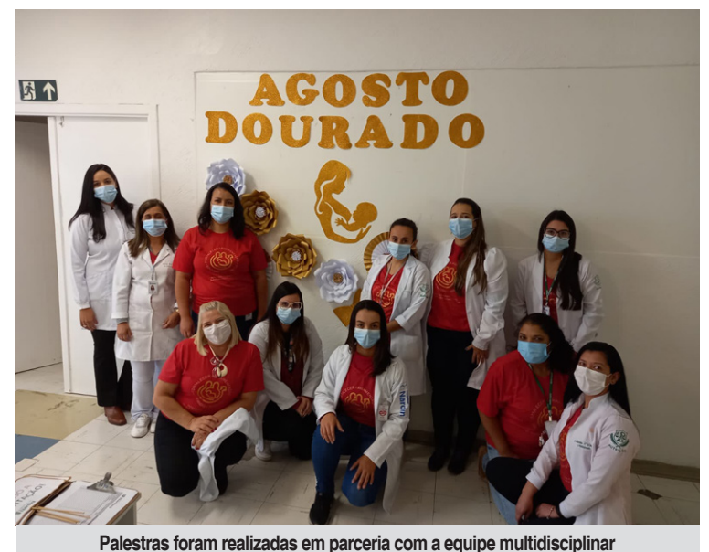
Palestras foram realizadas em parceria com a equipe multidisciplinar

Participaram como convidados do evento a neonatologista e coordenadora do Centro de Referência do Banco de Leite Humano do Hos-