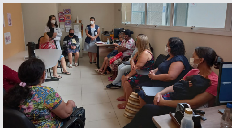
Ao todo, 12 pacientes participaram da ação

Dia 8 de julho, na unidade Estratégia de Saúde da Família (ESF) do bairro São Francisco, também gerenciada pela FUABC, teve início