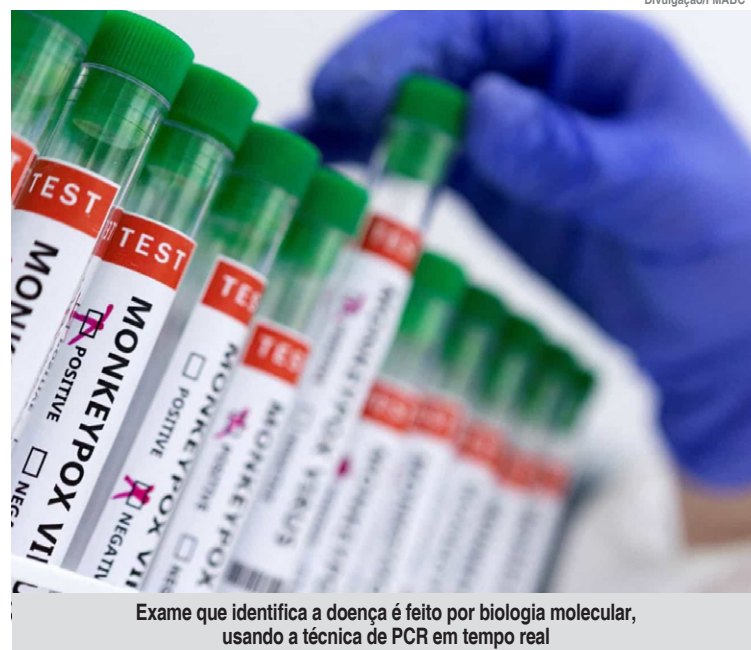
Exame que identifica a doença é feito por biologia molecular, usando a técnica de PCR em tempo real