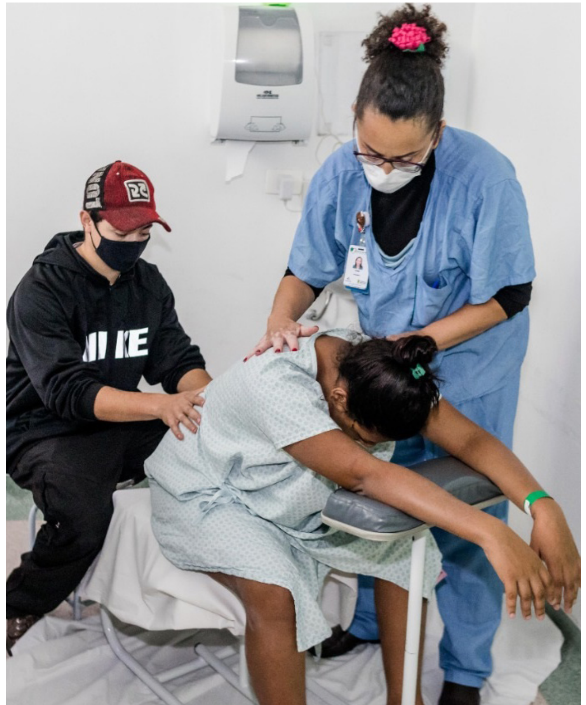
Unidade proporciona assistência integral à gestante e bebê

No Hospital da Mulher a gestante escolhe as músicas que serão reproduzidas durante o trabalho de parto, tendo uma experiência personalizada e agradável.