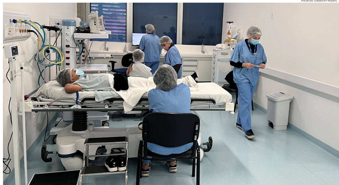
Unidade serve de retaguarda para toda a rede de Urgência e Emergência do município

Além do tratamento humanizado dos pacientes que ingressam no Hospital de Urgência, a equipe de farmacêuticos do Serviço de Farmácia Clínica desenvolveu um protocolo para promover a segurança na terapia medicamentosa domiciliar. Por meio de recursos lúdicos, tanto o responsável