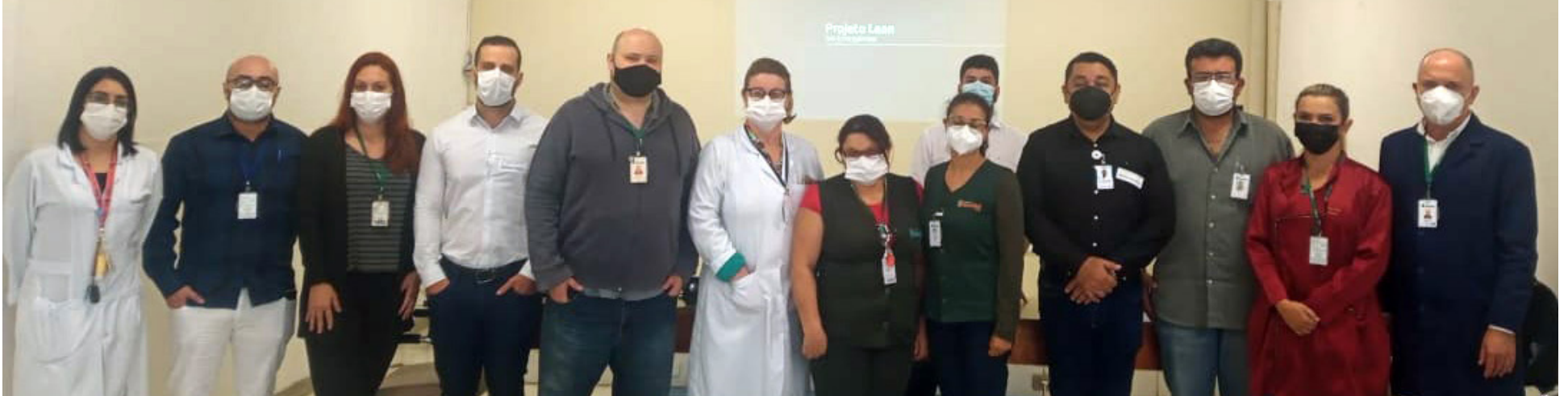
Participaram da ação colaboradores das áreas administrativa e assistencial

Unidade é uma das 39 instituições selecionadas para participar do sexto ciclo do projeto nacional