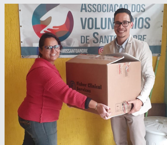
Entrega à Associação dos Voluntários de Santo André

Em 2021, a campanha do agasalho “Aquecendo o ABC” arrecadou entre 6 e 21 de julho 316 itens como casacos, cobertores, calças, meias e luvas que foram entregues a três entidades beneficentes da região. Em Santo André, receberam os donativos a Instituição Assistencial Lídia Pollone (IALP); em São Bernardo, o Exército da Salvação; e, em São Caetano, a Associação Esportiva Vida em Movimento.