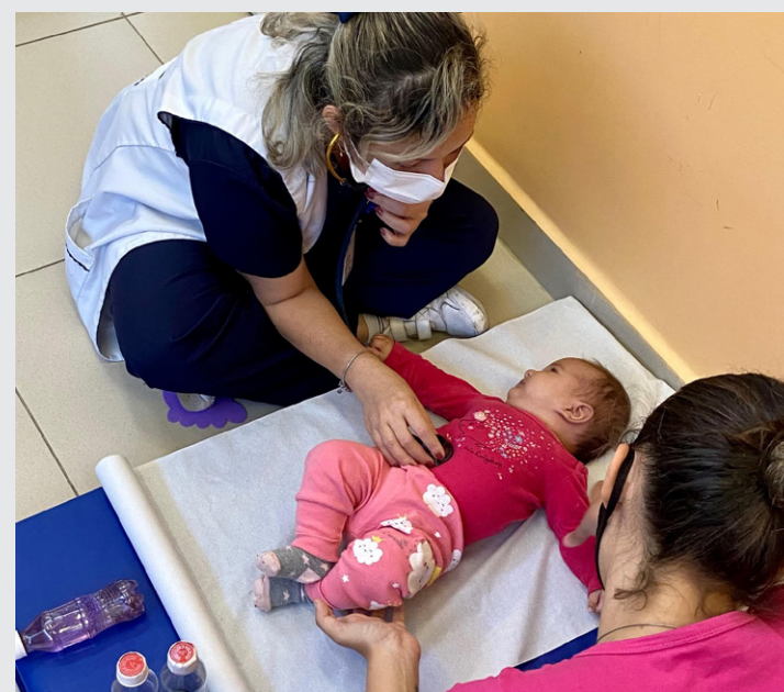
Na Pediatria, a puericultura é a área dedicada à promoção da saúde da criança e do adolescente

comunitárias de saúde, sem redução da disponibilidade das consultas clínicas. A realização de grupos de puericultura multidisciplinar tem potencial de melhorar os indicadores de saúde na comunidade local e estimular a criação de vínculos com a equipe de referência, além de contribuir para que as crianças percam o “medo” dos profissionais de saúde durante as avaliações.