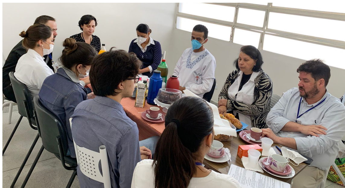
Encontro entre gestores e colaboradores ocorre mensalmente

“É um momento em que nos aproximamos e ouvimos as deman-