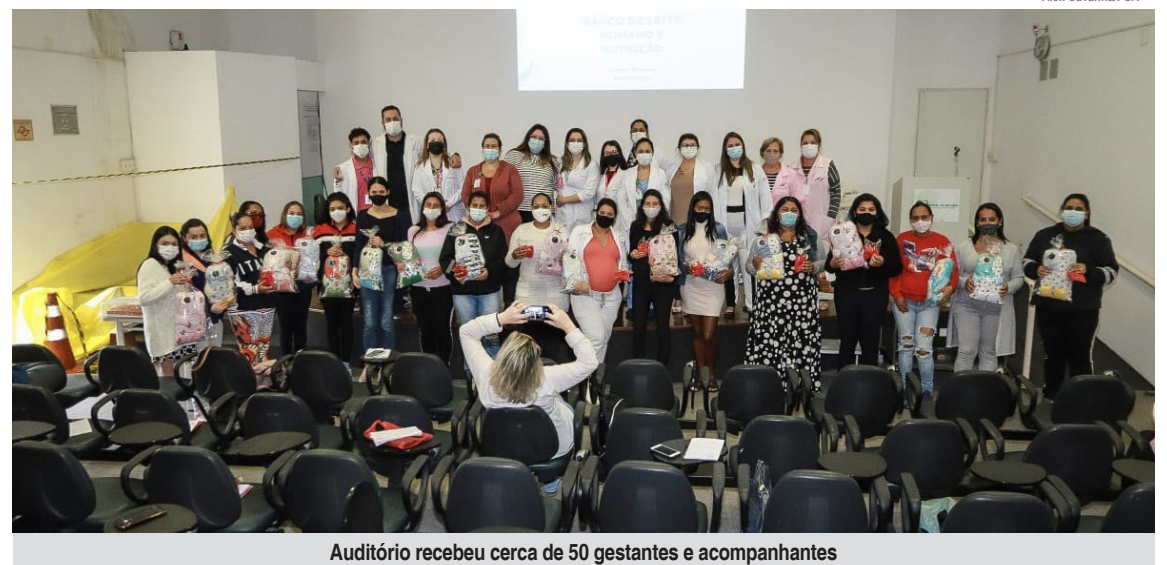
Auditório recebeu cerca de 50 gestantes e acompanhantes

No dia do curso também é oferecida visita à maternidade e ao Centro de Parto Normal do Hospital da Mulher.