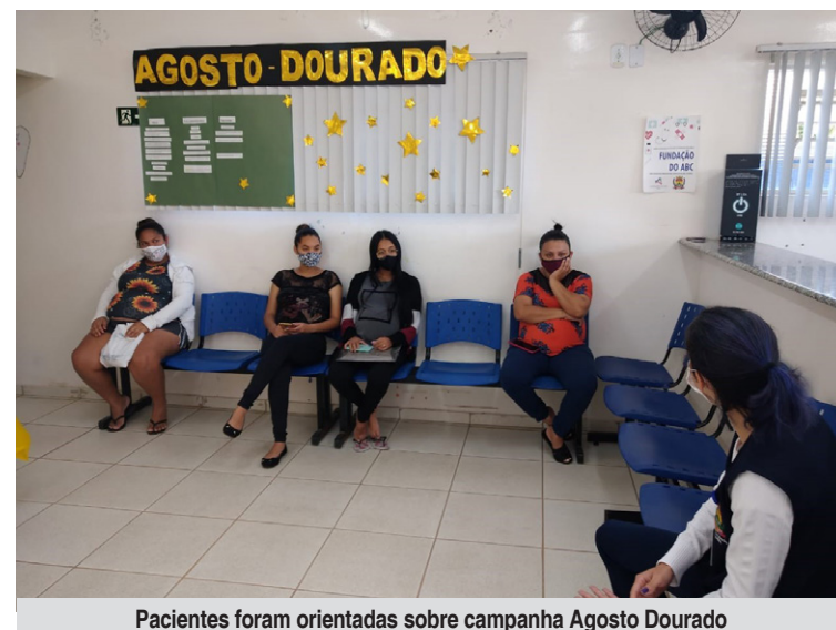
Pacientes foram orientadas sobre campanha Agosto Dourado