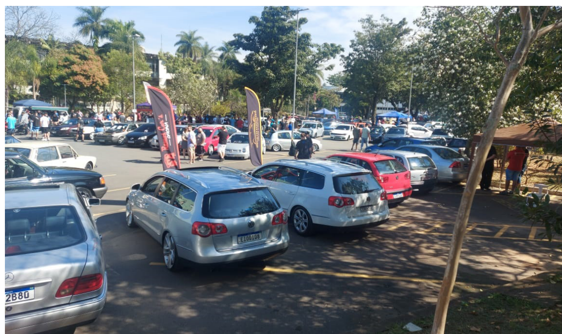
Evento foi organizado no estacionamento do campus universitário