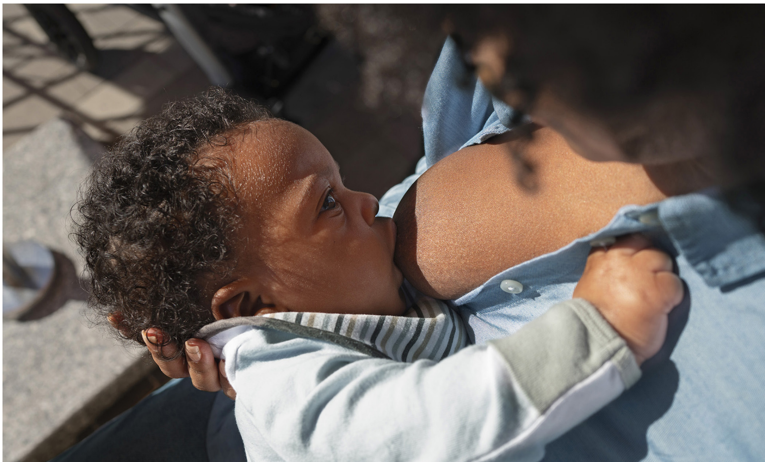
Leite materno é essencial para a saúde das crianças nos seis primeiros meses de vida como alimento exclusivo

"O leite materno é essencial para a saúde das crianças nos seis primeiros meses de vida como alimento exclusivo. Isso porque é um alimento completo, fornecendo nutrientes em quantidades adequadas, vitaminas e componentes para hidratação (água). Também reúne fatores de proteção, como anticorpos, leucócitos (glóbulos brancos) e outras importantes células de defesa. É isento de contaminação e perfeitamente adaptado ao metabolismo da criança", detalha a pediatra especialista em aleitamento materno e neonatologista do Centro Universitário Faculdade de Medicina do ABC