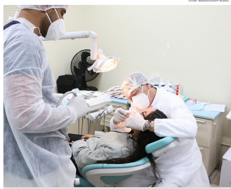
Objetivo é realizar mais de 3 mil procedimentos até setembro

Dia 8 de agosto teve início também, nas 33 Unidades Básicas de Saúde (UBS), a Campanha de Multivacinação e Poliomielite. A multivacinação ocorre de forma seletiva, ou seja, para atualização da carteira de vacinação de crianças e adolescentes menores de 15 anos, com oferta doses contra a tuberculose, hepatites A e B, rotavírus, difteria, tétano, coqueluche, caxumba, sarampo, febre amarela, varicela e HPV. Contra a poliomielite, podem ser vacinar crianças de 1 a 4 anos, de forma indiscriminada. O Dia D está previsto para 20 de agosto, com todas as UBSs abertas das 8h às 17h.