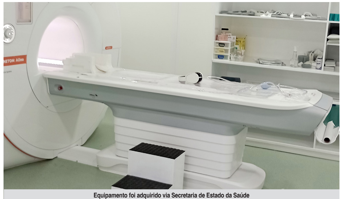
Equipamento foi adquirido via Secretaria de Estado da Saúde

A antiga ressonância magnética do HEMC estava em funcionamento desde a inauguração da unidade, em 2001. Com 21 anos de uso, o equipamento apresentava diversas limitações e a necessidade de constantes reparos e trocas de peças. Em meados de 2021, o aparelho operava parcialmente. Mesmo após amplo trabalho de recuperação, não retornou à plena capacidade, incapaz de realizar determinados exames em articulações, por exemplo.