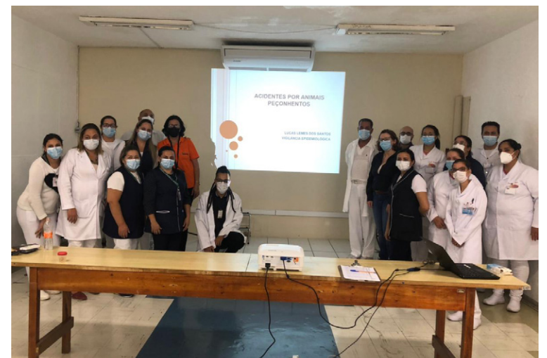
Equipes foram treinadas sobre conduta clínica no caso de incidentes com escorpiões, aranhas e cobras venenosas