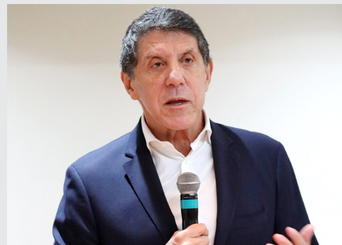
Uip substituirá Dimas Covas, presidente do Instituto Butantan

Atual secretário de Ciência, Pesquisa e Desenvolvimento em Saúde do Governo do Estado de São Paulo, o médico Dr. David Everson Uip foi nomeado para compor o Conselho Superior da Fundação de Amparo à Pesquisa do Estado de São Paulo (FAPESP). O mandato é de seis anos e a nomeação foi publicada na edição do Diário Oficial do Estado em 20 de julho. Uip substituirá Dimas Covas, presidente do Instituto Butantan.