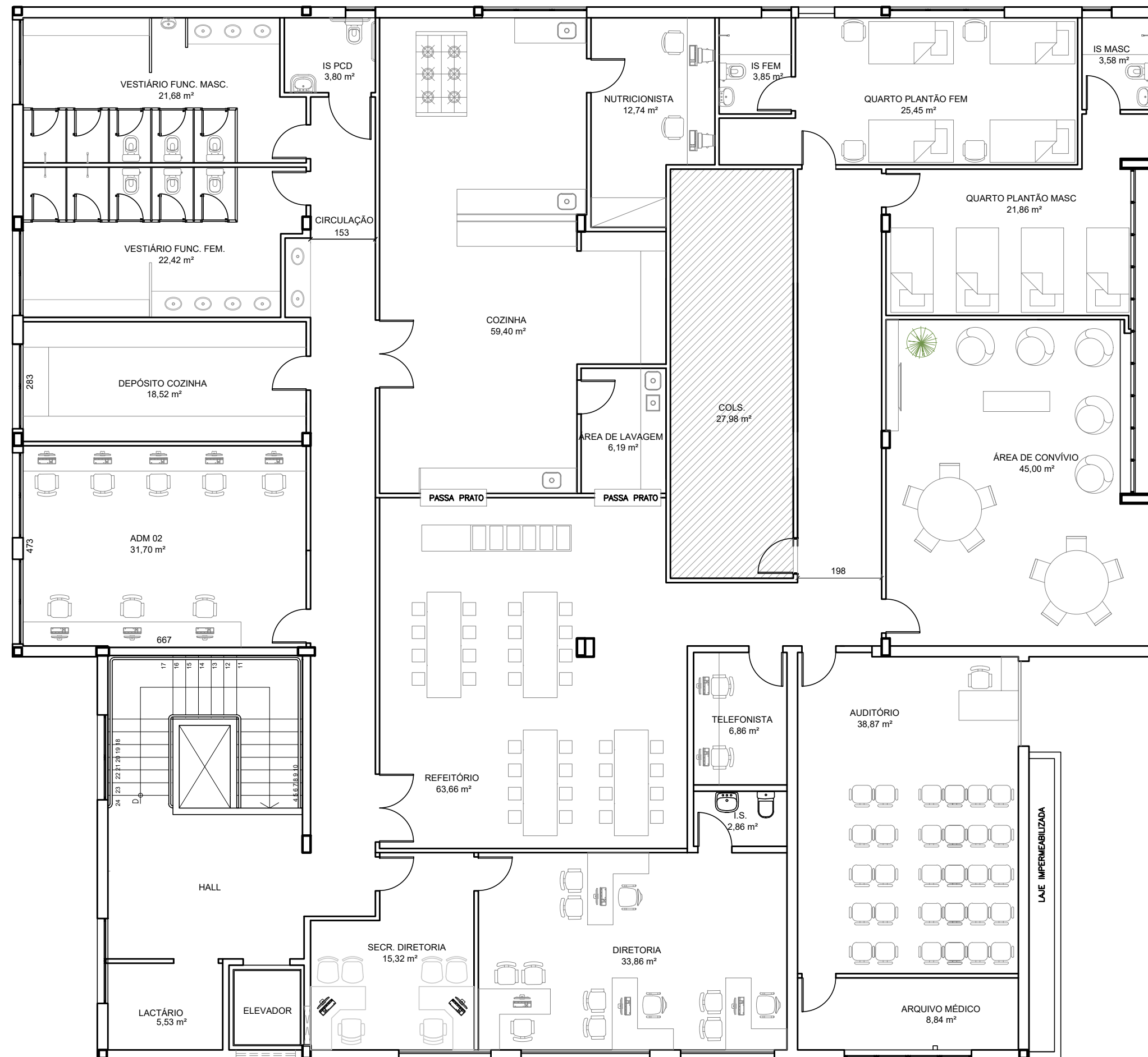
PLANTA PAVIMENTO SUPERIOR - PROPOSTA ESCALA 1/100