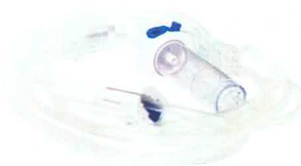
MDK MED Equip Universal para Bombas de Infusão "Luer Lock" 2350 mm - MdkMed (000 491111)

Os equipos das marcas 7 LIVES e MDKMED não estão homologados como equipos dedicados para uso no equipamento cotado. Conforme verificado em manual de usuário da bomba marca MINDRAY, segue listagem dos equipos que são calibrados para utilização nesta: