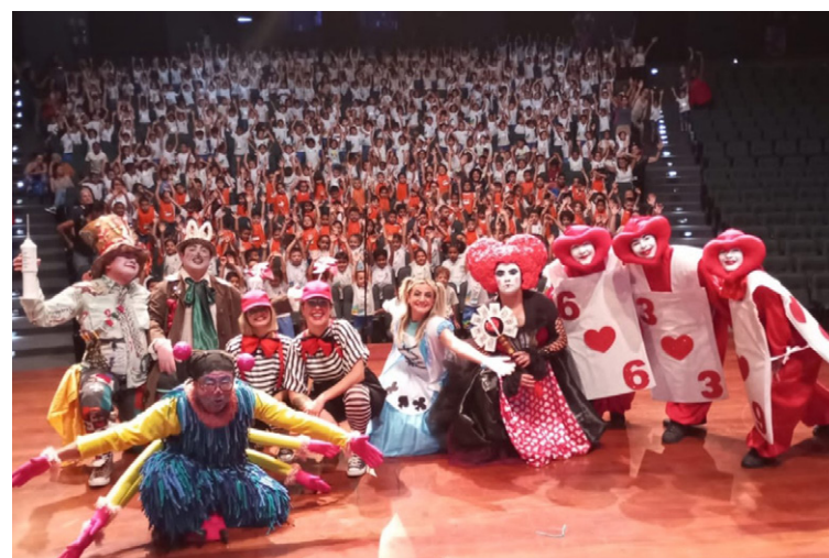
Grupo fez a apresentação da peça ‘Alice no País da Vacinação’, em 15 de dezembro

Neste percurso já foram desenvolvidas diversas encenações