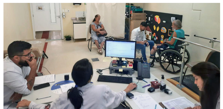
Pacientes tiveram suas medidas aferidas pelo técnico ortoprotesista

Inaugurado há pouco mais de cinco anos, o Centro de Reabilitação Lucy Montoro de Sorocaba atende aos 48 municípios do Departamento Regional de Saúde (DRS) de Sorocaba e se tornou referência na assistência