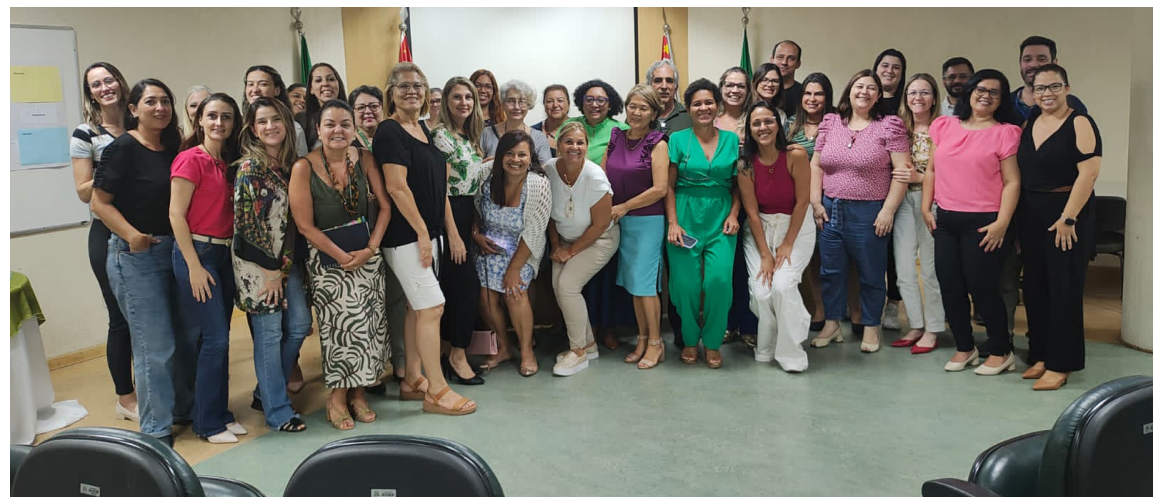
Objetivo principal das reuniões foi desenvolver estratégias para a área de Oncologia na Baixada Santista

A participação ativa e contínua do AME de Praia Grande no Programa de