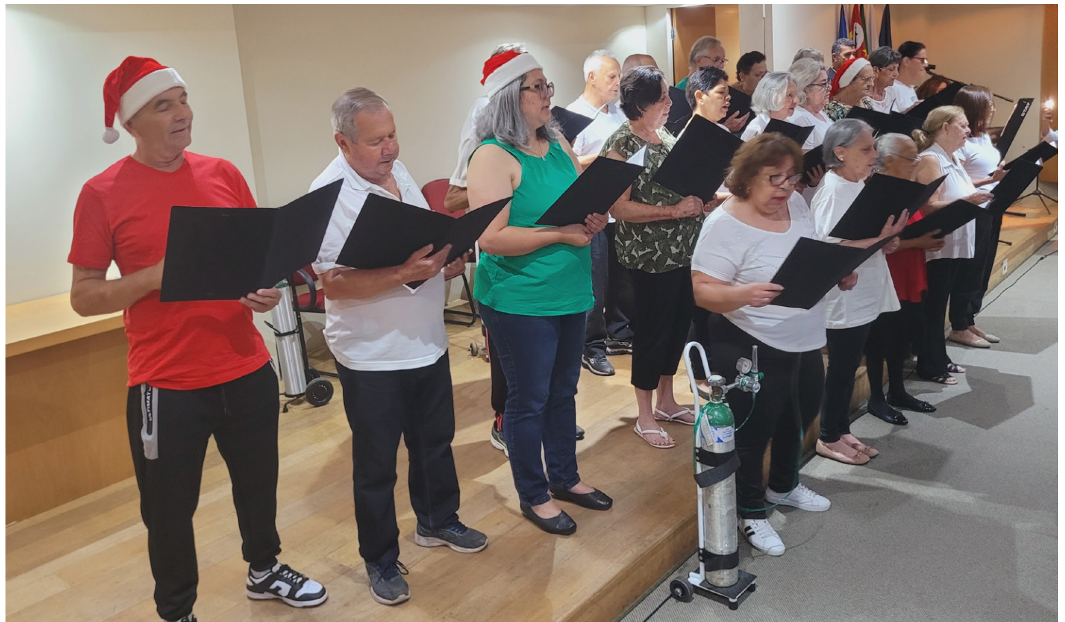
O canto é considerado uma ferramenta cognitiva que exercita a memória e permite a superação de dificuldades respiratórias

Tradição desde 2012, atividade destaca a importância da música na recuperação clínica