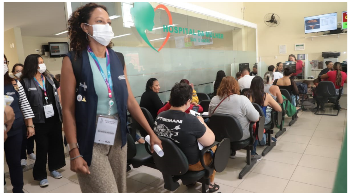
Técnicos do Ministério da Saúde visitaram Santo André para avaliar o serviço público de saúde do município

Por fim, também foi considerada a participação da comunidade no que diz respeito aos direitos humanos e igualdade de gênero, quando foram