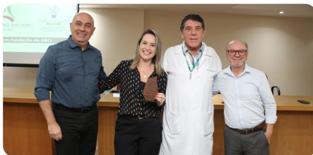
Projeto da Qualidade vence 3ª edição do concurso "Feito pela Gente"