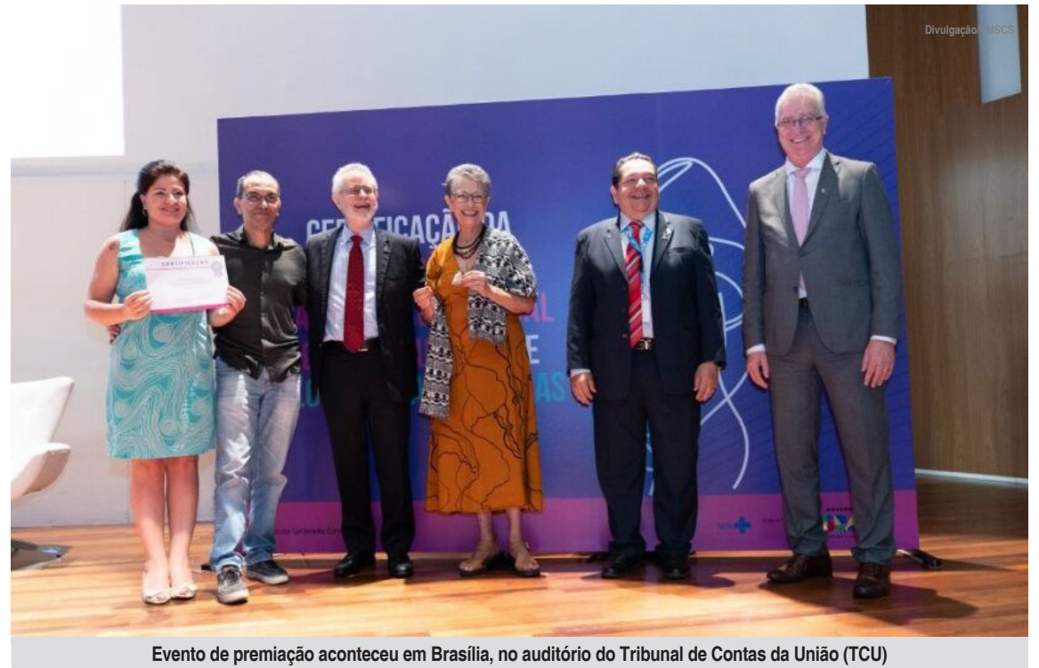
Evento de premiação aconteceu em Brasília, no auditório do Tribunal de Contas da União (TCU)

“O Selo representa nosso compromisso em garantir um futuro saudável para as gestantes e suas famílias aqui em São Caetano do Sul. Vamos continuar esse trabalho promovendo a saúde, bem-estar e muita informação para nossas gestantes”, destacou a