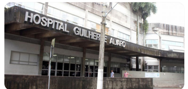
FUABC assume leitos de UTI no Hospital Guilherme Álvaro, em Santos