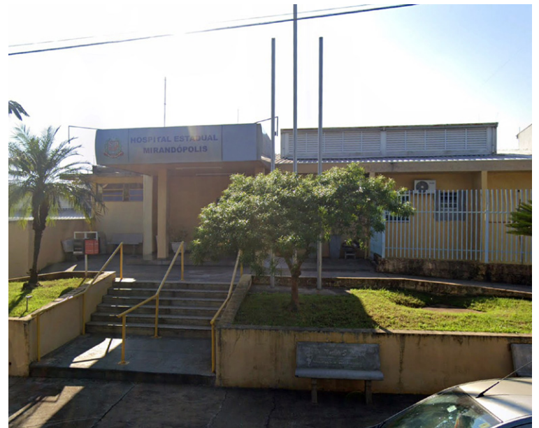
Hospital Estadual de Mirandópolis fica no Oeste Paulista, a 600km da Capital