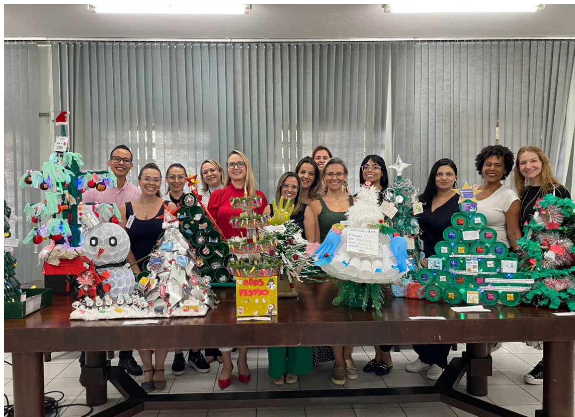
Todas as árvores produzidas foram expostas na unidade durante o período festivo

“Ficamos muito felizes com a iniciativa, empenho e participação de