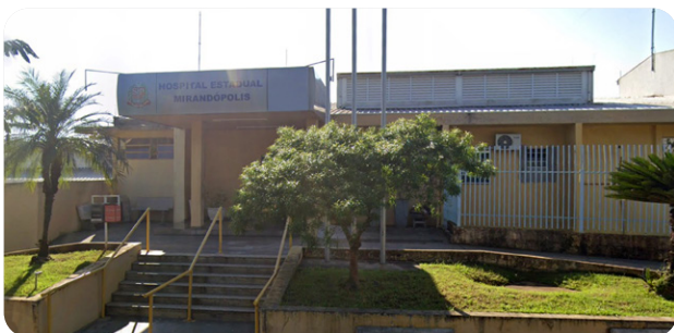
Fundação do ABC vence chamamento para Hospital Estadual de Mirandópolis

O Ambulatório Médico de Especialidades (AME) de Sorocaba, gerenciado pela Fundação do ABC em parceria com o Governo do Estado de São Paulo, completou em dezembro 10 anos em atividade com números expressivos na área da saúde. Desde sua inauguração, em 2013, a unidade registrou mais de 900 mil consultas, 1,7 milhão de exames e 63 mil cirurgias. Evento que celebrou a data reuniu autoridades estaduais, municipais, Presidência da FUABC, diretores da unidade e demais colaboradores. – Págs. 4 e 5