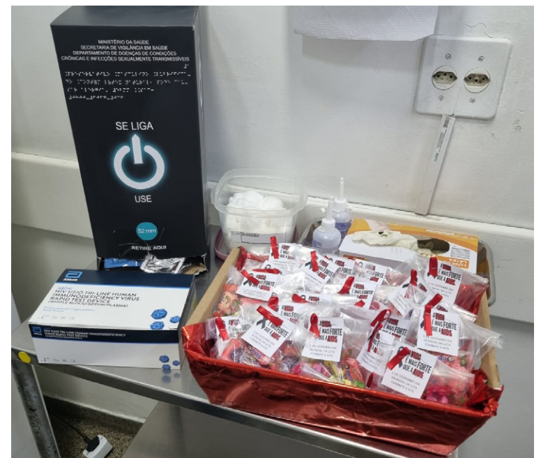
Foram distribuídos preservativos e realizadas orientações sobre prevenção e testagens gratuitas

A campanha Dezembro Vermelho, instituída pela Lei nº 13.504/2017 no Brasil, é um movimento de conscientização e prevenção do HIV/Aids e outras Infecções Sexualmente Transmissíveis (ISTs), apoiada pelos princípios do Sistema Único de Saúde (SUS). Com 92% das pessoas em tratamento contra o HIV alcançando um estado indetectável do vírus, graças aos esforços do Ministério da Saúde, a campanha destaca a importância do diagnóstico precoce, o uso de estratégias preventivas e o acesso a tratamentos gratuitos. Além disso, enfatiza a necessidade de observação