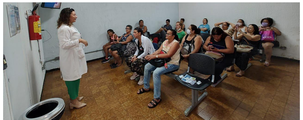
Equipes do AME promoveram o "Minuto Saúde", com informações sobre prevenção e promoção do bem-estar

Pacientes que apresentaram pontuação igual ou superior a 15 no FINDRISC foram encaminhados nominalmente ao município de origem via e-mail, proporcionando um direcionamento individualizado. Além