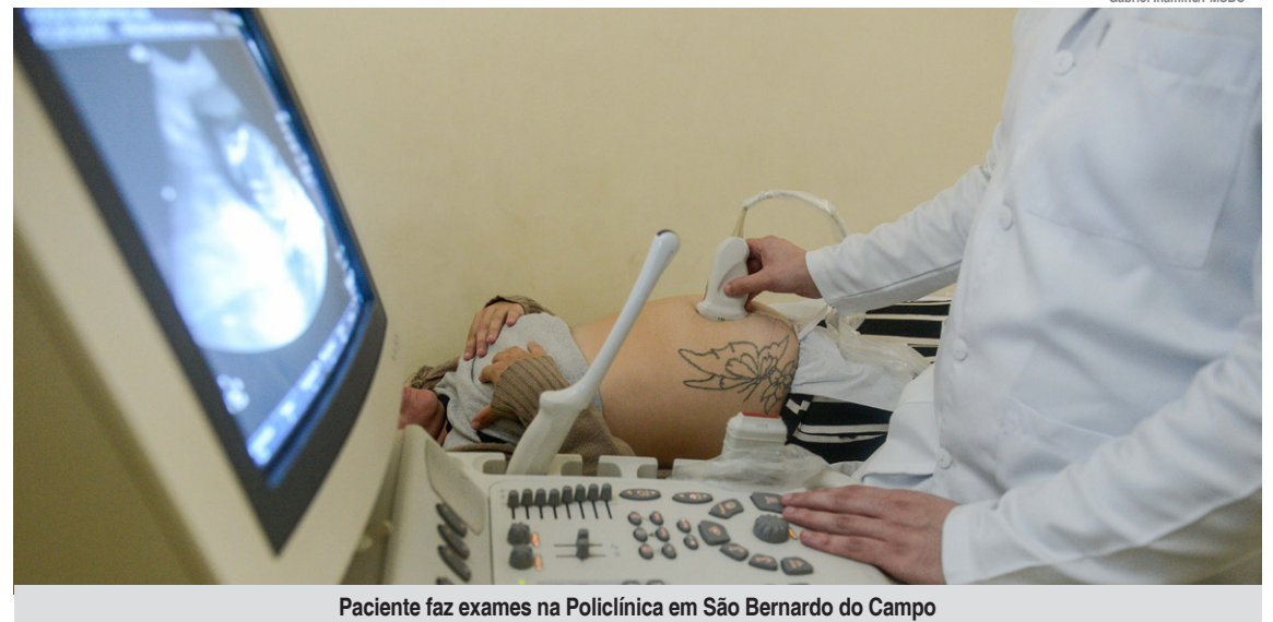
Paciente faz exames na Policlínica em São Bernardo do Campo

Para conceder o certificado, a Comissão Nacional de Validação (CNV) avaliou vários critérios de impacto dos últimos dois anos, especialmente os relacionados à quantidade de gestantes soropositivas; acompanhamento desde o pré-natal ao parto, incluindo a cobertura mínima de quatro consultas no pré-natal; taxa de transmissão vertical do HIV; acompanhamento do bebê nos primeiros anos de vida; ações de