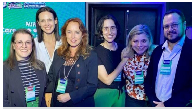
Equipe de SBC foi convidada a participar como palestrante no evento

Hoje a Saúde Suplementar utiliza os chamados ‘hospitais de transição’ e o home care . Neste sentido, a experiência do SAD-SBC reforça a importância do cuidado centrado no paciente e todo o processo de mudança do paciente do ambiente hospitalar para o domicílio.