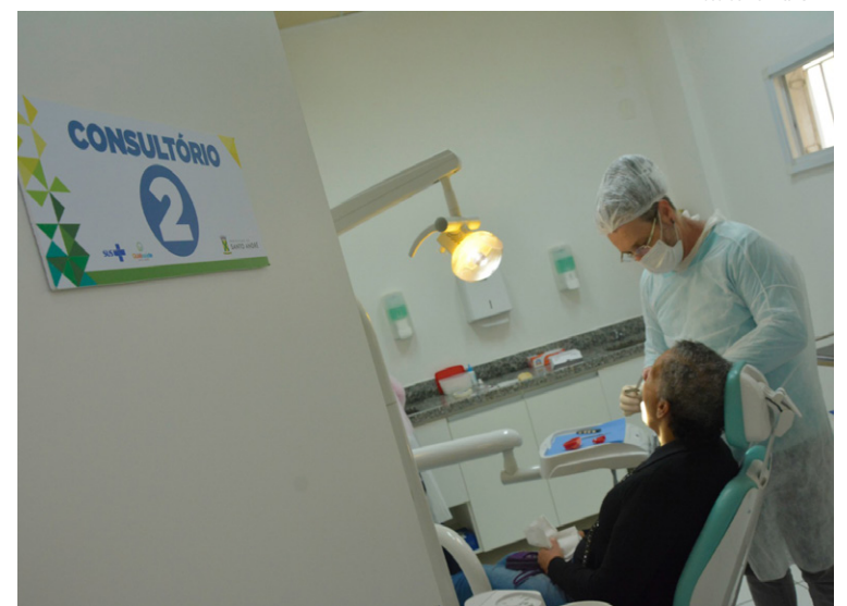
O câncer de boca é o quinto mais comum entre homens e o nono entre mulheres no Brasil

O câncer de boca é o quinto mais comum entre homens e o nono entre mulheres no Brasil, de acordo com o Instituto Nacional do Câncer (Inca). Ainda segundo o instituto, cerca de 6 mil pessoas morrem por ano com esse diagnóstico.