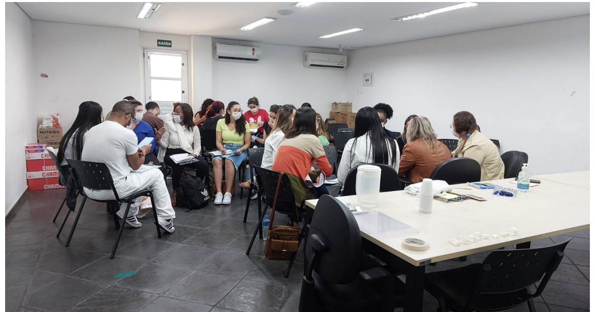
Iniciativa, que aperfeiçoa estratégias de integração, é voltada aos novos colaboradores e funcionários promovidos

“Um processo de integração sólido e eficaz é extremamente importante, principalmente no primeiro contato do colaborador com a FUABC. É neste momento que reforçamos