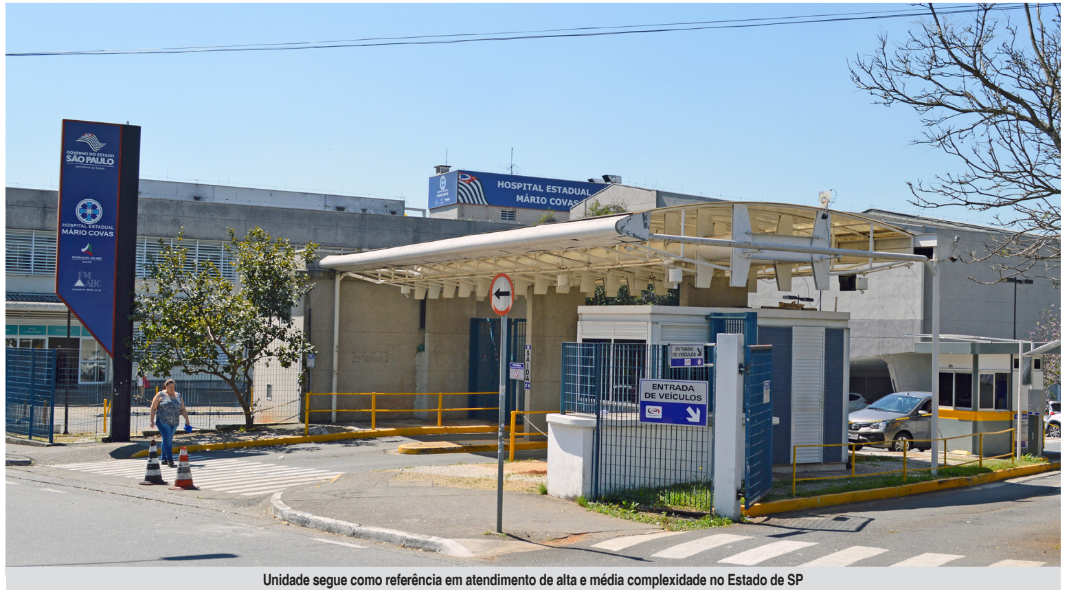
Unidade segue como referência em atendimento de alta e média complexidade no Estado de SP

“São números expressivos que mostram a robustez e a importância do Hospital Mário Covas para o Grande ABC. Foi um ano de muitos desafios e novos projetos. Reorganizamos o setor de emergência e qualificamos a entrada dos pacientes que chegam via regulação. Estamos, incansavelmente, revendo o nosso Núcleo Interno de Regulação (NIR) e a grade cirúrgica para conseguirmos operar mais pa-