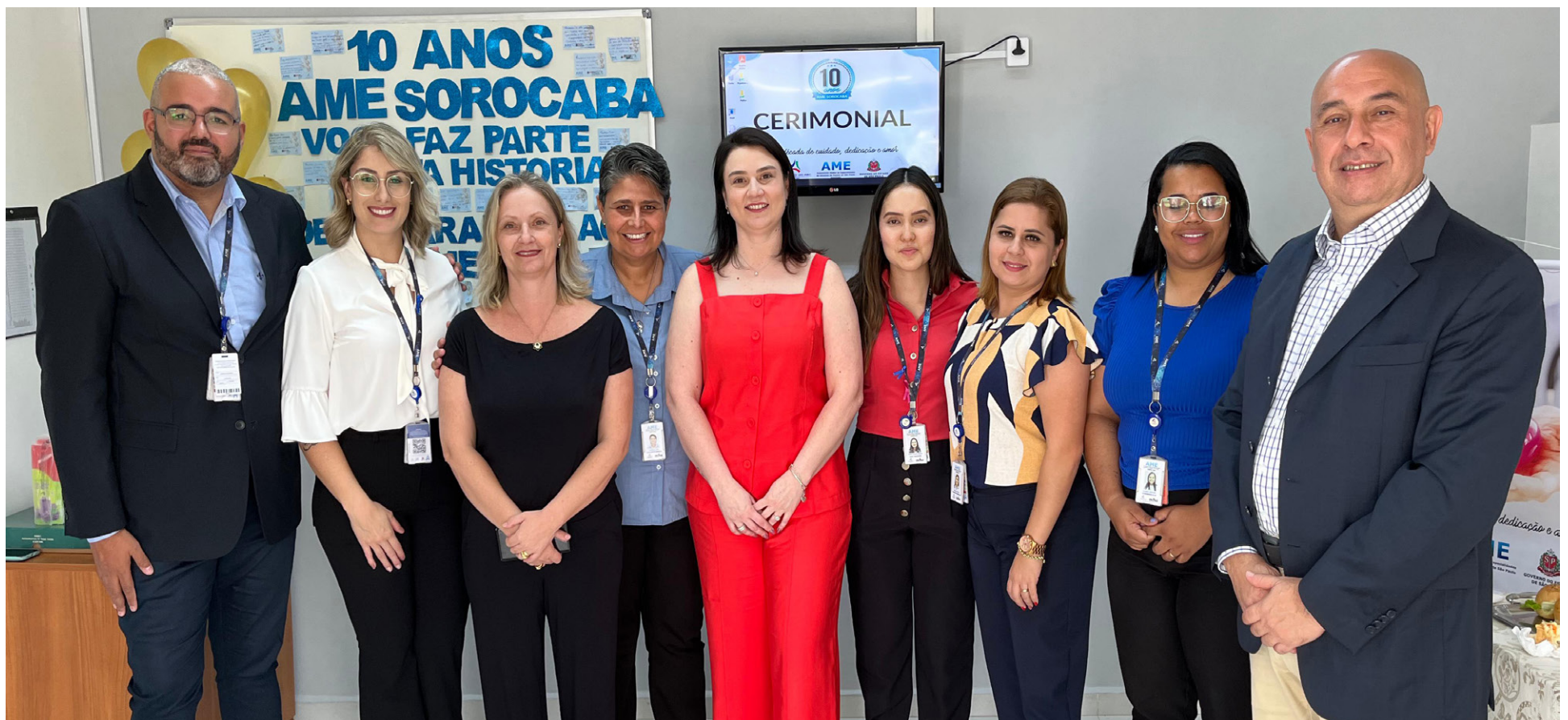
Equipe do AME Sorocaba e da FUABC durante comemoração de 10 anos da unidade

Ao longo de uma década, unidade gerenciada pelo Governo do Estado em parceria com a Fundação do ABC contabilizou quase 63 mil cirurgias