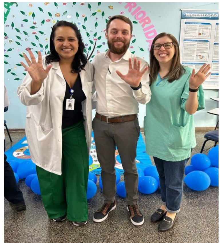
Iniciativa foi desenvolvida pelo Serviço de Controle de Infecção Hospitalar (SCIH)

Desta forma, o HGC espera conscientizar colaboradores, pacientes e visitantes sobre a importância da higienização das mãos. Com ações lúdicas e criativas, a campanha pretende reduzir os riscos de infecções no ambiente hospitalar e garantir a segurança dos pacientes.