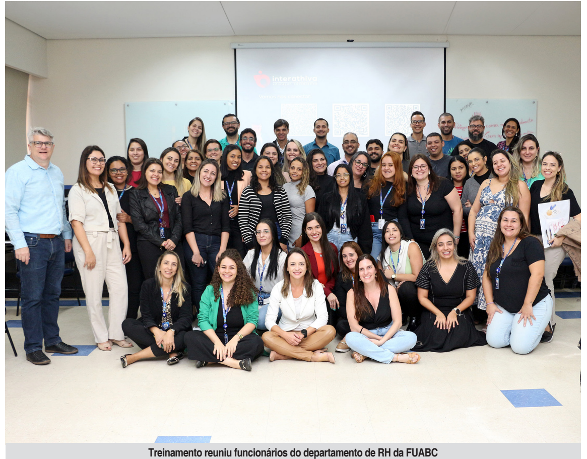
Treinamento reuniu funcionários do departamento de RH da FUABC