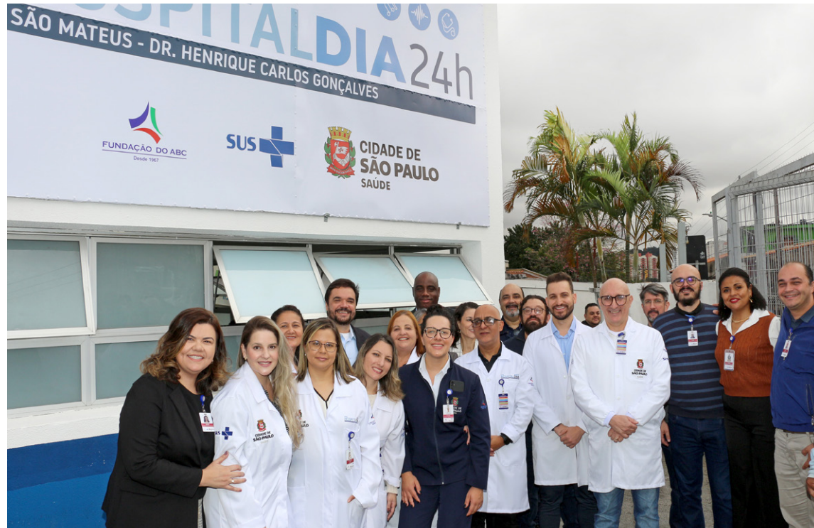
Hospital Dia de São Mateus passa a ter atendimento 24 horas

O prefeito ainda destacou que a unidade passa a ter capacidade para realizar um número maior de consultas: de 5 mil para 5,8 mil, assim como a quantidade de exames. Com a nova estrutura, a quantidade de exames aumenta de 5 mil para 5,7 mil; as cirurgias de 120 para 360 mensais. O