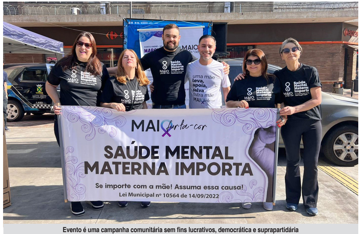
Evento é uma campanha comunitária sem fins lucrativos, democrática e suprapartidária

Além de participar da Marcha, a população pode contribuir promovendo palestras, rodas de conversa, caminhadas, viabilizando ações materialmente e financeiramente, compartilhando conteúdos nas redes sociais e engajando-se em ações gratuitas.