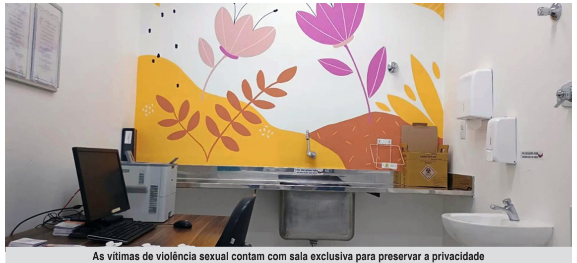
As vítimas de violência sexual contam com sala exclusiva para preservar a privacidade

Quando pertinente, também é ofertado ao responsável pelo paciente atendimento psicológico.