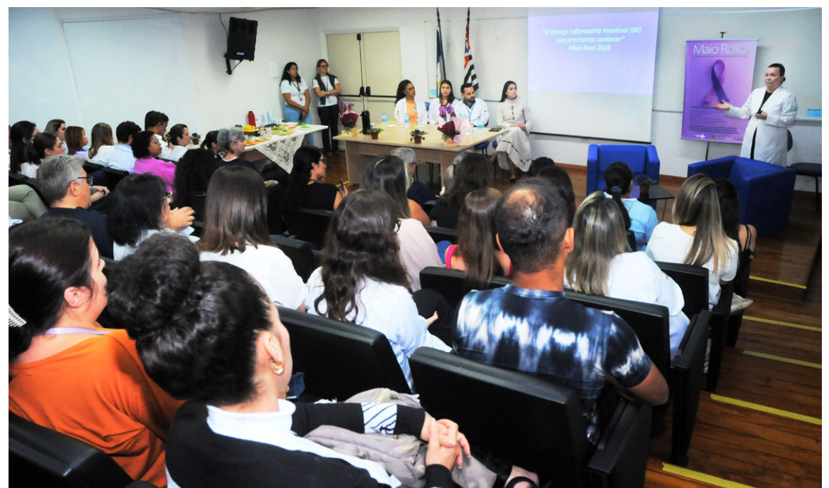
Evento aconteceu no auditório do CHM e foi aberto ao público