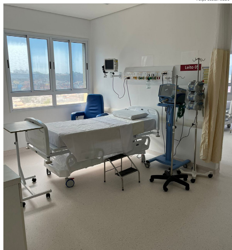
Mais 20 leitos da UTI foram revitalizados

Com investimento de aproximadamente R$ 4 milhões, a obra foi planejada para renovar toda a estrutura do 3º, 6º e 8º andares. Dentre as melhorias implantadas estão a troca completa de todo o piso e contrapiso, instalação de nova manta vinílica e revestimentos.