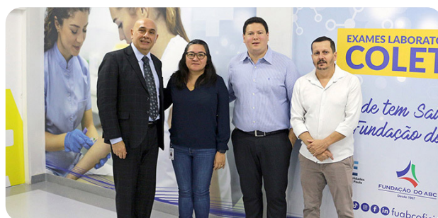
Presidente da FUABC visita AME Mauá e destaca avanços na unidade