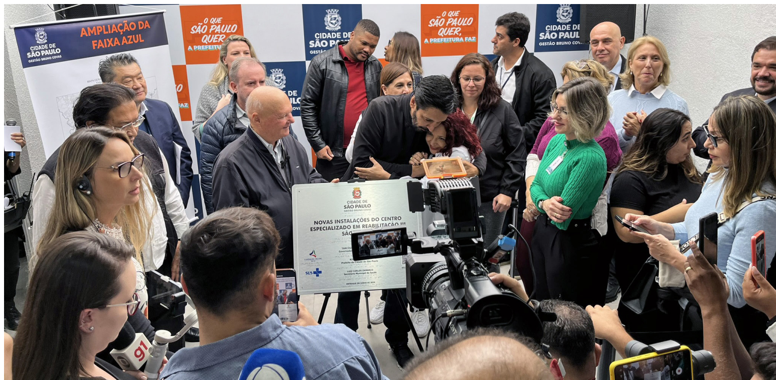
Ao centro, o prefeito de São Paulo, Ricardo Nunes, durante evento de entrega

“É uma alegria entregarmos hoje a requalificação deste CER que funcio-