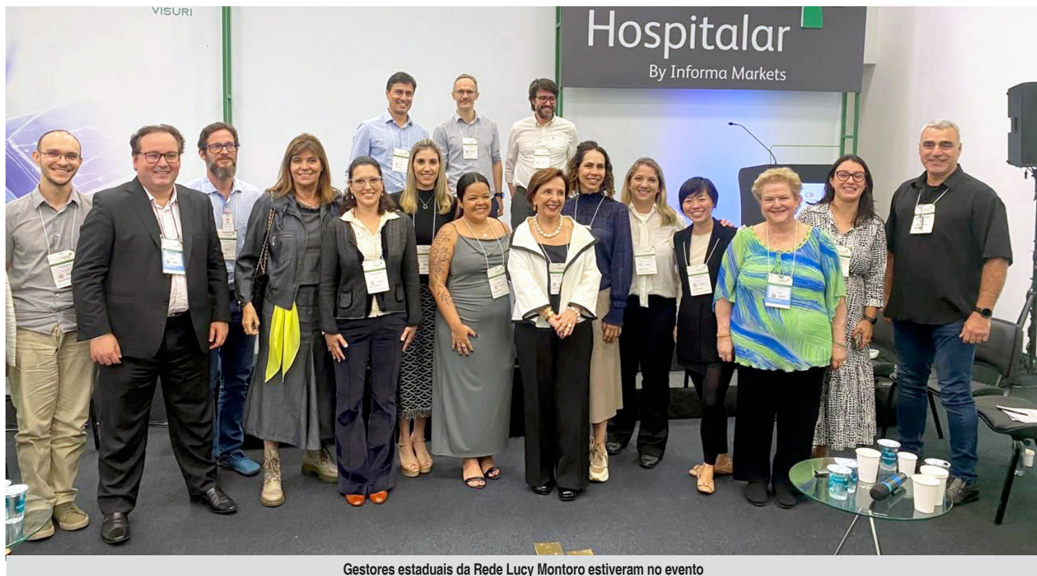
Gestores estaduais da Rede Lucy Montoro estiveram no evento

Além da coordenadora médica, também estiveram presentes a diretora-geral e o gerente adminis-