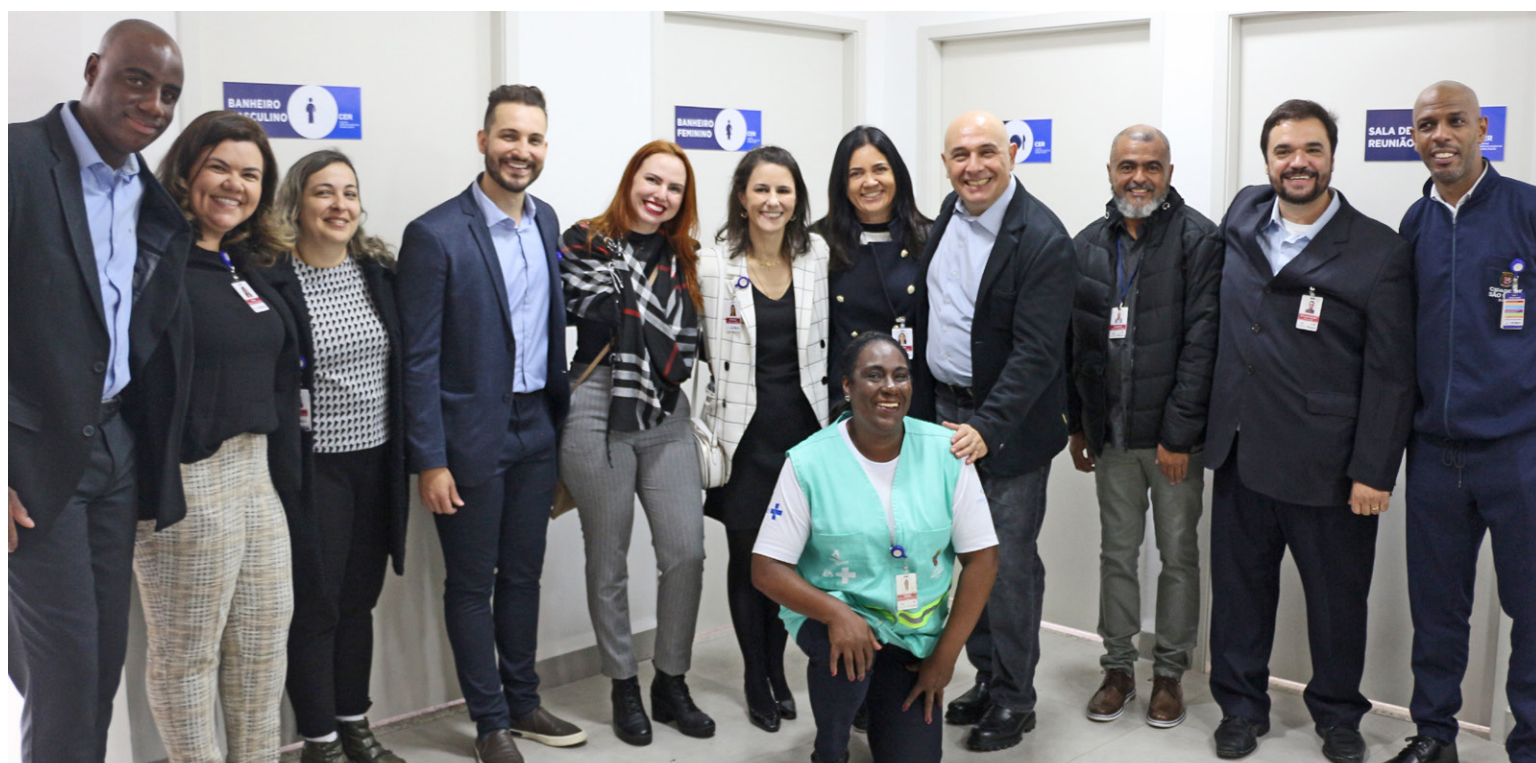
Corpo diretivo da FUABC posa com equipe de São Mateus