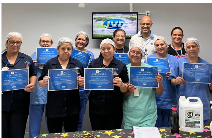
Participantes receberam certificados da empresa responsável pelo treinamento

Durante o treinamento, os colaboradores receberam instruções sobre o correto manuseio de produtos químicos, incluindo medidas preventivas para evitar acidentes e danos à saúde. Além disso, foram apresentadas diretrizes específicas para a utilização adequada de cada produto, de forma a garantir a eficácia na limpeza e conservação dos ambientes da unidade de saúde.