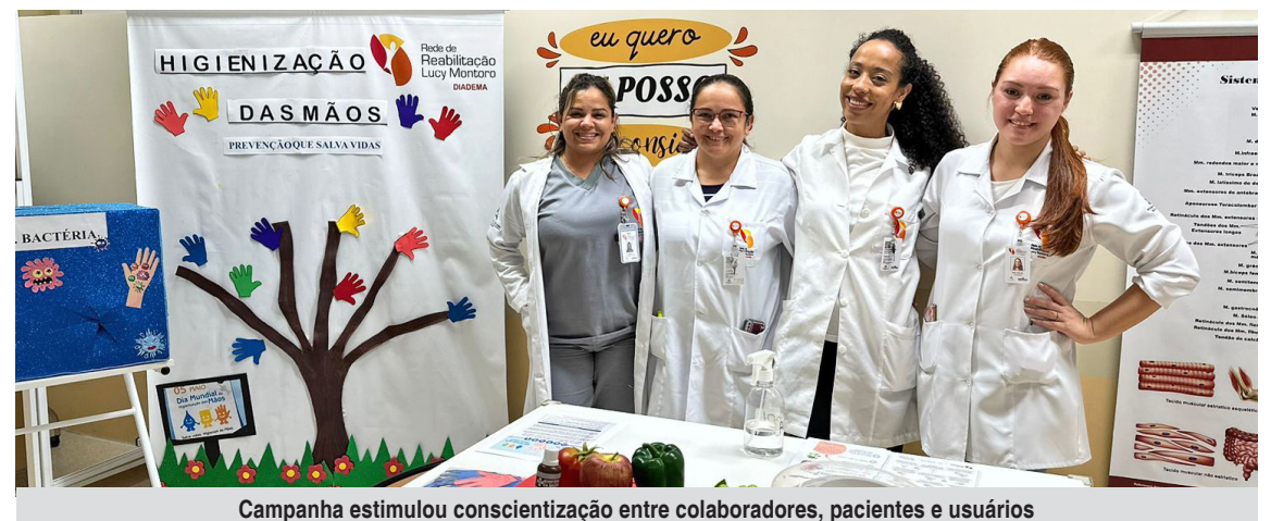
Campanha estimulou conscientização entre colaboradores, pacientes e usuários