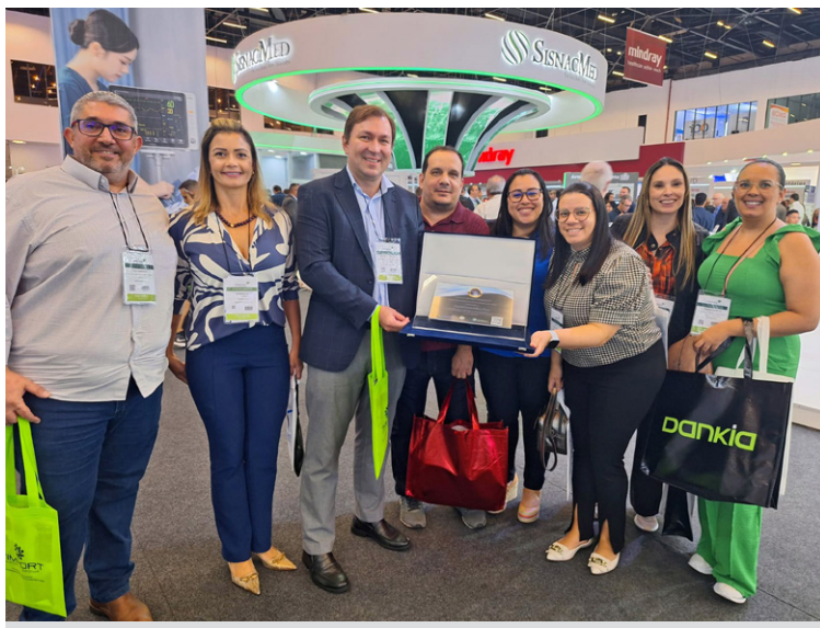
Equipe do Hospital Estadual Mário Covas, de Santo André

“Uma honra receber a certificação em Sistemas de Gestão de Qualidade concedida pelo Programa Farol, que ratifica as boas práticas adotadas pelo Hospital Nardini na assistência e nas rotinas administrativas. Agradeço a toda nossa equipe que, de forma admirável, foi responsável por mais essa conquista”, comemorou a diretora-geral do Complexo de Saúde de Mauá (CO-