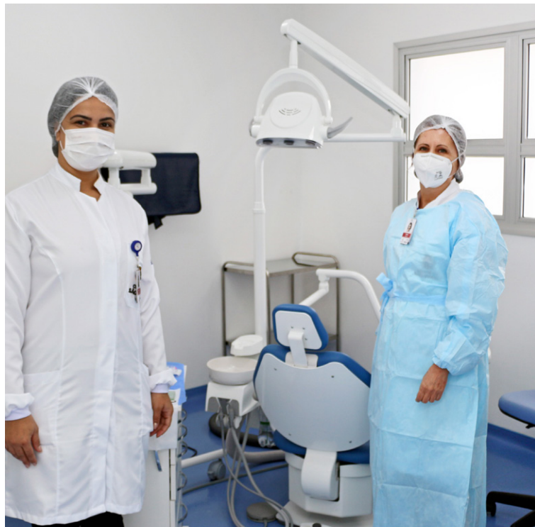
Centro de Especialidades Odontológicas (CEO) terá atendimento ampliado

Também em 4 de junho, foram entregues as reformas realizadas no Hospital Dia (HD) e no Centro de Especialidades Odontológicas (CEO) São Mateus, que ficam no mesmo complexo na Zona Leste da capital, com objetivo de ampliar e qualificar os equipamentos, além de aumentar o número de procedimentos realizados.