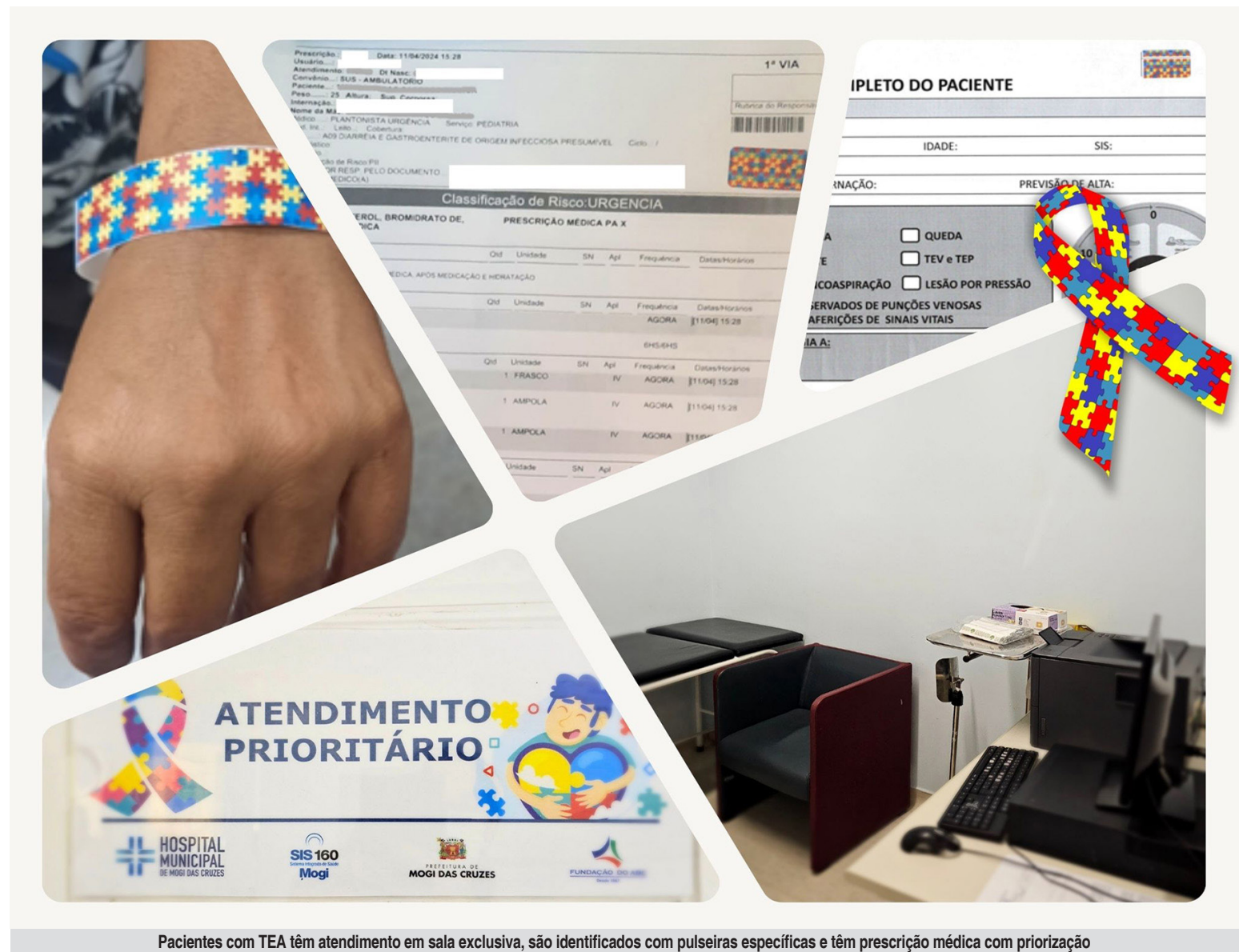
Pacientes com TEA têm atendimento em sala exclusiva, são identificados com pulseiras específicas e têm prescrição médica com priorização

No Pronto Atendimento Infantil, o processo começa com a acolhida e identificação do paciente com uma pulseira personalizada. Em seguida, ele é direcionado para uma sala exclusiva, onde a prescrição médica é destacada para priorização do atendimento. Nos ambulatórios, os pacientes são identificados com uma