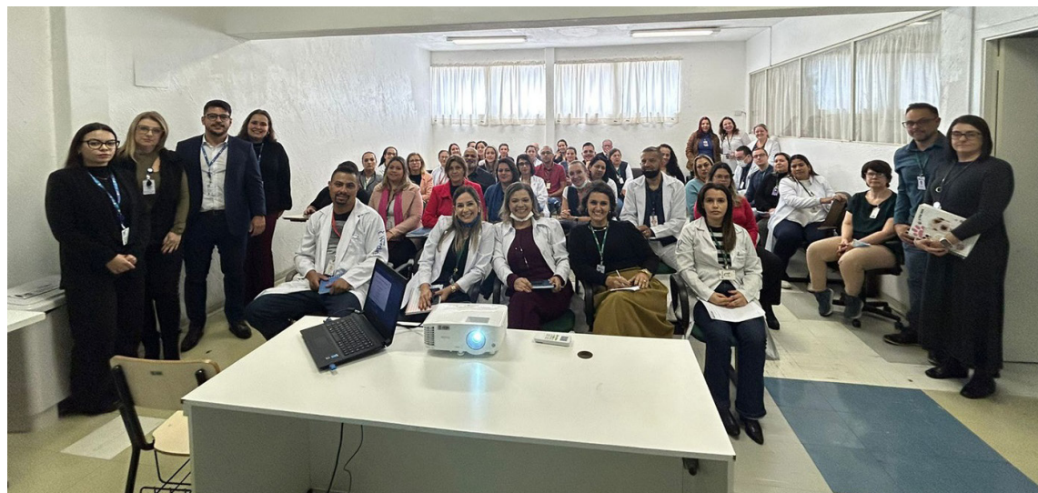
Objetivo da ação foi levar conhecimento às equipes sobre o conceito de Compliance

atuarão estrategicamente como representantes da área de Compliance junto aos colaboradores das unidades gerenciadas, para serem multiplicadores dos principais conceitos contidos no Código de Conduta Ética da FUABC, bem como políticas internas e ações que integram o Programa de Integridade da FUABC.