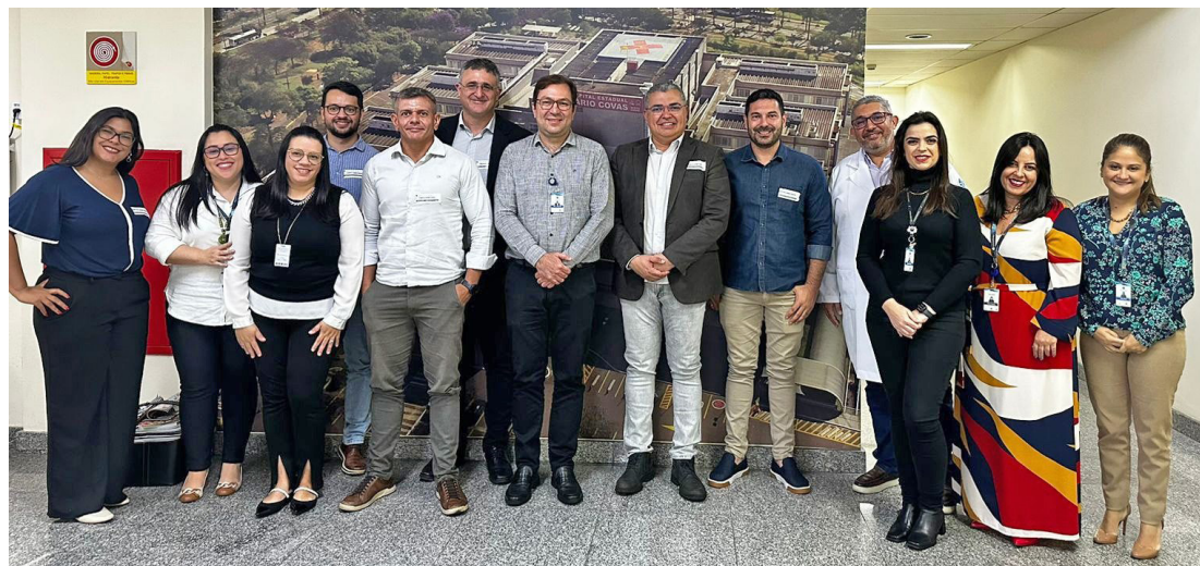
Encontro proporcionou trocas de experiências entre os serviços

Localizado no Triângulo Mineiro, o Mário Palmério Hospital Universitário é um hospital geral de ensino destinado ao atendimento da população de Uberaba e região. Suas instalações