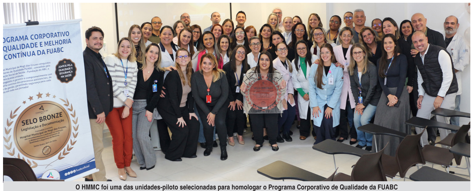
O HMMC foi uma das unidades-piloto selecionadas para homologar o Programa Corporativo de Qualidade da FUABC

tosas e boas práticas. Para isso, foram criados selos internos de avaliação de qualidade assistencial e administrativa instituídos pela própria Mantenedora, divididos em três níveis: Ouro, Prata e Bronze. A expectativa é de que as creditações nacionais e internacionais das unidades de saúde sejam uma consequência da criação deste programa. O projeto conta com apoio da Presidência e da área de Governança Corporativa da Mantenedora.