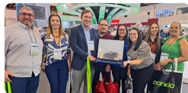
'Nardini' e 'Mário Covas' recebem selo do 'Programa Farol' na Hospitalar 2024