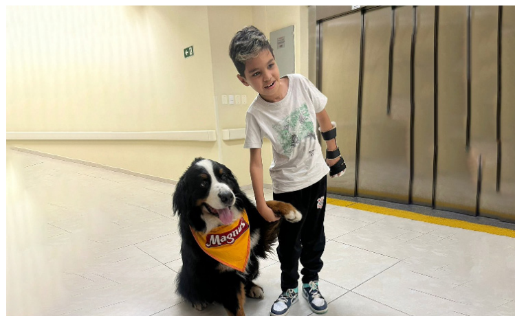
Cão Magnus presenteou a todos com seu carisma e alegria

O Dia Internacional da Família é celebrado anualmente em 15 de maio. A data homenageia a instituição familiar, que é um núcleo essencial para a formação de todos os indivíduos. Neste contexto, o Lucy Montoro Sorocaba promoveu diversas atividades, com destaque para a parceria com o Instituto Adimax, que presenteou a todos com o carisma e a alegria da visita do Cão Magnus.