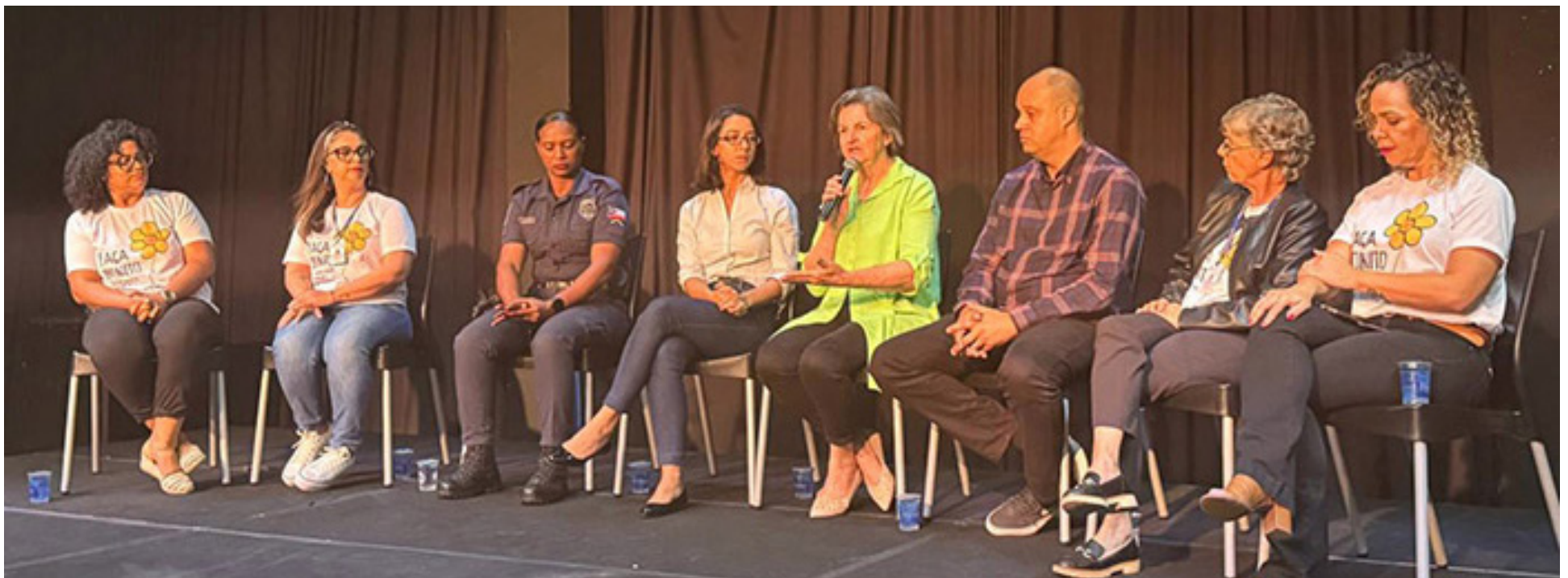
Evento discutiu estratégias para combater abuso e exploração sexual de crianças e adolescentes

No dia 14 de maio, a Secretaria Municipal de Assistência Social de Mogi das Cruzes organizou a roda de conversa "Faça Bonito", marcando o Dia Nacional de Combate ao Abuso e Exploração Sexual de Crianças e Adolescentes. O Hospital Municipal de Mogi das Cruzes (HMMC), referência para atendimento a esses casos,