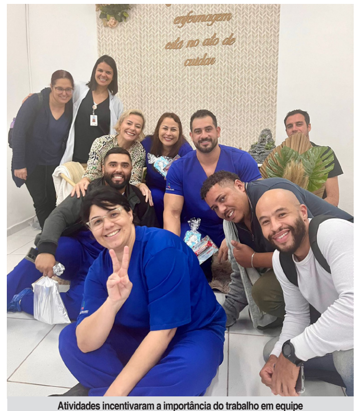
Atividades incentivaram a importância do trabalho em equipe