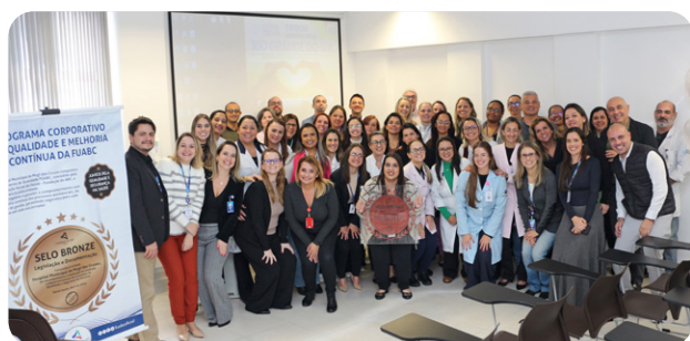
Hospital de Mogi das Cruzes conquista 'Selo Bronze' de qualidade da FUABC

A Prefeitura de São Paulo e a FUABC entregaram, em junho, as novas instalações do Centro Especializado em Reabilitação (CER) São Mateus, equipamento de excelência para reabilitação física, nas especialidades de fisioterapia, fonoaudiologia, terapia ocupacional e psicologia. Na mesma data também foram entregues as reformas do Hospital Dia (HD) e do Centro de Especialidades Odontológicas (CEO) São Mateus. Eventos contaram com a presença do prefeito de São Paulo, Ricardo Nunes. Págs.14 e 15