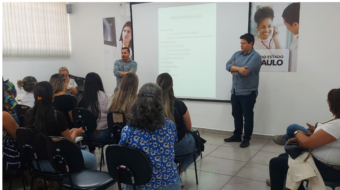
Melhora da performance foi fruto de trabalho integrado conduzido pela área de Qualidade da unidade

A partir desta iniciativa, com uma abordagem mais colaborativa e integrada, a unidade começou a notar benefícios como o acolhimento de dificuldades de