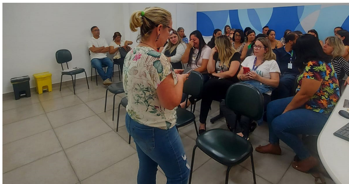
Estratégia de aproximação consistiu em envolver a equipe de matriciamento da unidade e da Regulação Municipal

forma empática e orientada por soluções, além da proatividade coletiva para sanar eventuais falhas de processo. Foi possível, também, aprimorar práticas de saúde e melhorar a eficiência dos encaminhamentos e agendamentos, com base na identificação de gargalos nos fluxos de trabalho, na simplificação de processos administrativos e na criação de ferramentas que otimizaram o processo