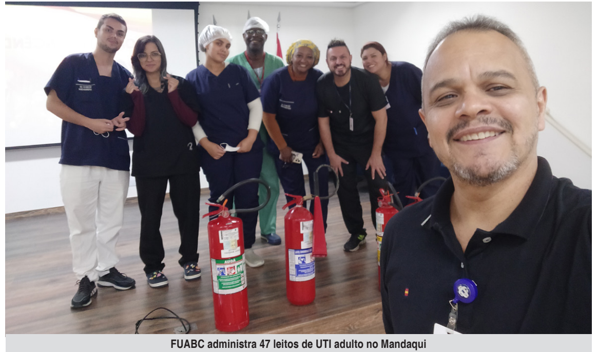
FUABC administra 47 leitos de UTI adulto no Mandaqui

Ao todo, 103 colaboradores da FUABC participaram do treinamento, que abordou desde conceitos básicos até práticas avançadas de prevenção e combate a incêndios. Entre os tópicos discutidos estavam: definições de fogo e incêndio, elementos essenciais do fogo, formas de transmissão de calor, classes de incêndio, tipos de combustíveis, agentes extintores, métodos de extinção e procedimentos de evacuação.