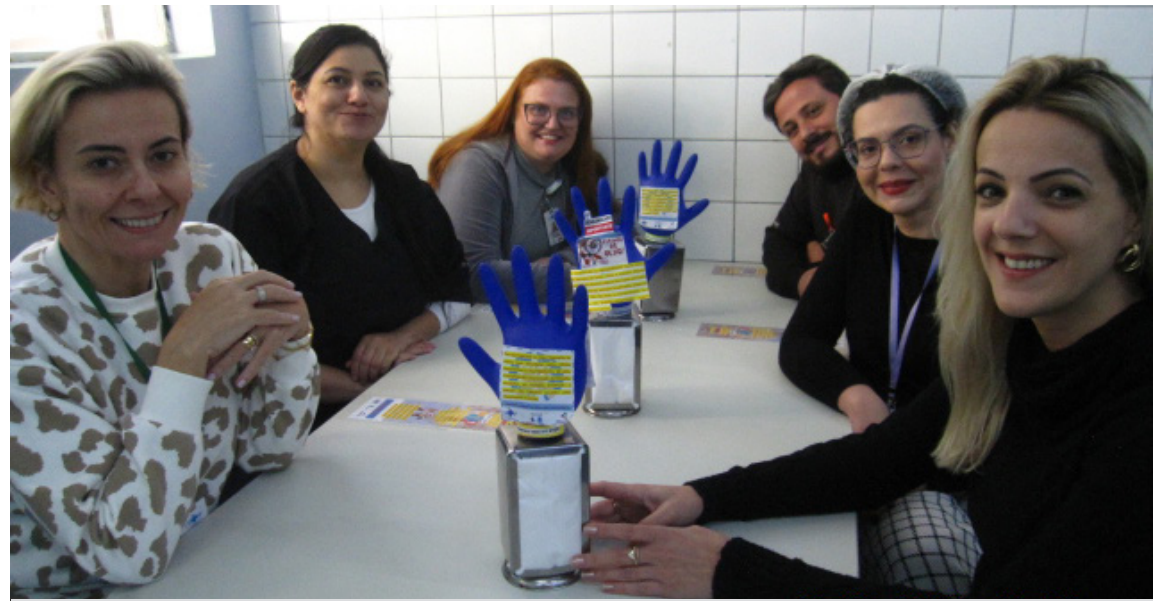
Campanha teve como foco o refeitório, local de grande circulação de colaboradores

A campanha incluiu uma atividade interativa: um formulário on-line disponível até o final de maio, no qual os colaboradores puderam responder a