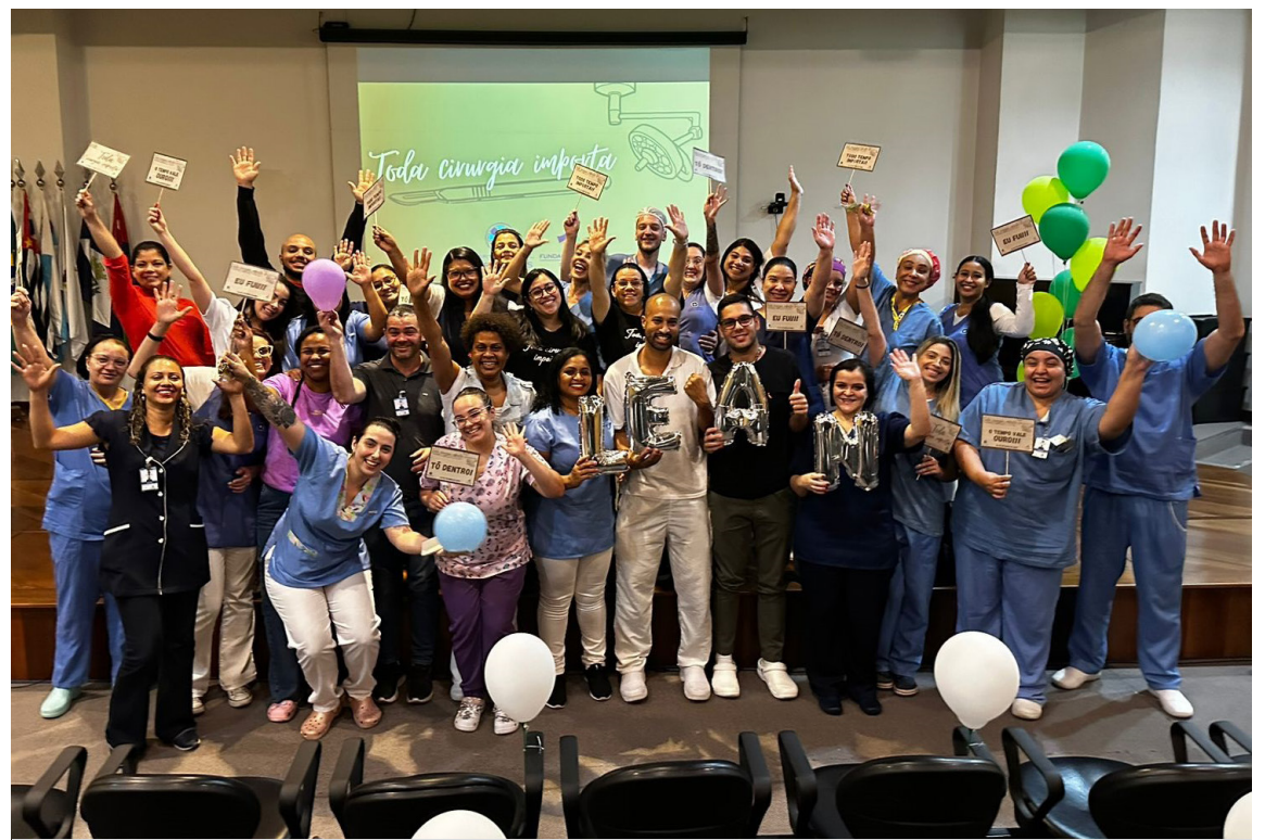
Evento reuniu equipes no auditório do hospital

O Hospital Estadual Mário Covas foi aprovado em agosto para o 5º ciclo da 2ª fase do projeto Lean, do Ministério da Saúde (MS), batizada 'Transformação LEAN nos Hospitais'. Diferentemente da etapa inicial, ligada à área de Emergência, agora o foco está na otimização dos processos no centro cirúrgico e unidades de internação. A iniciativa do MS ocorre em parceria com o Conselho Nacional de Secretários de Estado de Saúde (CONASS) e o Conselho Nacional de Secretarias Municipais de Saúde (CO-