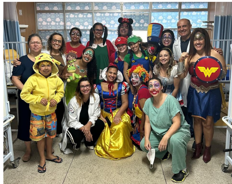
Os colaboradores se encheram de cores para levar alegria aos pequenos pacientes

Uma atividade de "pinta cara" também foi realizada, pela qual as crianças e a equipe puderam ter desenhos artísticos e infantis pintados em seus rostos, com a devida autorização médica e dos responsáveis legais. Para completar a