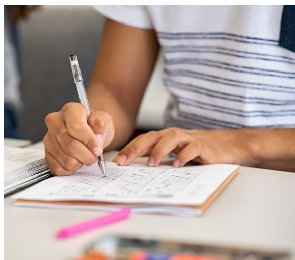
Foram abertas vagas para cursos como Biomedicina e Enfermagem

Também serão aceitas as notas obtidas no ENEM (Exame Nacional do Ensino Médio) de 2015 até 2024 para cálculo da nota de classificação do processo seletivo. Nessa condição, o candidato será dispensado da realização da prova e