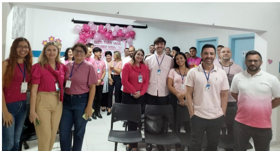
Equipe do AME Praia Grande