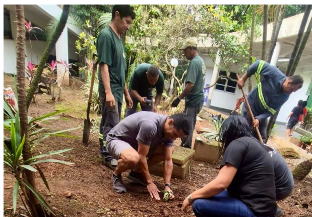
Ação contou com atividades de plantio e jardinagem

Cada família participante teve a oportunidade de plantar uma muda, simbolizando o compromisso com a preservação ambiental. Além disso, os presentes participaram de uma oficina de jardinagem, onde receberam dicas práticas sobre o cuidado com plantas em casa. A manhã terminou com uma confraternização ao ar livre, com um