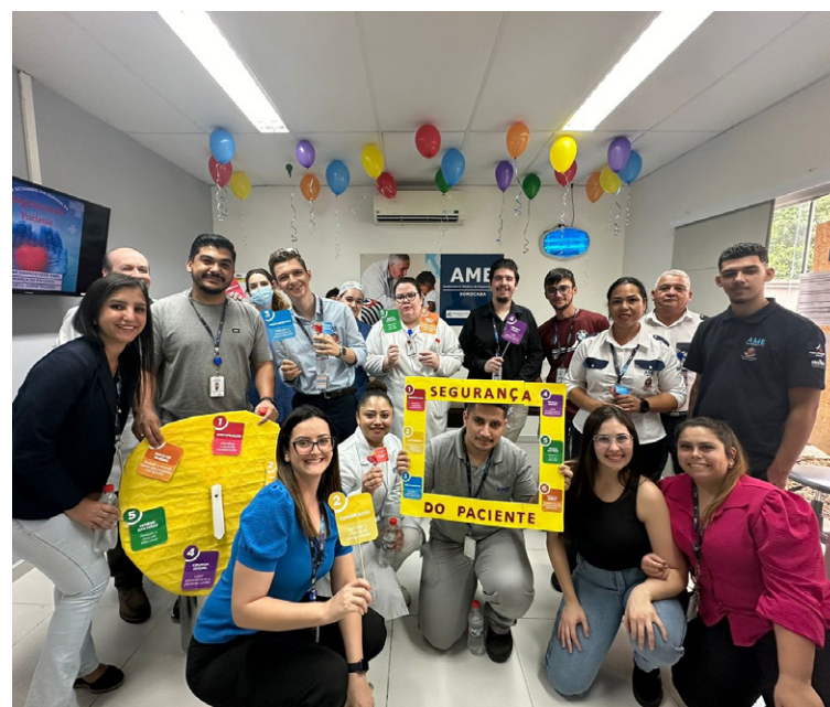
Colaboradores foram testados sobre as seis metas internacionais sobre a segurança do paciente

No dia 20 de setembro, as atividades culminaram em sessões interativas que abordaram as seis metas internacionais de segurança do paciente, com foco no tema da campanha deste ano: "Melhorar o diagnóstico para a segurança do paciente". Sob o slogan "Faça certo, tome seguro", a iniciativa buscou fortalecer a cultura de segurança dentro do AME Sorocaba, com envolvimento de todos os presentes no compromisso com o cuidado responsável.