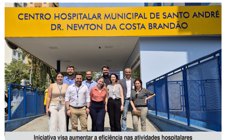
Iniciativa visa aumentar a eficiência nas atividades hospitalares

Ao otimizar o funcionamento do hospital, os impactos positivos se estendem para todo o sistema de saúde pública, reforçando o papel essencial do Sistema Único de Saúde (SUS) e sua interconectividade na promoção da saúde.