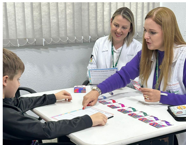
NEA-FMABC conta com métodos conceituados para avaliação dos transtornos

De acordo com o Manual Diagnóstico e Estatístico de Transtornos Mentais (DSM-5-TR), a dislexia é um transtorno do neurodesenvolvimento,