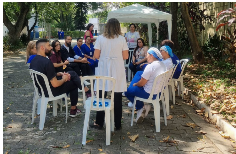
A programação incluiu dinâmicas e momentos de reflexão

Durante todo o mês de setembro, um mural de girassóis com mensagens motivacionais esteve disponível aos colaboradores, reforçando a importância do autocuidado diário.