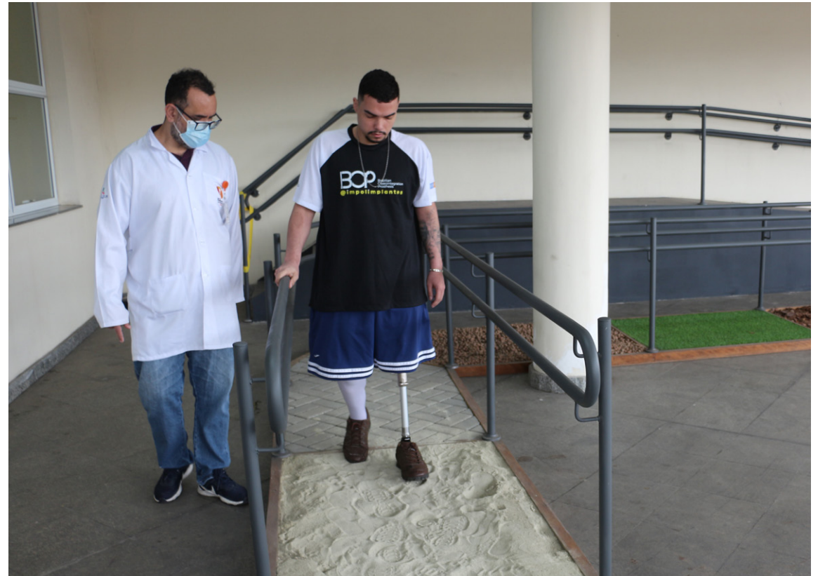
Os treinos de marcha são realizados em vários tipos de terrenos