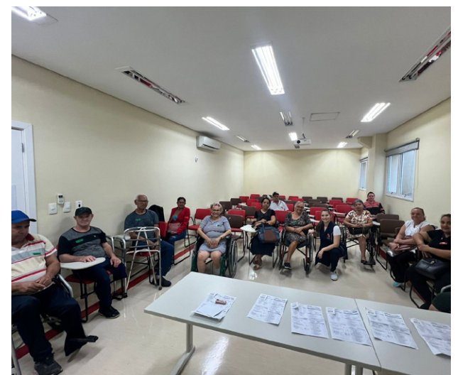
Pacientes foram instruídos sobre os perigos dos incêndios florestais

A campanha educativa seguiu até o final de setembro e as ações incluíram palestras, distribuição de material informativo e acompanhamento personalizado, visando garantir que os pacientes recebessem as informações necessárias para proteção contra os efeitos das queimadas.