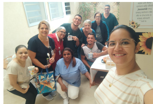
Colaboradores foram informados através de painéis e orientações sobre autocuidado

Para combater esse estigma, é essencial discutir o tema de forma aberta. Com esse objetivo, o Núcleo de Segurança do Paciente do AME desenvolveu diversas ações direcionadas a colaboradores