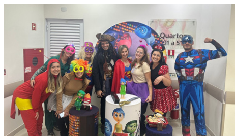
Hospital Municipal de Mogi das Cruzes