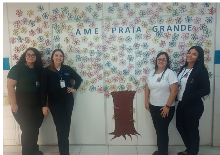
Painel foi feito com materiais reciclados, como miolo de papel higiênico

papel higiênico reciclados, recortados e colados um a um, formando as pétalas. Após essa etapa, os colaboradores se reuniram para aplicar as flores na parede, visível a todos os pacientes que chegam à unidade. O caule da composição, por sua vez, foi confeccionado com papel pardo e pintado à mão, completando o toque artesanal do projeto.