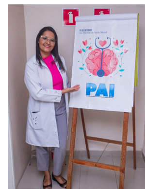
Evento foi uma realização da Comissão de Humanização

Os pacientes e a nutricionista da unidade, juntamente com alguns membros da Comissão