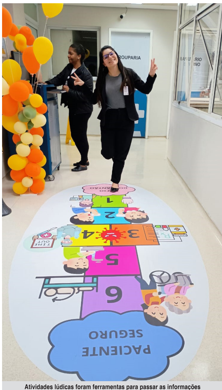
Atividades lúdicas foram ferramentas para passar as informações