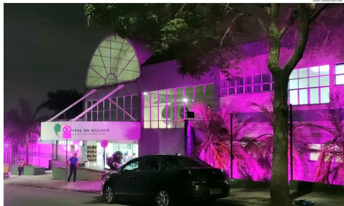
Prédio do Hospital da Mulher de Santo André recebeu iluminação temática

Na quinta-feira (24) foi realizada uma roda de conversa, às 15h, também na Casa da Gestante, sobre o tema "Câncer de Mama: Como Prevenir?". A discussão buscou esclarecer