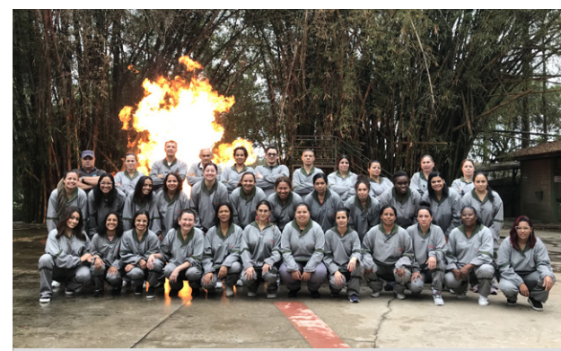
Mais de 30 colaboradores participaram da capacitação

namento abordaram a extinção de princípios de incêndio e a montagem de mangueiras para o combate a incêndios. Além disso, os participantes foram instruídos em manobras de primeiros socorros, incluindo a desobstrução de vias aéreas em adultos e crianças, massagem cardíaca e a identificação de hemorragias.