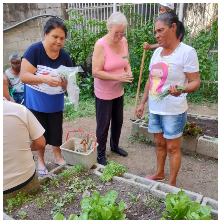
Horta é uma das oficinas terapêuticas de maior sucesso na unidade

Além do trabalho manual realizado no plantio e na colheita das hortaliças, elas podem ser utilizadas em atividades de culinária da unidade e também são divididas entre os participantes para que sejam consumidas com suas famílias.