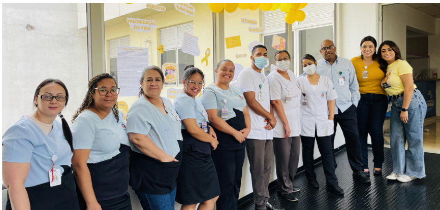
Colaboradores participaram de um desjejum festivo

Nos dias 27 e 30 de setembro, os colaboradores do Polo de Atenção Intensiva em Saúde Mental (PAI) da Baixada Santista, unidade gerenciada pela Fundação do ABC em parceria com o Governo do Estado de São Paulo, participaram de um café da manhã especial intitulado "Celebrando a Vida", em alusão ao Setembro Amarelo, campanha dedicada à prevenção do suicídio.