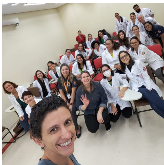
Evento reuniu as unidades da Rede de Reabilitação Lucy Montoro

Na Rede Lucy Montoro, o serviço de Nutrição tem como objetivo promover a