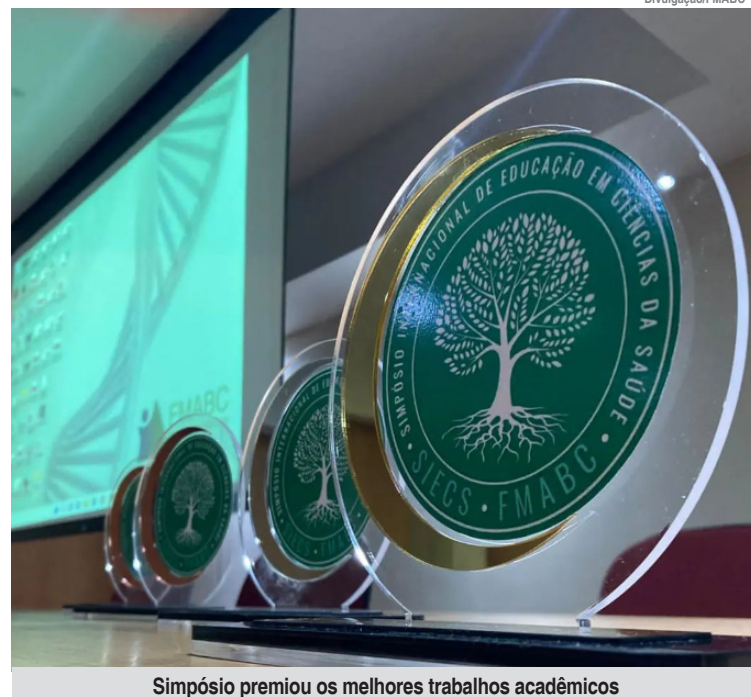
Simpósio premiou os melhores trabalhos acadêmicos

tiprofissional no tratamento da dor, fisioterapia pélvica, saúde mental, segurança do paciente, medicina integrativas e uso das redes sociais como ferramenta de cuidado. O SIECS é promovido anualmente por alunos e profissionais da Saúde dos cursos de Biomedicina, Enfermagem, Farmácia, Fisioterapia, Gestão Hospitalar, Nutrição, Psicologia, Radiologia e Terapia Ocupacional do Centro Universitário FMABC, com contribuição de profissionais renomados de todas