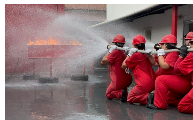
Foram formados 25 brigadistas no treinamento

A capacitação é uma exigência legal para o cumprimento da Norma Brasileira NBR 14276, da Associação Brasileira de Normas Técnicas (ABNT).