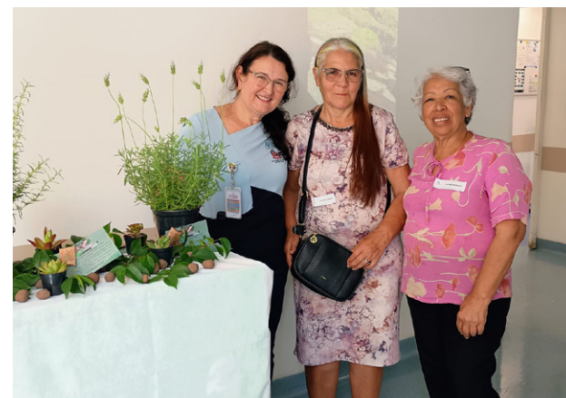
Colaboradores discutiram sobre a importância da vegetação

Durante a celebração, foram exibidas imagens que comparavam áreas arborizadas com regiões desmatadas, suscitando discussões sobre os impactos negativos da perda de vegetação, como a degradação do solo e a poluição do ar. “O Dia da Árvore