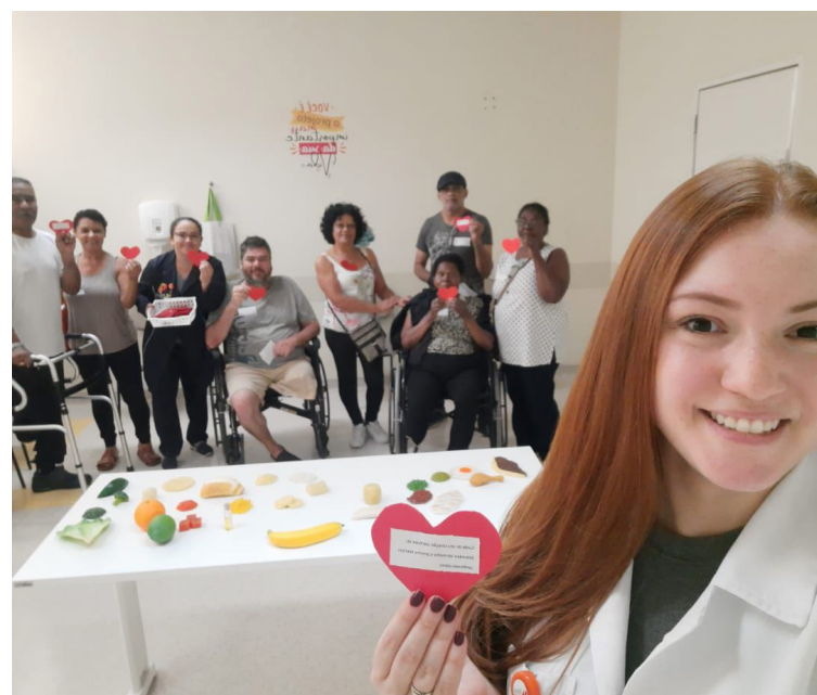
A campanha visa conscientizar sobre os perigos das doenças do coração