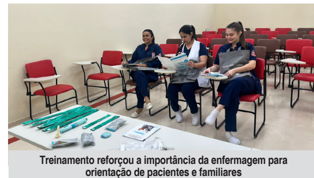
Treinamento reforçou a importância da enfermagem para orientação de pacientes e familiares

O treinamento reforçou a importância da enfermagem para orientação de pacientes