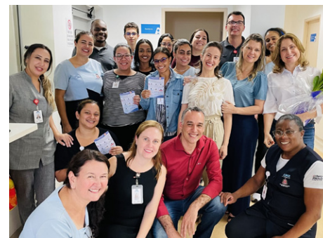
Participantes receberam orientações sobre como se cuidar em época com focos de fogo

Por fim, foram discutidas estratégias adicionais, como o uso de umidificadores, baldes com água ou toalhas umedecidas para melhorar a qualidade