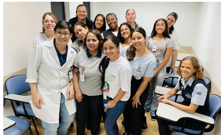
Os colaboradores se engajaram em atividades que mesclaram diversão e informação

Durante a SIPAT, diversas atividades foram realizadas para engajar os participantes de maneira divertida e instrutiva. O "Jogo das 3 Pistas", "Qual é a Música?", "Pescaria com a CIPAA" e