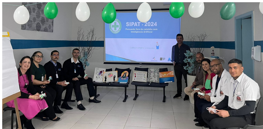
Bem-estar mental foi o foco da SIPAT deste ano do AME-PG

A Semana Interna de Prevenção de Acidentes do Trabalho (SIPAT) do Ambulatório Médico de Especialidades (AME) de Praia Grande, realizada entre os dias 16 e 20 de setembro, teve como foco central a saúde mental dos colaboradores. A unidade é gerenciada pela Fundação do ABC em parceria com o Governo do Estado de São Paulo.