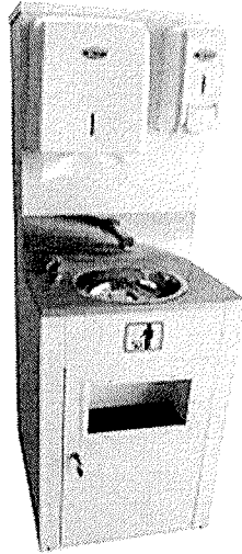
Figura 1. Modelo do lavatório a ser locado.

Observação 1: Conforme preconiza a RDC 50 da ANVISA, define-se a necessidade de disponibilizar lavatório ou pia para assepsia das mãos em ambiente de atendimento médico.