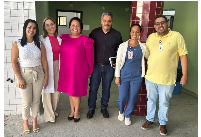
Equipe de gestão do HGA

Além disso, a FUABC dispõe de atendimento resolutivo e qualificado para o cuidado pré e pós-operatório