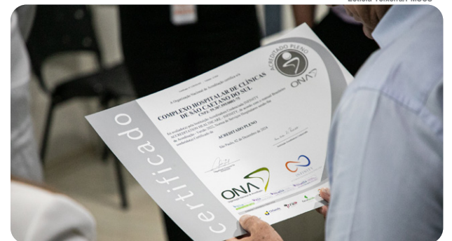
Complexo Hospitalar de Clínicas de São Caetano recebe certificação ONA2