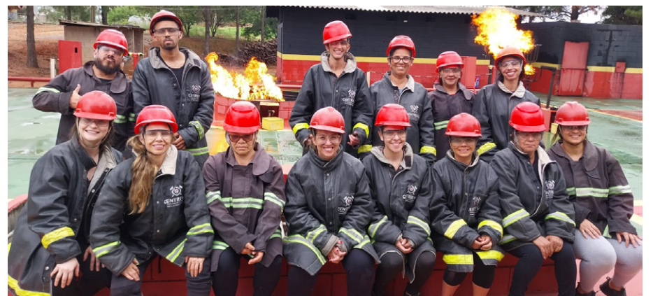
Aulas foram conduzidas no município de Valinhos/SP

Os participantes foram preparados para identificar riscos, orientar pessoas, acionar equipes especializadas e prestar suporte inicial em emergências médicas, como quedas, desmaios e crises convulsivas.