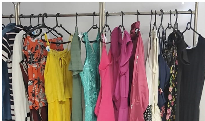
O ‘Breshopping’ foi montado a partir de itens de doações

O Breshopping do Emílio foi montado a partir de doações dos colaboradores da unidade, que entregaram roupas, brinquedos, sapatos e utensílios no geral. Em um ambiente descontraído, a proposta também reforçou a sustentabilidade, já que incentivou a