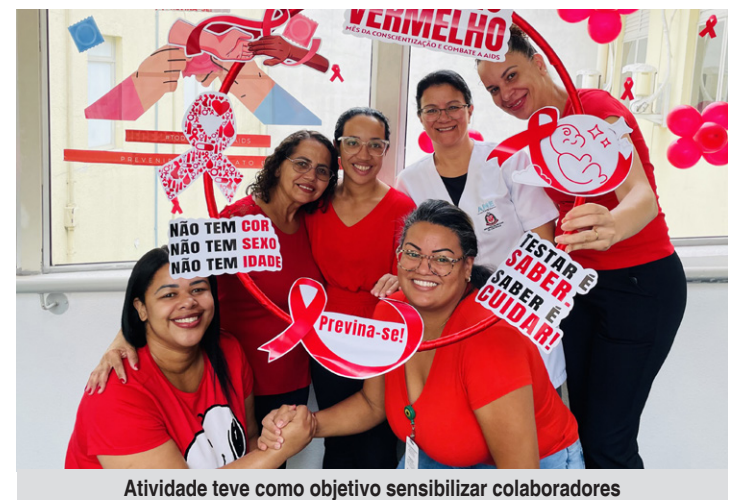
Atividade teve como objetivo sensibilizar colaboradores

hábitos saudáveis, com ênfase no uso de preservativos, na realização de testes e no acompanhamento médico. Também foram feitos esclarecimentos sobre o teste rápido para HIV, disponível nas redes de saúde primária, e sobre a importância da adesão ao tratamento e ao acompanhamento contínuo para uma vida saudável.