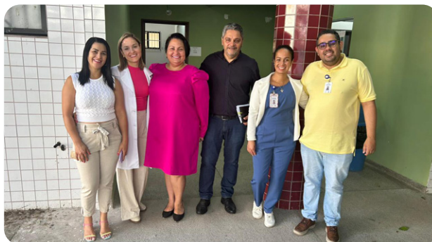
FUABC assume linha de cuidado de pacientes críticos no HGA