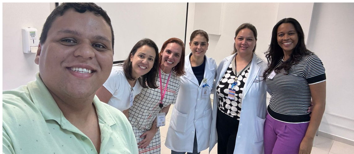
Equipes de Mogi e do Vale do Paraíba durante visita ao HMMC

No Pronto Atendimento Infantil, o processo começa com a acolhida e identificação do paciente com uma pulseira personalizada. Em seguida, ele é direcionado para uma sala exclusiva, onde a prescrição médica é destacada