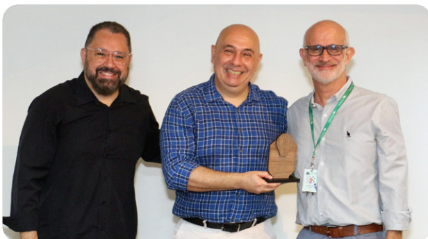
Trabalho da FMABC vence 4ª edição do concurso 'Feito pela Gente'

O vice-governador Felício Ramuth visitou, dia 8 de janeiro, o Centro de Reabilitação Lucy Montoro de Diadema, gerenciado pela Fundação do ABC em parceria com o Governo do Estado. O governante conheceu a área robótica da unidade, que recebeu recentemente o LokomatPro Sensation, aparelho de alta tecnologia destinado a pacientes com dificuldades de locomoção. Ao todo, pelo menos 150 pacientes em reabilitação são beneficiados com a tecnologia. Pág. 7