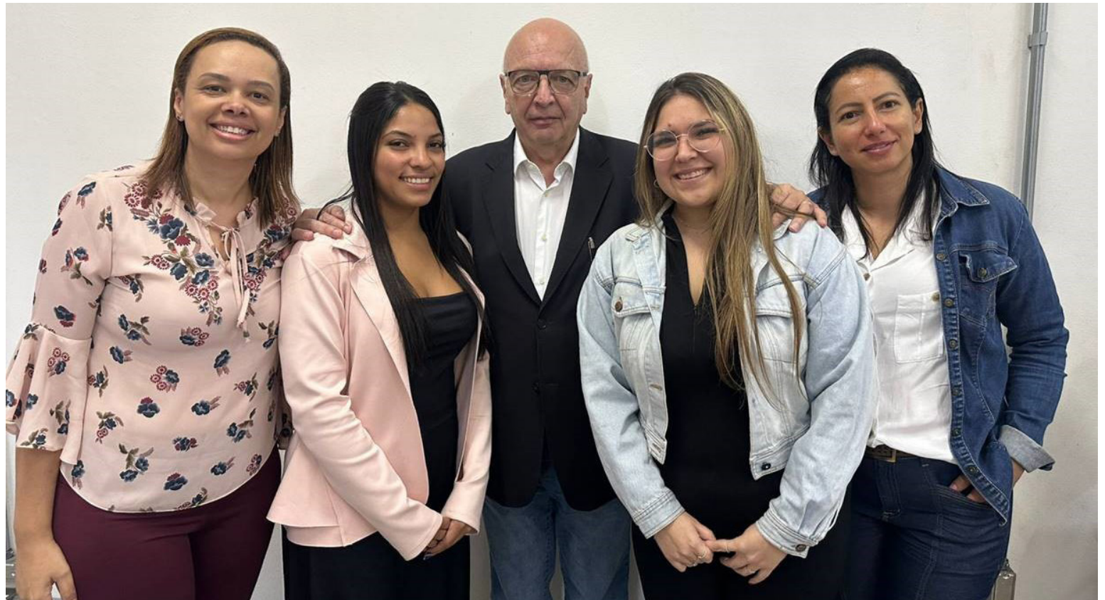
Equipe da Comissão de Residência Médica (Coreme) do Centro Universitário FMABC celebra marca histórica

Mais de 4 mil se inscreveram para participar do programa, considerado um dos 10 maiores do País