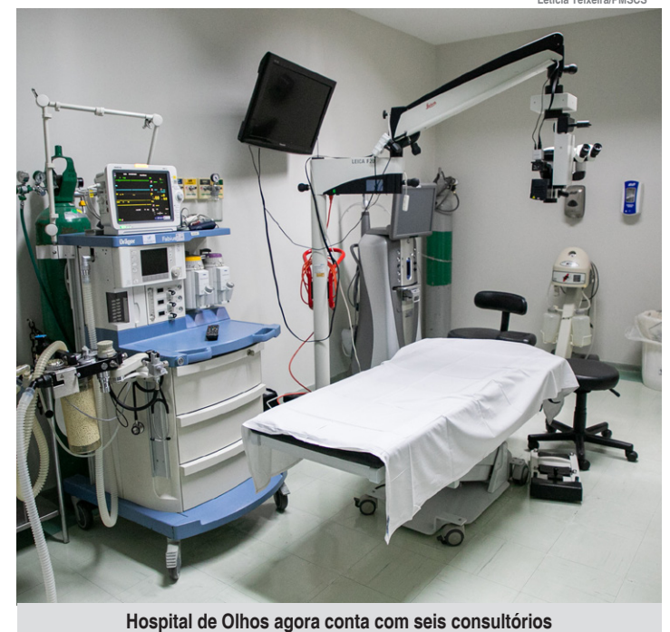
Hospital de Olhos agora conta com seis consultórios