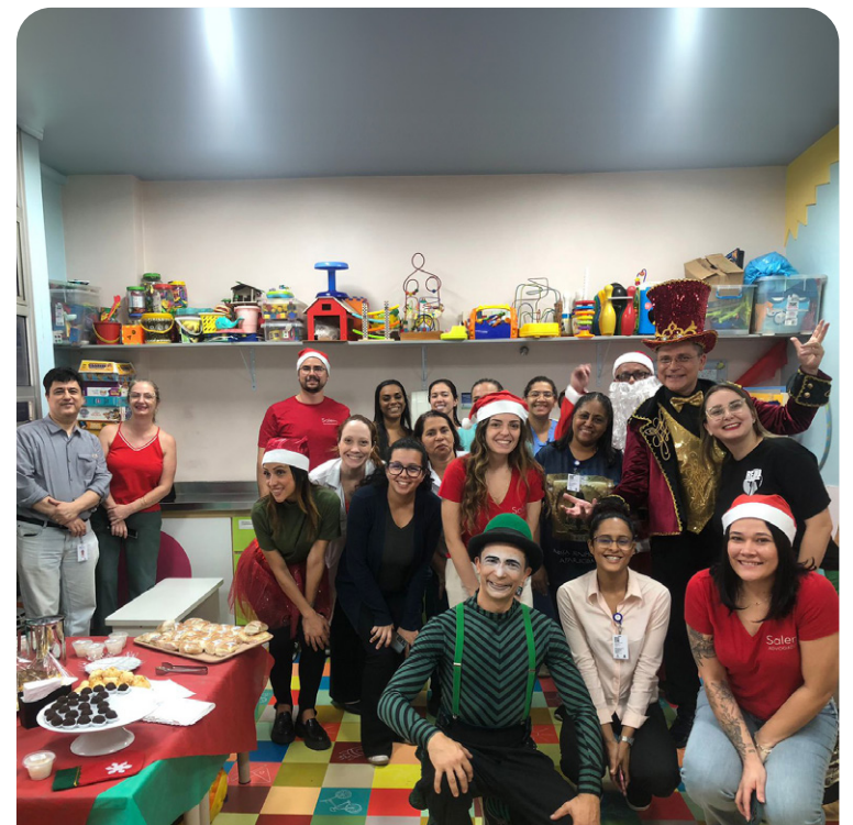
NATAL NO HGC - A Festa de Natal no Hospital Geral de Carapicuíba foi pura alegria! Teve música, mágico, malabarista e entrega de presentes para as crianças. Um momento especial de humanização para trazer sorrisos e esperança!

Os recursos captados a partir do brechó serão destinados ao atendimento das necessidades dos pacientes, como vestimenta, processo de desospitalização, entre outras.