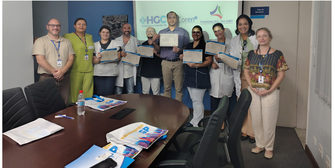
Conselheiros do Coren-SP, membros da comissão e da Diretoria da unidade