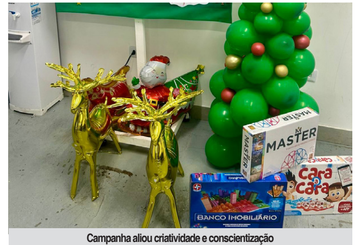
Campanha aliou criatividade e conscientização

O Complexo Hospitalar de Clínicas de São Caetano do Sul promoveu em dezembro ação especial “Natal da Segurança do Paciente”. Com o objetivo de fortalecer a importância das 6 Metas Internacionais de Segurança do Paciente, a iniciativa envolveu as equipes assistenciais, administrativas e terceiros em uma campanha que alia criatividade e conscientização.