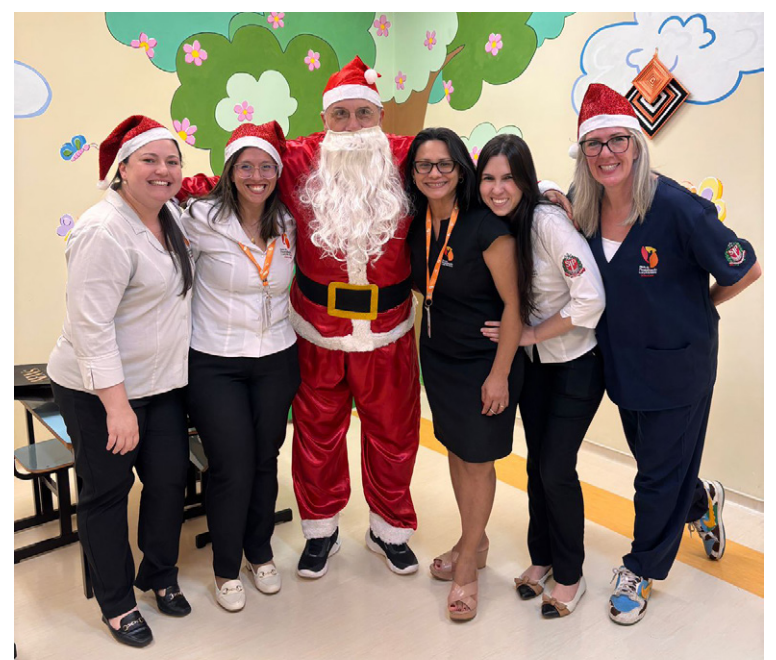
O ‘Bom Velhinho’ marcou presença na celebração natalina

Assim, o Show de Talentos 2024 reafirmou o papel do Centro de Reabilitação Lucy Montoro de Sorocaba como um espaço de acolhimento, superação e celebração da vida. O evento, além de promover momentos de alegria e emoção, reforçou a importância da inclusão e da valorização das histórias de cada paciente.