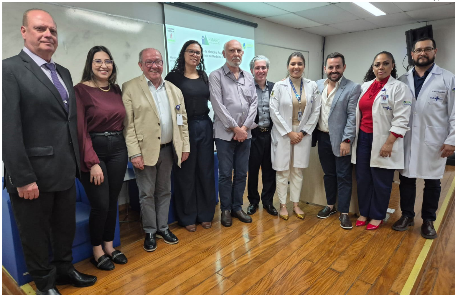
Funcionários e membros da Diretoria do CHMSA