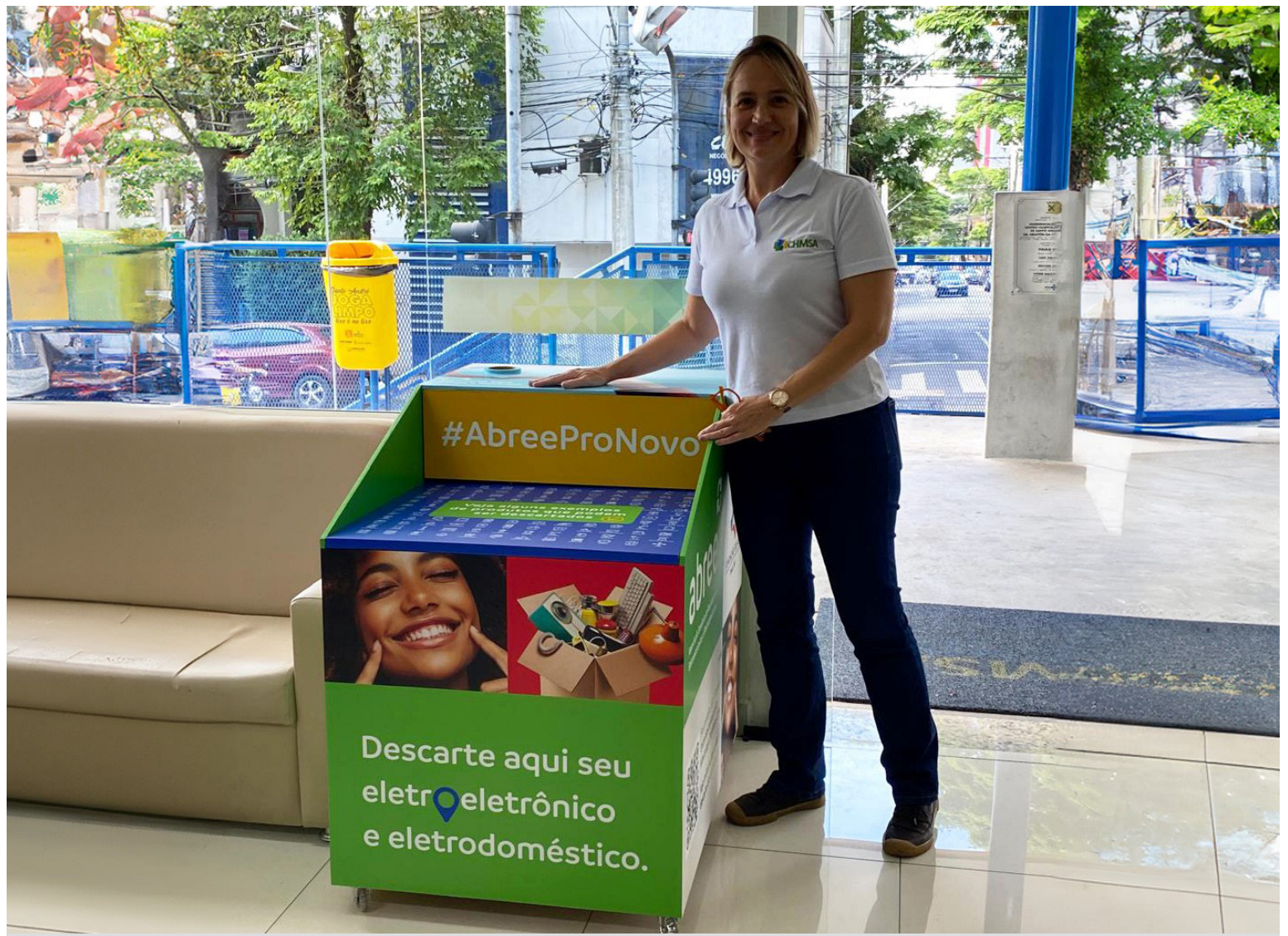
Centro Hospitalar Municipal de Santo André é um dos pontos de coleta

Além disso, ao garantir que esses resíduos sejam encaminhados corretamente para centros de reciclagem e reaproveitamento, o projeto contribui para a economia circular, fomentando a reutilização de materiais valiosos como o ouro, a prata e o cobre, presentes nos componentes eletrônicos. Esse ciclo reduz a necessidade de mineração e a extração de novos