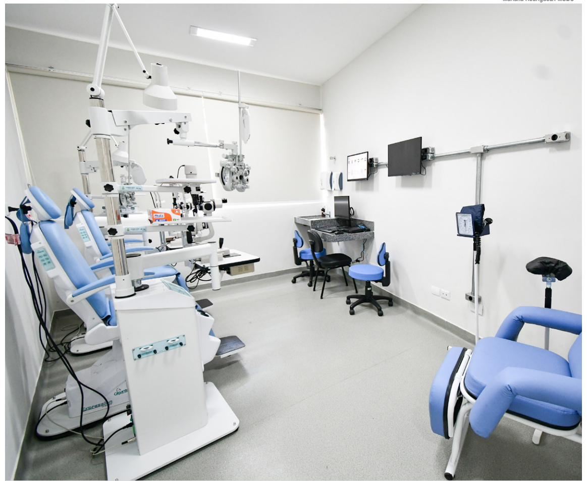
Unidade recebeu investimento de R$ 5,3 milhões

"Sabemos da alta demanda de pacientes de outras cidades nos equipamentos de São Bernardo. Nosso apoio é essencial para manter a qualidade do atendimento", afirmou o governador Tarcísio de Freitas.