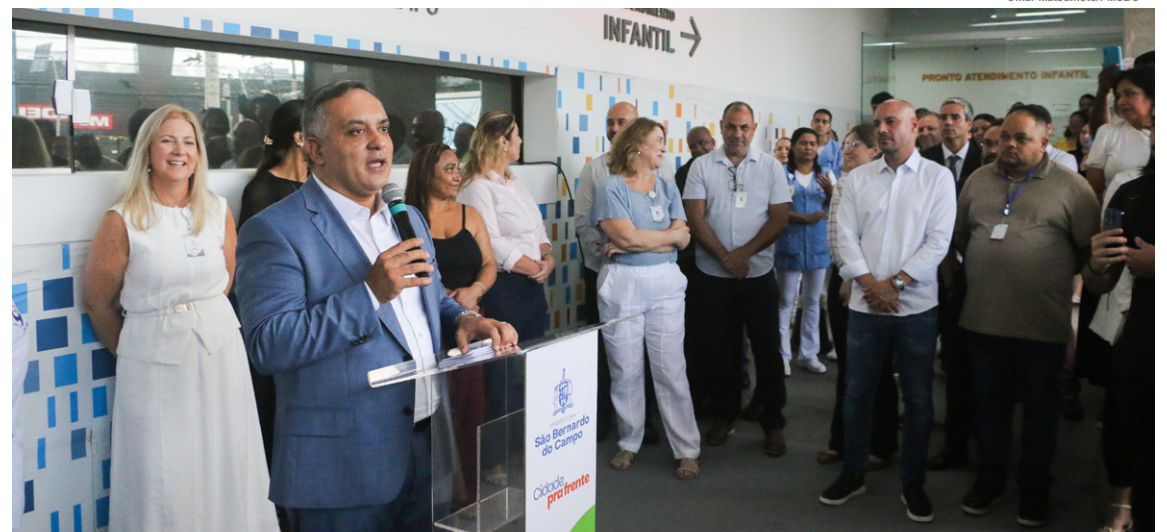
Prefeito Marcelo Lima discursa em frente ao Hospital de Urgência

O Chefe do Executivo Municipal garantiu que outros equipamentos de saúde passarão por adequações para garantir que os espaços estejam funcionando com 100% da força de trabalho,