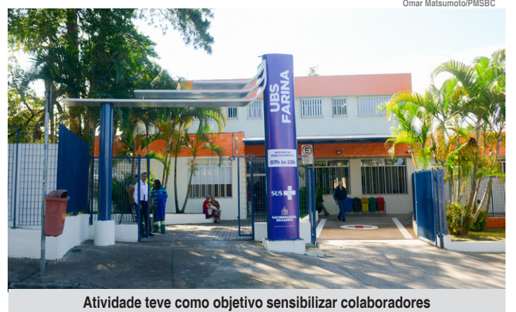
Atividade teve como objetivo sensibilizar colaboradores

São Bernardo possui 34 Unidades Básicas de Saúde, com 20 delas em funcionamento com horário estendido até às 22h pelo programa Saúde na Hora Certa. Juntos, os equipamentos são a porta de entrada da saúde pública no município, responsáveis pelos serviços de consultas médicas, exames laboratoriais, vacinação, atendimento odontológico,