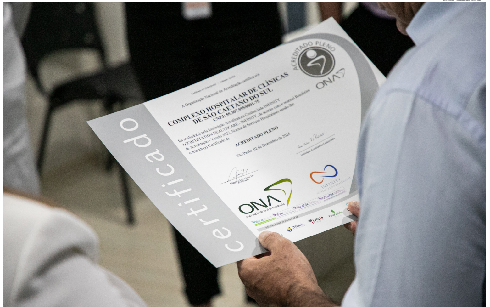
Complexo está entre os 7% dos hospitais brasileiros com o ONA 2

Com foco na segurança do paciente e melhoria contínua dos processos, a instituição passou por uma avaliação detalhada, através de uma IAC (Instituição Acreditada Credenciada) e sua equipe de avaliadores habilitada pela ONA. Eles buscaram evidências de conformidade com os padrões do Manual Brasileiro de Acreditação nas diversas áreas, incluindo a gestão