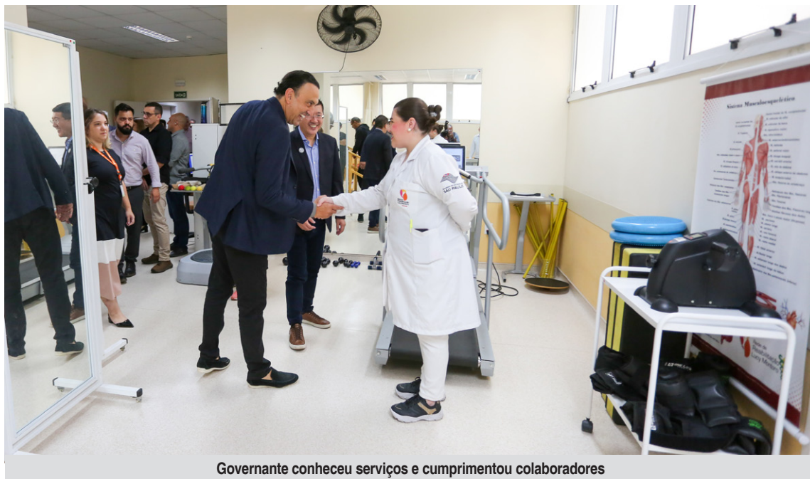
Governante conheceu serviços e cumprimentou colaboradores

em parceria com o Governo do Estado de São Paulo desde sua abertura, em 2021, a Rede de Reabilitação Lucy Montoro de Diadema realiza anualmente cerca