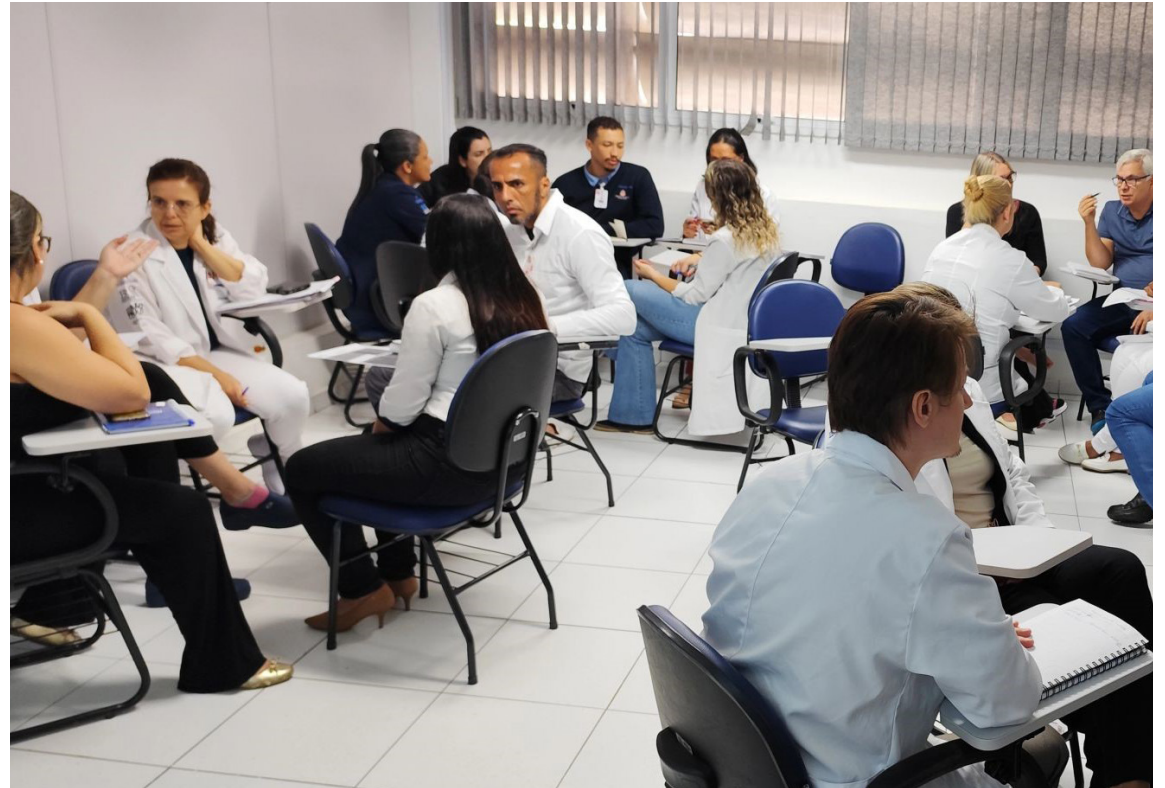
Grupos estão encarregados de levantar e analisar ideias de melhorias na unidade