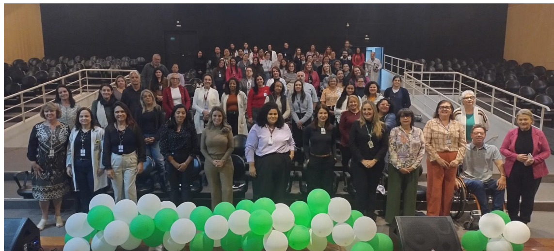
Evento aconteceu no auditório do Hospital Mário Covas

“A inclusão na fisioterapia significa garantir que todos, independentemente