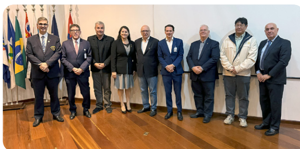
Hospital Mário Covas e Nardini recebem doações do Rotary Club