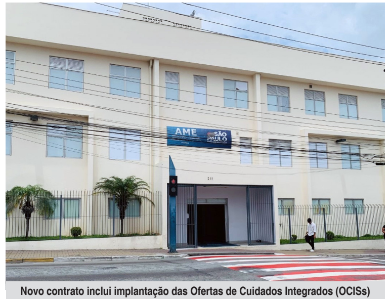
Novo contrato inclui implantação das Ofertas de Cuidados Integrados (OCISs)

Entre as novidades do novo contrato está a implantação das Ofertas de Cuidados Integrados (OCISs). São procedimentos de saúde agrupados, destinados a tratar uma necessidade específica do paciente e que buscam agilizar o acesso a consultas e exames, melhorar a qualidade do cuidado e reduzir filas de espera. A unidade prevê realizar 145 avaliações mensais.