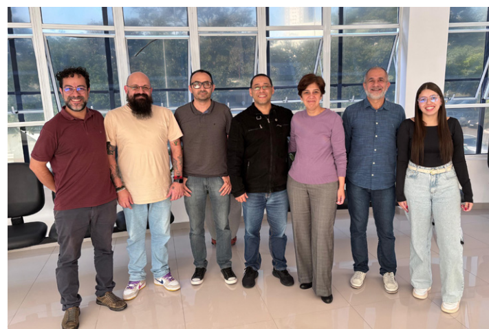
Equipes das áreas de Tecnologia da Informação e Financeiro da FUABC

A implantação do sistema ocorreu entre julho e dezembro de 2024, sendo inicialmente adotado pela Fundação do