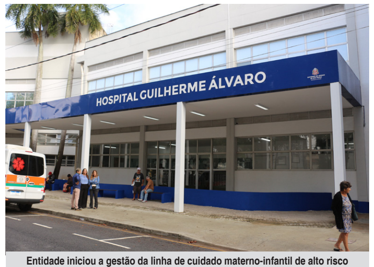
Entidade iniciou a gestão da linha de cuidado materno-infantil de alto risco

O atendimento fracionado às sextas-feiras, sábado e domingo foi proposto mediante solicitação da Secretaria de Estado da Saúde, com objetivo de complementar o quadro de recursos humanos de médicos e enfermeiros nas áreas mencionadas.