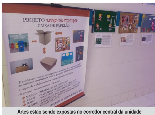
Artes estão sendo expostas no corredor central da unidade

A ação integra um ciclo mensal de temas que começou em março e segue com “Galáctico: Universo e Planetas” em maio. Junho será dedicado à montagem final dos volumes e uma tarde de autógrafos, quando o livro será disponibilizado no Espaço Infantil da unidade.