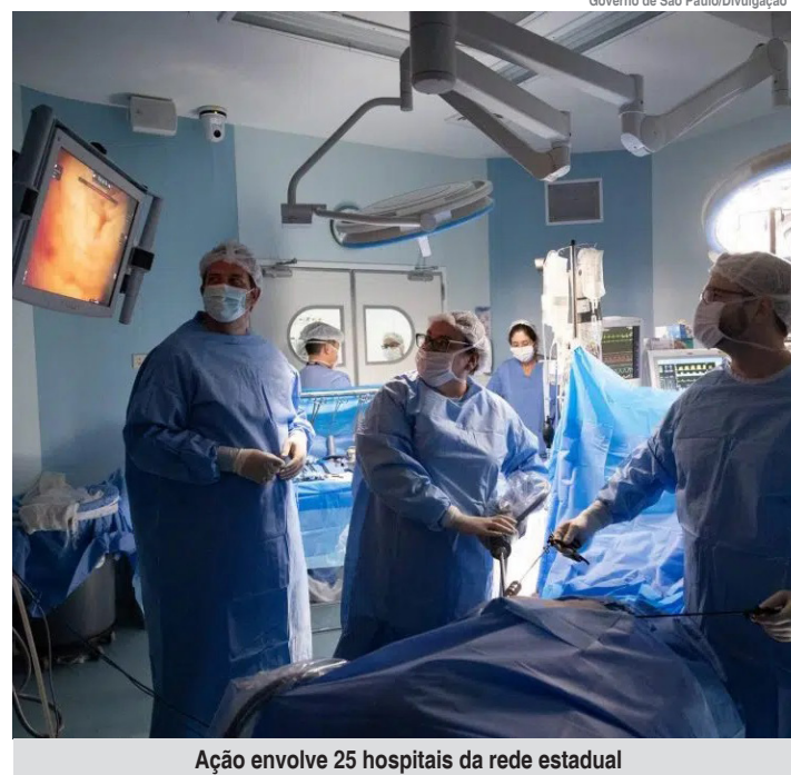
Ação envolve 25 hospitais da rede estadual

Participam da iniciativa hospitais estaduais (Diadema, Sapopemba, Vila Alpina, Dr. Albano da Franca Rocha