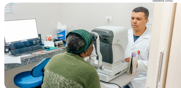
Centro cirúrgico do Hospital de Olhos é inaugurado em São Bernardo