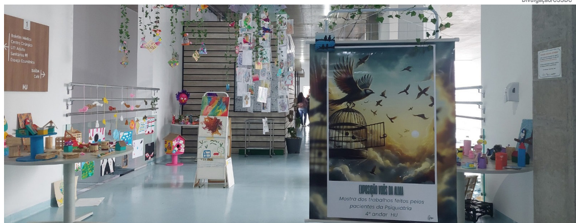
Ex-pacientes criaram todas as obras da exposição

O Nutrarte - Núcleo de Trabalho em Arte é um dispositivo da Rede de Atenção