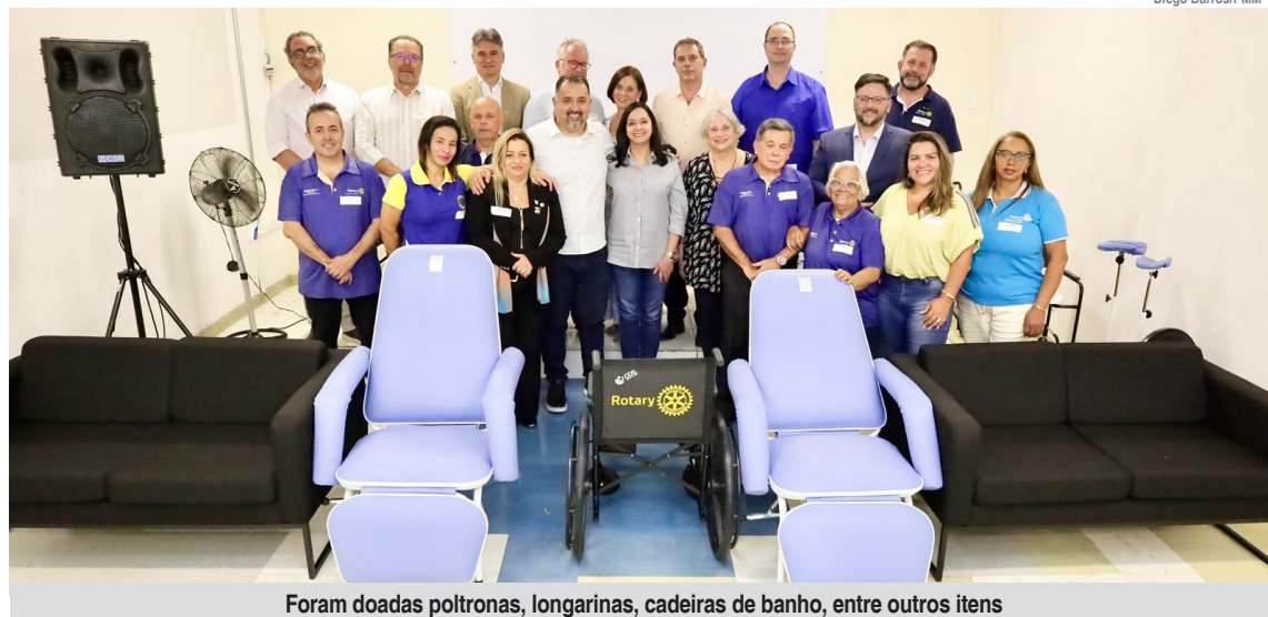
Foram doadas poltronas, longarinas, cadeiras de banho, entre outros itens