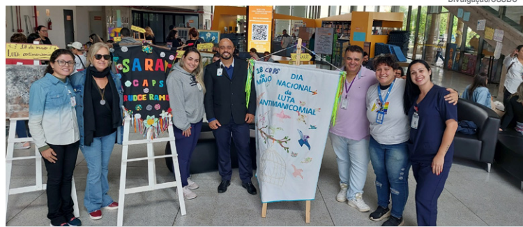
Equipamentos de saúde mental, como os CAPS, participaram do evento

Participaram do evento os nove Centros de Atenção Psicossocial