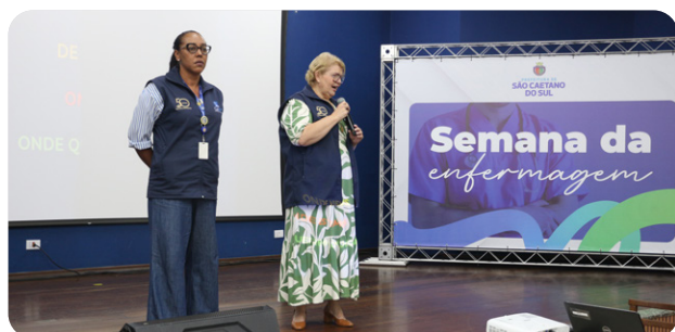
FUABC celebra Semana da Enfermagem com homenagens aos profissionais

A Fundação do ABC está reforçando sua presença no Sistema Único de Saúde (SUS) estadual com a conquista de quatro novos contratos de gestão firmados com o Governo do Estado de SP. O destaque é a estreia no AME Itu, que passa a ser o oitavo AME gerido pela instituição. Além disso, a FUABC venceu os chamamentos para gestão do AME Itapevi e do Instituto de Infectologia Emílio Ribas II (Guarujá), que permanecem sob administração da FUABC. Na Baixada Santista, a entidade assumiu novo serviço no Hospital Guilherme Álvaro, em Santos. Págs. 4 e 5