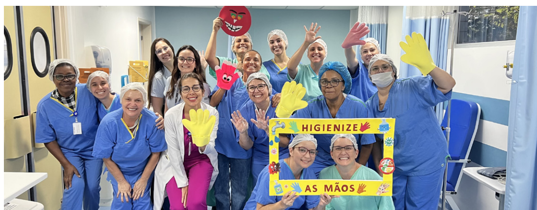
AME Sorocaba organizou atividades educativas

proposto pela OMS e endossado pela Agência Nacional de Vigilância Sanitária (Anvisa). Segundo a equipe da unidade, a adesão às boas práticas é fundamental para garantir a segurança dos pacientes e dos profissionais, especialmente em um contexto em que as infecções relacionadas à assistência à saúde ainda representam um desafio global.