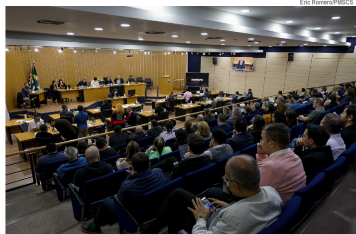
Prestação de contas aconteceu na Câmara Municipal

Procedimentos clínicos (consultas, tratamentos e terapias individualizadas) somaram 720.999. Ações de prevenção e promoção de Saúde (206.058), cirurgias ambulatoriais (5.184), internações (3.897) e fornecimento de órteses, próteses e materiais especiais (506) completam a relação.