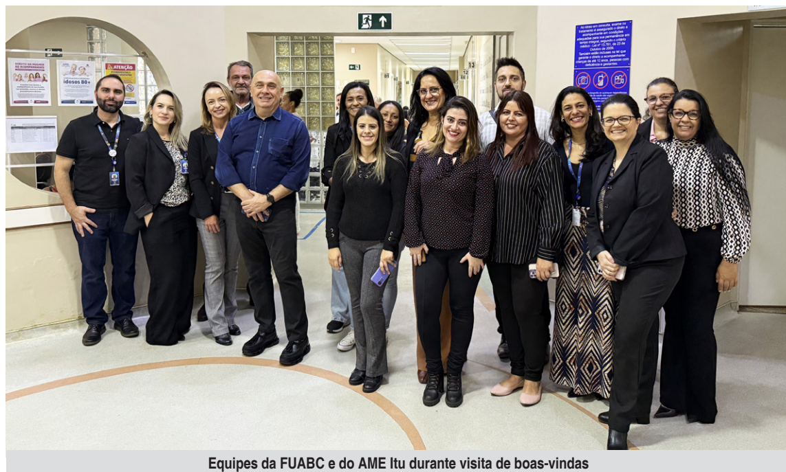
Equipes da FUABC e do AME Itu durante visita de boas-vindas

No campo cirúrgico serão realizados cerca de 370 procedimentos por mês, alcançando 4,4 mil cirurgias anuais entre PAAF (Punção Aspirativa por Agulha Fina) de tireoide, infiltrações, biópsias de pele, cauterização de lesões cutâneas, exérese de tumor de pele, entre outras. As especialidades cirúrgicas compreendem as áreas de Endocrinologia, Dermatologia, Ortopedia e Reumatologia.