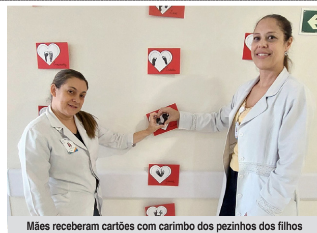
Mães receberam cartões com carimbo dos pezinhos dos filhos

A iniciativa foi organizada por uma equipe multiprofissional, com foco no cuidado humanizado e no apoio emocional às pacientes e suas famílias. A celebração reforça o compromisso do hospital com a valorização da maternidade e o fortalecimento dos laços afetivos, mesmo em meio aos desafios da internação.