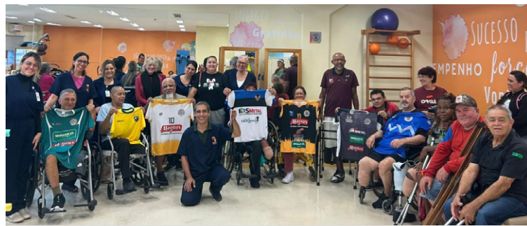
Palestra reforçou que esportes podem transformar vida de deficientes