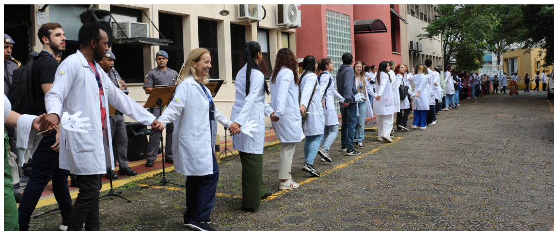
Abraço simbólico mobilizou centenas de colaboradores

Na sequência do evento, houve apresentação da Banda Regimental da Polícia Militar - CPI-6 e a tradicional “Mostra de Talentos”, que em sua 3ª