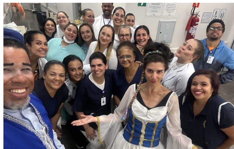
Peça teatral foi montada para conscientizar sobre a prática

Nos dias 26 e 27 de maio, uma peça teatral interativa adaptada do clássico "Romeu e Julieta" foi apresentada em diferentes setores do hospital. De forma lúdica, a encenação mostrou como a personagem Julieta se infecta por conta da negligência de Romeu quanto à higienização das mãos. A apresentação teve cerca de 30 minutos de duração e detalhou os cinco momentos essenciais da técnica correta de higienização, com o objetivo de facilitar a memorização dos