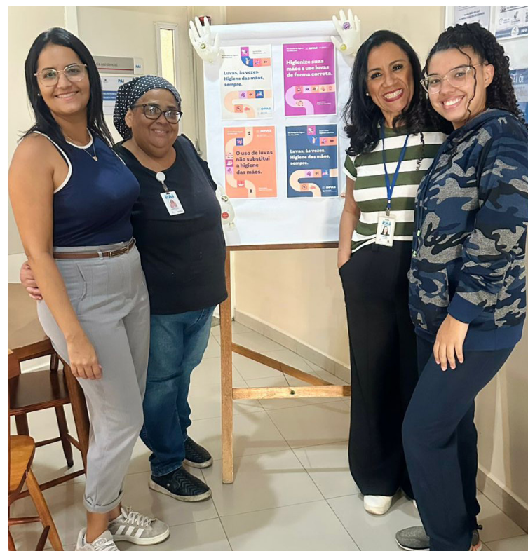
Ação reforçou a importância de lavar as mãos no ambiente hospitalar

Para incentivar a adoção dessas práticas, a equipe distribuiu minifrascos de álcool em gel, facilitando