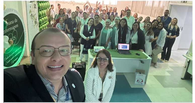
Evento foi promovido no auditório da unidade

Além de valorizar os profissionais, o evento reforçou o papel essencial da enfermagem na promoção, prevenção e reabilitação da saúde, com atuação ética, autônoma e comprometida com o cuidado humano.