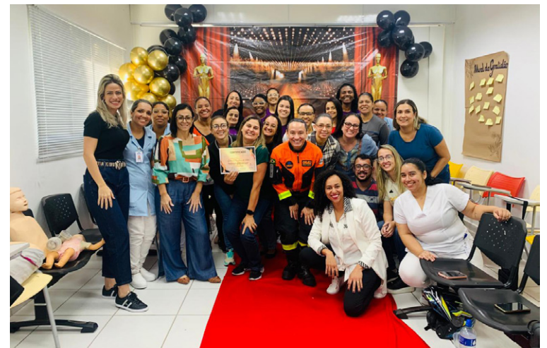
O "Dia do Oscar da Enfermagem" teve premiações por categorias

O encerramento foi marcado pelo "Dia do Oscar da Enfermagem", com premiações por categorias e um café da manhã especial. Além disso, a equipe participou de um treinamento prático de PCR (Parada Cardiorrespiratória), conduzido por uma enfermeira do GRAU (Grupo de Resgate e Atenção às Urgências e Emergências), reforçando a importância da capacitação contínua.