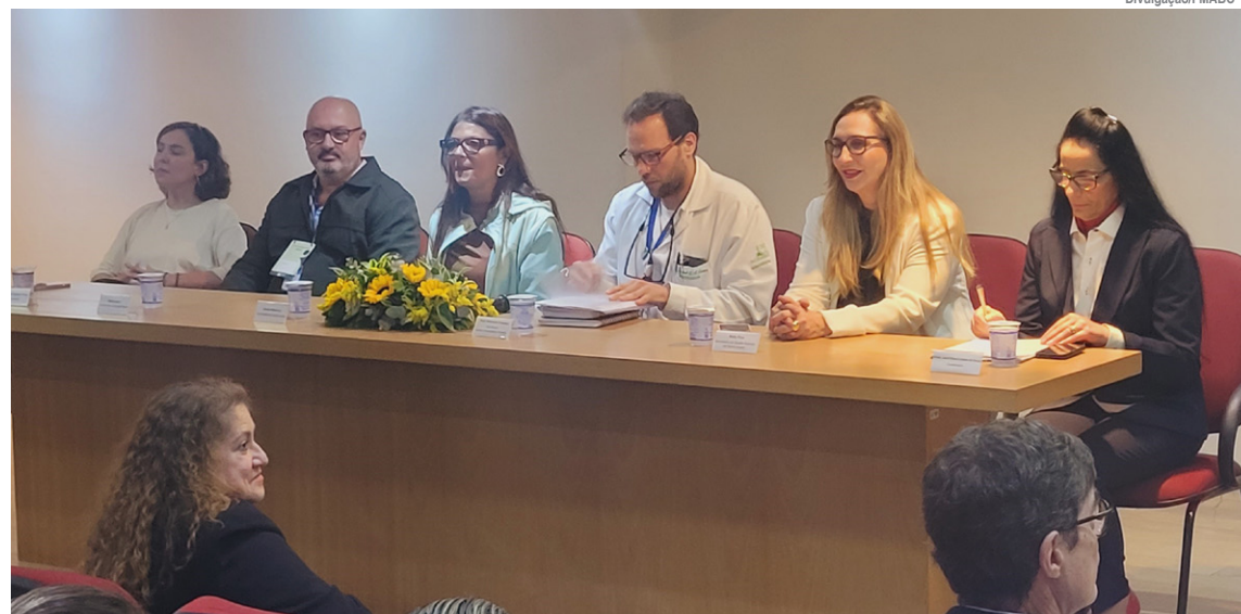
Evento reuniu profissionais da saúde do município e especialistas em TEA

O encontro contou com palestras que ressaltaram a importância de reconhecer que todas as pessoas têm necessidades específicas, independentemente de apresentarem ou não o transtorno, e demonstraram que indivíduos diagnosticados com TEA têm plena capacidade de serem cidadãos atuantes, desde que recebam acompanhamento adequado e tenham