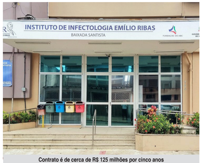
Contrato é de cerca de R$ 125 milhões por cinco anos

O instituto recebeu em 2023 a acreditação Nível 1 da Organização Nacional de Acreditação (ONA), selo que avalia a segurança do paciente e a qualidade da assistência prestada.