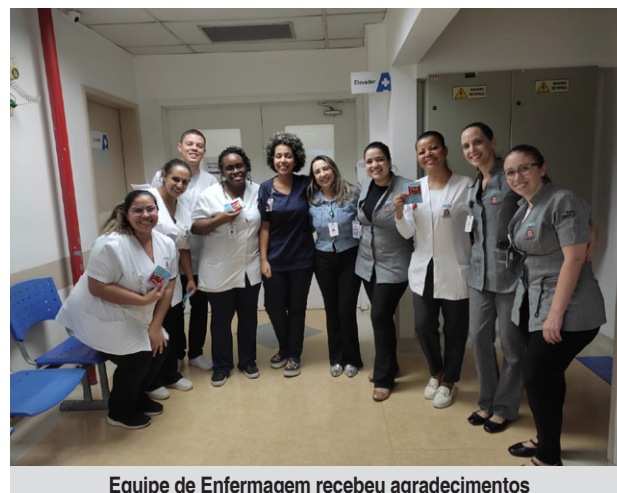
Equipe de Enfermagem recebeu agradecimentos

O AME de Itapevi celebrou o Dia Internacional da Enfermagem com uma homenagem aos profissionais que são pilares essenciais no atendimento à saúde. A unidade preparou uma ação especial para reconhecer o trabalho diário da equipe, destacando a dedicação e humanização no cuidado aos pacientes.