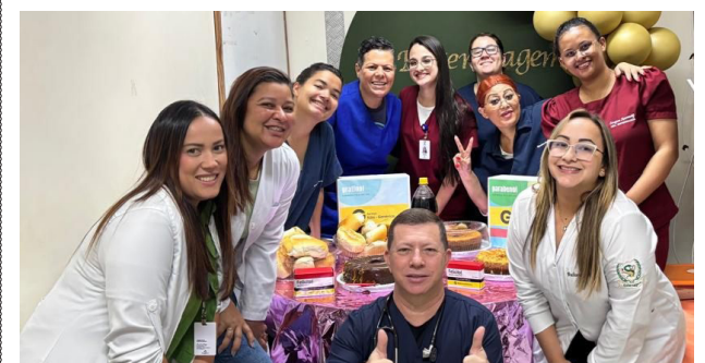
FUABC gerencia o PS e a UTI do Hospital Geral de Guaianases

Em celebração à Semana da Enfermagem, a Fundação do ABC realizou uma programação especial para homenagear os profissionais que atuam na linha de frente do cuidado à saúde no Pronto-Socorro e na Unidade de Terapia Intensiva do Hospital Geral Jesus Teixeira da Costa, em Guaianases, que fica na Zona Leste da capital paulista. A iniciativa teve como destaque um café da manhã em ambiente