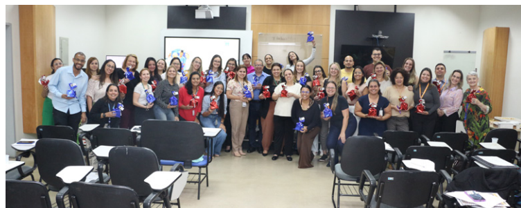
Equipe integrante do último ciclo de treinamentos da Qualidade da FUABC

Foram abordados temas como: “Balance Scorecard (BSC)”, ferramenta que auxilia na tradução e implementação de estratégias institucionais por