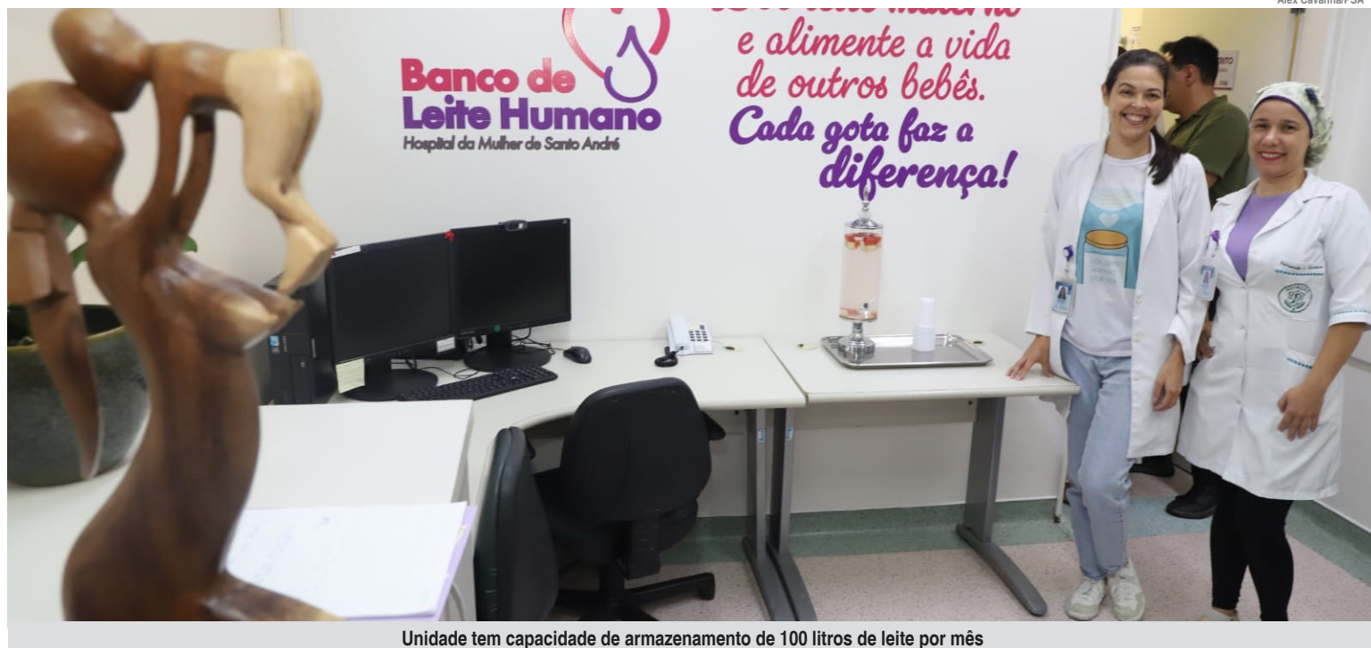
Unidade tem capacidade de armazenamento de 100 litros de leite por mês

Sua capacidade de armazenamento é de 100 litros de leite por mês, sendo referência também para as cidades de Mauá, Ribeirão Pires, Rio Grande da Serra, São Caetano do Sul e bairros de parte da Zona Leste de São Paulo que fazem divisa com Santo André. Em média, são doados 65 litros de leite por mês.