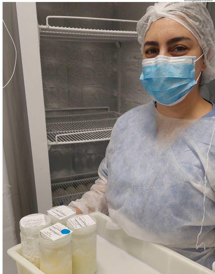
Todo o leite recebido é testado, pasteurizado e preparado