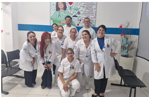
Semana contou com palestras sobre segurança do paciente

O AME Praia Grande realizou, entre 12 e 16 de maio, a Semana da Enfermagem, com programação dedicada a atualizações técnicas, debates e reconhecimento aos profissionais que atuam na linha de frente da Saúde. Um dos destaques do evento foi o 1º Fórum de Enfermagem da unidade, com palestras sobre segurança do paciente ministradas pelas enfermeiras locais.