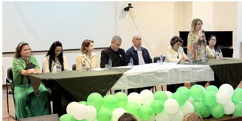
Mesa solene com autoridades na abertura do evento