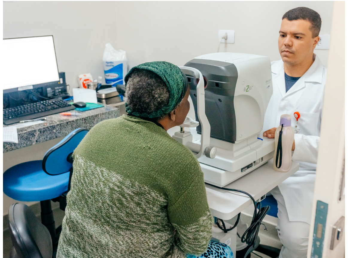
Unidade foi inaugurada em dezembro de 2024