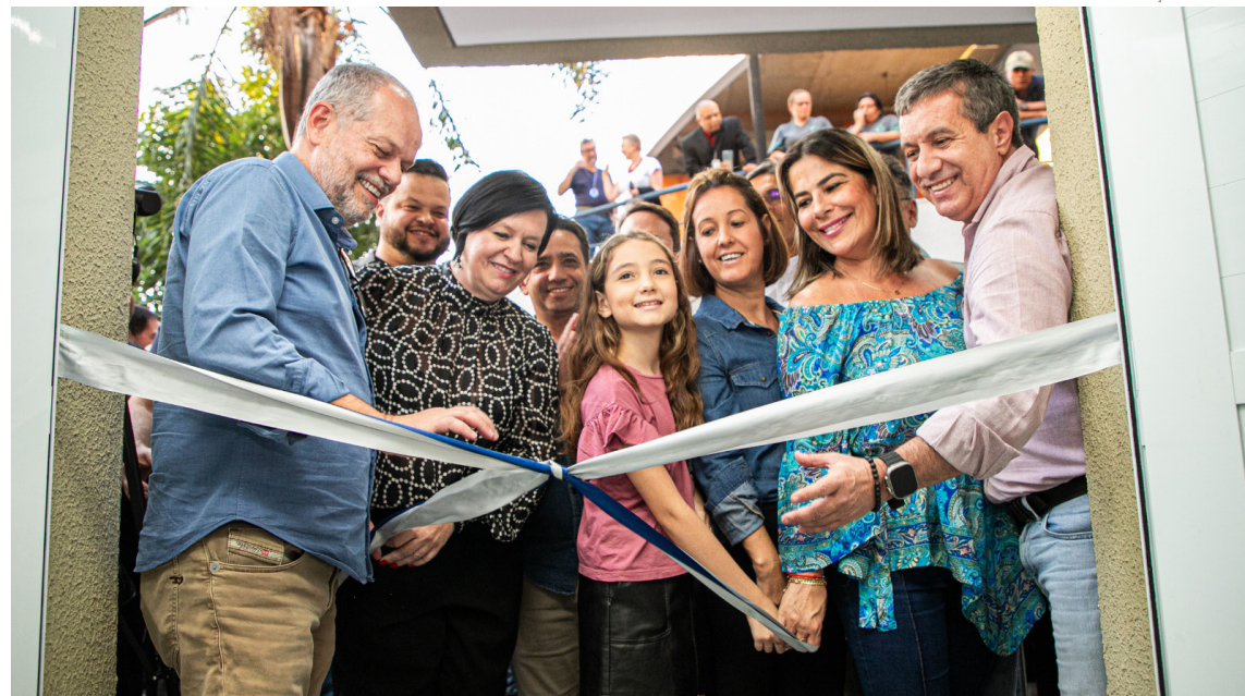
Unidade é voltada ao atendimento de pessoas com HIV/AIDS, hepatites virais, tuberculose e outras infecções

consultórios médicos, um consultório odontológico e salas de vacinação, triagem, coleta de exames, farmácia e esterilização. A expectativa é de que sejam realizados cerca de 1.400 atendimentos por mês, entre consultas, coletas de exames e dispensação de medicamentos.