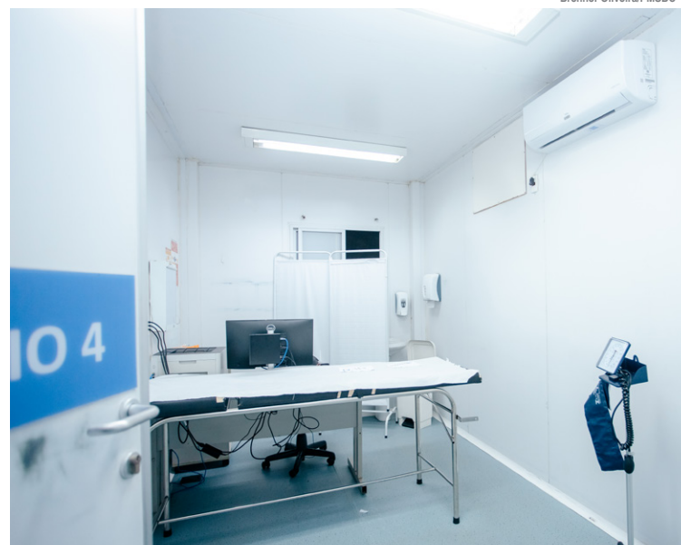
Investimento para a reforma será de cerca de R$ 4 milhões