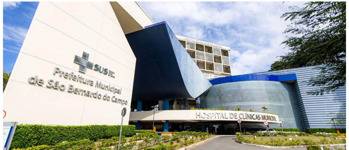
Proposta foi desenvolvida pela Secretaria de Saúde, com apoio da Pasta de Projetos e Obras

O projeto foi aprovado na categoria destinada ao poder público e serviços