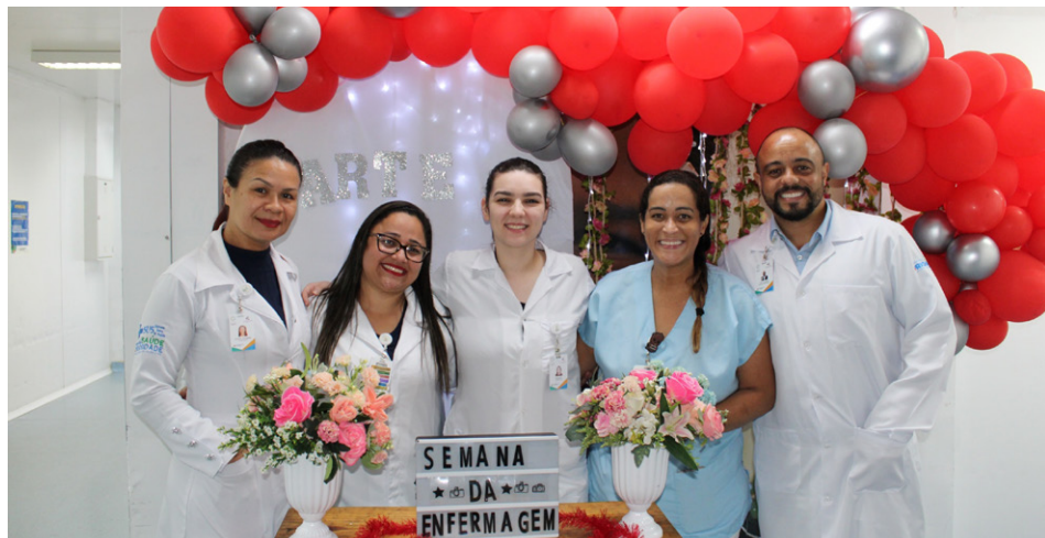
Evento celebrou Dia do Técnico e Auxiliar de Enfermagem

Na manhã de 21 de maio, a UPA Demarchi, em São Bernardo do Campo, realizou um café da manhã especial em homenagem aos profissionais de enfermagem da unidade. A ação celebrou o Dia do Técnico e Auxiliar de Enfermagem, comemorado em 20 de maio,