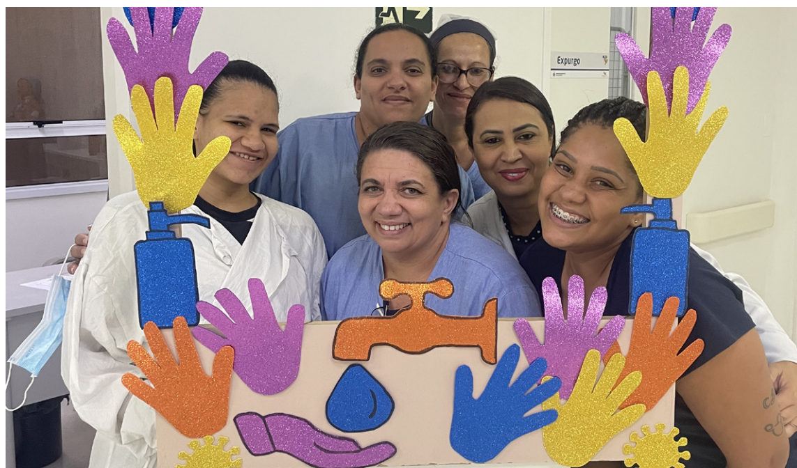
Correta lavagem das mãos controla a disseminação de infecções

Além disso, um webinar promovido pela Organização Pan-Americana da Saúde (OPAS) foi realizado no dia 5 de maio, reforçando o tema deste ano: “Luvas, às vezes. Higiene das mãos, sempre”. A campanha no HC-SBC também estabeleceu que todo dia 5 de cada mês será dedicado a reforçar essa prática, alinhando-se aos 5 Momentos da Higiene das Mãos e à Meta 5 da Segurança do Paciente, ambos protocolos da Organização Mundial da Saúde (OMS).