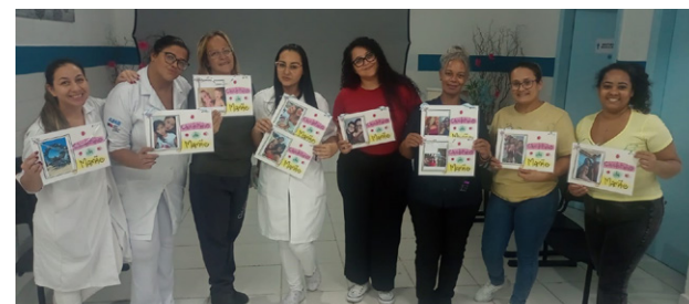
Colaboradoras que são mães receberam foto dos seus filhos

que os funcionários escrevessem mensagens de carinho para as colegas mães, em um formato inspirado no tradicional “correio elegante”. As homenagens foram entregues posteriormente, gerando momentos de gratidão e alegria entre as equipes.