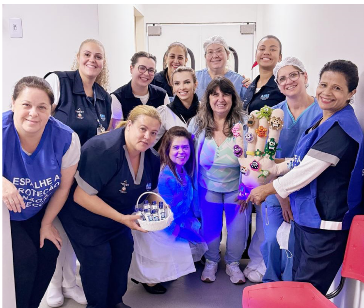
Tema da campanha foi "O que os olhos não veem, o paciente sente"

No AME Mauá, o tema da campanha foi "O que os olhos não veem, o paciente sente". A iniciativa, organizada pelo Núcleo de Segurança do Paciente e pelo Serviço de Controle de Infecção Relacionada à Assistência à Saúde (SCIRAS), teve como objetivo conscientizar os colaboradores sobre a importância da higienização correta das mãos como medida essencial para prevenir as IRAS.