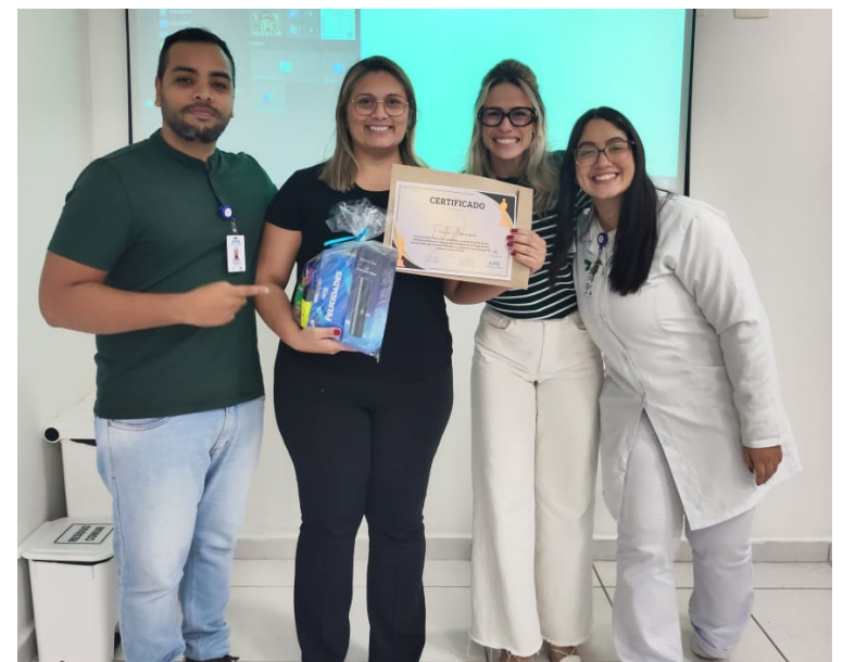
Reconhecimento e valorização

As Farmácias de Medicamentos Especializados, conhecidas popularmente como "Farmácia de Alto Custo", são estabelecimentos farmacêuticos responsáveis pela dispensação de medicamentos de elevado valor e complexidade, ou que exigem cuidados especiais no manejo. Esses medicamentos são geralmente destinados ao tratamento de doenças crônicas, raras ou de condições específicas que requerem terapias avançadas.