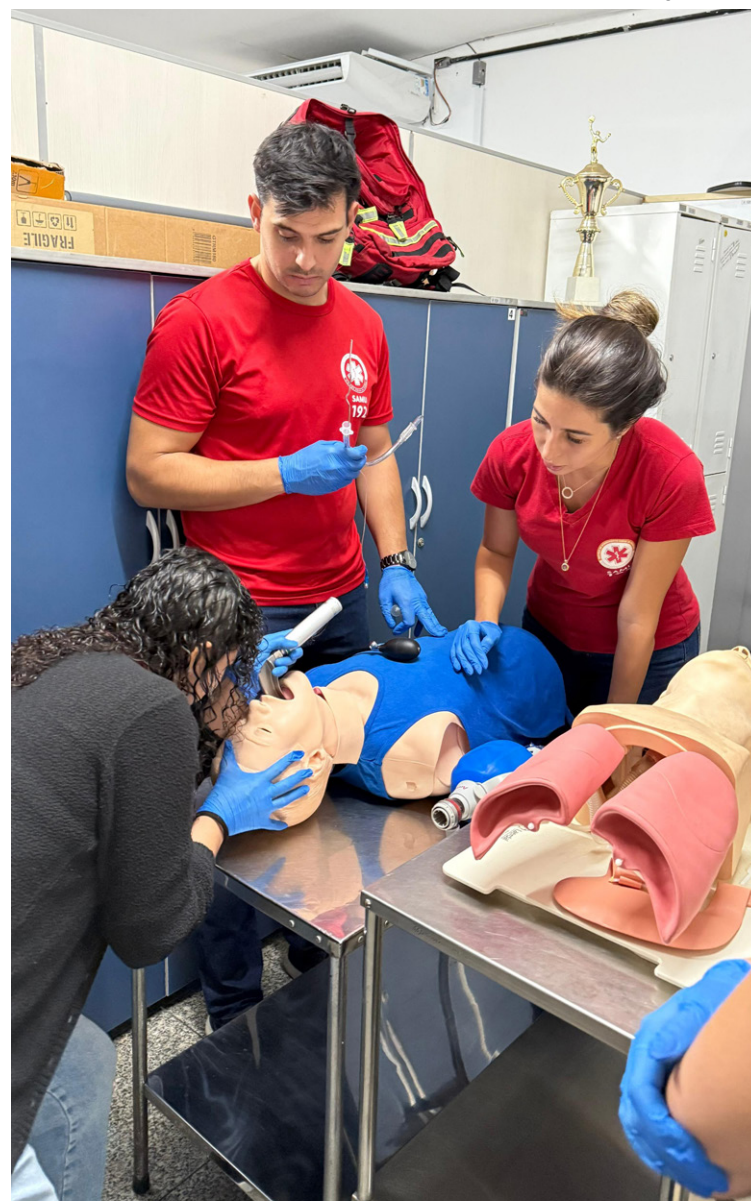
Capacitação teve estações práticas com uso de manequins