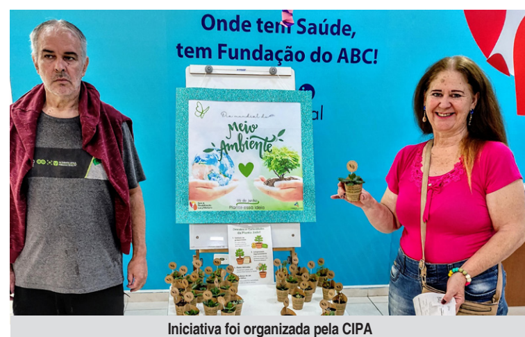
Iniciativa foi organizada pela CIPA

A escolha das espécies frutíferas não foi casual, uma vez que estas árvores contribuirão futuramente para a criação de um ambiente mais verde e produtivo dentro do centro de reabilitação, além de oferecer benefícios terapêuticos aos pacientes através do contato direto com a natureza.