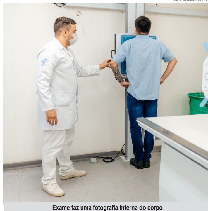
Exame faz uma fotografia interna do corpo