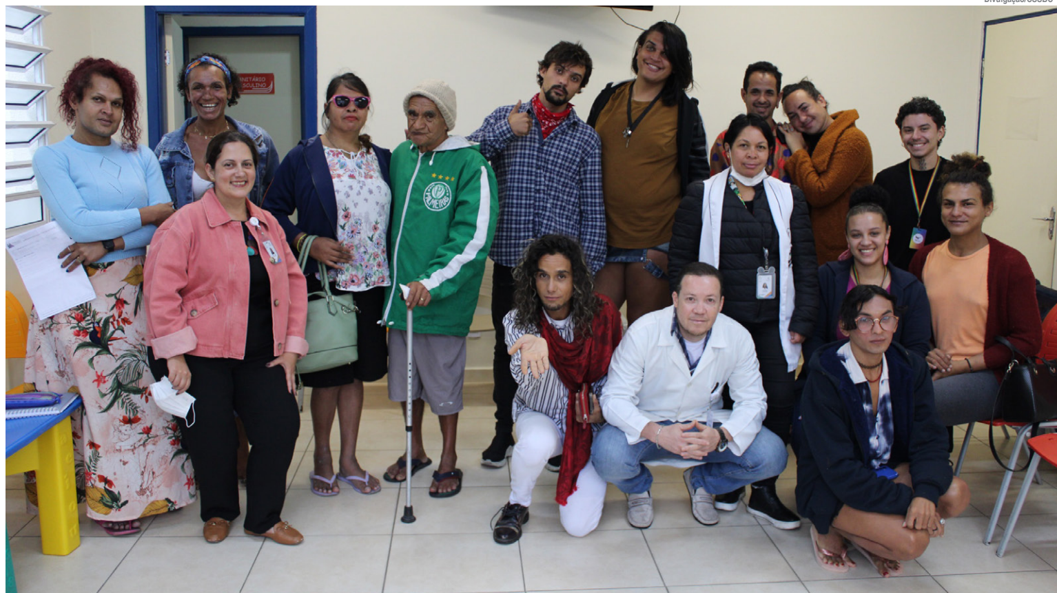
Encontros mensais são promovidos em parceria com a Casa Neon Cunha