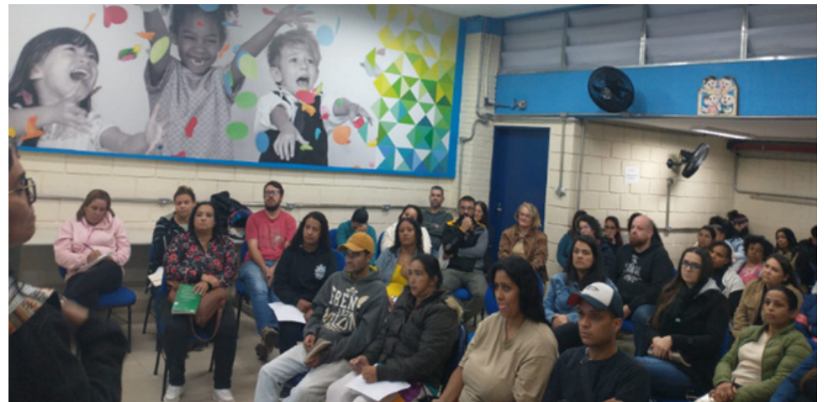
Pais recebem orientações coletivas

prática chamada "Jogo das 4 cores", que consiste em colorir um mapa ou figura usando apenas quatro matizes diferentes, sem que cores iguais se toquem em regiões adjacentes. Enquanto os pais participavam da atividade, as crianças que os acompanharam permaneceram em outra sala, trabalhando as mesmas funções executivas e de atenção através de jogos apropriados para sua idade.