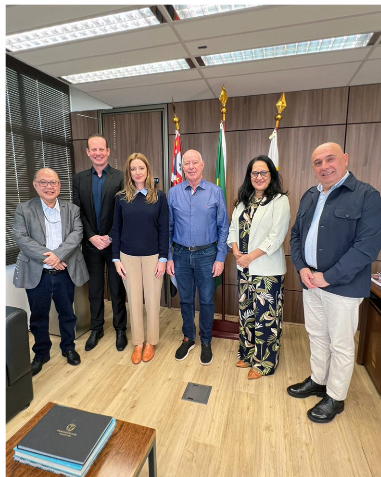
Reunião selou compromisso de trabalho conjunto

Inaugurado em 2010, o AME Itu é a principal referência ambulatorial para a população dos municípios de Araçariguama, Araçoiaba da Serra, Itu, Mairinque, Porto Feliz e Salto, sendo também referência para outros 14 municípios vinculados à Diretoria Regional de Saúde (DRS XVI) de Sorocaba.