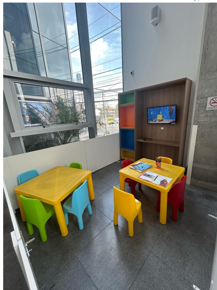
Hospital conta com local especial para receber as crianças