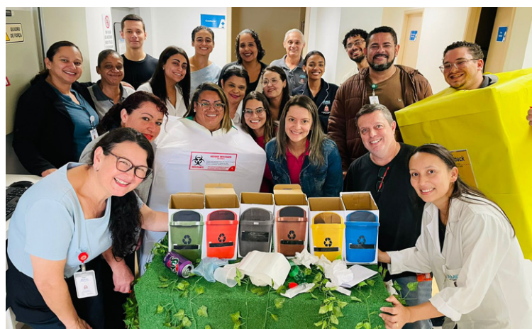
Atividade lúdica trouxe conhecimentos para os colaboradores

Na ocasião, também foi reforçado que o AME Itapevi é um ponto de coleta