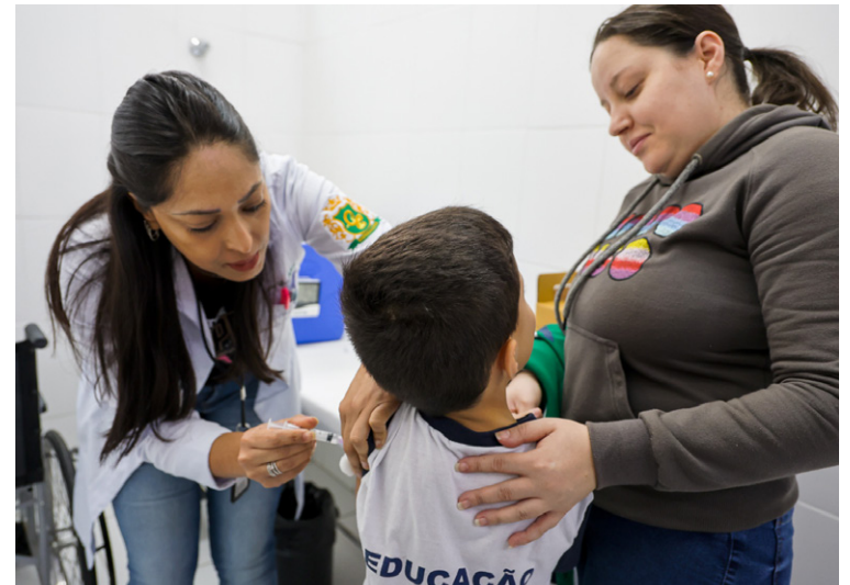
Alunos tiveram as carteiras de vacinação avaliadas

“Nos anos de pandemia, observamos no País o aumento do número de pessoas não vacinadas, o que ampliou a possibilidade de retorno de doenças preveníveis e da ocorrência de surtos. A vacinação nas escolas é um esforço adicional para consolidarmos o cenário de retomada”, afirma a coordenadora municipal