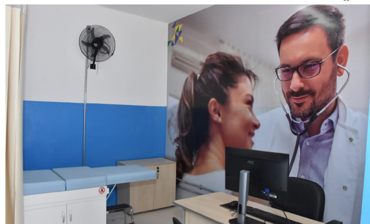
Nova estrutura promete facilitar o acesso das equipes