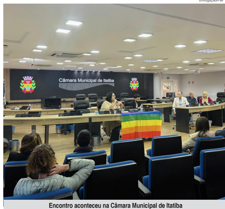
Encontro aconteceu na Câmara Municipal de Itatiba

O Ambulatório Trans de Itatiba é uma iniciativa do CTA (Centro de Testagem e Aconselhamento) e funciona no mesmo prédio, à Rua Pompeia, 45, no Giardino D'Itália (atrás do posto de gasolina). A unidade é referência para ISTs (infecções sexualmente transmissíveis), como