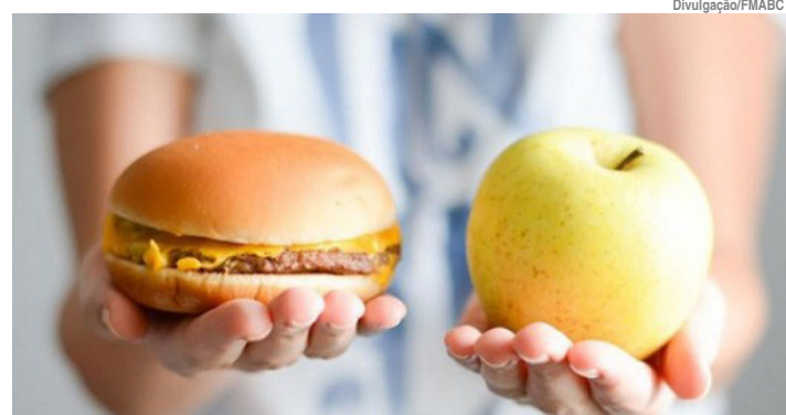
Um dos ensinamentos é a redução de ingestão dos ultraprocessados

O aleitamento materno exclusivo até os seis meses — e complementado até os dois anos ou mais — é uma das estratégias mais eficazes para a prevenção da obesidade infantil. O leite materno, entre outras inúmeras vantagens, contribui para a autorregulação do apetite, favorece uma composição corporal adequada e oferece proteção contra infecções, alergias e doenças crônicas, sendo um importante fator de prevenção da obesidade infantil.