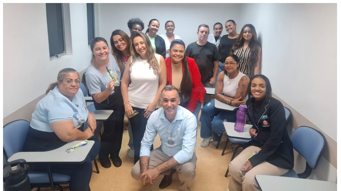
Palestra também trouxe orientações práticas, como a importância da ergonomia

Foram apresentados dados preocupantes sobre a realidade nacional, como os quase 2,9 mil óbitos relacionados ao trabalho e os quase 500 mil acidentes registrados em 2023 pela plataforma eSocial, gerando um impacto de R$ 429 bilhões à economia, segundo o Ministério do Trabalho e Emprego.