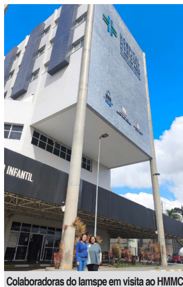
Colaboradoras do Iamspe em visita ao HMMC

O Iamspe, autarquia vinculada ao Governo do Estado de São Paulo,