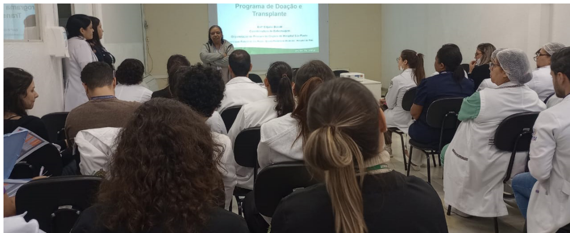
Palestra abordou as etapas fundamentais no processo de doação de órgãos

POLVOS DE CROCHÊ - Em meio ao aumento no volume de atendimentos na ala pediátrica do Hospital Nardini, em Mauá, causado pelas doenças respiratórias típicas do inverno, um gesto de carinho fez a diferença na rotina das crianças acamadas. Uma voluntária que frequentemente realiza doações à unidade entregou polvos de crochê aos pacientes mirins. Os bonecos vão além de simples brinquedos e oferecem conforto emocional aos pequenos durante a fase de tratamento. Inspirados no polvo neonatal, os bonecos possuem tentáculos que remetem ao cordão umbilical, transmitindo sensação de segurança e aconchego, semelhante ao ambiente intrauterino. A iniciativa chegou ao Nardini como uma forma de amenizar o estresse e a ansiedade das crianças durante a permanência no hospital.