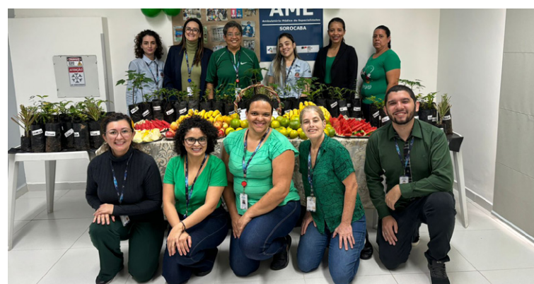
Frutas frescas foram distribuídas entre os funcionários

O AME Sorocaba realizou no dia 3 de junho uma ação especial organizada pela Comissão de Sustentabilidade da unidade. A atividade teve como objetivo incentivar a reflexão sobre a importância da preservação ambiental e promover hábitos mais saudáveis entre colaboradores.