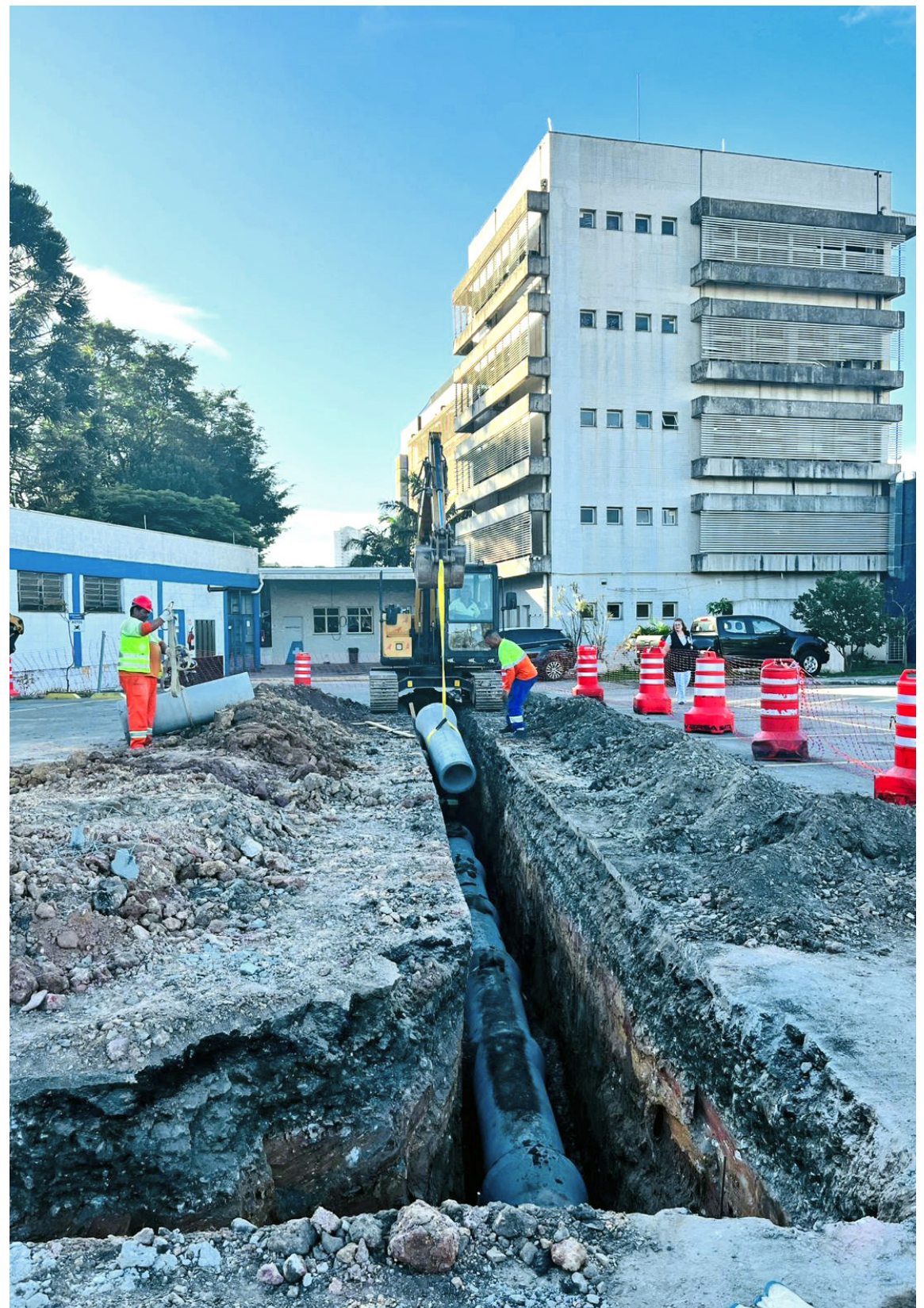
Projeto técnico prevê a implementação de um sistema com quatro níveis de proteção

Além de beneficiar diretamente os pacientes e colaboradores da unidade, a intervenção trará mais segurança e tranquilidade para moradores, pedestres e motoristas que circulam pela área, reforçando o compromisso