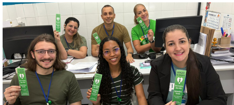
Colaboradores foram incentivados a vestirem roupas verdes às sextas-feiras

O Ambulatório Médico de Especialidades (AME) de Praia Grande aderiu à campanha Setembro Verde, movimento que conscientiza sobre a importância da doação de órgãos e tecidos. Durante todo o mês, a unidade promove ações educativas para sensibilizar pacientes, familiares e colaboradores.