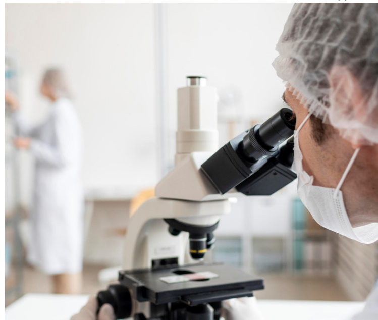
Biomédicos realizam análises clínicas e biológicas para diagnosticar doenças, entre outras atribuições