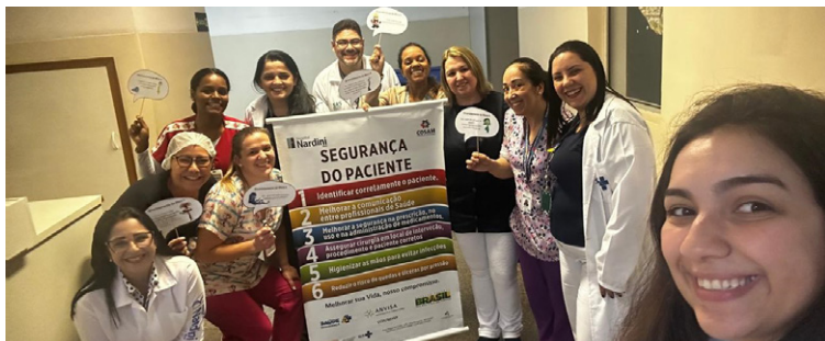
Atividade foi conduzida pela Comissão de Segurança do Paciente

O Hospital de Clínicas Dr. Rada-més Nardini, em Mauá, organizou ao longo do mês de setembro uma série de atividades voltadas à conscientização sobre a segurança do paciente. A campanha se destacou pela abordagem interativa e participativa, com ações realizadas diretamente nos setores da unidade.