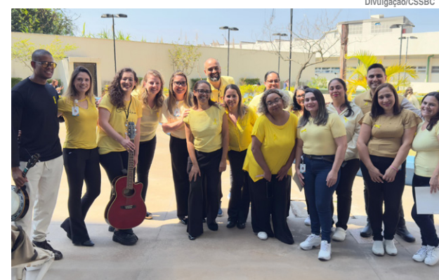
Ação no HC teve série de atividades para sensibilizar os profissionais

O Hospital de Clínicas promoveu, no dia 15 de setembro, a abertura da Semana de Valorização à Vida, iniciativa da Comissão de Humanização do Complexo de Saúde de São Bernardo do Campo. Entre as iniciativas, destaca-se o Corredor de Girassol, um painel artístico representando um campo florido instalado na entrada de colaboradores (primeiro subsolo), que trouxe mensagens de incentivo e valorização