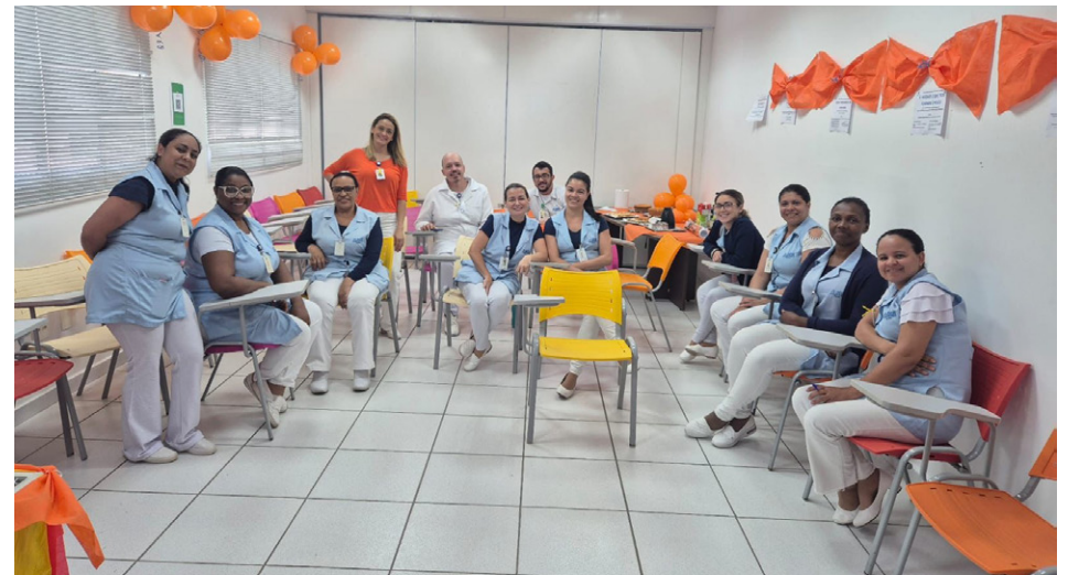
Equipes organizaram jogo de perguntas e respostas

No AME Santos, a iniciativa contou com uma programação completa, com o objetivo de reforçar a cultura de segurança na unidade, por meio de atividades educativas, como quiz interativo e exibição de