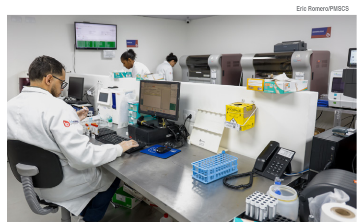
Laboratório próprio deu mais celeridade ao processo de conclusão dos exames

A medida também evita interferência nos resultados dos exames. Durante o transporte, o sangue coletado pode sofrer hemólise por variações de temperatura, agitação ou contaminação, levando à degradação de componentes. Já a urina pode apresentar aumento da turbidez e alteração do pH, entre outras condições que poderiam exigir uma nova coleta.