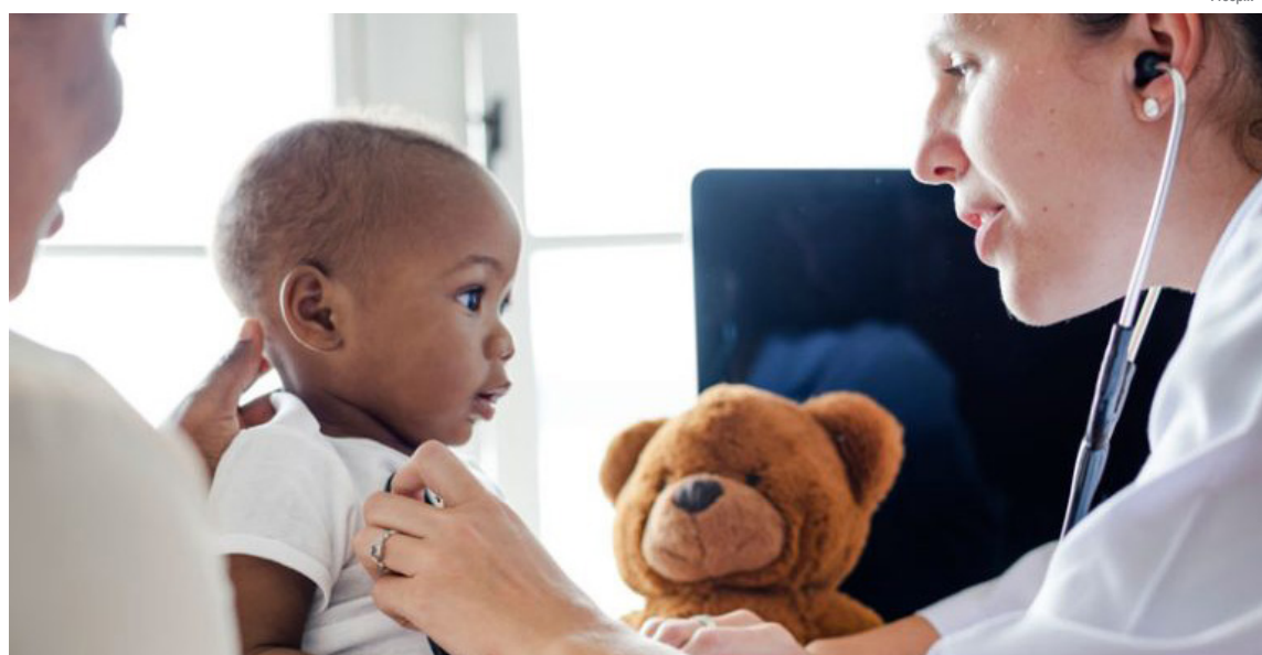
Proposta de 2025 destaca a vulnerabilidade da faixa etária

A mobilização global deste ano reforça diretrizes já apresentadas em campanhas anteriores, como o parto seguro; priorização da segurança do paciente; segurança dos profissionais de saúde; segurança da medicação;