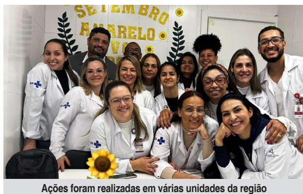
Ações foram realizadas em várias unidades da região

A iniciativa, que integra o calendário anual de ações de saúde mental da rede, incluiu atividades educativas sobre prevenção ao suicídio, momentos motivacionais com mensagens de esperança e rodas de conversa com