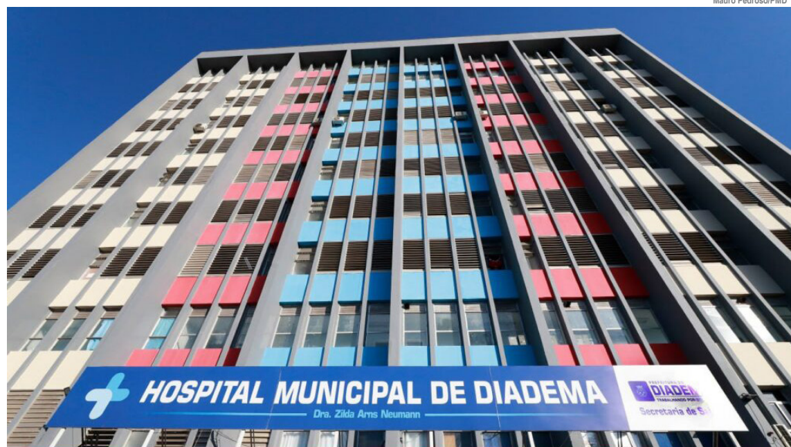
Proposta da FUABC é pautada em um modelo de gestão orientado pela melhoria contínua, integração logística e inovação tecnológica

A estrutura do hospital conta com os seguintes serviços: exames de imagem (radiografia, ultrassonografia, ecocardiograma, tomografia); Laboratório; Centro Cirúrgico com três salas; Central de Materiais e Esterilização (CME); Agência Transfusional; Hemodiálise; Farmácia; Serviço de Nutrição