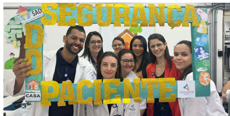
Conscientização sobre as seis metas internacionais da segurança

a importância das seis Metas Internacionais de Segurança do Paciente aplicadas especificamente ao cuidado infantil. As ações desenvolvidas foram devidamente registradas, demonstrando o engajamento efetivo dos serviços de saúde com a cultura de segurança.