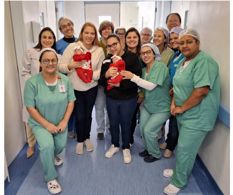
Equipe do Nardini posa com as bebês, nos braços de parentes

Nesse período, a equipe multiprofissional não apenas garantiu o suporte técnico necessário, como também ofereceu acolhimento e apoio emocional à família. Entre os cuidados que foram ofertados para as bebês ao longo da internação estiveram ventilação mecânica, nutrição adequada, controle de infecções, estímulos para o desenvolvimento, entre outros pontos de assistência humanizada.