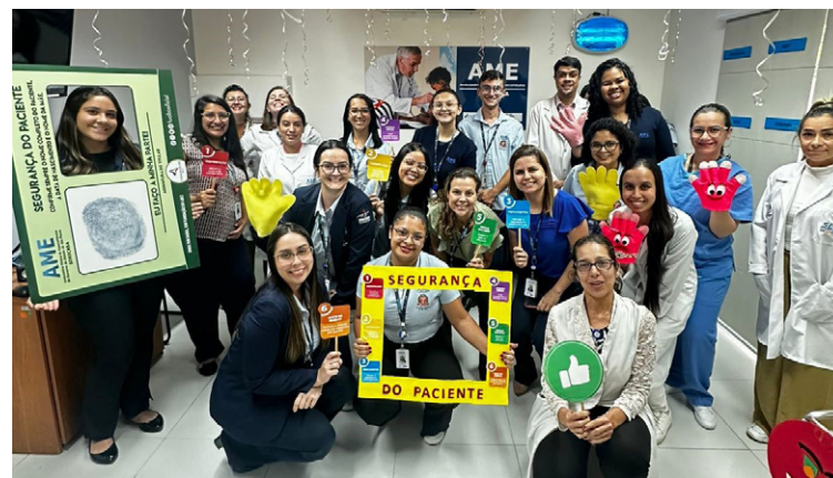
Criatividade foi a tônica da campanha

Um dos destaques da programação foi a exibição de um vídeo educativo sobre segurança do paciente, produzido e apresentado pelos próprios colaboradores da unidade. As atividades também incluíram discussões sobre práticas assistenciais seguras, estimulando o diálogo entre os profissionais e fortalecendo o compromisso coletivo com a qualidade do atendimento.