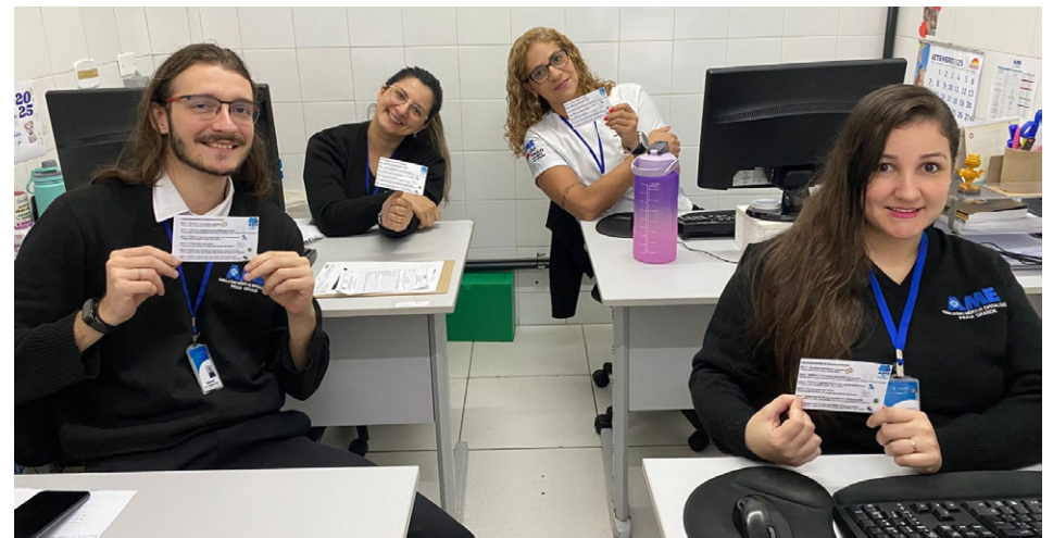
Equipes receberam informativos sobre as metas internacionais

O AME de Praia Grande fez, na última semana de agosto, uma ação em favor da segurança do paciente. Foram espalhadas pelas telas de computadores usados por médicos e funcionários as “6 Metas Internacionais de Segurança do Paciente”, a saber: identificar