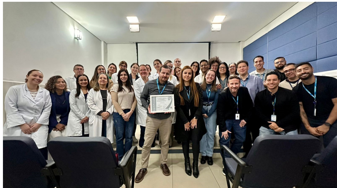
Equipe do CHSCS celebra manutenção do selo ONA 2

“A manutenção deste selo de qualidade é resultado da nossa busca permanente pelo aprimoramento dos processos visando a segurança do paciente e uma gestão integrada, com melhorias entre as áreas e o envolvimento de todo o corpo de