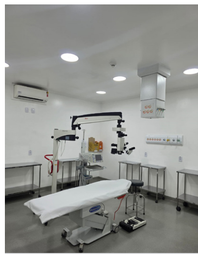
Unidade realiza cerca de 6,3 mil procedimentos cirúrgicos por ano

As melhorias foram realizadas com recursos oriundos do contrato de gestão da unidade, e executadas pela equipe de Manutenção do AME. Segundo a