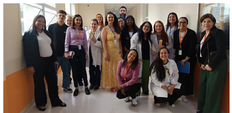
Palestra abordou conceitos fundamentais sobre ansiedade

Além da palestra, a unidade promoveu uma sessão de ginástica laboral conduzida pelos educadores físicos da unidade. A atividade teve como objetivo proporcionar aos colaboradores um momento de cuidado com o bem-estar físico e emocional, reforçando a importância do equilíbrio entre corpo e mente no ambiente de trabalho.