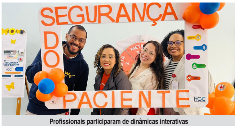
Profissionais participaram de dinâmicas interativas

Nos dias 25 e 26 de setembro, o Hospital Geral de Carapicuíba (HGC) promoveu um evento especial voltado à Segurança do Paciente. A iniciativa teve como objetivo reforçar junto aos colaboradores da unidade a importância do tema e avaliar os conhecimentos sobre as Metas Internacionais de Segurança do Paciente.