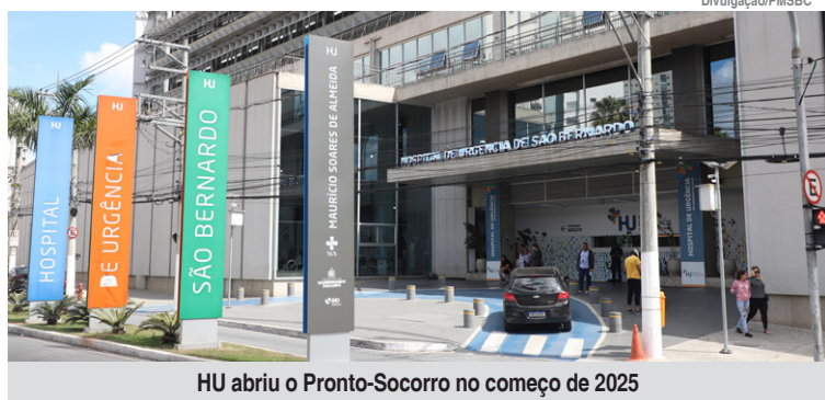
HU abriu o Pronto-Socorro no começo de 2025

O Hospital de Urgência (HU) de São Bernardo registrou, no primeiro semestre de 2025, um aumento de 201% no número de atendimentos no comparativo ao mesmo período do ano passado. Em 2024, de janeiro a junho, foram realizados 31.482 atendimentos, número que saltou para 94.765 neste ano durante o intervalo equivalente. A abertura das portas do HU para demanda espontânea da população foi efetivada no primeiro dia da atual gestão, e esse aumento comprova a necessidade da mudança de modelo.