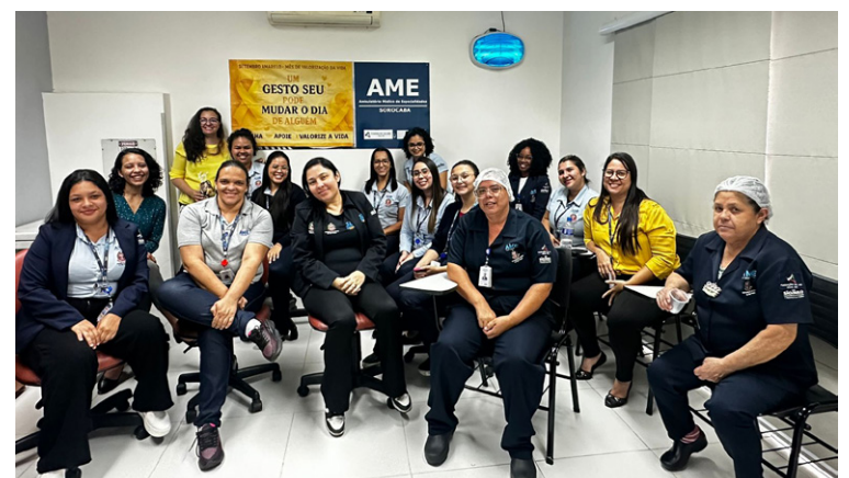
Colaboradores fizeram dinâmica com balões

a oportunidade de representar suas dificuldades em um balão e, posteriormente, estourá-lo como forma de enfrentamento e liberação emocional. Ao final da dinâmica, todos os presentes receberam uma bala acompanhada de uma mensagem de esperança, reforçando o clima de acolhimento e apoio.