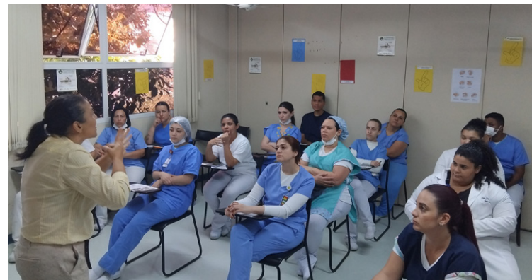
Os participantes responderam a questões sobre higiene das mãos

Durante o evento, 212 profissionais de diferentes áreas participaram da ação, incluindo representantes do almoxarifado, brinquedistas, serviço social, enfermagem, higiene, laboratório, radiologia e odontologia. Os participantes responderam a questões sobre higiene das mãos e receberam demonstrações práticas das técnicas corretas de higienização com álcool em gel.