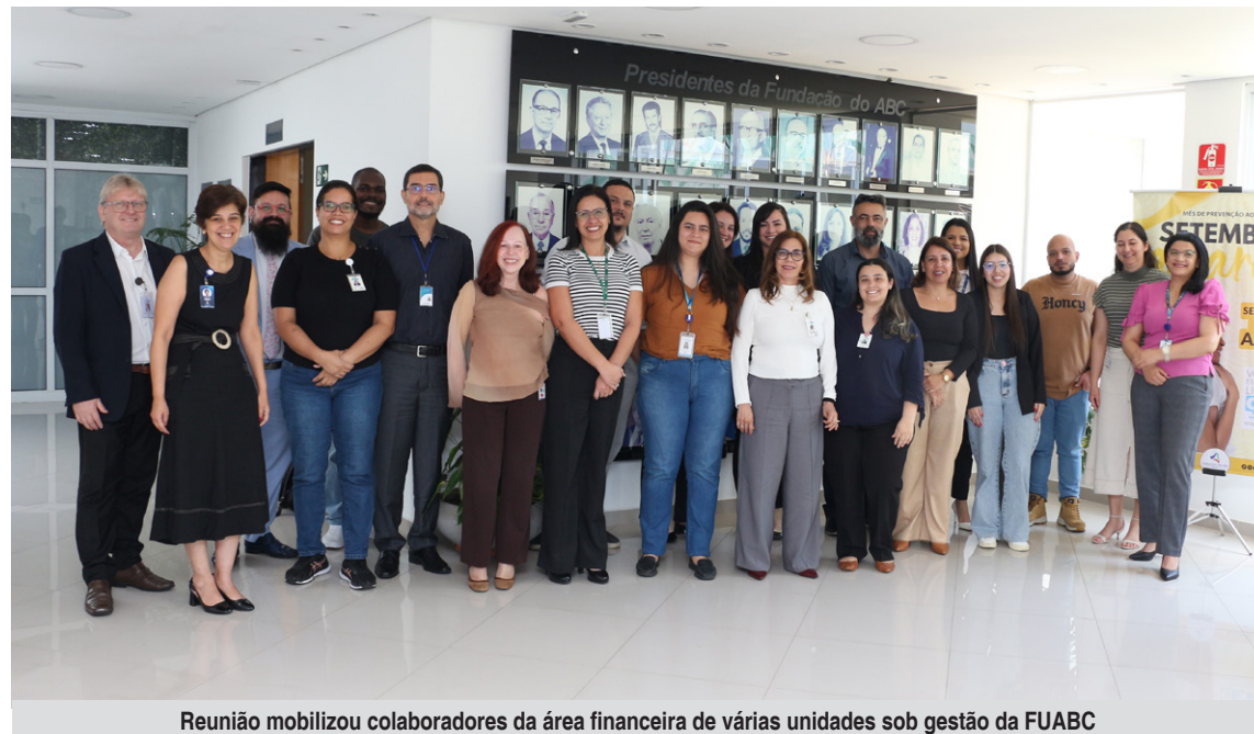
Reunião mobilizou colaboradores da área financeira de várias unidades sob gestão da FUABC

Entre os avanços apresentados está a criação de uma equipe dedicada exclusivamente ao controle de custos, que tem apoiado as unidades hospitalares no cálculo de procedimentos e na compreensão de temas relacionados à