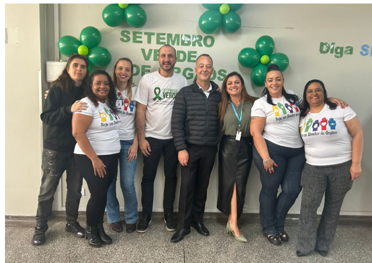
Ação foi parte da campanha do Setembro Verde