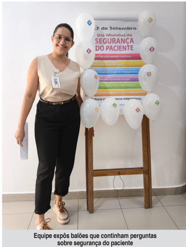
Equipe expôs balões que continham perguntas sobre segurança do paciente

Os profissionais participaram de um jogo no qual, ao estourar balões, eram apresentadas perguntas relacionadas às Metas Internacionais de Segurança do Paciente. Os participantes que acertavam as respostas recebiam brindes com lembretes das metas, reforçando a importância da segurança do paciente nas atividades diárias da unidade.