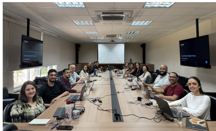
Capacitação preparou equipes para a migração de todos os fluxos operacionais

O treinamento teve como objetivo principal preparar as equipes para a migração gradual de todos os fluxos operacionais, promovendo maior eficiência, transparência e controle na gestão de processos administrativos. O novo sistema ainda está em fase de homologação, conduzida pela