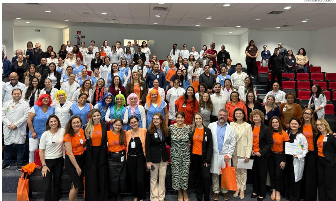
CSSBC organizou Fórum de Qualidade e Segurança do Paciente

A programação também incluiu o relato de um case de sucesso de uma família atendida pela rede, além de uma apresentação cultural do Coral, que encerrou as atividades da manhã. No período da tarde, cada hospital do Complexo promoveu dinâmicas interativas e educativas.