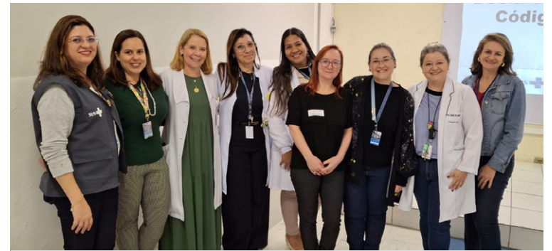
Capacitação reuniu médicos e demais profissionais da saúde

“A correta emissão da Declaração de Óbito é essencial para a construção de dados confiáveis. O uso de códigos errados pode esconder informações