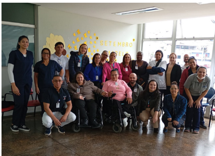
Foram debatidos temas como inclusão e acessibilidade no ambiente hospitalar

A iniciativa integra as ações da unidade voltadas ao fortalecimento de práticas inclusivas, reconhecendo a importância da participação e do protagonismo das pessoas com deficiência no cotidiano da assistência à saúde. O momento de diálogo permitiu que os colaboradores