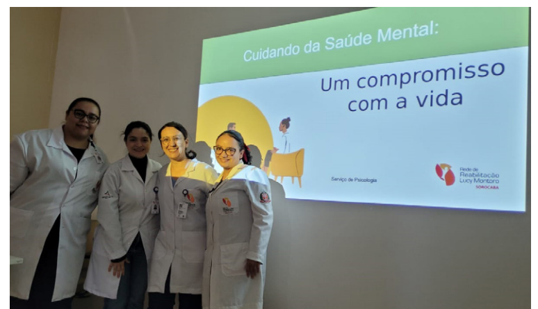
Equipe de Psicologia foi responsável pela palestra

A palestra destacou que a saúde mental é parte integrante da saúde geral e que práticas como o autocuidado, a busca por atividades prazerosas e a manutenção de vínculos sociais sólidos são ferramentas essenciais no processo de reabilitação, tanto para pacientes quanto para profissionais.