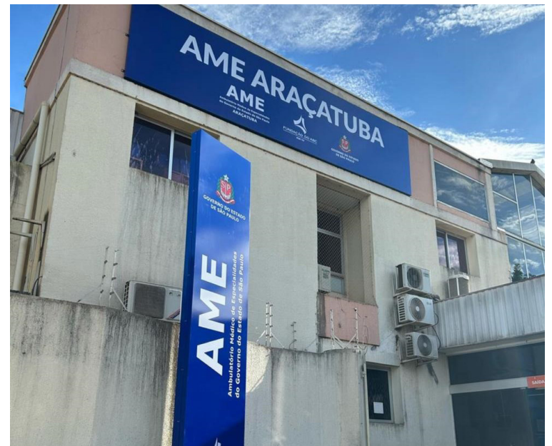
Unidade é gerenciada pela FUABC desde dezembro de 2024

A Caravana 3D é uma iniciativa do Governo de São Paulo que percorre as regiões do estado para implementar políticas públicas baseadas no desenvolvimento, dignidade e diálogo. Durante dois dias, o governador e secretários estaduais visitaram sete municípios da região de Araçatuba para realizar anúncios e entregas nas