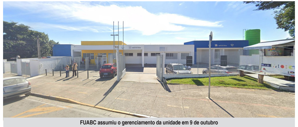
FUABC assumiu o gerenciamento da unidade em 9 de outubro

A estrutura conta com quatro consultórios médicos, um consultório multiprofissional, um consultório para classificação de risco, sala de emergência com três leitos, salas de radiologia, eletrocardiograma, inalação, sutura e curativo e assistência social, além da Central de Material e Esterilização (CME), almoxarifado, farmácia, entre