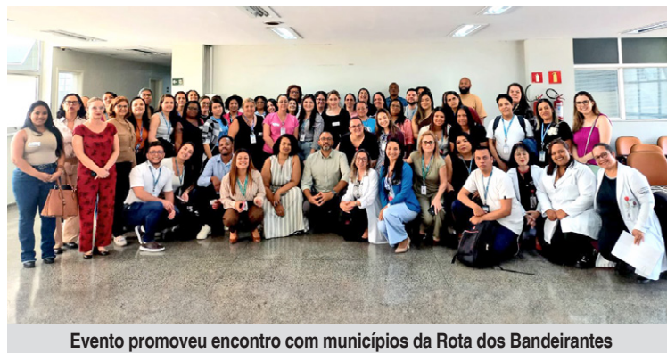
Evento promoveu encontro com municípios da Rota dos Bandeirantes

Gerenciado pela Fundação do ABC (FUABC) e vinculado à Secretaria de Estado da Saúde de São Paulo, o HGC é uma das principais unidades da região quando se fala em parto humanizado. Durante o encontro, foram compartilhadas experiências da rede de Atenção Básica, reflexões sobre o acolhimento hospitalar e depoimentos de pacientes e profissionais que vivenciam na prática o protagonismo feminino no cuidado materno.