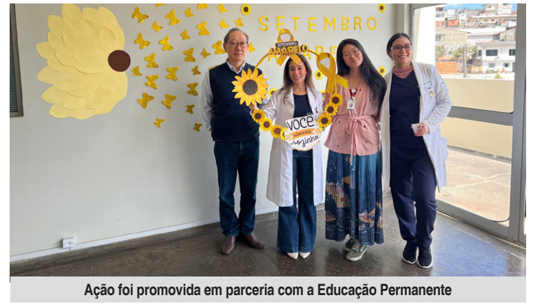
Ação foi promovida em parceria com a Educação Permanente

profissionais de saúde da instituição. O encontro teve como proposta principal promover o diálogo e o acolhimento sobre questões relacionadas à saúde mental no ambiente de trabalho hospitalar.