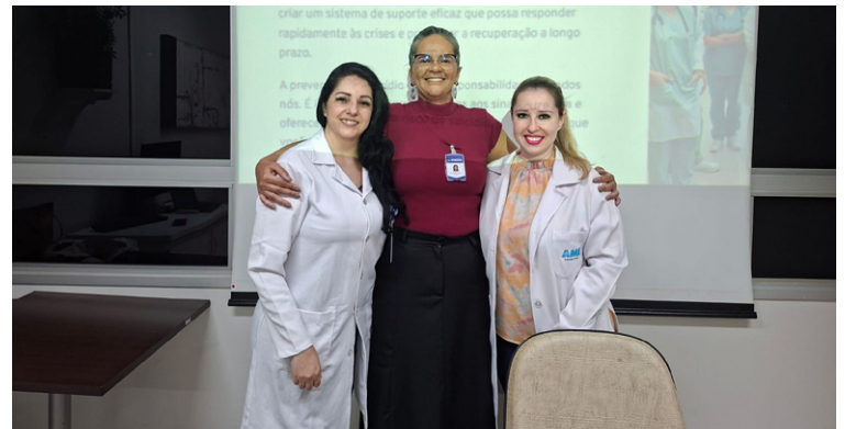
Participaram da ação quase 30 funcionários

apresentação, foram abordados temas como definição e prevenção do suicídio; trajetória histórica; barreiras para detecção; mitos; impactos sociais; principais fatores de risco; e as urgências e os desafios enfrentados pela rede de saúde na oferta de cuidados.