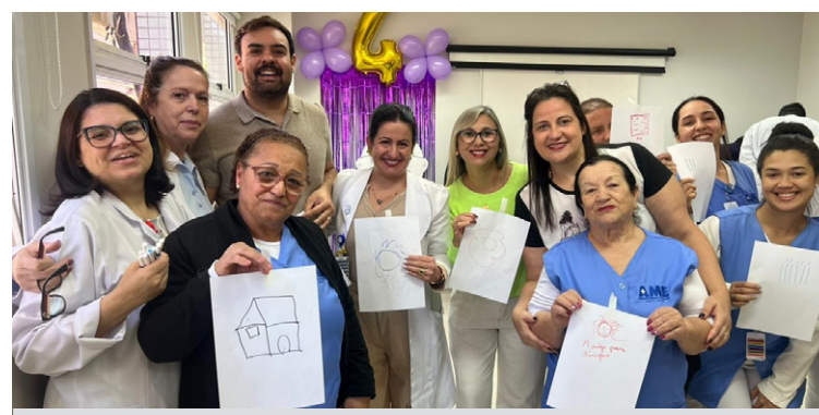
Iniciativa teve ampla adesão dos colaboradores

atividades foram planejadas para estimular o aprendizado de forma dinâmica, incentivando a adoção de práticas seguras no cotidiano profissional e promovendo o alinhamento de toda a equipe com as melhores práticas em saúde.