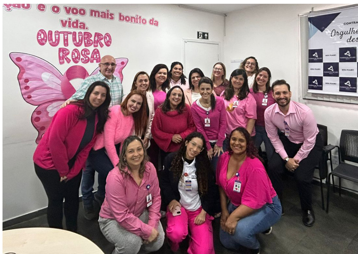
Ações foram realizadas em diversas unidades da Zona Leste de São Paulo

A UBS Jardim Roseli participou no dia 15 de outubro de uma ação voltada à saúde e ao bem-estar das mulheres. A iniciativa, desenvolvida pelo Instituto Hope Box, aconteceu