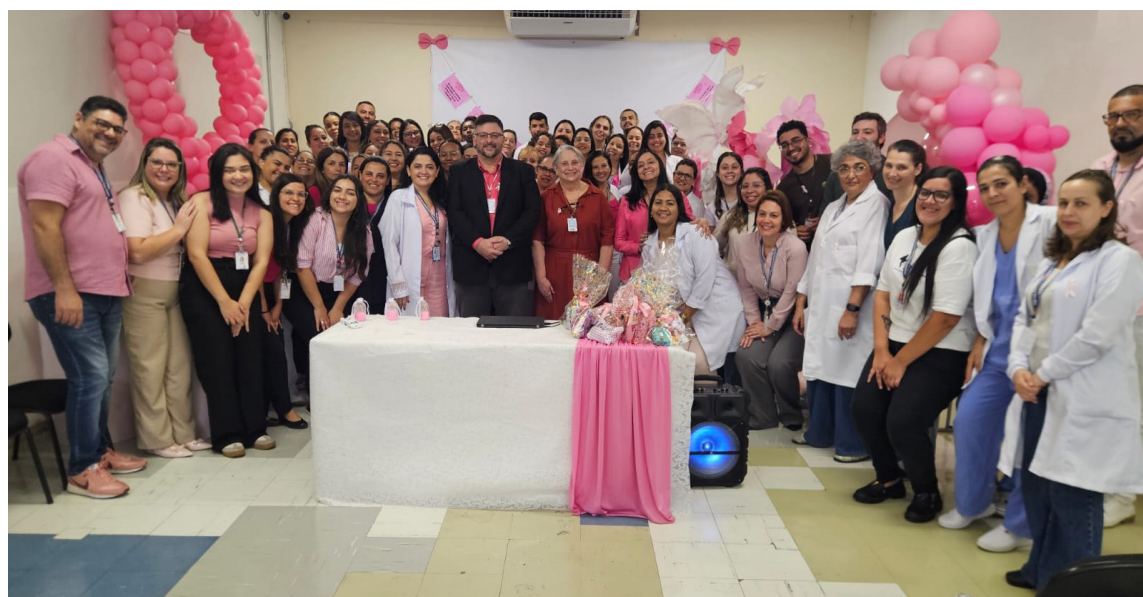
Colaboradores estiveram à frente das ações voltadas aos colegas

Nos dias 22 e 23 de outubro, cerca de 200 colaboradoras da instituição participaram da coleta do exame