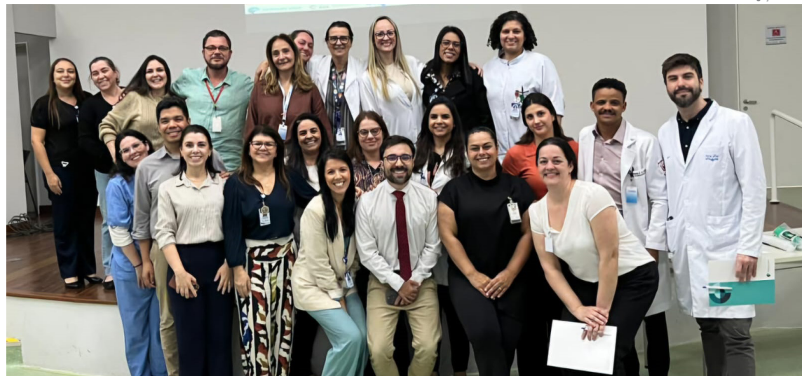
Projeto terá consultoria do Hospital Alemão Oswaldo Cruz

Uma comitiva do Hospital Alemão Oswaldo Cruz esteve no Hospital da Mulher Maria José dos Santos Stein, em Santo André, em 15 e 16 de outubro, para a primeira visita do projeto Lean nas Emergências. O equipamento hospitalar andreense, referência em saúde feminina e materno-infantil no ABC, foi um dos selecionados para integrar a iniciativa.