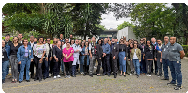
FUABC vence chamamento público e segue à frente do CHSP

A Fundação do ABC promoveu uma programação especial em celebração ao Outubro Rosa, mês dedicado à conscientização sobre a prevenção e o diagnóstico precoce do câncer de mama. Com roda de conversa liderada por referências femininas da saúde do Grande ABC, a ação foi organizada pela Comissão das Mulheres da FUABC, instituída em 2025 pela Presidência e composta por 18 colaboradoras de diversos setores da sede administrativa. Paralelamente, as unidades gerenciadas pela FUABC também organizaram iniciativas para reafirmar o cuidado integral com a saúde da mulher. Pág. 12 a 17