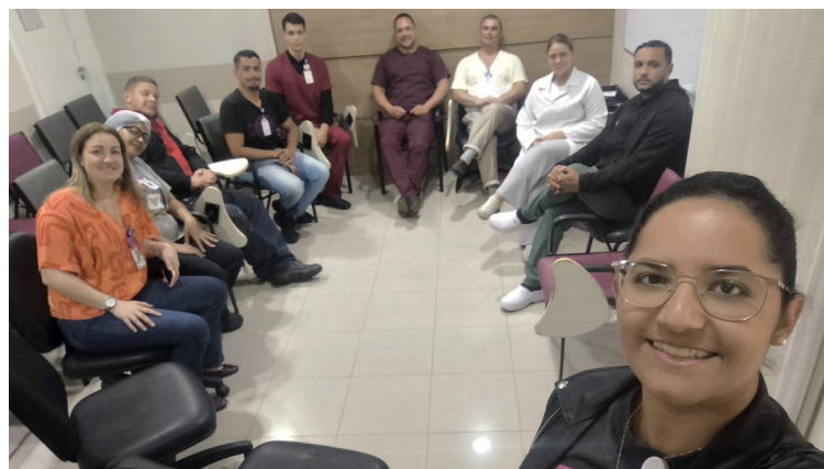
No total, 69 profissionais participaram das discussões

Para disseminar o plano entre os profissionais, a Comissão de Humanização do PAI Baixada Santista realizou rodas de conversa que promoveram a integração entre equipes assistenciais e administrativas. A ação, inicialmente programada até julho deste ano, foi estendida até outubro de 2025 devido ao interesse e à participação dos colaboradores. Ao