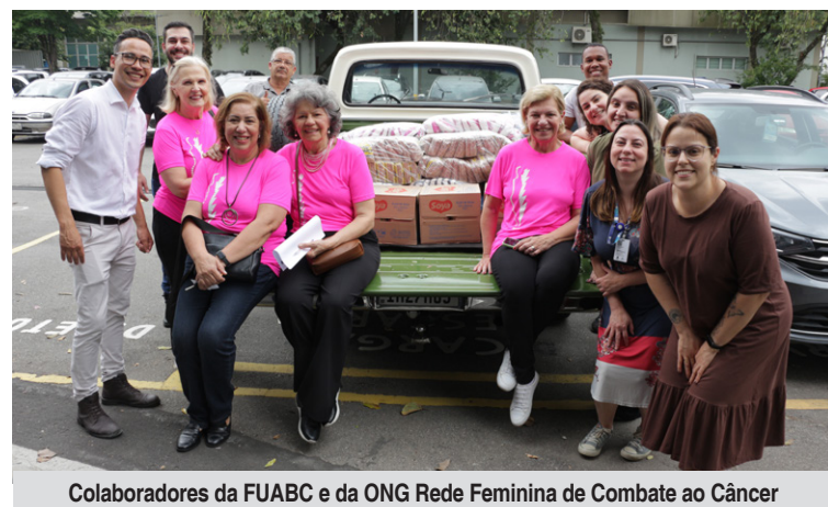
Colaboradores da FUABC e da ONG Rede Feminina de Combate ao Câncer

na prática, como a sustentabilidade e a responsabilidade social são indissociáveis da excelência em saúde e ensino, posicionando a FUABC como uma referência em gestão sustentável e cidadã no Grande ABC.