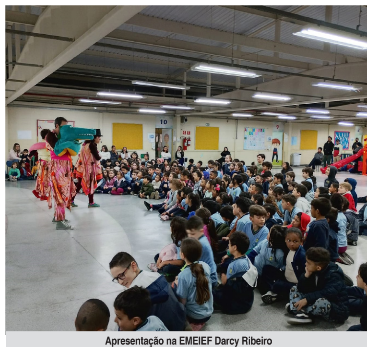
Apresentação na EMEIEF Darcy Ribeiro

de ações do Departamento de Educação Inclusiva e Apoio Educacional que têm como objetivo evidenciar e valorizar o trabalho realizado pelos professores do Atendimento Educacional Especializado e pela equipe de Educação Inclusiva. Além disso, busca promover a visibilidade das Salas de Recursos Multifuncionais e sua importância na rede municipal de ensino. Ao mesmo tempo, essas ações proporcionam momentos formativos para toda a comunidade escolar, ampliando a compreensão e fortalecendo a cultura inclusiva dentro das escolas.