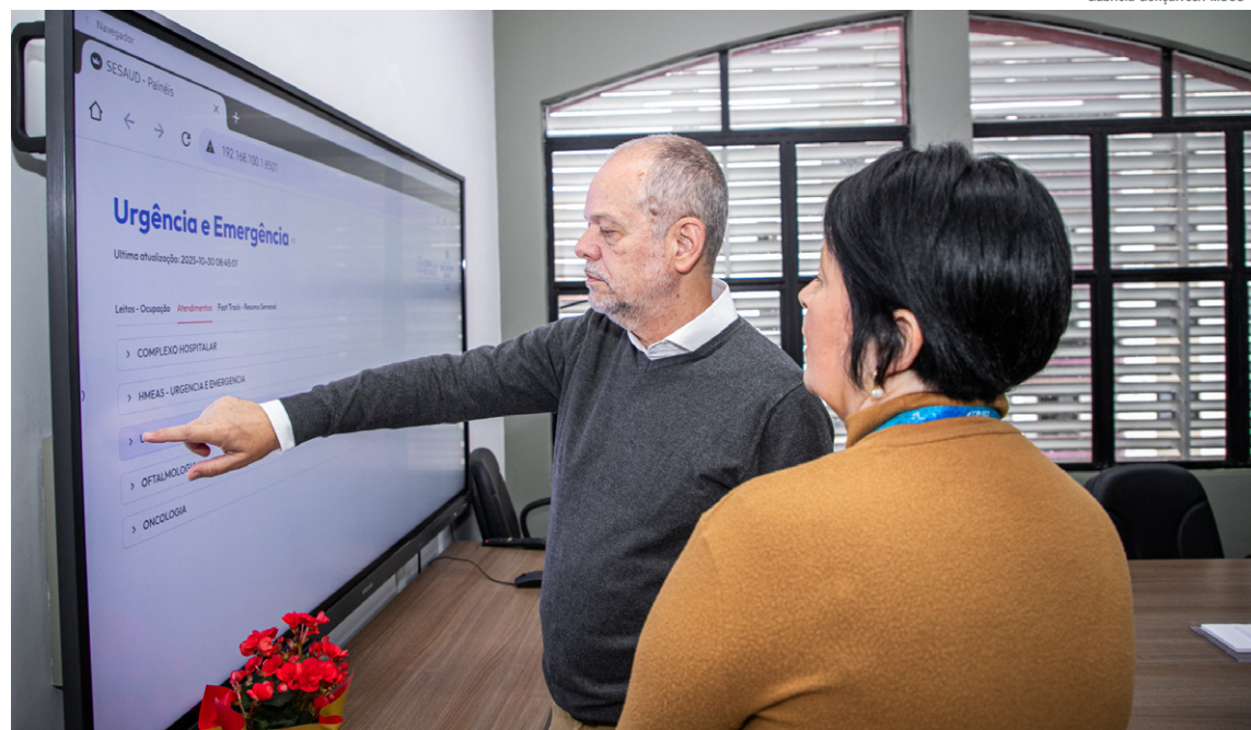
Prefeito e secretária de Saúde conferem dados de monitoramento

Resultado da parceria entre a Secretaria de Saúde, Ciedi (Centro de Inteligência Epidemiológica e Doenças Infecciosas) e Fundação do ABC, a ferramenta extrai dados do sistema, apoiando a tomada de decisões