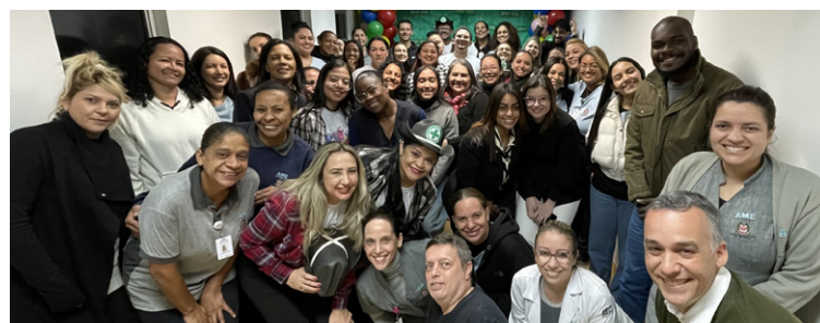
Colaboradores tiveram cinco dias de atividades

Ao longo dos cinco dias, os colaboradores do AME Itapevi participaram de jogos e brincadeiras que combinaram aprendizado e diversão. Mímica, banquinho, caça-palavras e o bingo da CIPAA foram algumas das atividades que incentivaram a interação entre os funcionários e estimularam o espírito de equipe em um ambiente descontraído.