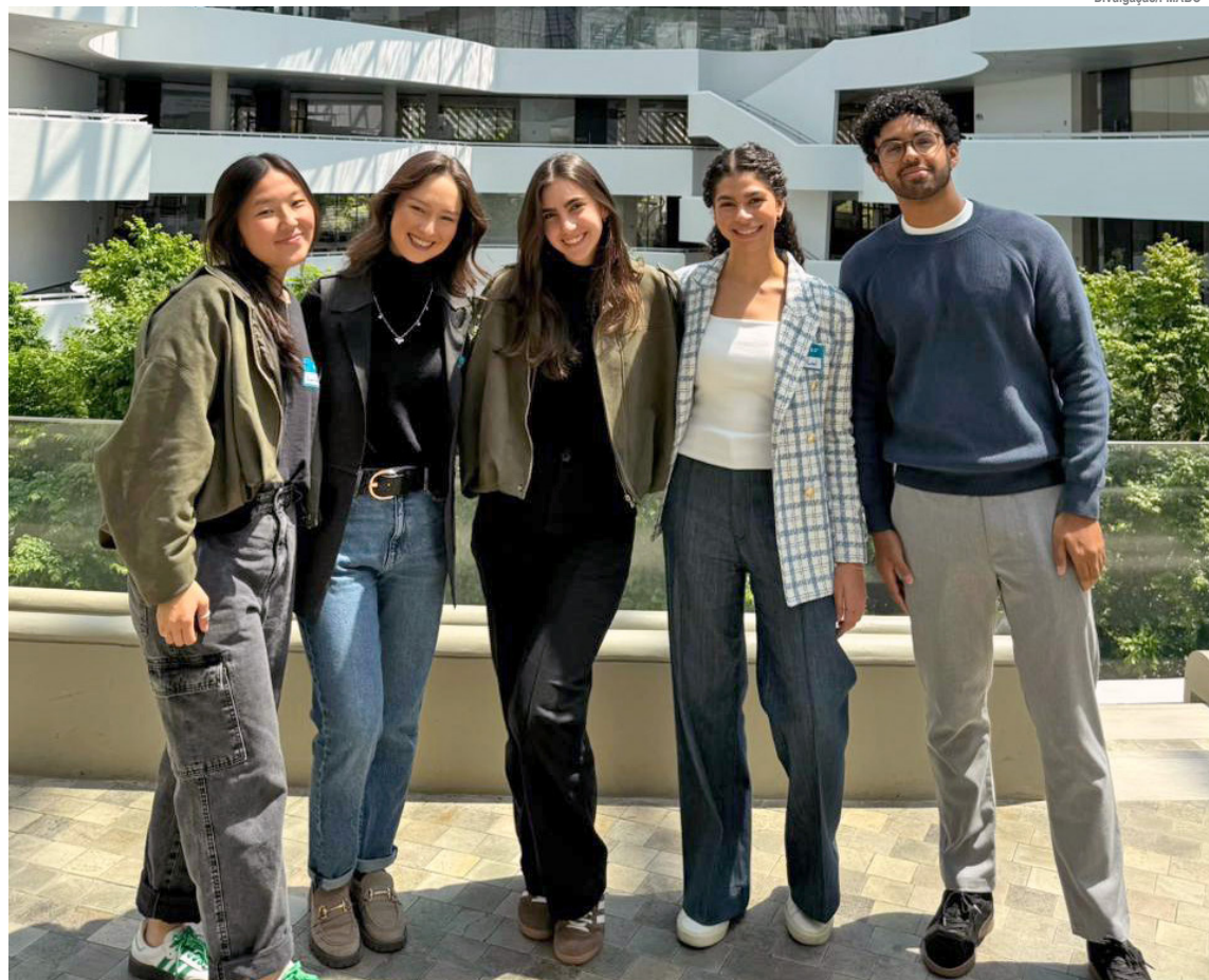
O ABC Medical Academic Meeting é organizado por alunos ligados à OCAAM

Organizado integralmente pelos estudantes, o evento, que contou com apoio da Fundação do ABC, reforça o protagonismo acadêmico dentro da FMABC e estimula a formação de médicos capazes de dialogar com as transformações da ciência em nível internacional.