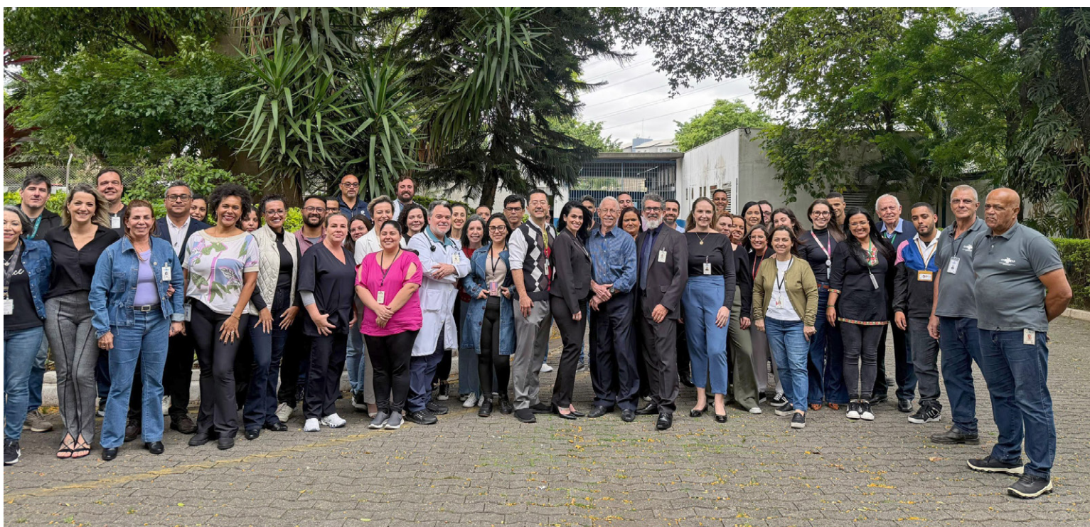
CHSP é gerenciado pela FUABC desde 2014

Localizado no Carandiru, Zona Norte da Capital paulista, o CHSP é uma unidade de referência estadual no atendimento à população carcerária, com foco em Infectologia, Cirurgia, Psiquiatria e Saúde da Mulher. A unidade é vinculada à Secretaria de Estado da Saúde (SES) e atua em parceria com a Secretaria de Administração Penitenciária (SAP) para a gestão de segurança.