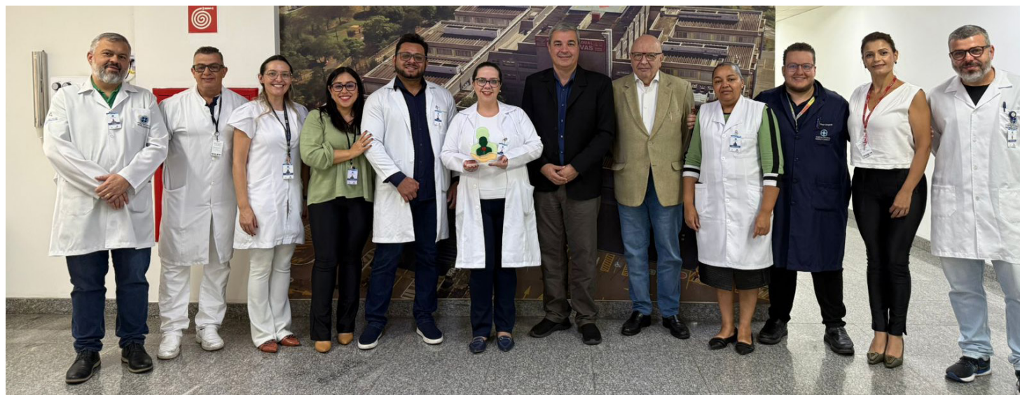
HEMC foi condecorado como 'Destaque em Taxa de Notificação de Órgãos 2025'