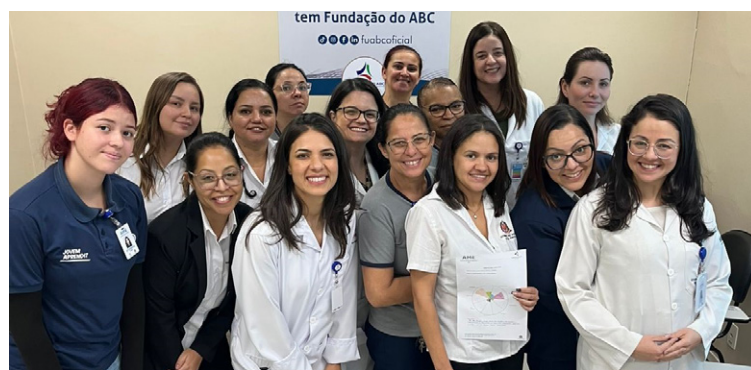
Ações foram coordenadas pela CIPA da unidade

participação ativa dos funcionários ao convidá-los a escrever sobre as formas como se previnem de acidentes no trabalho. As contribuições foram reunidas em um painel interativo, acompanhado de um espaço "Instagramável" para registro fotográfico.