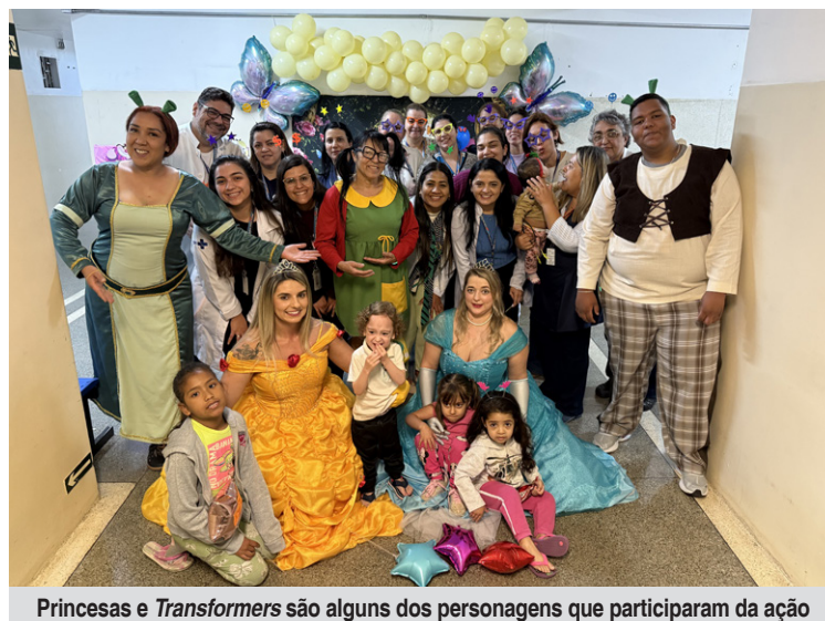
Princesas e Transformers são alguns dos personagens que participaram da ação

Princesas, personagens infantis e até um simpático robô percorreram a pediatria e a maternidade, levando com eles não apenas fantasias e músicas, mas também uma dose extra de esperança. Cada sorriso arrancado, cada olhar curioso e cada gargalhada se tornaram uma espécie de antídoto para um espaço que, na maioria das vezes, é marcado pela preocupação das famílias e pelo ritmo delicado do