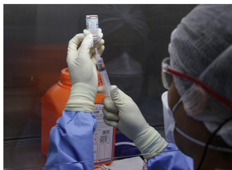
Para manipular os medicamentos, é necessário estar paramentado com avental, máscara, luvas, touca e propé descartáveis

Para entrar nessa área de manipulação, os profissionais passam pela sala de paramentação, onde higienizam as mãos e vestem avental, máscara, luvas, touca e propé descartáveis. Dentro da sala, as superfícies internas das cabines e os materiais são esterilizados com álcool