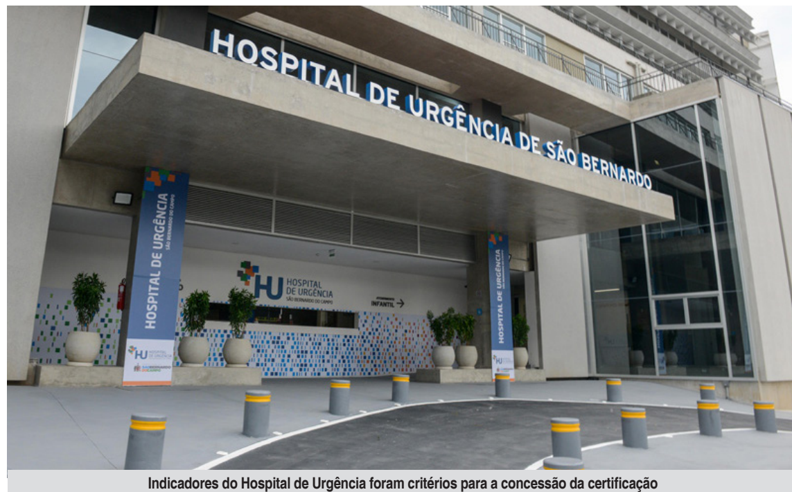
Indicadores do Hospital de Urgência foram critérios para a concessão da certificação

AVC (29 de outubro), o Centro de Reabilitação Lucy Montoro de Diadema promoveu uma iniciativa especial de conscientização sobre a doença. A programação contou com a participação de diversos profissionais da unidade das áreas de Fonoaudiologia, Fisioterapia, Psicologia, Enfermagem,