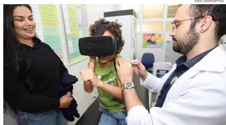
Os óculos de realidade virtual distraem as crianças

Santo André conta com aproximadamente 400 agentes comunitários de saúde, que têm um papel fundamental na sociedade: ser a ligação entre as unidades de saúde e a população. E, em 7 de outubro, um evento no Centro de Formação de Professores Clarice Lispector lotou o auditório Jorge Amado