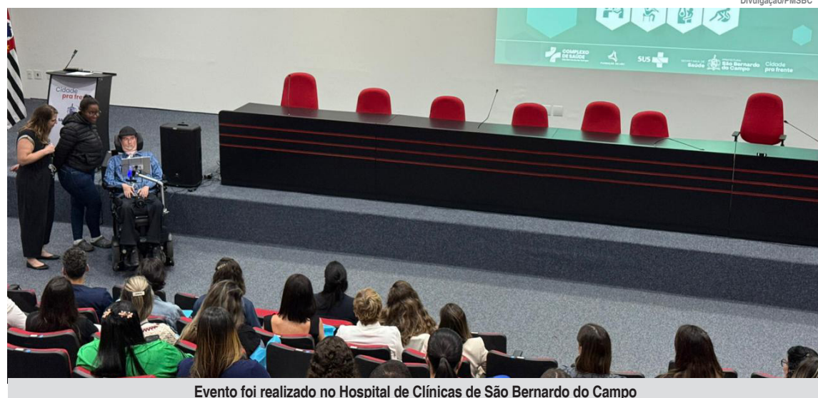
Evento foi realizado no Hospital de Clínicas de São Bernardo do Campo