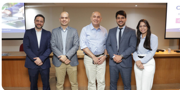
FUABC consolida cultura de integridade na 2ª Semana de Compliance