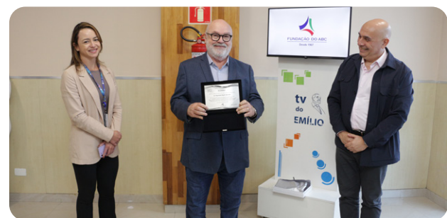
Legado de liderança e gratidão marcam homenagem ao diretor do IIER2