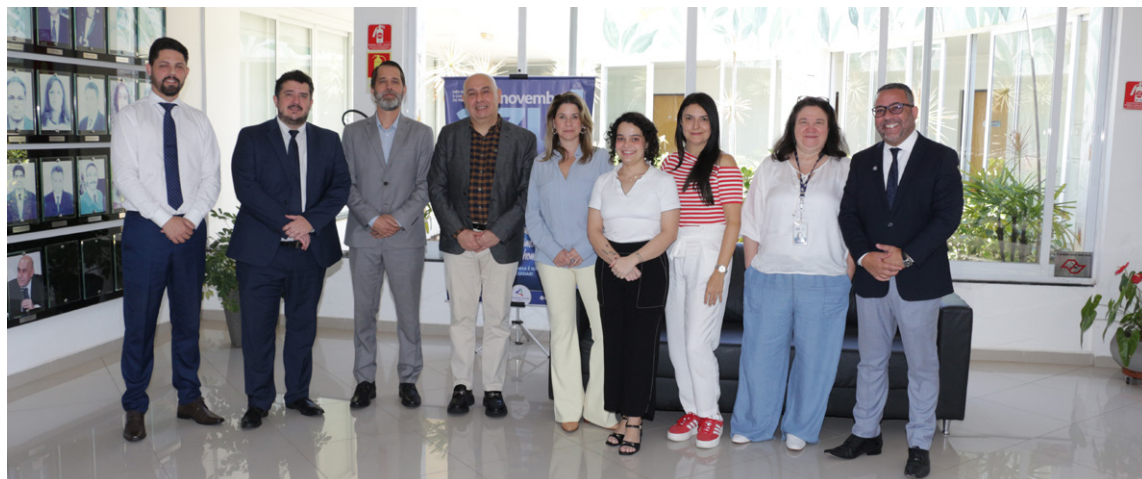
Representantes da FUABC, OAB e IMESC