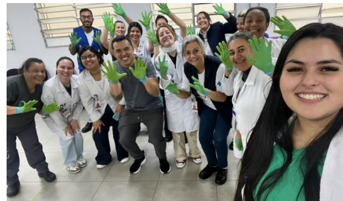
Iniciativa permitiu melhorar as técnicas de lavagem das mãos

A UBS IV Centenário, localizada no território de São Mateus, na Zona Leste da Capital paulista, promoveu em 29 de outubro uma ação educativa voltada à conscientização sobre a importância da higiene das mãos. A iniciativa, organizada pela Comissão de Controle de Infecções e Biossegurança e pela Comissão do Núcleo de Qualidade e Segurança do Paciente, reuniu profissionais de saúde de diversos setores da Atenção Básica.