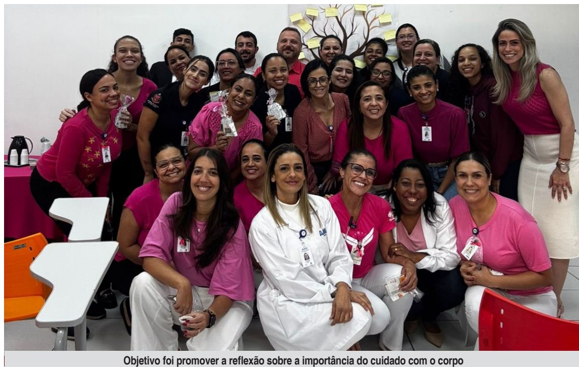
Objetivo foi promover a reflexão sobre a importância do cuidado com o corpo

Entre os pontos discutidos, foram enfatizadas a prática regular de atividades físicas, a manutenção de uma boa alimentação e a atenção à saúde mental como pilares essenciais para a qualidade de vida. O momento também proporcionou um espaço de diálogo e acolhimento, reforçando que a informação e a conscientização são ferramentas fundamentais para a prevenção e o empoderamento feminino.