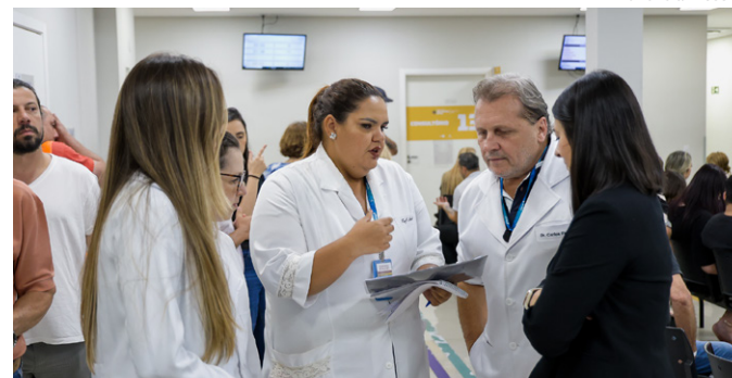
Projeto será finalizado em dezembro de 2026

O Hospital Municipal de Emergências Albert Sabin (HMEAS) segue avançando na implantação do projeto Lean nas Emergências, que busca otimizar o fluxo de atendimento. No começo de outubro, consultores do Hospital Sírio-Libanês estiveram no local para realizar o Diagnóstico de Demanda e Capacidade (DDC).