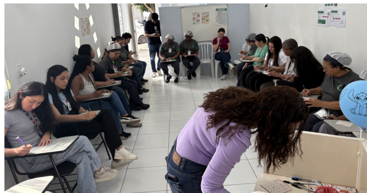
Evento destacou importância do cuidado coletivo

mútuo, a programação da SIPAT enfatizou a importância do cuidado coletivo e da união para superar desafios. A mensagem central reforçou que, apesar das diferenças, a equipe pode trabalhar de forma integrada e segura quando há apoio mútuo.