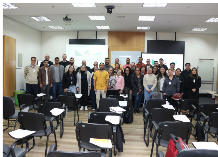
Treinamento teve carga horária de 16 horas

Durante o treinamento, realizado nos dias 21 e 22 de outubro, foram abordados temas como acidente de trabalho, estrutura das Normas Regulamentadoras, distinção entre perigo e risco, metodologias de avaliação, investigação de acidentes e protocolos de emergência – sempre com foco na aplicabilidade à realidade hospitalar e administrativa da FUABC.