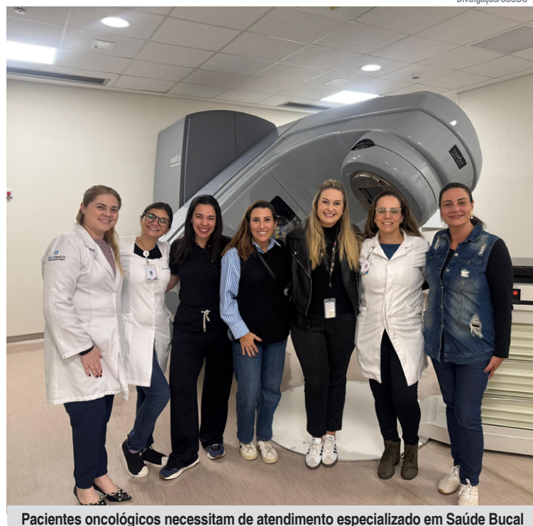
Pacientes oncológicos necessitam de atendimento especializado em Saúde Bucal

“Os pacientes oncológicos encaminhados aos Centros de Especialidades Odontológicas (CEOs) recebem atendimento prioritário e especializado, sem necessidade de interromper o tratamento. Esse alinhamento entre os serviços reflete a importância do trabalho integrado e da comunicação entre as áreas envolvidas”, reforça.