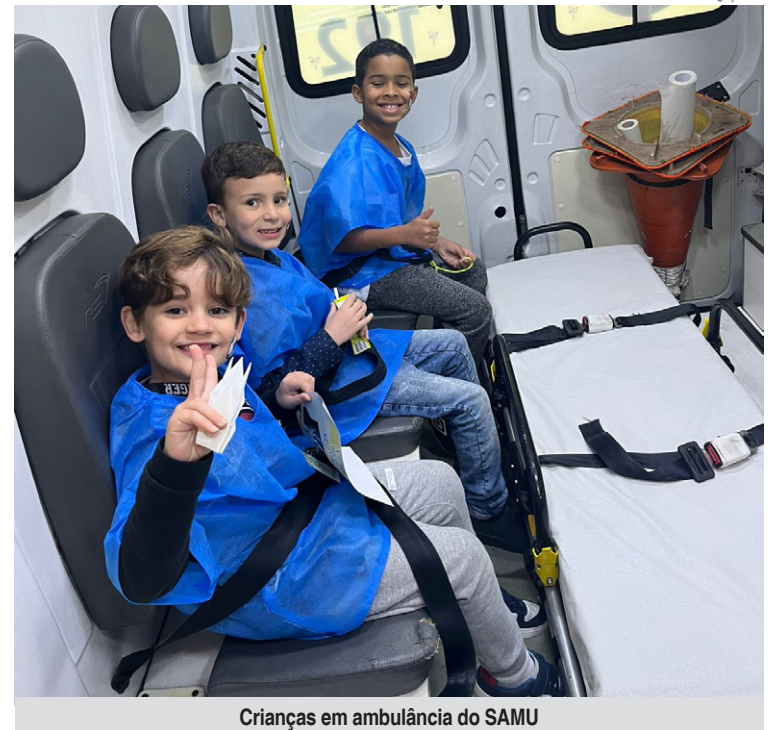
Crianças em ambulância do SAMU