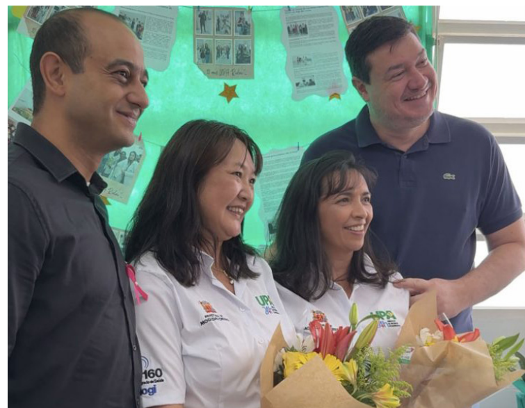
Colaboradoras que estão desde a inauguração foram homenageadas

Para o secretário adjunto de Saúde e Bem-Estar, Luiz Bot, a unidade é um exemplo de estrutura pública consolidada e essencial para a rede municipal. “A UPA do Rodeio é um símbolo do compromisso de Mogi com um atendimento humanizado e eficiente. Em 10 anos, a unidade se transformou em referência regional, com profissionais dedicados e um serviço que a população reconhece e confia”, enfatiza.