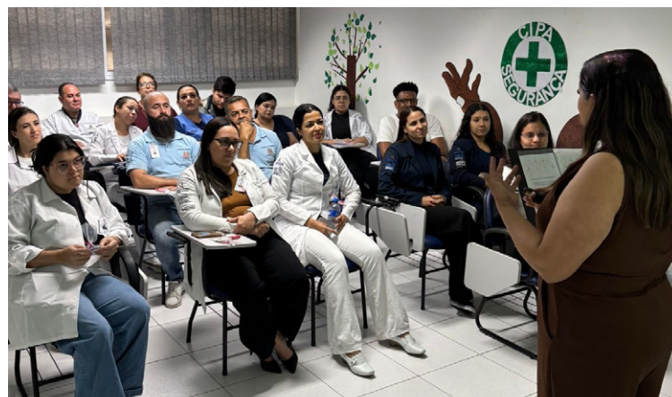
A semana de eventos abordou questões laborais e ambientais