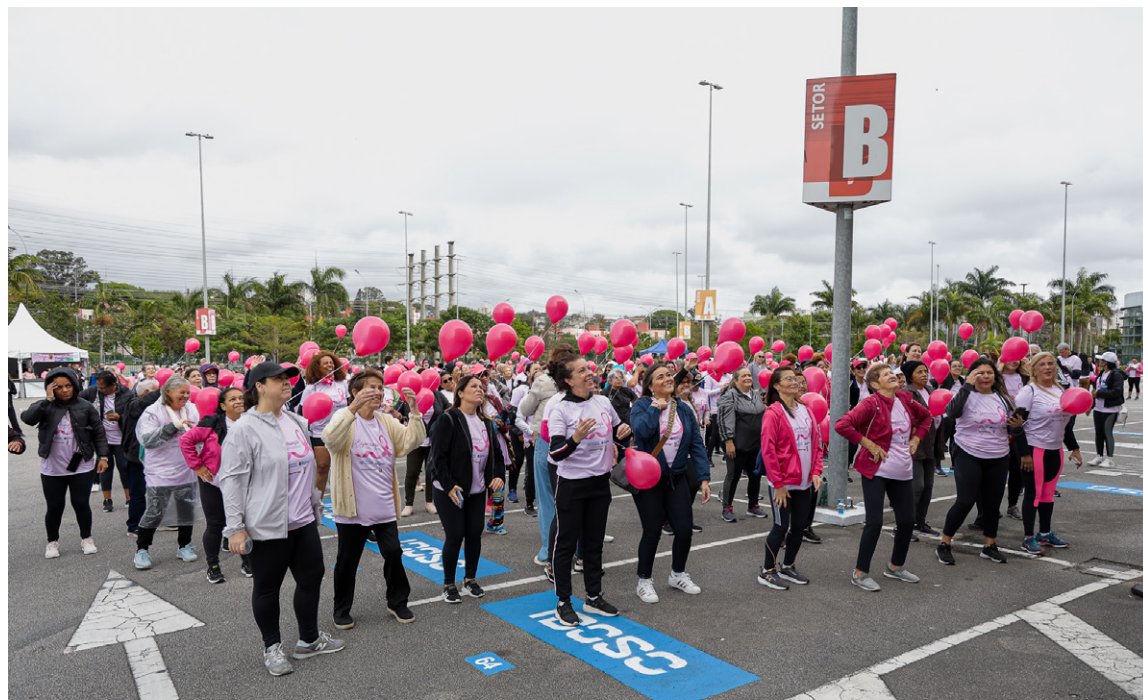
Ação contou com diversas atividades