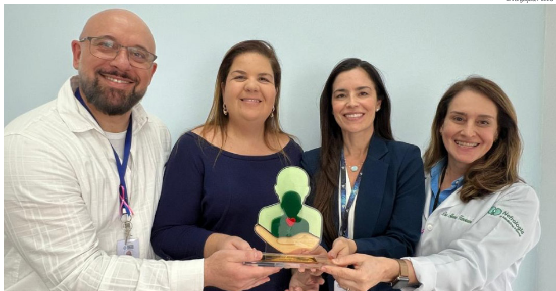
HMMC recebeu 'Reconhecimento pelo Compromisso com a Doação de Órgãos 2025'

A premiação entregue ao HMMC foi na categoria 'Reconhecimento pelo Compromisso com a Doação de Órgãos 2025'. Já o HEMC foi condecorado como 'Destaque em Taxa de Notificação de Órgãos 2025', pelo empenho da CIHDOTT em mobilizar esforços para viabilizar o maior número possível de doações de órgãos, inclusive com trabalho contínuo de sensibilização a familiares.