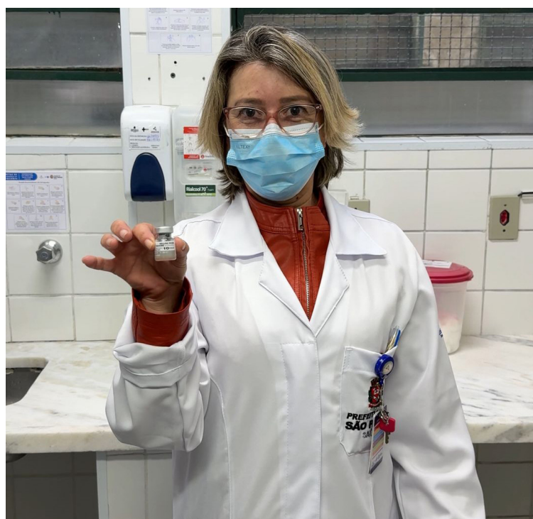
Foram distribuídas mais de 6,8 milhões de doses

A ação buscou reduzir a incidência de doenças preveníveis, manter a eliminação da poliomielite, reforçar o combate ao sarampo e aproximar