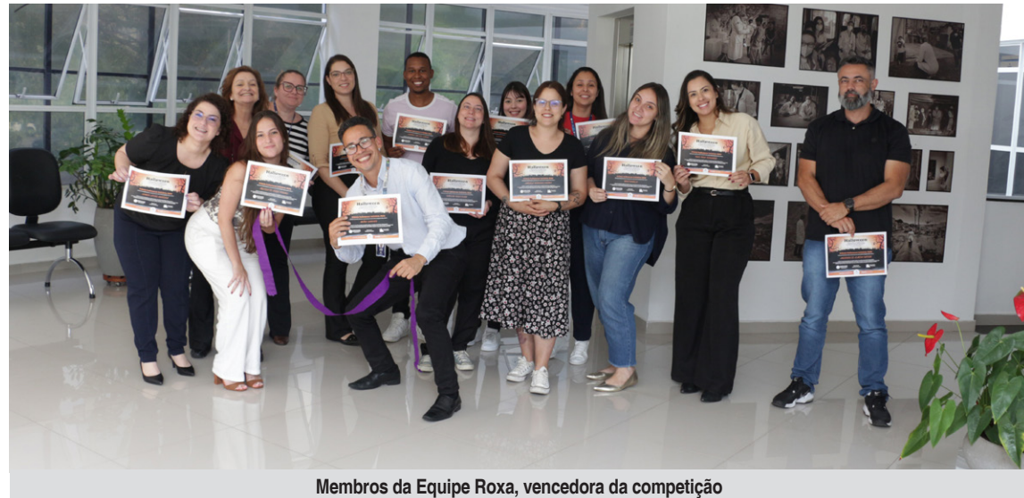
Membros da Equipe Roxa, vencedora da competição