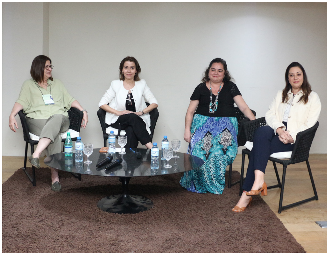
Mais de 300 profissionais participaram do evento