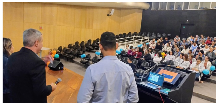
SIPAT do HEMC contou com atividades lúdicas

Entre as ações realizadas, destaque para o Big Fone da Segurança, dinâmica na qual colaboradores recebem ligações em seus ramais com perguntas sobre prevenção de acidentes e protocolos de segurança. Quem acertava as respostas ganhava prêmios.