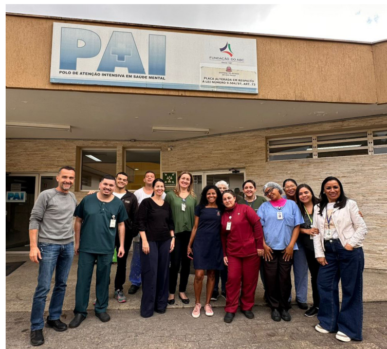
Atividades visaram também o bem-estar emocional

A CIPAA é uma comissão obrigatória em empresas e tem como objetivo prevenir acidentes e doenças do trabalho, além de combater o assédio moral, físico e sexual nas organizações. No PAI Baixada Santista, a comissão tem atuado de forma recorrente em iniciativas voltadas à saúde mental dos trabalhadores, demonstrando o compromisso da instituição com a criação de um ambiente de trabalho mais acolhedor e saudável.