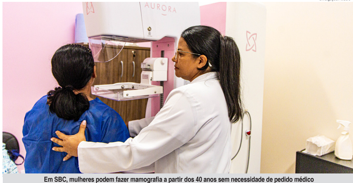
Em SBC, mulheres podem fazer mamografia a partir dos 40 anos sem necessidade de pedido médico

O Complexo de Saúde de São Bernardo do Campo coordenou no dia 29 de outubro a ação “Fios de Esperança”. Com o slogan “Seu cabelo é a força de alguém”, a iniciativa reforçou a importância de gestos simples capazes de transformar a vida de