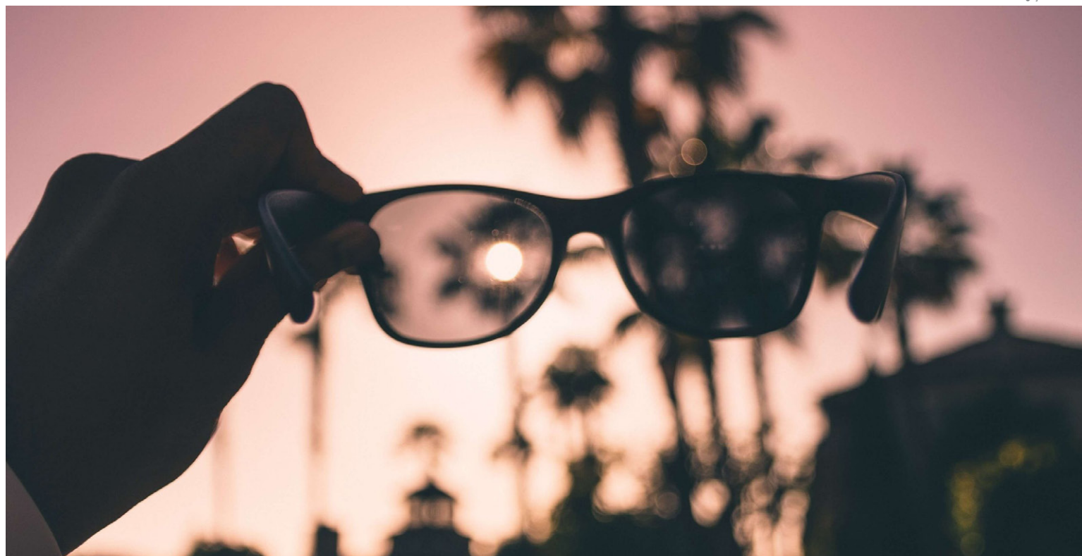
O sol também causa danos cumulativos aos olhos

As altas temperaturas e a maior exposição ao sol durante o verão não afetam apenas a pele. Os olhos também sofrem com as condições típicas da estação, principalmente para quem costuma frequentar praias e piscinas. De acordo com o oftalmologista Dr. Renato Leça, do Centro Universitário FMABC, esse conjunto de fatores pode provocar uma série de desconfortos oculares bastante comuns nesta época do ano.