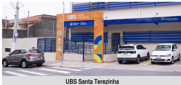
UBS Santa Terezinha

A chegada do verão e o aumento da temperatura acendem o alerta sobre os cuidados com o câncer de pele, o tipo mais comum de câncer no Brasil e no mundo. Ele surge quando as células da pele começam a crescer de forma anormal. Por isso, em dezembro, as 35 UBSs (Unidades Básicas de Saúde) de São Bernardo do Campo reforçaram o trabalho de conscientização sobre a prevenção da doença, em alusão à Campanha Dezembro Laranja.