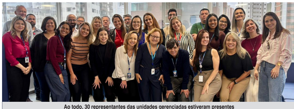
Ao todo, 30 representantes das unidades gerenciadas estiveram presentes

No encontro, em 17 de dezembro, foi apresentado o novo Regulamento de Gestão de Pessoas, recentemente aprovado pelo Ministério Público do Estado de São Paulo. O documento representa um avanço significativo na governança institucional, ao