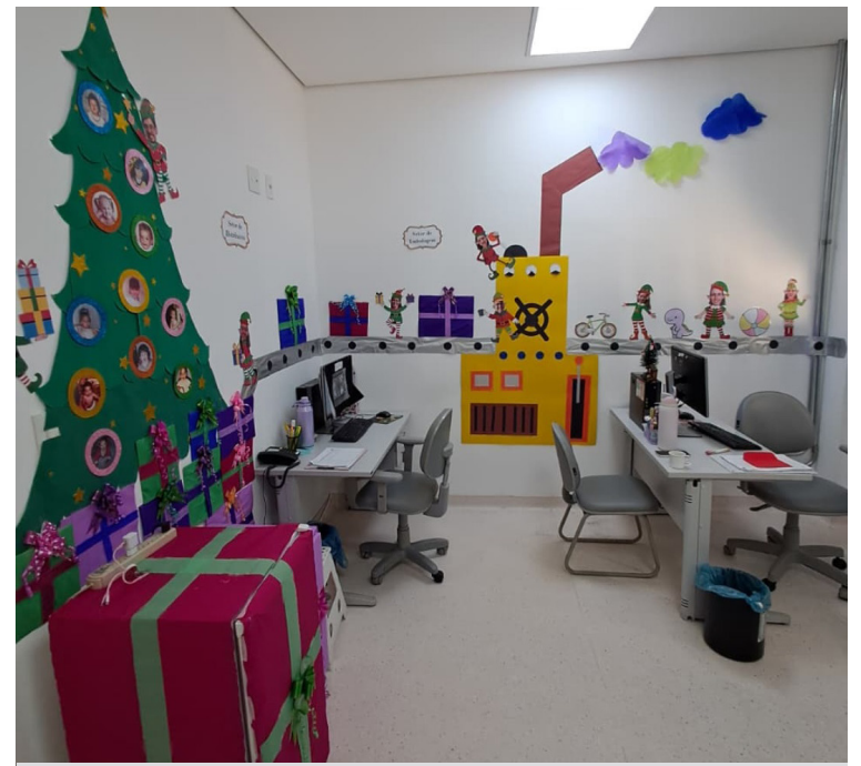
Unidade entrou no clima de fim de ano

Mais do que uma competição, a ação celebra o Natal, promove a integração entre os colaboradores e reforça