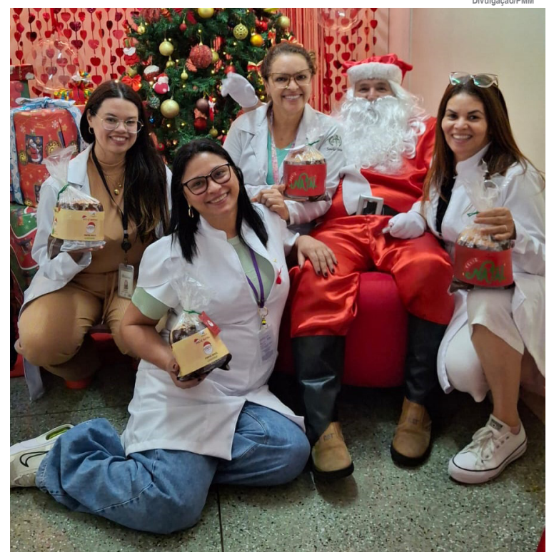
Colaboradores receberam o brinde das mãos do Papai Noel

A ação reforça o espírito de união e valorização das pessoas que fazem o hospital funcionar 24 horas por dia. Em meio à rotina intensa da área da saúde, iniciativas como essa ajudam a fortalecer os laços, renovar as energias e lembrar que o cuidado também começa dentro de casa. Mais do que um presente, o panetone simbolizou gratidão, acolhimento e o desejo de um Natal mais leve e humano para todos os profissionais que dedicam seu trabalho ao cuidado com o próximo.