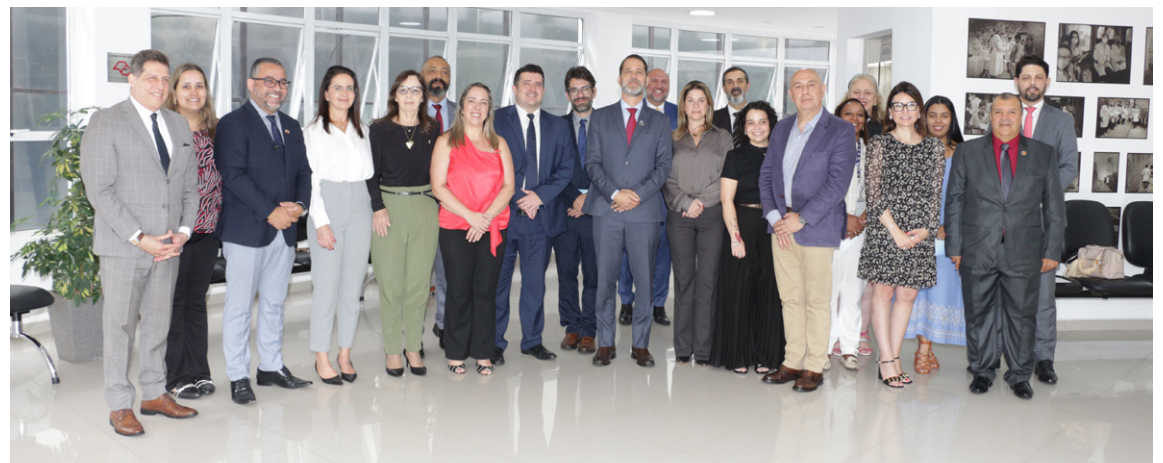
Representantes da FUABC, IMESC e Colégio de Presidentes da OAB

O plano de trabalho que integra o Termo de Cooperação estabelece como diretrizes centrais ampliar a capacidade de atendimento pericial do IMESC, reduzir o tempo de espera para a realização de perícias médicas e descentralizar o serviço, facilitando o acesso dos beneficiários da justiça gratuita residentes na região do ABC e entorno. Também prevê a garantia de atendimento em ambiente adequado, com suporte operacional e estrutura organizacional capazes de conferir mais eficiência e qualidade ao fluxo pericial.