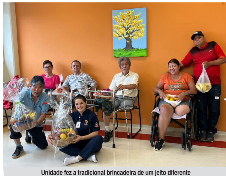
Unidade fez a tradicional brincadeira de um jeito diferente

Eventos como o "Amigo Fruta" desempenham papel fundamental no bem-estar emocional dos pacientes, auxiliando no enfrentamento dos desafios da reabilitação e promovendo a interação social. A unidade realiza periodicamente atividades sazonais que contribuem para a melhora na qualidade de vida e na autonomia dos pacientes, mostrando que a reabilitação é um processo contínuo que busca não apenas a recuperação física, mas também o desenvolvimento integral do indivíduo.