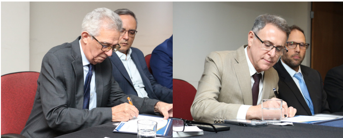
Assinatura do Termo de Posse da nova gestão