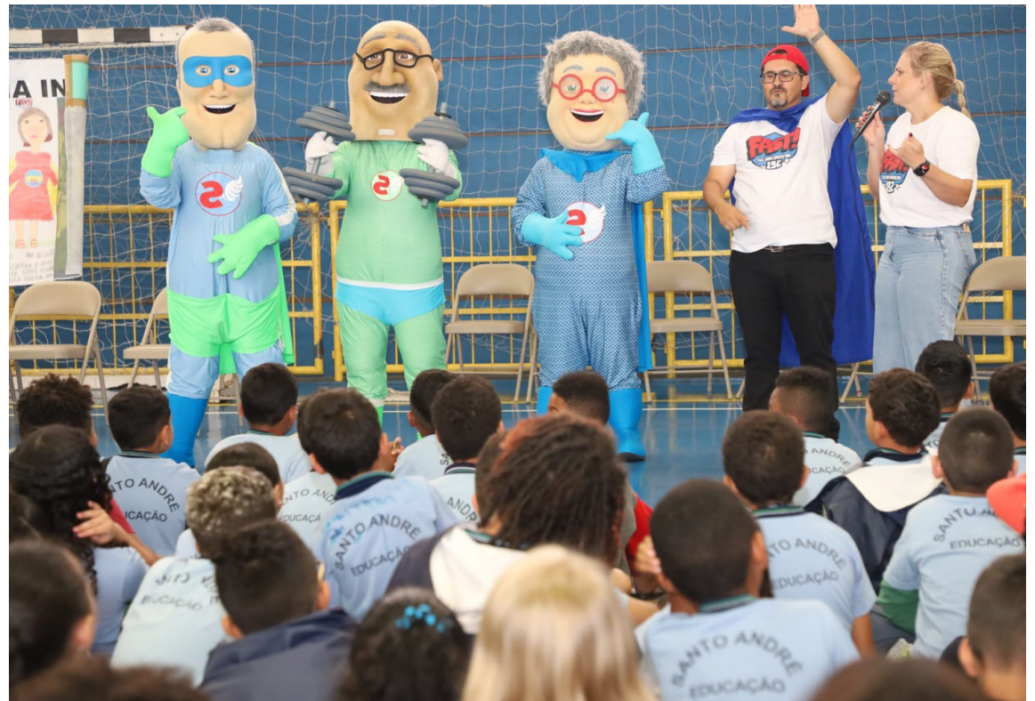
Alunos da rede municipal foram treinados para reconhecer os sintomas do AVC