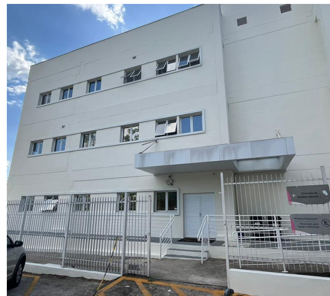
Ação integra a primeira etapa do plano de adequações prediais da unidade

A Fundação do ABC assumiu a gestão clínica e administrativa do Centro de Reabilitação Lucy Montoro de Sorocaba em julho de 2023, após vencer o chamamento público do Governo do Estado de São Paulo. O contrato tem vigência de cinco anos e vincula os repasses financeiros do Governo do Estado a indicadores de qualidade e produtividade pré-estabelecidos.