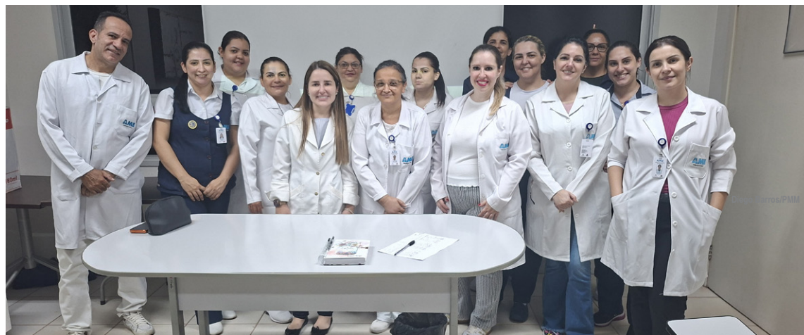
Câncer de pele é a mais comum das neoplasias malignas

descontrolado das células da pele, formando um tumor maligno. Existem três tipos principais da doença. O carcinoma basocelular é o mais comum e menos agressivo. O carcinoma espinocelular, segundo mais frequente, pode ser mais invasivo. Já o melanoma, embora seja o menos frequente, é o mais perigoso devido ao alto potencial de metástase, ou seja, de se espalhar para outros órgãos.