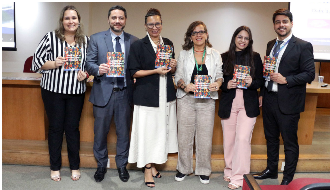
Manual foi apresentado durante a Semana de Compliance da FUABC, realizada no começo de novembro

A iniciativa também reforça o compromisso da FUABC com as melhores práticas de governança e responsabilidade social, integrando-se ao conjunto de políticas que norteiam a atuação ética da instituição. “Ao oferecer diretrizes claras sobre convivência, respeito e inclusão, o manual contribui para que colaboradores, gestores e equipes desenvolvam relações profissionais saudáveis e alinhadas aos princípios de equidade. A proposta é