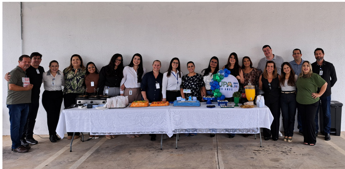
Data festiva reuniu profissionais e gestores da unidade

“A UPA Oropó é um marco para a saúde pública de Mogi das Cruzes. Participei da sua implantação como secretário de Saúde e, hoje, como vice-prefeito, é motivo de orgulho ver uma unidade consolidada, salvando vidas diariamente e com equipes tão