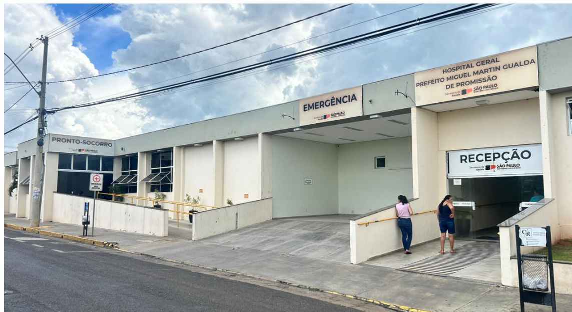
Hospital Geral Prefeito Miguel Martin Gualda de Promissão

Com duração de 12 meses, o convênio tem valor mensal de R$ 848,7 mil, ou R$ 10,1 milhões no valor global. No município, a FUABC também