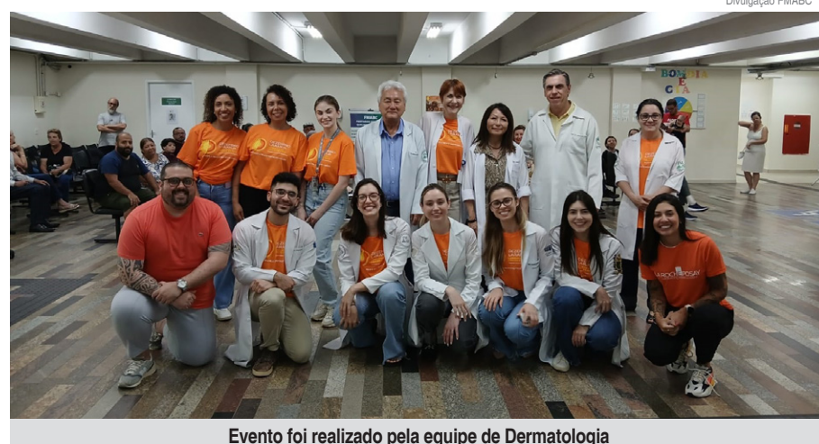
Evento foi realizado pela equipe de Dermatologia

A equipe da Dermatologia, formada por dermatologistas, médicos residentes e estudantes, recebeu no Instituto da Pele da FMABC a população com uma palestra informativa e realizou exames clínicos e de