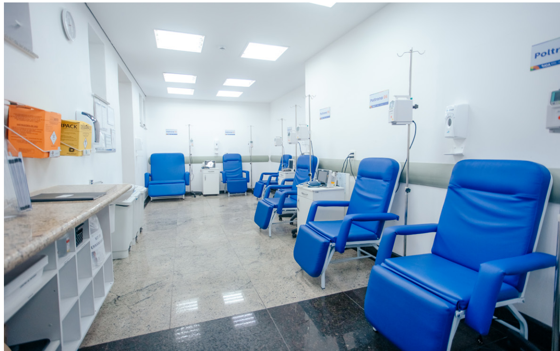
Novo espaço conta com sete poltronas