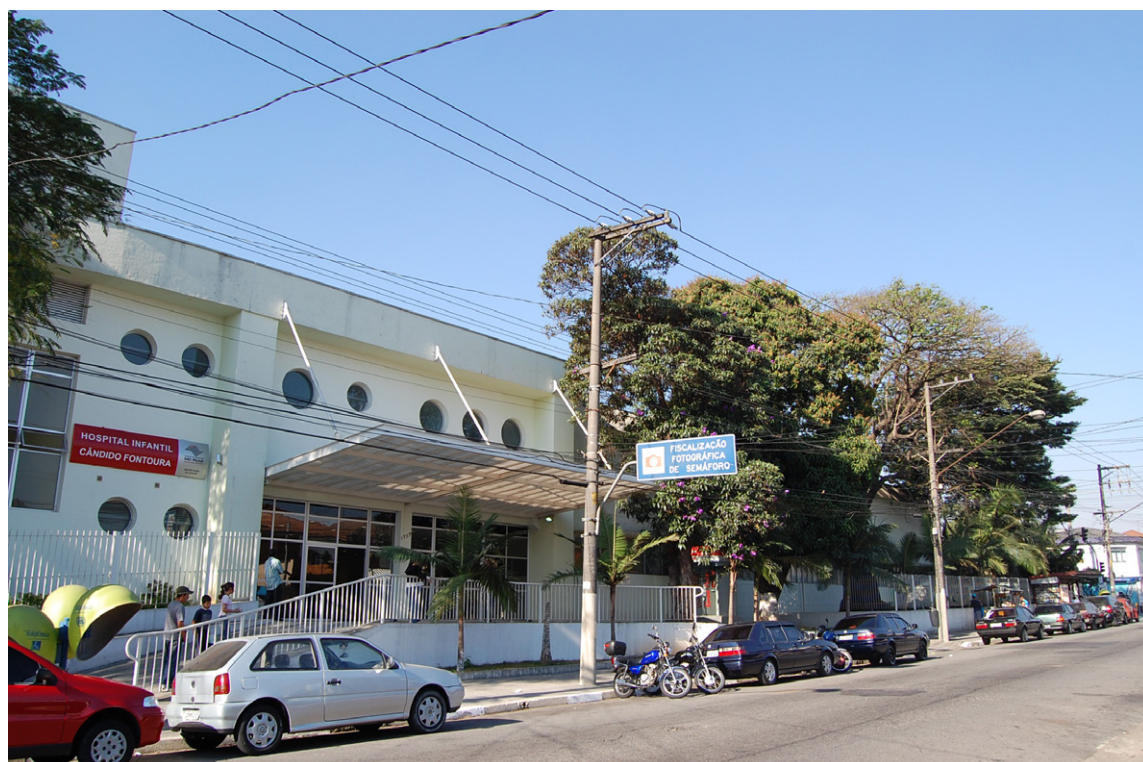
Hospital Infantil Cândido Fontoura

é responsável, desde maio de 2025, pelo gerenciamento do Ambulatório Médico de Especialidades (AME) Itu.