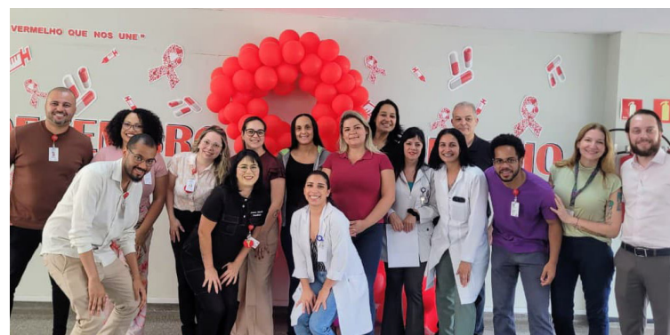
Ação foi organizada pela Comissão de Eventos e conduzida pelo SCIH

Outro destaque da programação voltada à excelência assistencial ocorreu nos dias 2 e 3 de dezembro, com o Treinamento de Manutenção e Manejo do Cateter PICC. Direcionada especificamente para as equipes de