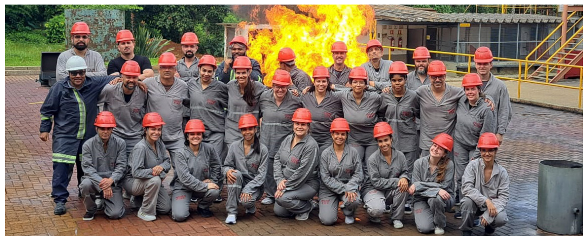
Capacitação foi realizada em Guarulhos

Durante a capacitação, os participantes receberam orientações técnicas sobre princípios de prevenção e combate a incêndios, classes de fogo, uso correto de equipamentos de combate, abandono de área, noções de primeiros socorros e procedimentos operacionais em situações de emergência. As atividades práticas permitiram aos brigadistas vivenciarem cenários simulados,