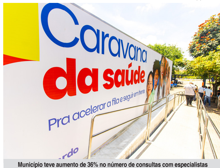
Município teve aumento de 36% no número de consultas com especialistas

na média mensal de atendimentos, saltando de 5,3 mil para 16,9 mil. Na saúde bucal, a oferta de consultas nas 35 Unidades Básicas de Saúde cresceu 57%, com 92,4 mil consultas ofertadas no ano e mais de 15 mil próteses dentárias entregues. As melhorias incluíram ainda recomposição de equipes médicas, aquisição de equipamentos modernos e reorganização dos fluxos de atendimento em toda a rede municipal.