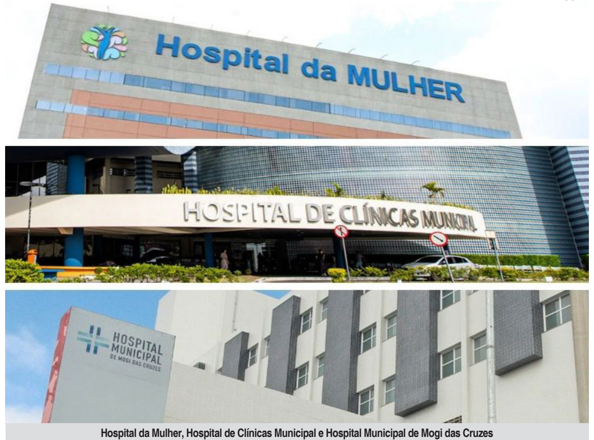
Hospital da Mulher, Hospital de Clínicas Municipal e Hospital Municipal de Mogi das Cruzes

Foram incluídos hospitais gerais, adultos ou pediátricos, e unidades especializadas em áreas como ortopedia, oncologia, cardiologia e maternidade, com mais de 50 leitos e produção registrada no Sistema