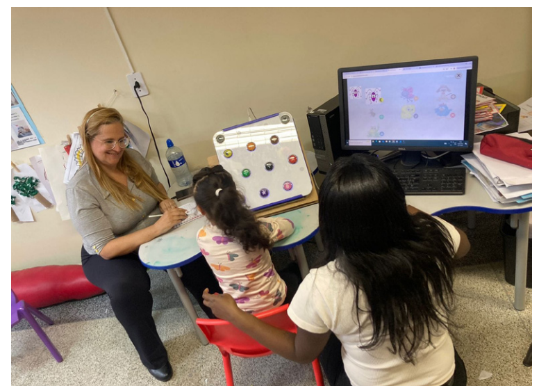
Profissionais de psicologia acompanham os alunos

Atendimento Educacional Especializado. A atuação da equipe técnica contribui para ampliar o olhar sobre cada estudante, identificando necessidades específicas e criando possibilidades concretas para a superação de barreiras comportamentais, que interferem no desenvolvimento da aprendizagem. O objetivo é promover o avanço qualitativo da educação especial na perspectiva inclusiva no município.