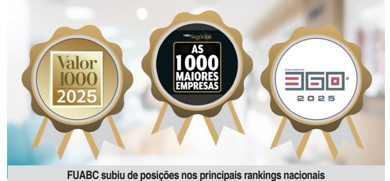
FUABC subiu de posições nos principais rankings nacionais

Os resultados refletem o crescimento institucional registrado em 2024. A expansão foi impulsionada pela celebração de novos contratos de gestão, como o do Hospital Geral de Carapicuíba, firmado em