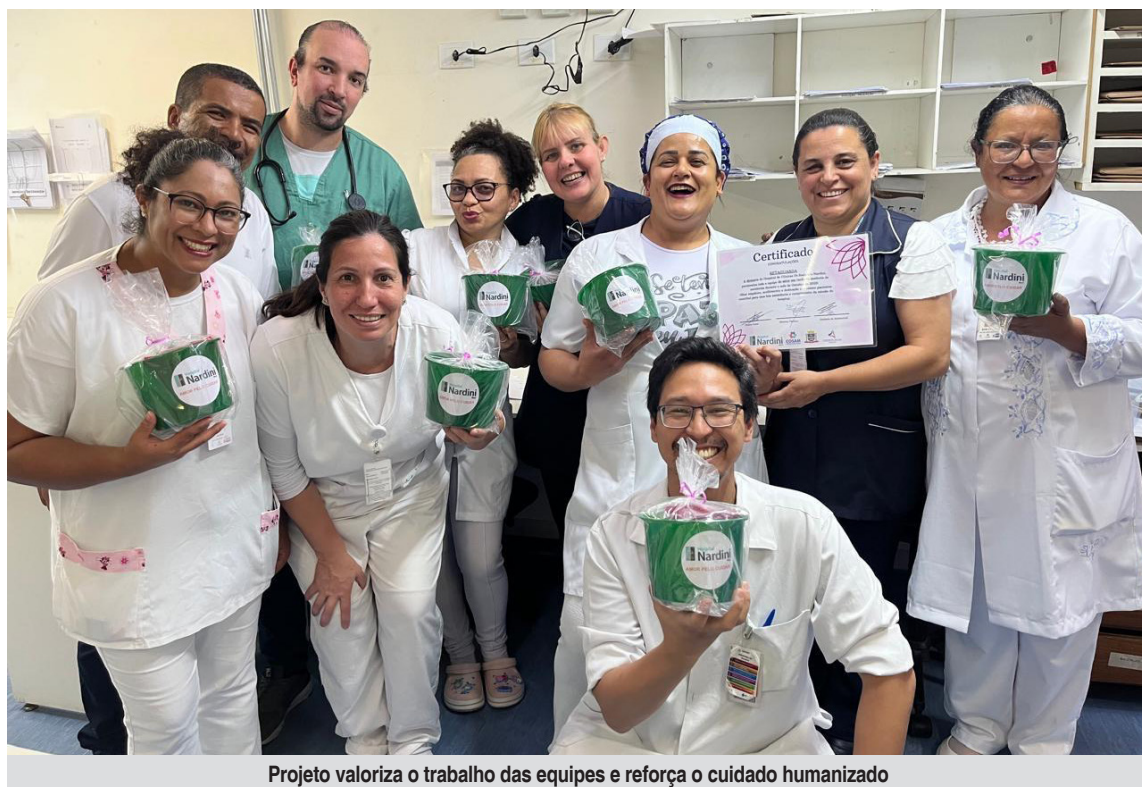
Projeto valoriza o trabalho das equipes e reforça o cuidado humanizado

Iniciativa interna reduziu em 65% o número de reclamações em quase um ano e incentiva a humanização no atendimento