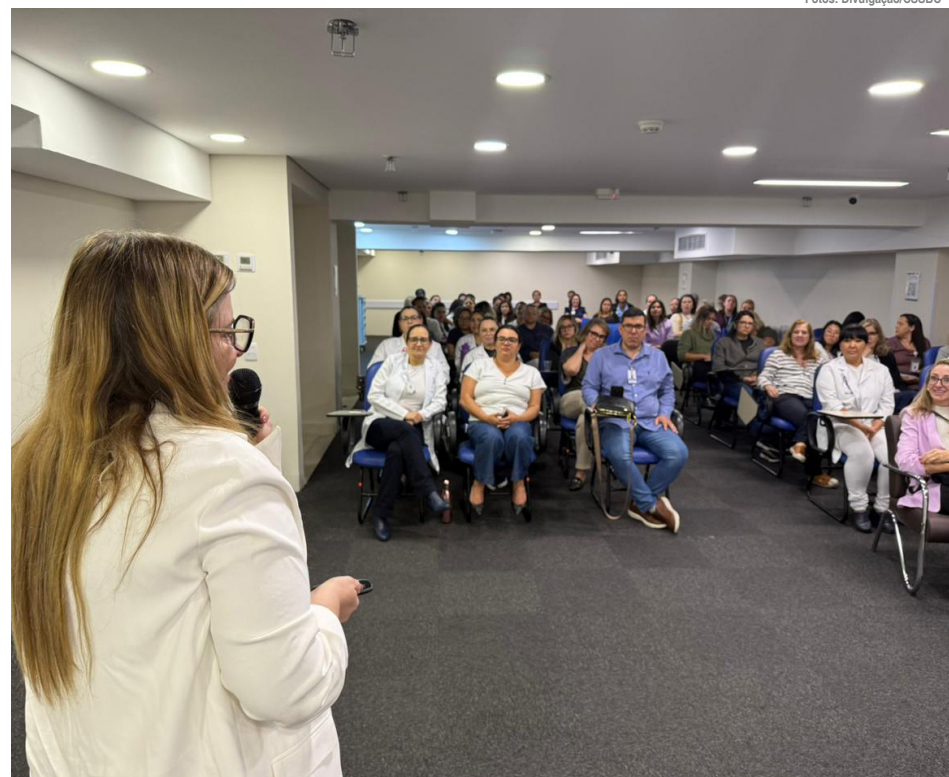
Apresentação contou com diretrizes sobre acolhimento e fluxos de atendimento

O encontro reuniu profissionais do CSSBC, Ambulatórios de Especialidades, Atenção Básica, UPAs de SBC e equipes convidadas dos outros seis municípios do Grande ABC (Diadema, Santo André, São Caetano, Mauá, Ribeirão Pires e Rio Grande da Serra), promovendo integração intermunicipal e compartilhamento de práticas qualificadas. Ao longo da capacitação, foram reforçados os fluxos da rede, protocolos clínicos, condutas psicossociais e orientações para garantir um cuidado eficaz, seguro e humanizado às vítimas de violência sexual.