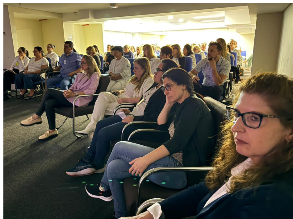
Todas as vagas do evento foram preenchidas