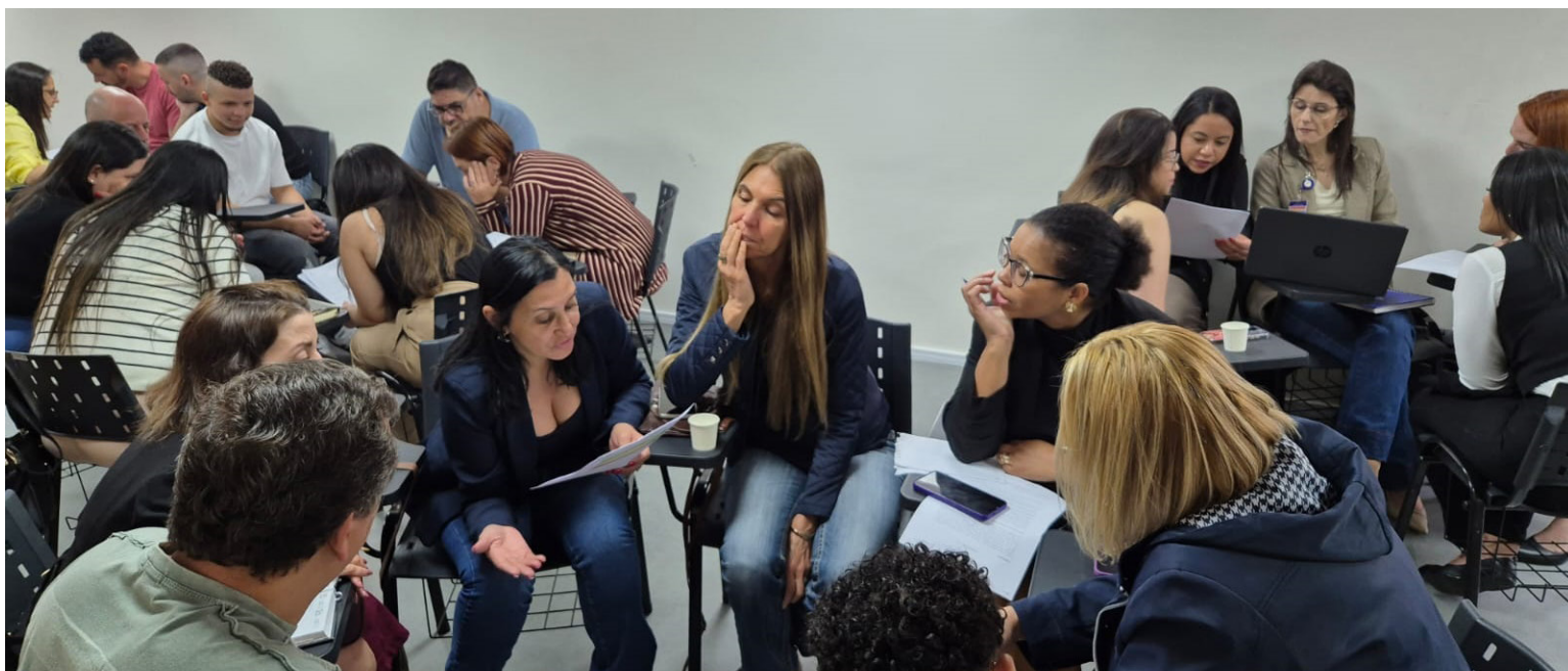
Em dezembro, cerca de 90 profissionais receberam treinamento sobre o Notifica FUABC

Já o segundo encontro ocorreu no dia 9 de dezembro, no Centro Universitário Anhanguera em Santo André e foi direcionado exclusivamente aos membros da Comissão do Núcleo de Segurança do Paciente da Rede de Atenção Primária de Santo André. Este workshop reuniu 57 participantes, ampliando o alcance da iniciativa