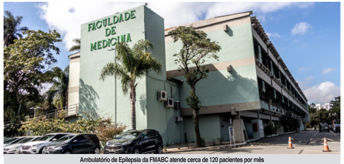
Ambulatório de Epilepsia da FMABC atende cerca de 120 pacientes por mês

Apesar disso, a epilepsia ainda é cercada por mitos. Um dos mais comuns é a crença de que a pessoa pode “engolir a língua” durante uma crise, o que não é verdade e pode levar a condutas inadequadas. Também é equivocado afirmar que pessoas com epilepsia não podem estudar ou trabalhar. “Muitos pacientes levam uma vida completamente normal quando estão em tratamento adequado”, afirma o médico.