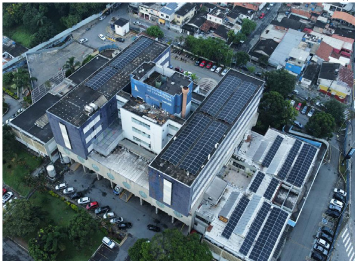
Foram instaladas 354 placas fotovoltaicas no telhado do Hospital