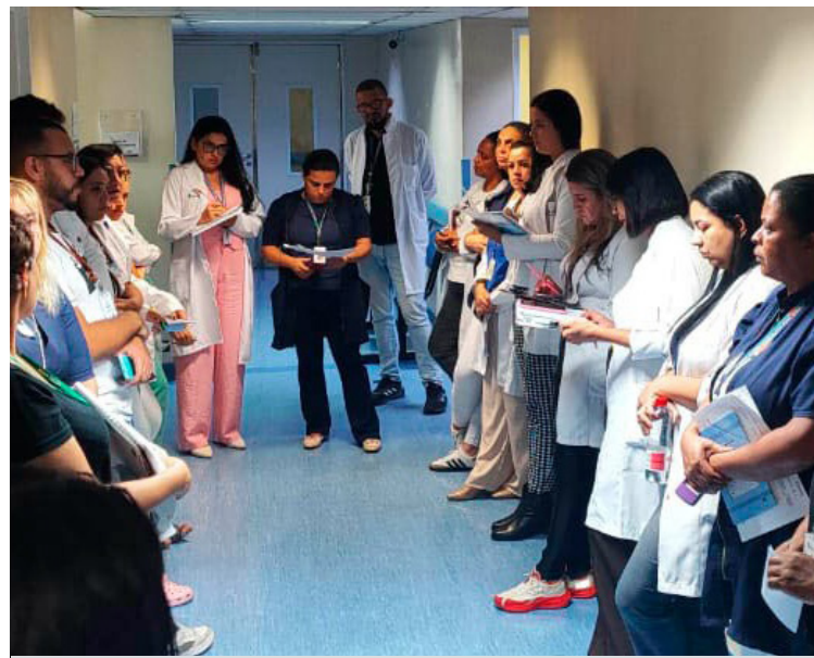
O Huddle é uma reunião rápida de alinhamento feita pela equipe assistencial

estão a melhoria da comunicação entre as equipes, maior integração no cuidado ao paciente e a antecipação de possíveis problemas no fluxo do pronto-socorro. Realizado diariamente, o Huddle segue uma rotina estruturada, com definição de pautas, discussão objetiva e acompanhamento de indicadores de qualidade. A iniciativa também permite o compartilhamento de feedbacks e a atualização sobre ações previamente discutidas.