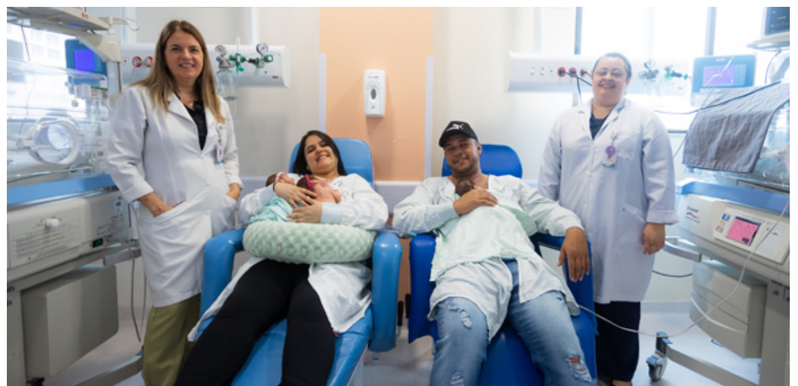
Os pais dos trigêmeos com a equipe da unidade

que a assistência prestada reflete a estrutura e a capacidade técnica da rede de saúde do município. “O Hospital da Mulher é referência em gestação de alto risco em São Bernardo e conta com equipes altamente capacitadas para atender casos complexos, como o nascimento de trigêmeos prematuros. Desde o acompanhamento no Caism até o cuidado intensivo neonatal e a aplicação do método canguru, todo o atendimento é realizado de forma integrada e humanizada”, destaca.