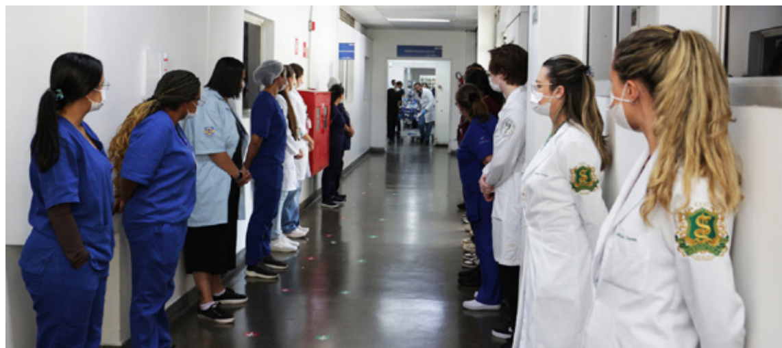
Foi realizado um "corredor do silêncio" por onde passou a doadora

A dimensão do problema que ações como essa ajudam a enfrentar é significativa. Segundo dados do Governo do Estado de São Paulo, em setembro de 2025 cerca de 27 mil pacientes aguardavam por um transplante apenas no Estado. Em nível nacional,