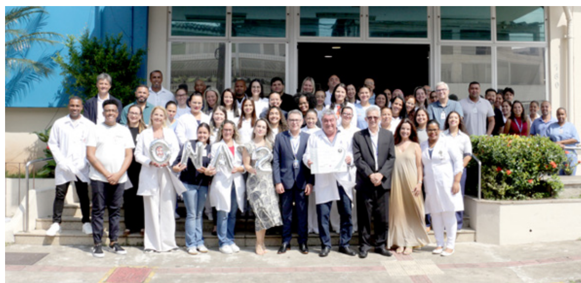
Equipe do Instituto de Infectologia Emílio Ribas II, junto com a Presidência da FUABC e representante do IBES

voltadas ao foco dos processos e da gestão, tudo isso reflete no paciente, que é o nosso objetivo final. Ou seja, uma gestão eficaz, processos bem definidos, sistemas e fluxos bem desenhados e funcionando adequadamente acabam por resultar em uma assistência mais adequada ao paciente. Nesse processo entre a manutenção da ONA 1 e a solicitação da ONA 2, implantamos o prontuário eletrônico, por exemplo”, explicou o diretor técnico do ER2, que finaliza: