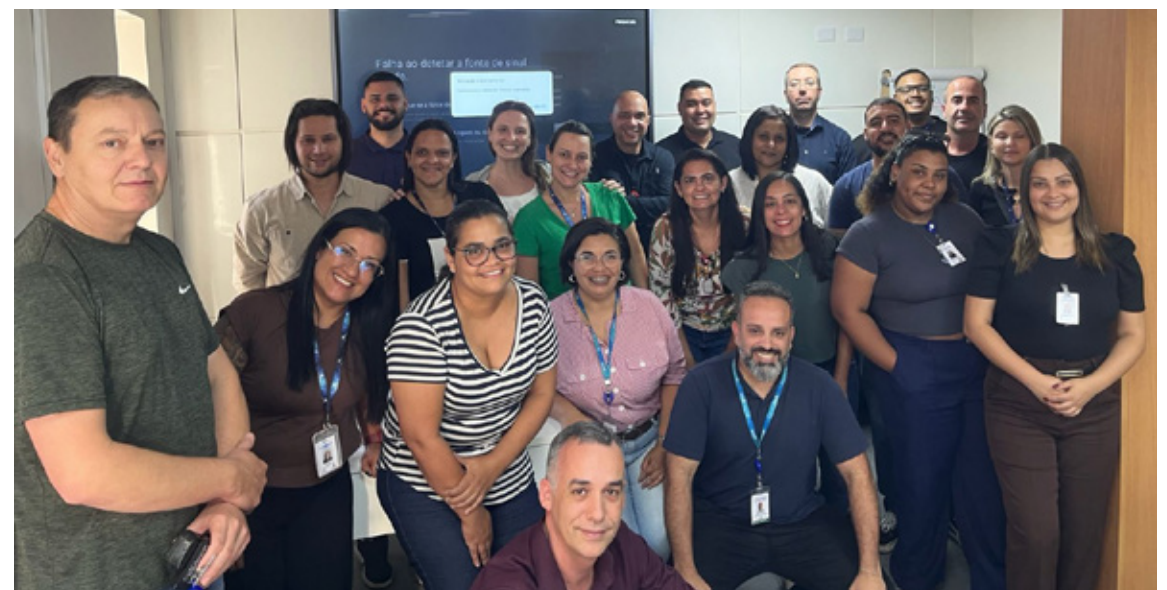
Duas turmas somaram cerca de 50 participantes do curso

Ao longo do dia, engenheiros e técnicos de segurança do trabalho aprofundaram conhecimentos sobre a