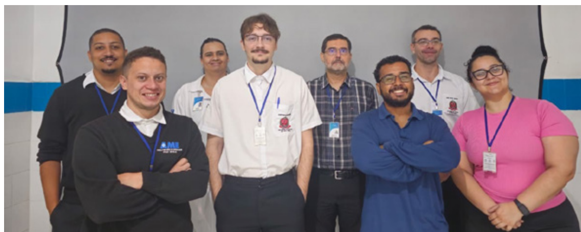
Membros da CIPA

Em consonância com o mês dedicado à valorização da mulher, a comissão dedicou atenção especial ao reconhecimento da atuação das profissionais da unidade, destacando sua contribuição essencial para a construção de um ambiente de trabalho colaborativo e comprometido com o bem-estar coletivo.