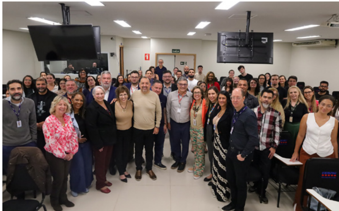
Evento de lançamento do programa foi realizado no auditório da Universidade Nove de Julho (Uninove) de Mauá