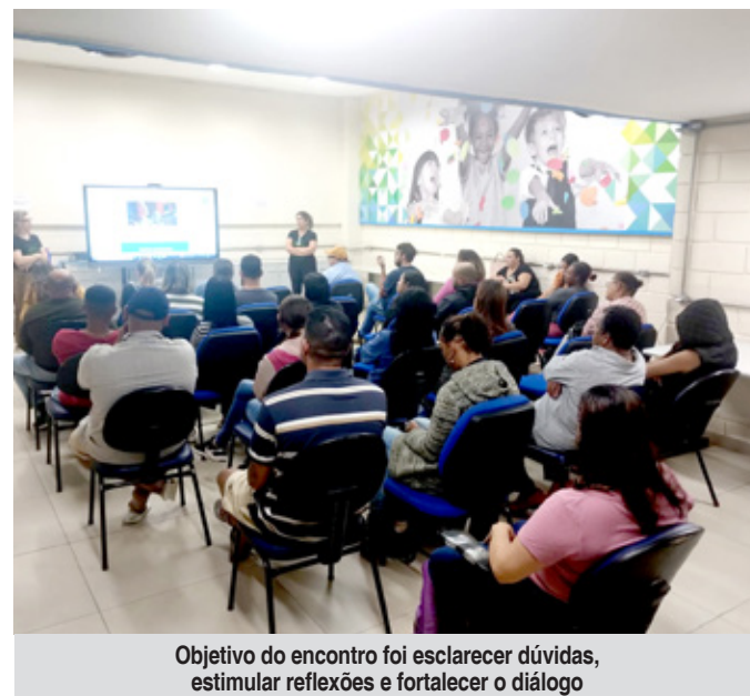
Objetivo do encontro foi esclarecer dúvidas, estimular reflexões e fortalecer o diálogo

A iniciativa também destacou o papel central da família no enfrentamento do problema. Os participantes foram orientados sobre a importância da escuta ativa, do acolhimento e do diálogo aberto em casa, para que crianças e adolescentes se sintam seguros para compartilhar suas experiências. O encontro reforçou, ainda, que relações baseadas no respeito e na empatia são fundamentais para a construção de um ambiente saudável de convivência.