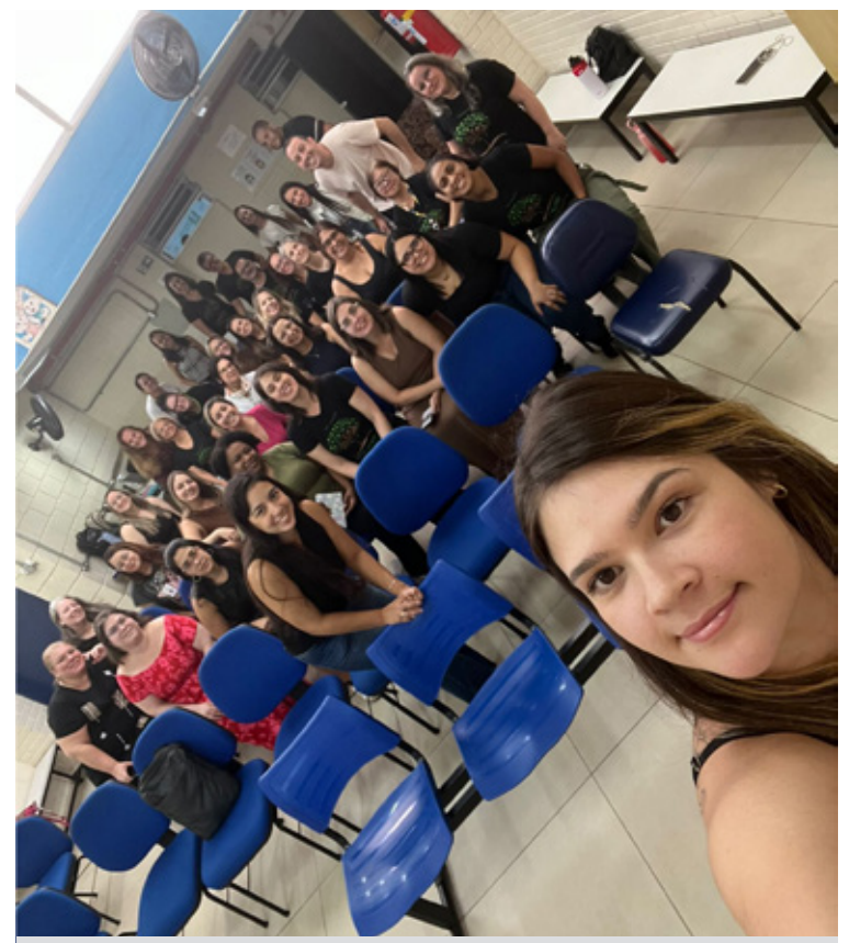
Capacitação reuniu cerca de 40 participantes

Por fim, o quarto tema foi dedicado à segurança no manuseio de produtos químicos. Os participantes foram orientados sobre a identificação de substâncias por meio do número CAS, a leitura e o uso das fichas de dados de segurança e os procedimentos a serem adotados em casos de intoxicação, com destaque para o papel do Centro de Controle de Intoxicações como referência em situações de emergência.