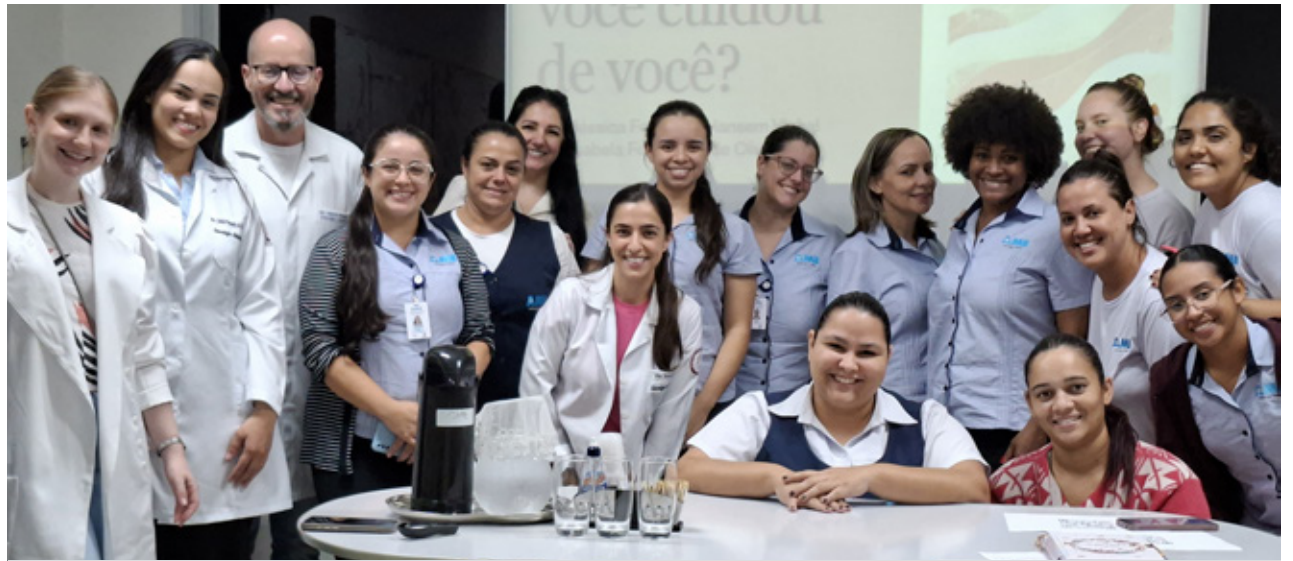
Objetivo foi ampliar o acesso a informações qualificadas sobre saúde da mulher

Durante a roda de conversa, foi criado um espaço de escuta ativa e troca de experiências, no qual as participantes puderam compartilhar dúvidas e reflexões sobre o cuidado com a própria saúde. A dinâmica reforçou a importância do autocuidado como condição essencial para que a mulher possa manter sua qualidade de vida e continuar exercendo seus diferentes papéis com equilíbrio.