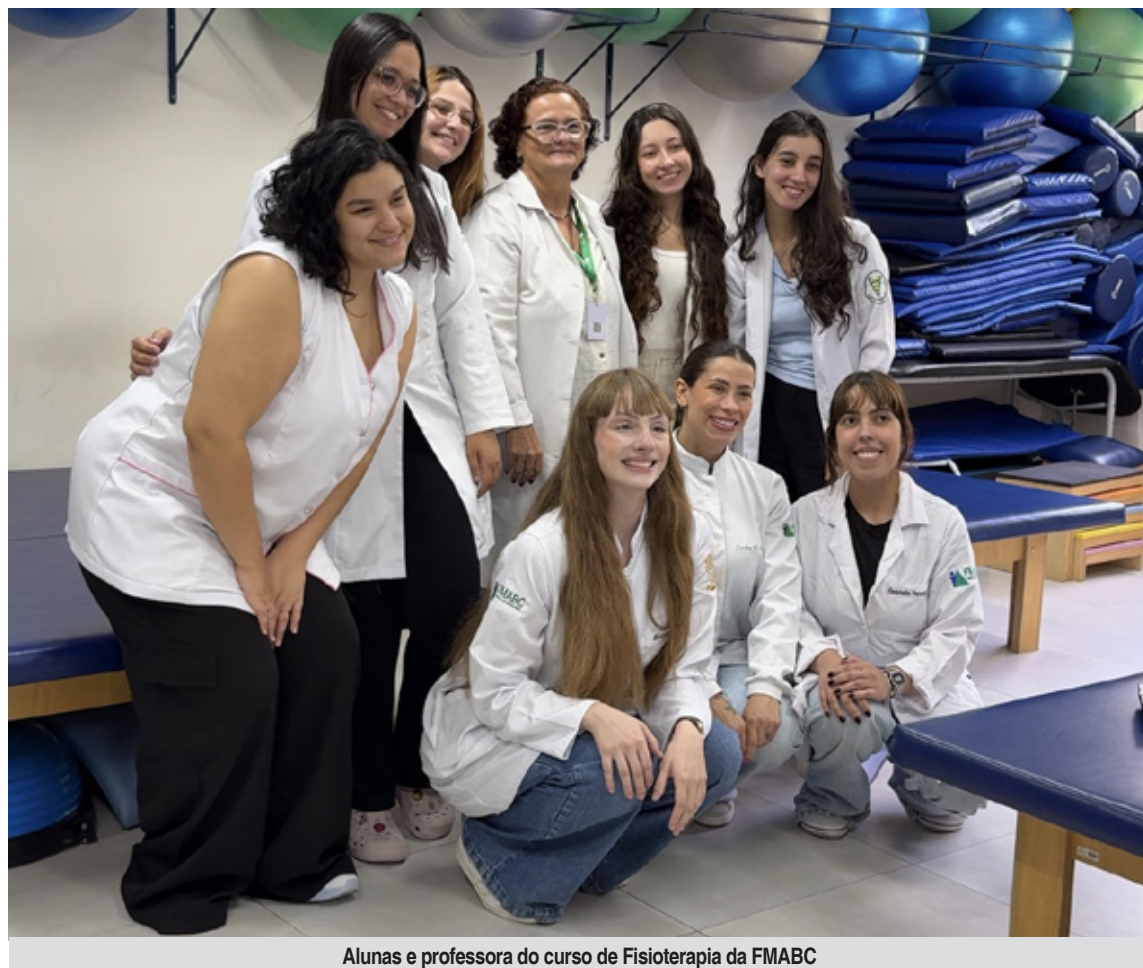
Alunas e professora do curso de Fisioterapia da FMABC