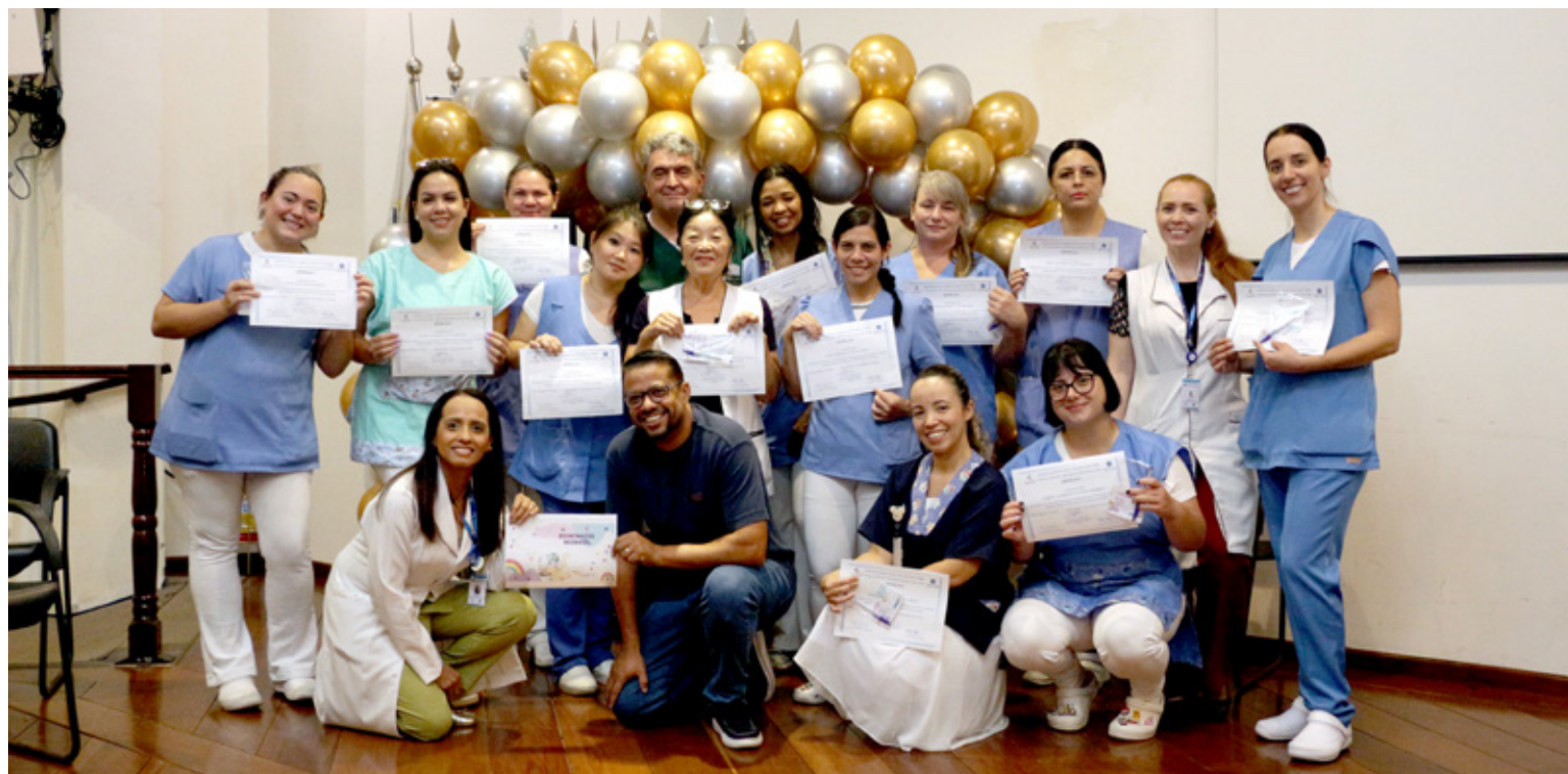
Colaboradores receberam certificados de participação

que todas as enfermeiras e técnicas de enfermagem tenham um treinamento bem uniforme, tanto na parte de ventilação, massagem e uso de medicações, para fazer com que o atendimento de nossos recém-nascidos aqui no Hospital Estadual Mário Covas seja mais efetivo, a reanimação seja mais efetiva, com menos complicações neurológicas e com um desfecho mais favorável para