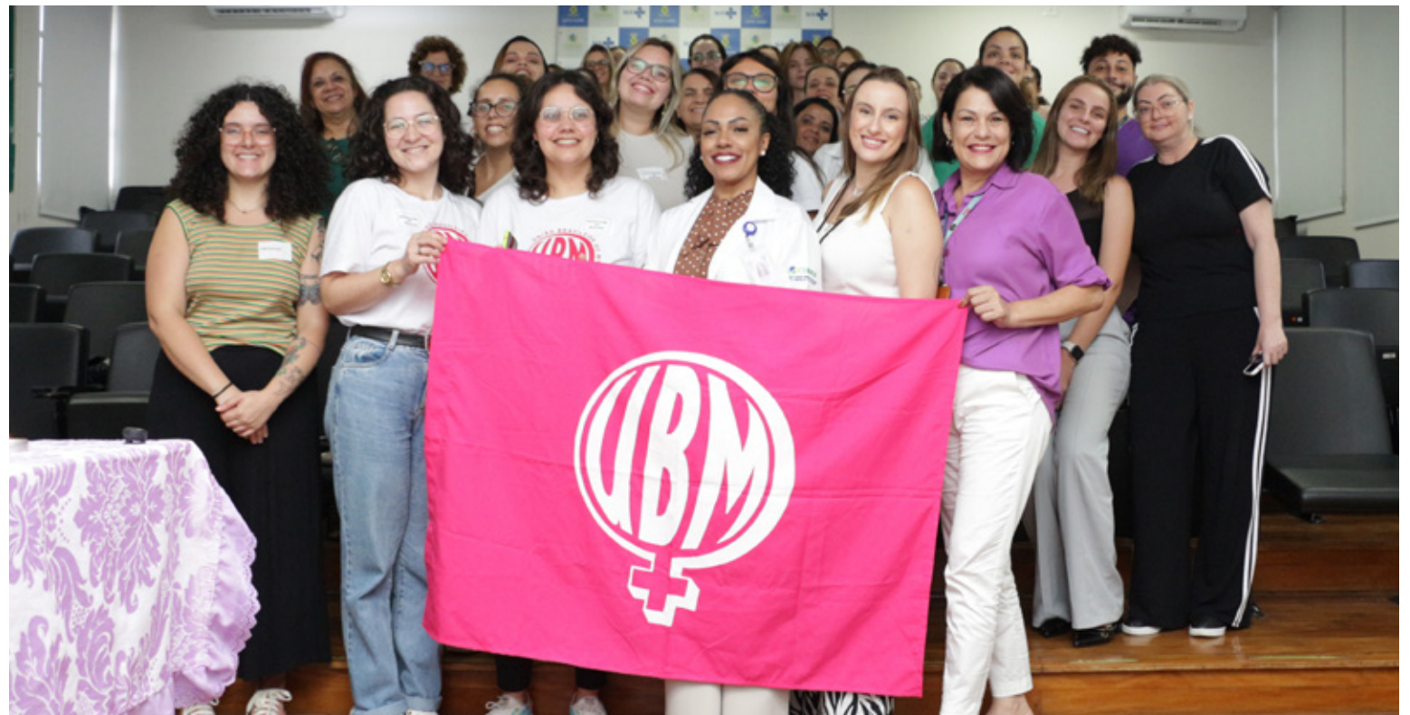
Equipe da UBM e do CHMSA