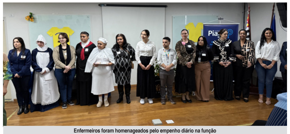
Enfermeiros foram homenageados pelo empenho diário na função

"Mais que uma data específica, a enfermagem representa o 'coração e o pulmão' do hospital todos os dias,