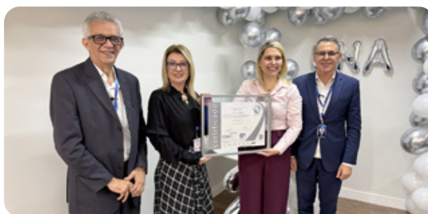
AME Mauá recebe certificação de qualidade 'ONA 2'