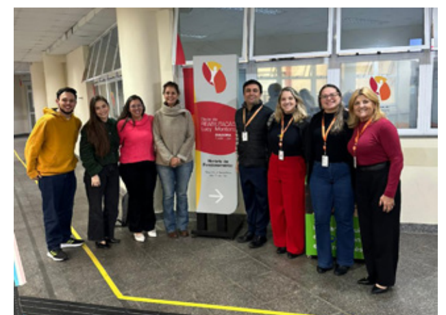
Equipes do Lucy Montoro de Sorocaba e de Diadema

O prontuário eletrônico do paciente é outro ponto de destaque. Cada especialidade pode configurar o prontuário de acordo com a sua própria rotina, e os documentos gerados durante os atendimentos – receitas, atestados, encaminhamentos – podem ser assinados digitalmente no padrão ICP-Brasil, o que traz mais segurança jurídica e reduz o uso de papel. O histórico