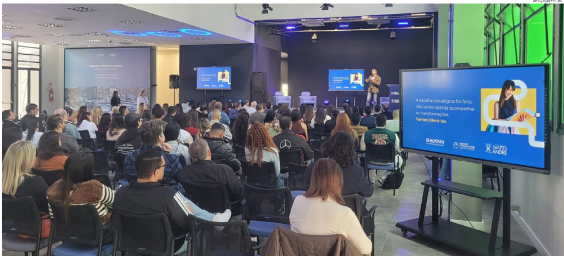
Simpósio promoveu reflexões sobre os impactos da IA no mercado de trabalho