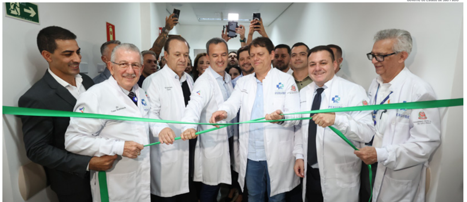
Ao centro, o governador do Estado, Tarcísio de Freitas, com autoridades de Peruíbe, diretores do hospital e dirigentes da FUABC

“Essa entrega é um marco para a Fundação do ABC. Sabemos a responsabilidade que assumimos em uma cidade que nunca teve um hospital. São 40 anos de espera da população. Vamos investir e trabalhar muito para torná-lo um serviço municipal referência em todo