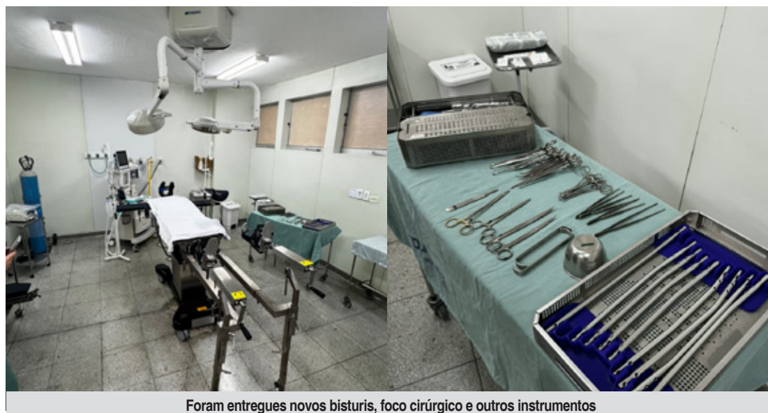
Foram entregues novos bisturis, foco cirúrgico e outros instrumentos

A parceria entre o Rotary e o hospital já havia garantido, em maio do ano passado, a entrega de poltronas, cadeiras de rodas, cadeiras de banho, sofás e outros equipamentos de apoio, contribuindo para a modernização do 5º andar da unidade hospitalar.