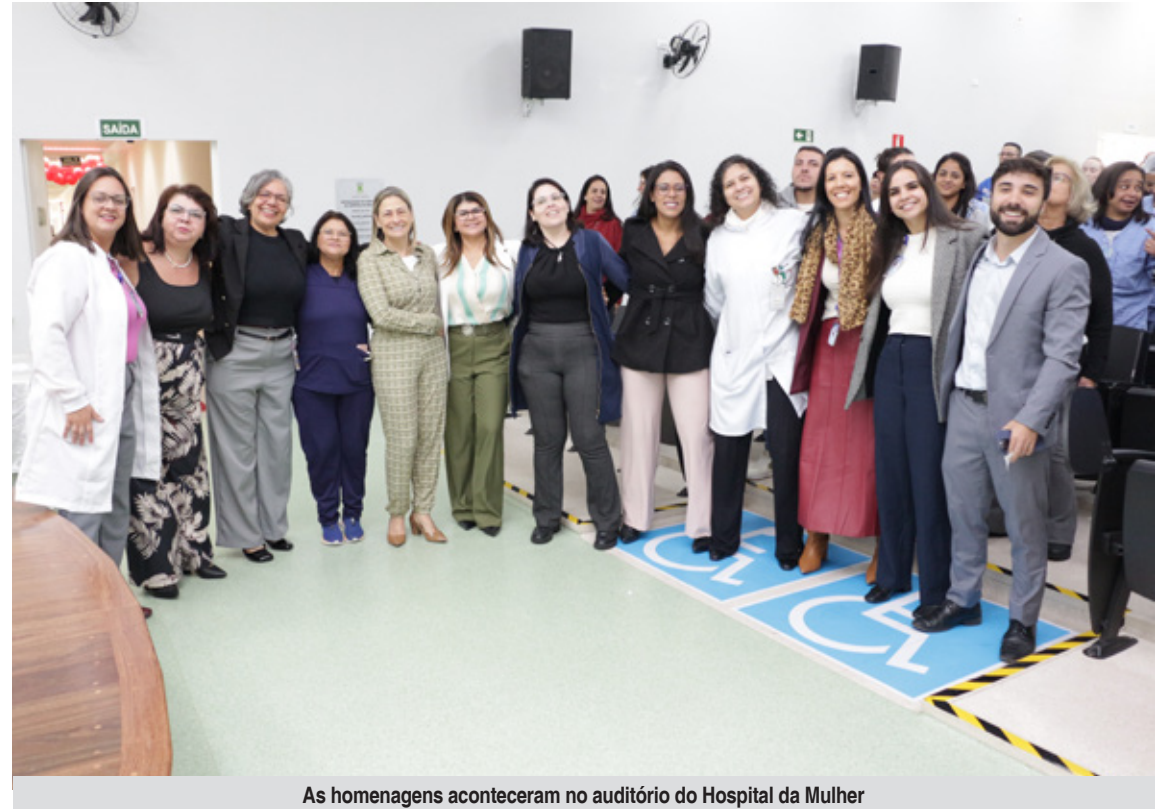
As homenagens aconteceram no auditório do Hospital da Mulher