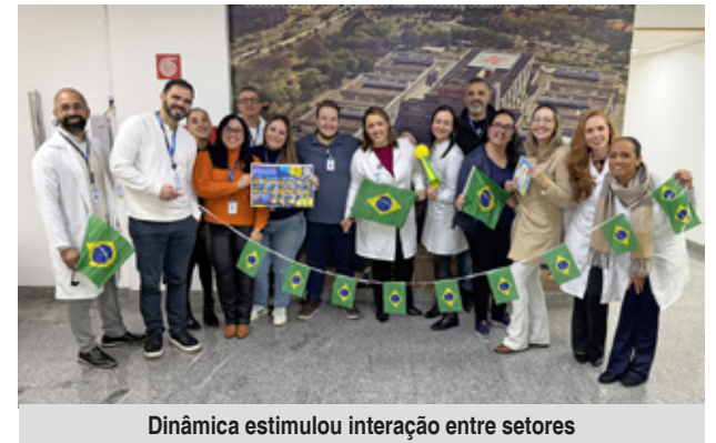
Dinâmica estimulou interação entre setores

escanear um QR Code, preencher seus dados e encaminhar uma foto. A partir dessas informações, será gerada uma figurinha personalizada, que passará a compor o mural batizado "HEMC em