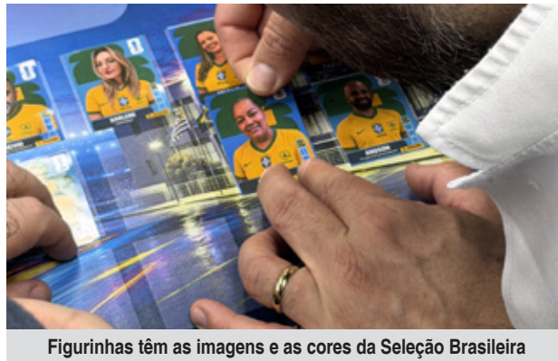
Figurinhas têm as imagens e as cores da Seleção Brasileira

A dinâmica foi pensada para estimular a troca, a aproximação e o relacionamento entre os profissionais. Como há figurinhas repetidas, a única forma de completar o álbum é por meio da interação com os colegas, reproduzindo no ambiente hospitalar uma das tradições mais populares entre