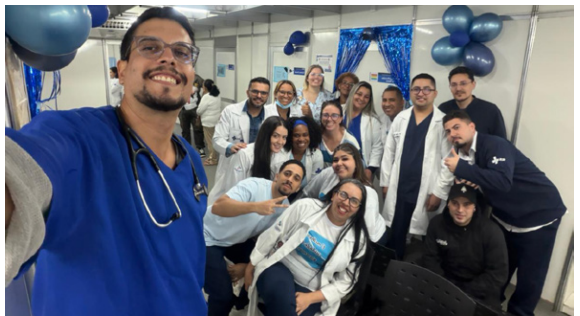
Equipe do AMA Jardim das Laranjeiras

do cuidado — conceitos que, na prática, significam escuta qualificada, acolhimento e acompanhamento