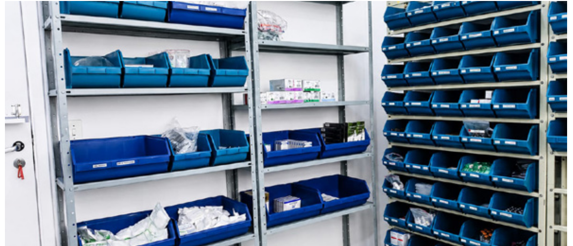
Iniciativa busca descentralizar o gerenciamento de insumos

A implantação de uma farmácia satélite é uma prática adotada em hospitais e ambulatorios que buscam descentralizar o gerenciamento de