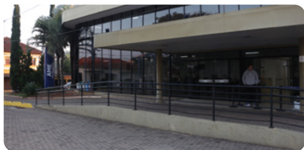
FUABC assume gestão do AME Casa Branca

O Governo do Estado de São Paulo e a Prefeitura de Peruíbe inauguraram, em 18 de junho, o novo Hospital Municipal de Peruíbe, no Litoral paulista. A cerimônia contou com as presenças do governador de SP, Tarcísio de Freitas, autoridades municipais, dirigentes da FUABC, além de diretores e colaboradores do hospital. Vencedora do chamamento público para a gestão do serviço, a FUABC assume a administração do hospital por meio de contrato de gestão com vigência de cinco anos. Em pleno funcionamento, contará com 72 leitos. Págs. 8 e 9