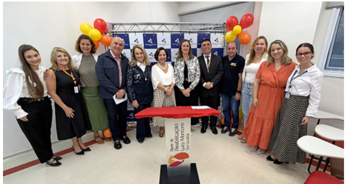
Lideranças reunidas na celebração do aniversário do Lucy Montoro Sorocaba