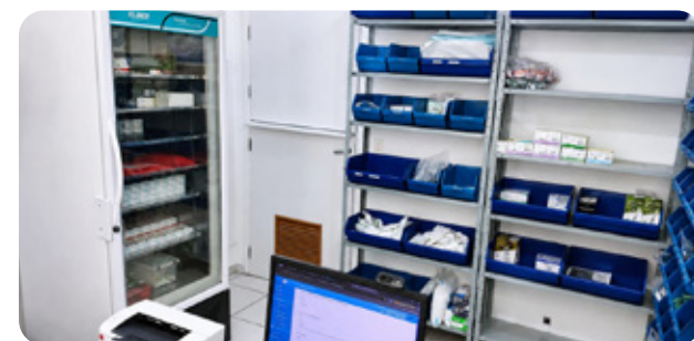
AME Santos abre farmácia satélite para agilizar entrega a pacientes