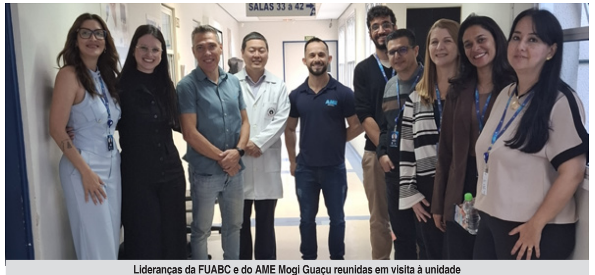
Lideranças da FUABC e do AME Mogi Guaçu reunidas em visita à unidade