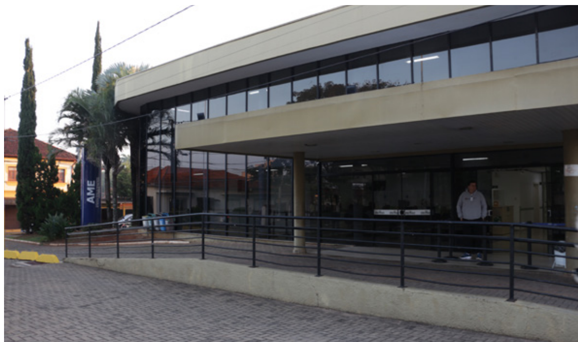
Unidade é referência para oito municípios, que somam cerca de 200 mil habitantes