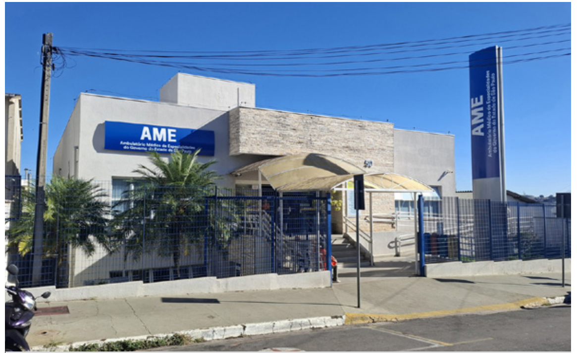
AME Mogi Guaçu é o 10º AME sob gestão da FUABC