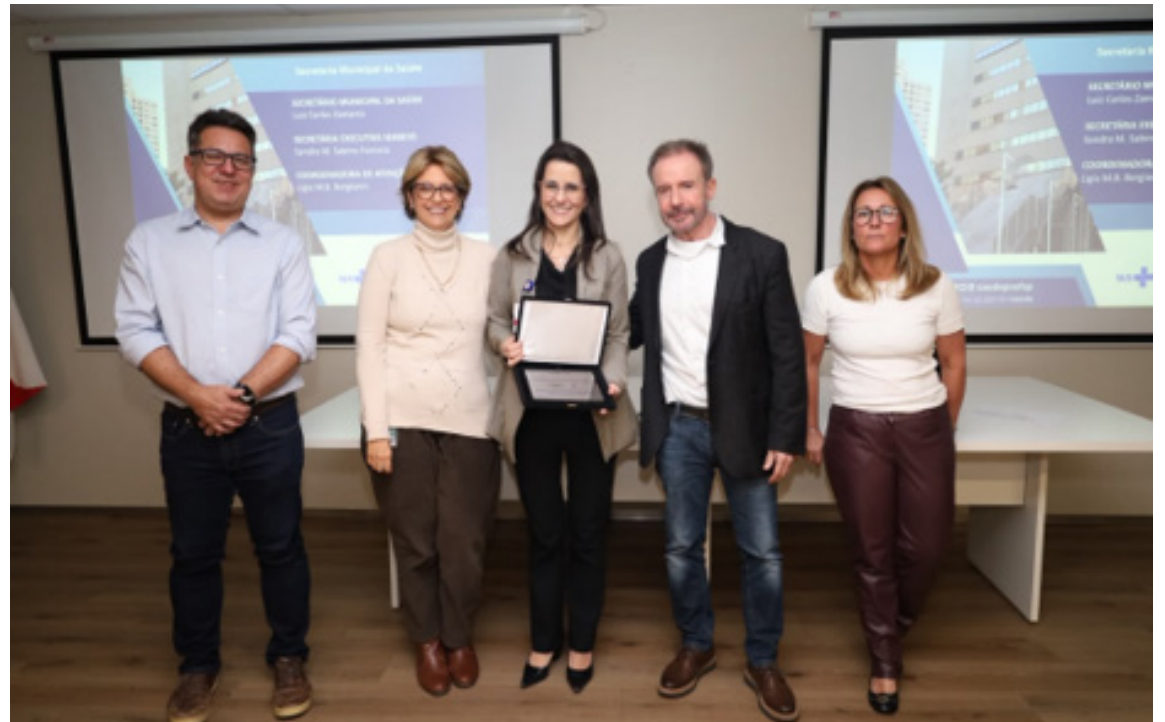
Marco reforça a oferta de assistência segura, qualificada e centrada na população

Esta conquista é fruto de um esforço coletivo, construído com responsabilidade, colaboração e propósito. Cada profissional envolvido contribuiu de forma significativa para o fortalecimento dos serviços prestados e para a consolidação de uma assistência mais qualificada, humanizada e segura.