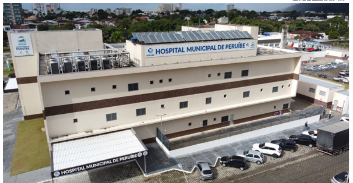
Em pleno funcionamento, unidade terá 72 leitos, sendo 20 de UTI