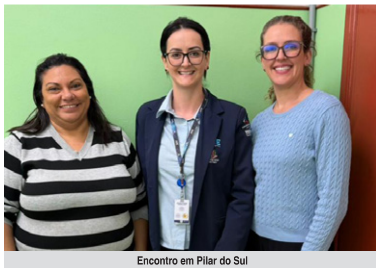
Encontro em Pilar do Sul

As atividades aconteceram em datas distintas: no dia 16 de abril,