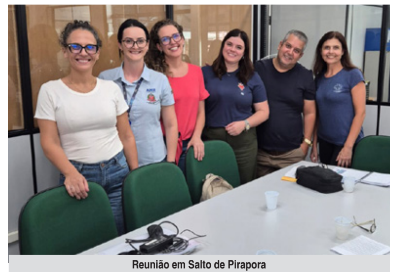
Reunião em Salto de Pirapora

eletroencefalograma (EEG) e espirometria. Quando o paciente chega sem as orientações corretas, o procedimento precisa ser remarcado — o que representa perda de vaga e atraso no diagnóstico.