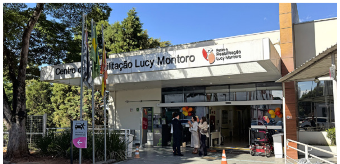
Desde a inauguração até junho de 2026, unidade realizou mais de 122 mil consultas e atendimentos e ultrapassou a marca de 214 mil procedimentos terapêuticos