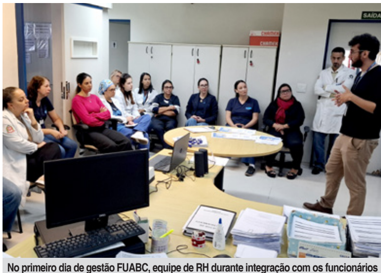
No primeiro dia de gestão FUABC, equipe de RH durante integração com os funcionários

A proposta da FUABC também contempla programas permanentes de capacitação profissional, uso de ferramentas corporativas de gestão da qualidade e compliance, além de monitoramento assistencial contínuo para garantir eficiência, transparência e melhoria permanente dos serviços prestados pelo SUS.